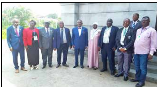
Le nouveau bureau de Brazzaville posant avec le président national

des contributions financières des parents d'élèves et la prise en charge des bénévoles et agents communautaires de l'enseignement comme mesures salvatrices devant alléger les charges des parents par rapport à l'harcèlement financier dont ils sont victimes. Le président de l'APEEC n'a pas lésiné de tordre le cou aux marchands d'illusions qui s'arrogent d'affirmer que l'APEEC n'a plus son