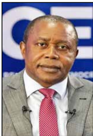
Denis Kadima, patron de la CENI

cembre 2023, certains candidats se sont plaints de l'expulsion de leurs témoins des bureaux de vote. Dans quelques régions, la CENI a expliqué que l'accès aux bureaux de