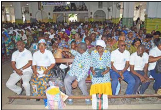
Les foyers chrétiens participant à la messe