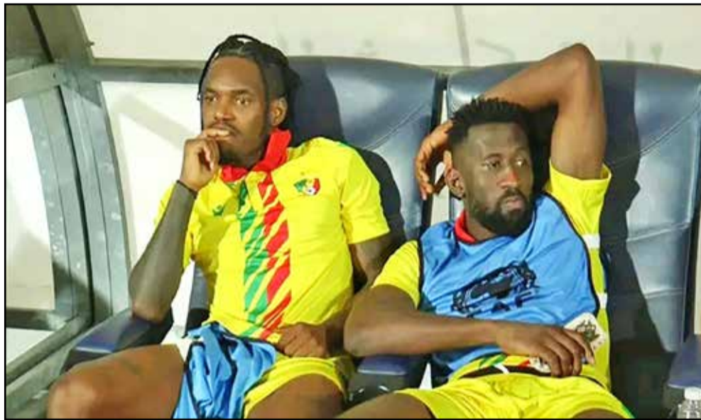
La déception des Diables-Rouges A après leur élimination

Pis, zéro pointé pour les Diables-Rouges U-23 du coach Cyril