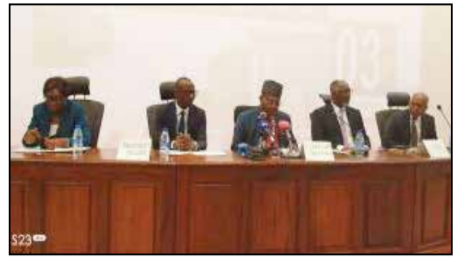
Le présidium à l'ouverture des travaux

Organisées par la Société congolaise de gynécologie obstétrique (SO.CO.GO), les troisièmes universités de gynécologie obstétrique consacrées sur l'infertilité chez l'homme, en vue de faire connaître cette maladie pour une prise en charge optimale, ont eu lieu le 27 décembre 2023 à Brazzaville. Sous le thème: «La prise en charge de l'infertilité: mise en oeuvre et perspectives en République du Congo».