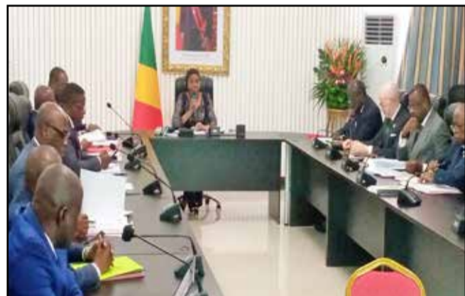
...pendant la réunion avec les membres du comité technique

Pour le reste des départements, la population se répartit de la manière suivante: Kouilou 97 362 habitants; Niari 334 863 habitants; Lékoumou 100 559 habitants; Bouenza 363 850 habitants; Pool 394 532 habitants; Plateaux 283 421 habitants; Cuvette 316