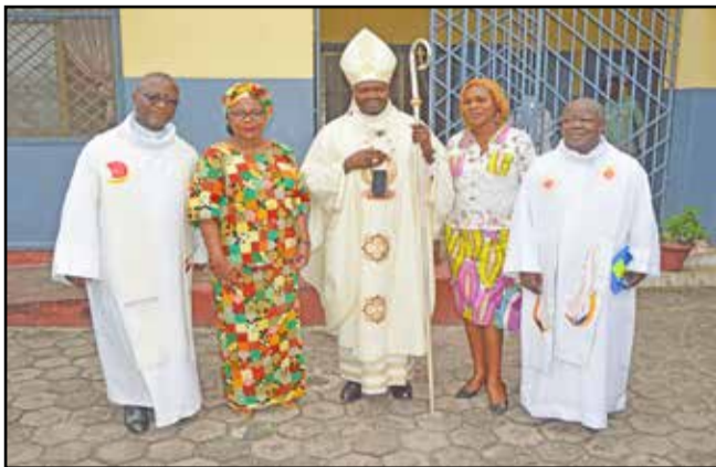
L'archevêque de Brazzaville (crosse en main) avec Mme la ministre (2ème de g. à dr.) le curé (à g.) et l'aumônier (à dr.)