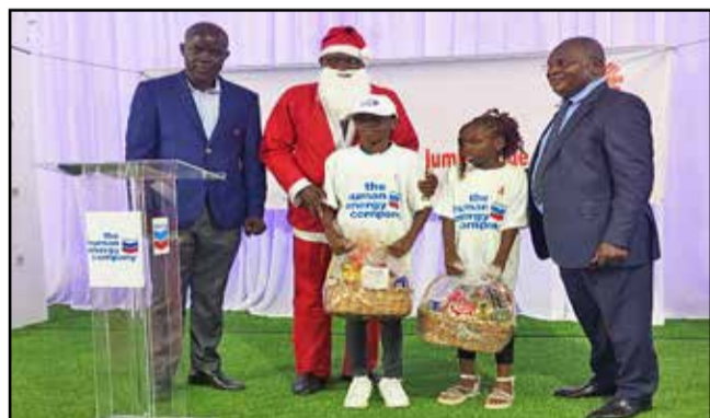
un échantillon des enfants ayant reçu des cadeaux de la part de papa Noël, accompagnés du directeur de cabinet de Madame le maire de Pointe-Noire

métier du dessin. Le partenaire Chevron n'en est pas à sa première œuvre vis-à-vis des enfants vulnérables de la ville; ses efforts de soutien favorisent également le développement affectif et intellectuel des jeunes du Congo en général. Cette journée fut un moment spécial pour les enfants qui ont profité de cette journée en célébrant la Nativité de Jésus dans la joie, et en recevant des jouets de la part de la Caritas et de Chevron Congo, son partenaire. Le moment des ateliers a permis aux enfants de susciter la réflexion et d'apporter à leur cœur du sourire en passant du temps ensemble. Chaque enfant a éprouvé du plaisir à échanger avec les organisateurs à travers leurs dessins. Pour le représentant de Chevron