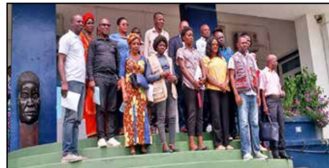
Après la publication du rapport

Dans le but de contribuer à l'amélioration de l'accès à l'eau potable et à l'électricité, la coalition Publiez ce que vous payez a fait une enquête sur un échantillon de