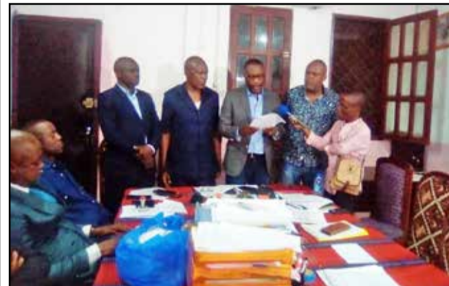
Les dirigeants du collège intersyndical, pendant leur déclaration.

La coordination du collège intersyndical de l'Université Marien Nguabi s'est réunie mercredi 27 décembre 2023 à Brazzaville, pour statuer sur deux points: les négociations avec le Gouvernement, après sa déclaration du 3 novembre 2023. Et elle propose l'examen de la situation délétaire créée à l'Université Marien Nguabi par le blocage du salaire de décembre 2023 par le directeur du contrôle budgétaire auprès de l'Université Marien, et le détournement de 219 050 204 FCFA des retenues des mutuelles et des syndicats par le directeur des affaires budgétaires. Le collège intersyndical dit avoir suivi avec attention le compte rendu de la coordination nationale sur les négociations avec le Gouvernement,