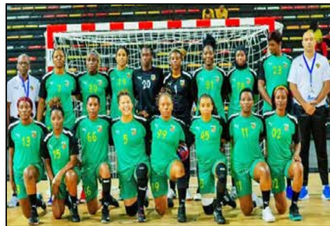
Les Diables-Rouges dames

Coupe du Président, tout juste pour se consoler. Quant aux clubs, DGSP et BMC ont sauvé les meubles en