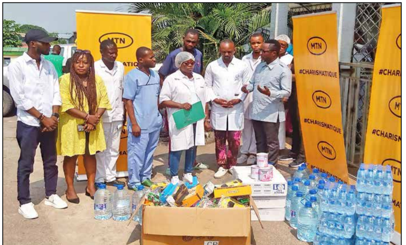
Un échantillon des vivres et des jouets