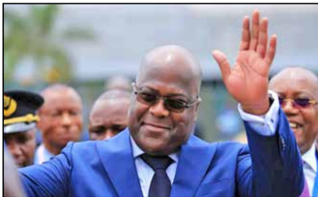
Félix Tshisekedi Tshilombo largement vainqueur

vote était difficile en raison de l'étroitesse des locaux. D'autres candidats n'ont pu obtenir que les fiches sorties de la machine à voter, alors que ce sont les procès-verbaux signés qui ont une valeur en cas de contentieux. La RDC attend désormais les résultats des trois autres scrutins qui se sont tenus simultanément avec la présidentielle. Il s'agit des législatives, des provinciales et des municipales partielles.