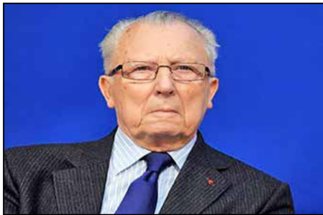
Jacques Delors l'Eurodéputé

Son grand combat: la réunification de l'Allemagne alors divisée en deux blocs. De 1979 à 1981, cet Européen convaincu a également été député européen. L'ancien ministre de l'Economie avait douché les espoirs de la Gauche en refusant de se présenter à l'élection présidentielle de 1995 alors qu'il était le grand favori des sondages. Un renoncement spectaculaire. Il est revenu en 2021 sur cette décision. Du gaulisme social avec Chaban-Delmas à l'union de la Gauche, puis au social-réalisme aux côtés de François Mitterrand, Jacques Delors a tracé les contours d'une deuxième Gauche française. Avant de faire son entrée en politique, il est entré à la Banque de France, puis a adhéré à la Confé-