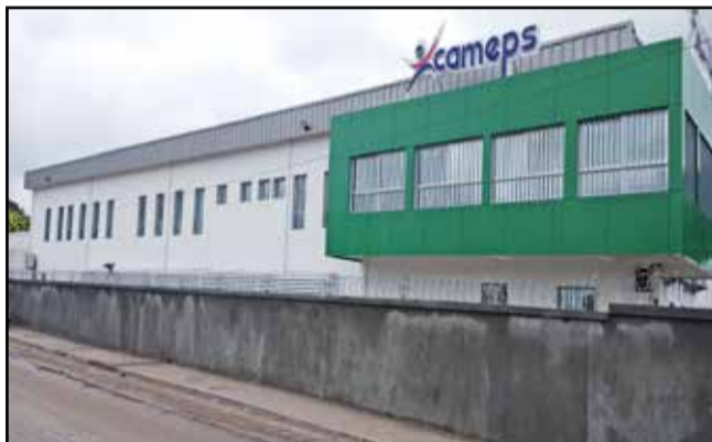
Le nouvel entrepôt inauguré

personnalité avec une empreinte carbone réduite, en ce qu'il repose à terme partiellement sur une énergie renouvelable». Elle s'est dite fière de noter que le Congo dispose désormais d'un édifice de cette qualité. « Nous formulons le vœu que cet outil