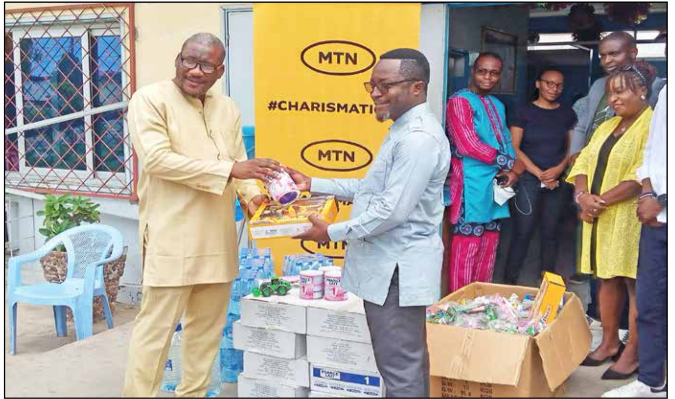
Réception des jouets offerts par MTN Congo

consomment nos produits et services, sans qui nous ne serions pas là. Pour nous, cette action sociale est un élan de coeur, de solidarité, parce que les festivités de Noël sont un moment chaleureux où le vivre ensemble est mis en avant et cela fait partie des valeurs de MTN Congo", a-t-elle souligné, souhaitant un joyeux Noël à tout le personnel hospitalier qui prodigue des soins de qualité à