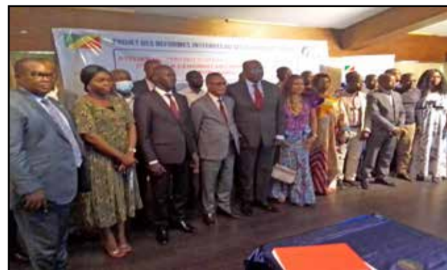
Les organisateurs et les participants

«les pays conformes ont l'obligation de continuer à respecter les principes et les exigences de l'Initiative afin de conserver leur statut de pays conforme». Le Congo a déjà fait l'objet de deux validations et la 3 e validation est attendue. Lors de la dernière validation, le Conseil d'administration international a félicité le pays pour les progrès réalisés, ainsi que pour les résultats obtenus et l'impact sur la transparence. Mais, plusieurs recommandations ont été formulées à l'issue de cette validation et de nombreux défis restent à relever. Conformément à l'exigence 7 de la norme ITIE internationale