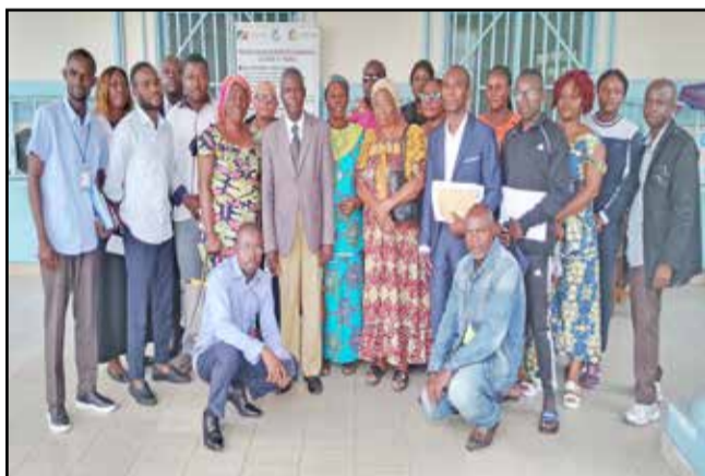
Pour la postérité