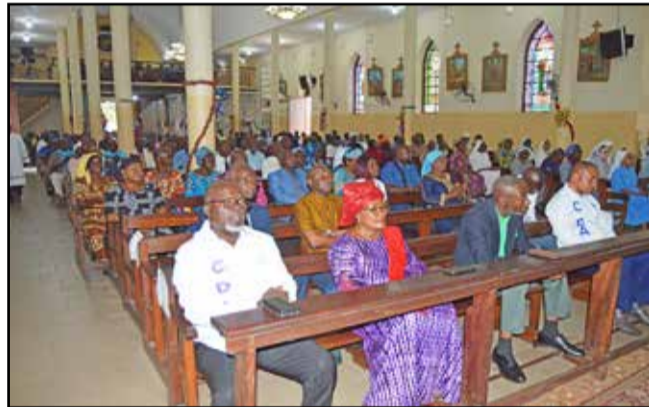
Des participants à la messe

épouser la culture de l'efficacité, à continuer à demeurer fiers d'être chrétiens catholiques, à persévérer à mettre leur confiance en Dieu. « J'apprécie le travail que réalise les catéchistes, les conseils pastoraux paroissiaux et les mouvements d'apostolat », a-t-il affirmé avant