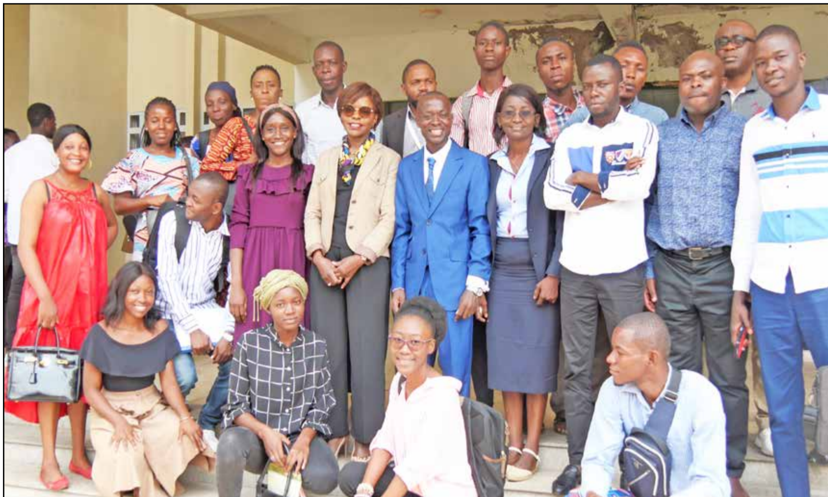
Les membres de la Fondation

C 'est avec une grande émotion et un grand plaisir que je vous souhaite ainsi qu'à tous vos proches une merveilleuse année 2024.