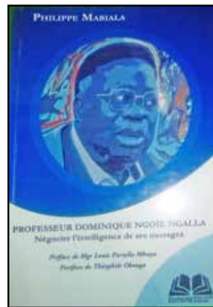
La couverture du livre

la vie intellectuelle, qui a marqué ses pairs par des vertus chrétiennes ainsi qu'une plume féconde et humaniste». Dans sa postface, Théophile Obenga souligne: «Le Pr Dominique Ngoïe-Ngalla est une des rares personnes à qui j'ai fait confiance, les yeux fermés. C'est un esprit, au sens philosophique du terme. Extrêmement intelligent et d'une grande culture générale, il fait partie, de par sa probité morale et sa droiture de vie, d'une espèce humaine, hélas, en voie de disparition, c'est-à-dire des hommes et des femmes qui vivent pour le bien des autres et pour l'avènement d'un monde de justice et de paix». Félicitant l'auteur, le Pr Omer Massoumou estime que c'est osé, écrire sur Dominique Ngoïe-Ngalla au regard de la densité du personnage qu'il représente. Et le père Christian de La Bretesche interpelle, à cet effet, les mécènes pour s'emparer de l'oeuvre de Do-