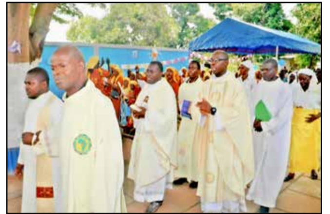
Une vue de la procession

Des religieuses de la Congrégation des sœurs de la Divine Providence de Ribeaupville et quelques séminaristes étaient comptés parmi les participants de la messe aux côtés des membres de la Communauté paroissiale.