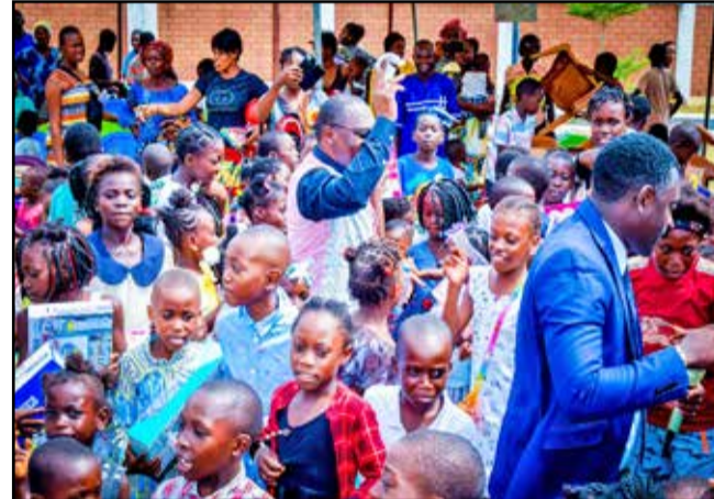
Les enfants manifestant leur joie

travailler aux côtés d'acteurs locaux, en l'occurrence, la mairie de Ngoyo, pour donner le aux enfants démunis de cet arrondissement en cette période de fin d'année. Nous es-