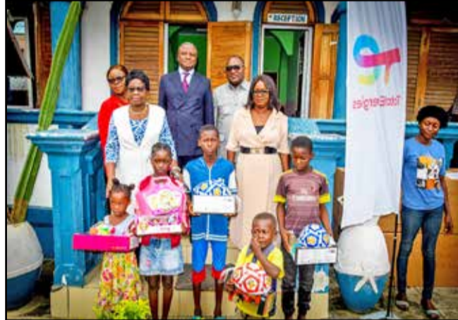
Les enfants ayant reçu leurs cadeaux

des conditions de vie des populations vivantes autour de nos installations. Nous sommes fiers de contribuer à cette action destinée aux enfants de cet arrondissement et de