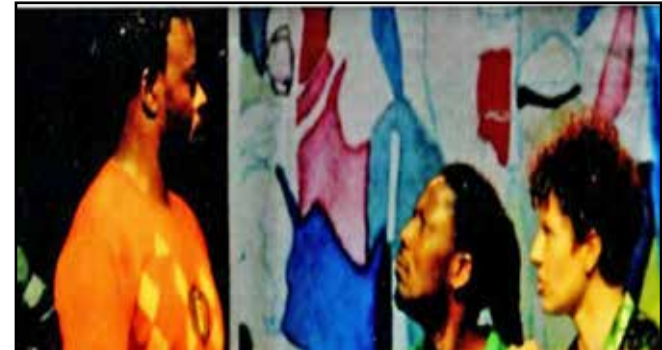
La Compagnie Koz'art du Cameroun sur scène

La 20 e édition du Festival Mantsina sur scène, rencontre internationale de théâtre de Brazzaville, s'est déroulée du 13 au 22 décembre 2023. La capitale politique congolaise a vibré aux sons et à la prestation des différents artistes qui y ont pris part. L'évènement a eu pour thème: "L'affirmation", un thème qui met en exergue la notoriété de l'évènement.