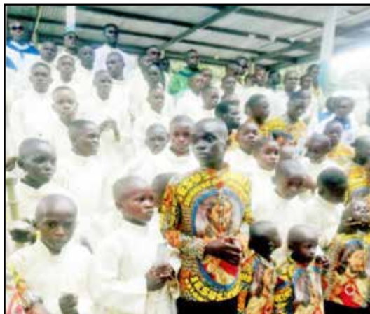
Les servants d'autel après la messe