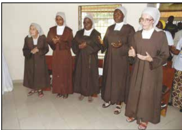
Une vue des sœurs Carmélites de Brazzaville pendant la messe.

sident de la C.e.c a souligné le caractère universel de la mission dévolue aux Carmélites, partant à tous les ordres contemplatifs, laquelle permet à l'Eglise de s'enraciner davantage et de perpétuer sa