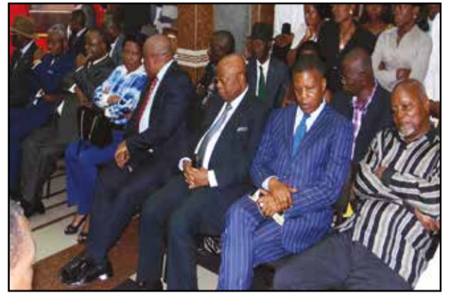
Les leaders du Frocad.

Tout en relevant l'illégalité du référendum constitutionnel, les forces politiques et sociales opposées au changement de la Constitution rejettent les résultats de ce scrutin et exigent: «l'annulation de ce référendum et le retrait pur et simple du texte de la nouvelle constitution; la libération immédiate de tous les responsables et militants de l'opposition arbitrairement arrêtés pendant la campagne référendaire; la levée sans délai des mesures d'assignation à résidence