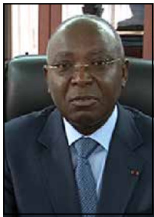
Raymond Zéphirin Mboulou, ministre de l'intérieur et de la décentralisation.

Inscrits: 596.103; Votants: 357.499; Taux de participation: 59,97%; Bulletins nuls ou blancs: 3.346; Suffrages exprimés: 354.443; Oui: 331.256; Non: 22.767.