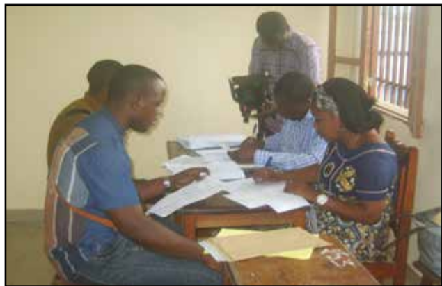
Les agents Pdce entretenant les jeunes.