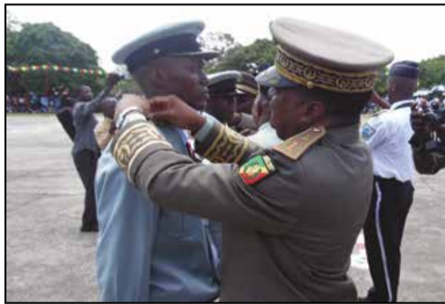
Port des insignes de grades.