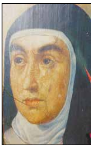
Sainte Thérèse d'Avila.