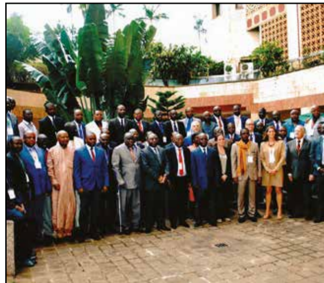
Photo de famille des membres des cellules de renseignements financiers francophones.

L'A.n.i.f (Agence nationale d'investissements financiers) organise, à Brazzaville, du 3 au 4 novembre prochain, une réunion des cellules des renseignements financiers francophones. Placée sous le haut patronage du ministre d'Etat, Gilbert Ondongo, ministre de l'économie, des finances, du budget, du plan et du portefeuille public, cette rencontre, qui regroupera vingt pays, se tiendra sur le thème: «Lutte contre le financement du terrorisme».