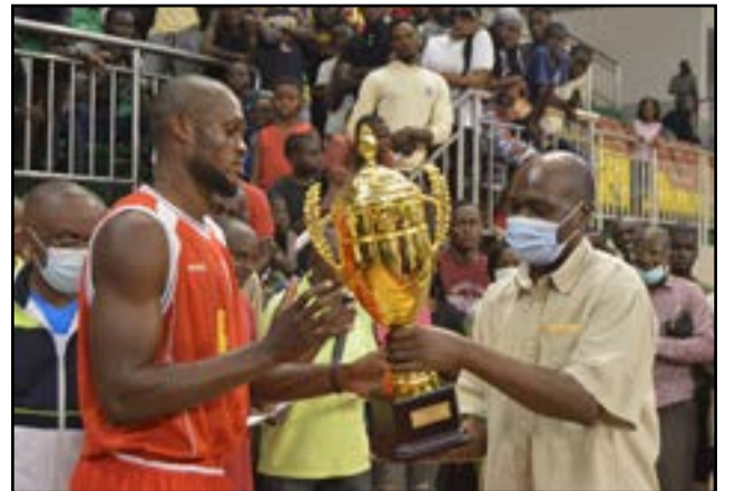
Le capitaine d'Inter Club reçoit le trophée des champions des mains du conseiller Ganga

On le voit, un gros travail reste à accomplir du côté des dames. Eternel refrain, dirait l'autre. En outre, il faut signaler que les actrices de grande