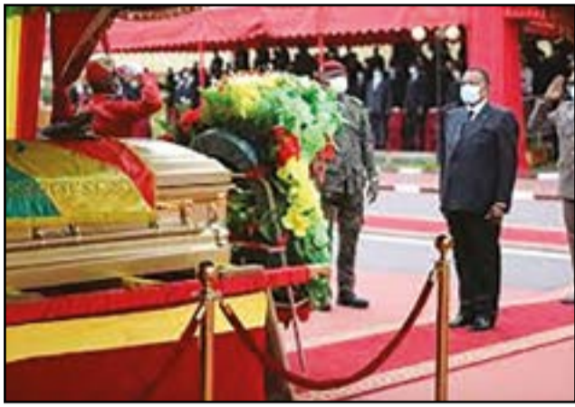
Le Président Denis Sassou-Nguesso se recueillant après avoir déposé la gerbe de fleurs