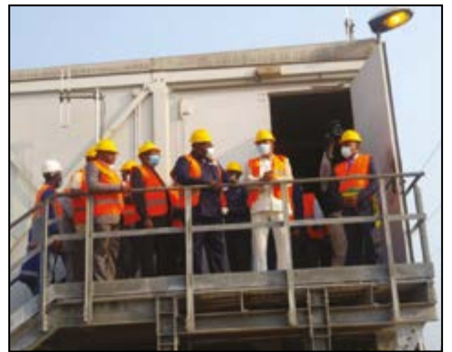
Pendant la visite

également inspecté les installations du poste Très haute tension de Mbondji, dans le district de Hinda, en pleine capacité de production électrique. Ici, le poste est composé de deux transformateurs électriques et dispose du nécessaire pour répondre à la demande des sociétés industrielles. Sur 110 MW de garantie, il n'y a que 14 MW seulement qui sont utilisés par le champ pétrolier d'Eni Congo et des deux autres sociétés. Le ministre a saisi cette opportunité pour exhorter les sociétés à y investir et il a dénoncé la concurrence malsaine pratiquée par certaines sociétés industrielles implantées dans la zone de Mbondji. Il a eu une série d'entretiens avec les so-