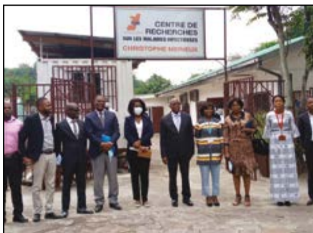
Après la visite