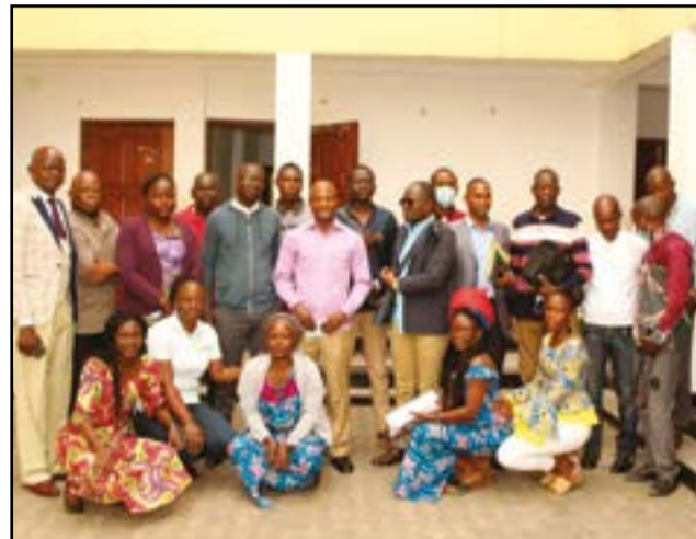
Les participants après la cérémonie d'ouverture

Vingt-un enseignants y prennent part ainsi que onze facilitateurs, dont trois chercheurs de l'INRAP et deux chefs de l'Inspection de la circonscription scolaire (ICCS) et six en Braille.