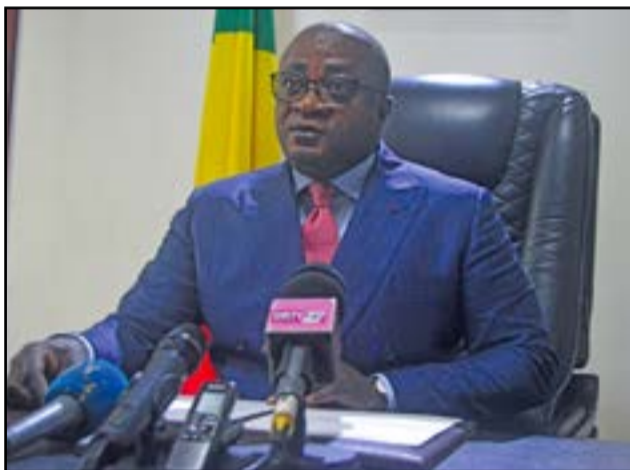
Aimé Ange Wilfrid Bininga

L'humanité a célébré, le lundi 9 août dernier, la Journée internationale des peuples autochtones. Prélude à cette célébration, le ministre de la Justice, des droits humains et de la promotion des peuples autochtones, Aimé Ange Wilfrid Bininga, a fait une déclaration le samedi 7 août, à Brazzaville.