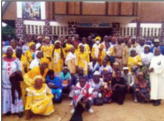
Les participants aux assises nationales du Renouveau charismatique à Madingou

A Madingou, les participants ont échangé aussi sur certains aspects de réforme concernant le fonctionnement du Renouveau. Notamment la question de la fête de Christ-Roi et la célébration du cinquantenaire du Renouveau (1973-2023). A propos de la question de la fête de Christ-Roi, et faisant suite à une invite des pères évêques, la coordination nationale a opté pour le jour de la fête de Sainte Trinité au calendrier liturgique comme jour anniversaire pour le Renouveau charismatique au Congo. Ce ne sera plus lors de la fête de Christ Roi de l'univers en novembre. La raison de ce changement s'explique du fait que le Vatican a déclaré la fête de Christ-Roi de l'Univers comme jour de grands rassemblements des Jeunes au plan mondial (JM) et ce donc,