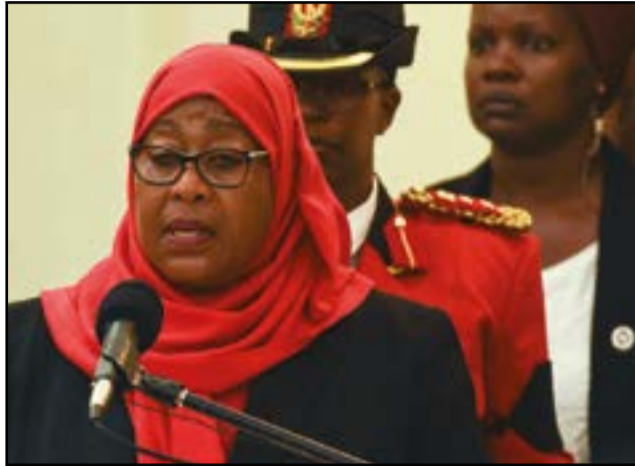
Samia Suluhu Hassan

La nouvelle présidente du pays, Samia Suluhu Hassan, a affirmé qu'il n'était pas bon d'ignorer l'importance de la pandémie. Elle a fait cette déclaration lors de la cérémonie d'investiture des membres de son nouveau gouvernement à Dar es Salam.