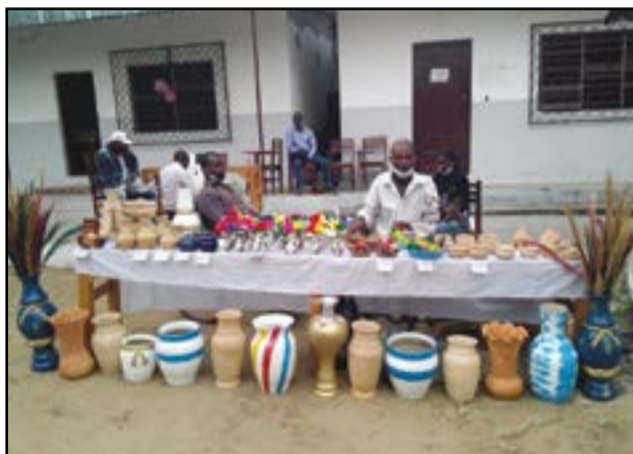
Une vue de l'exposition-vente