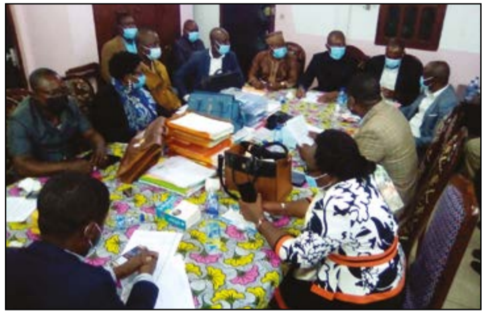
Les syndicalistes en pleine séance de travail (P.11)