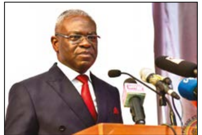
Anatole Collinet Makosso

suite à un litige l'opposant à l'ex opérateur de téléphonie mobile Warid Congo. Pour cette préoccupation, le premier ministre a sollicité l'autorisation de ne pas répondre à une question adressée au ministre des Postes, des télécommunications et de l'économie numérique. En application, selon lui, de l'article 169 de la Constitution qui dispose: «le pouvoir judiciaire ne peut amputer ni sur les attributions du pouvoir exécutif, ni sur celles du pouvoir législatif. Le pouvoir législatif ne peut ni statuer sur les différends ni entraver le cours de la justice ou s'opposer à l'exécution d'une décision de justice». «C'est une question de justice», a rappelé Pierre Ngolo, comme pour balayer cette préoccupation. Le ministre Jean Luc Mouthou a justifié le non recrutement de certains diplômés de l'Ecole normale supérieure (ENS) par le fait qu'ils n'étaient pas sur le terrain. Pour cela, l'administration a reconnu plutôt les bénévoles dans les domaines de la santé et de l'éducation. Mais il a rassuré qu'un effort