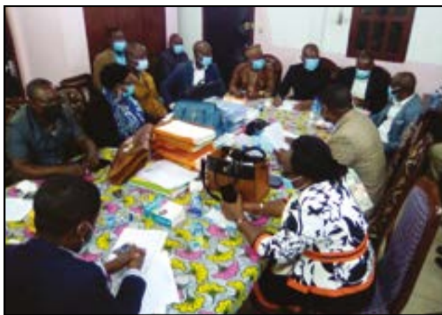
Pendant la séance de travail