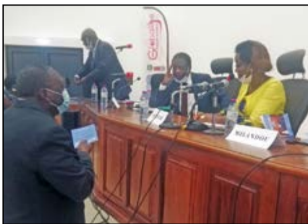
L'auteure, pendant la dédicace du livre

a donné beaucoup d'affection et d'amour. Et en retour, elle pérennise le nom de celui-ci à travers ce livre. C'est aussi un hommage à un compatriote, un homme brave qui a beaucoup aimé son pays, qui a accompli son travail avec professionnalisme et qui est allé servir au-delà des frontières pour une mission de pacification d'un pays frère, la République Centra-