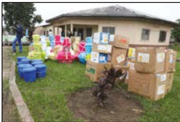
Un échantillon de don au district sanitaire

Fonds des Nations Unies pour la population (UNFPA) Congo. Cette commémoration a permis de sensibiliser les Gouvernements, les décideurs et les différentes couches de la population sur l'importance des questions de population et les enjeux qu'elles représentent dans les efforts de développement des pays. L'édition 2021, a été célébrée sur le plan international sous le thème: «Les droits et les choix sont la réponse: qu'il s'agisse d'un baby-boom, ou d'un effondrement, la solution consiste à donner la priorité à la santé de la reproduction et aux droits de tous».