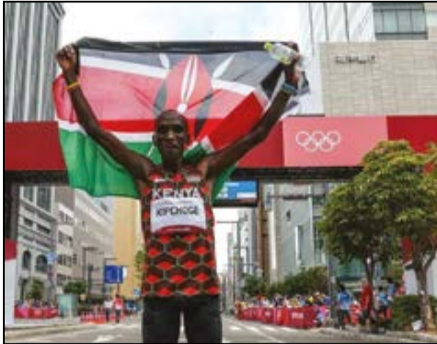
Eliud Kipchoge reste champion olympique du marathon

Les performances africaines aux Jeux de Tokyo, malgré une médaille d'or de plus qu'à Rio il y a cinq ans, laissent encore à désirer. Sauf, bien sûr, en athlétisme dans les épreuves de fonds et de demi-fond. En effet, ces Jeux ont révélé les quelques forces mais aussi et, surtout, toutes les faiblesses du sport continental. C'est terminé à Tokyo le 8 août 2021 ! Les jeux Olympiques de la 32e Olympiades sont bien terminés. Entreprise gigantesque et risquée, ils auront coûté une fortune au Japon, aggravée par la pandémie de COVID-19. La facture des Jeux, officiellement à 12,6 milliards d'euros, alors que certains audits l'évaluent au double, reste totalement (hors contribution de 1,1 milliard d'euros versée contractuellement par le CIO) à la charge du Japon et