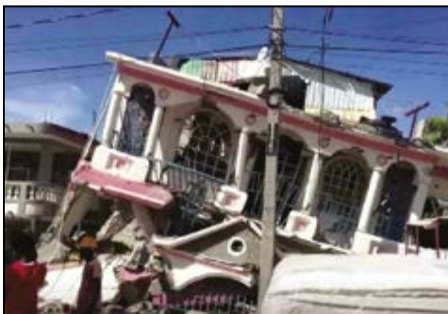
Un bâtiment effondré lors du tremblement de terre

Pays situé aux Amériques, Haiti a été secoué samedi 14 août 2021 par un séisme de magnitude 7.2. La secousse a été ressentie sur l'ensemble du pays. Elle a occasionné des dégâts matériels et humains dans plusieurs régions du pays. Un bilan, toujours en évolution, faisait état de plus de 1200 morts lundi, selon Jerry Chandler, directeur de la Protection civile.