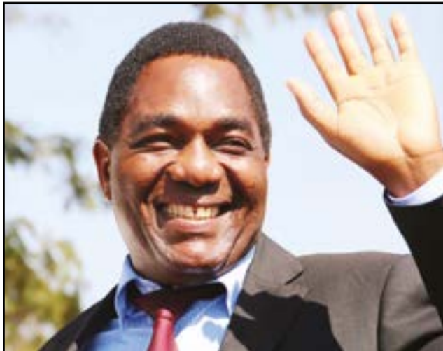
Le Président élu Hakainde Hichilema

Dans peu de temps, la conduite des destinées de la Zambie sera confiée à l'opposant Hakainde Hichilema. Il est en tête des résultats provisoires du scrutin présidentiel publiés par la Commission électorale lundi 16 août 2021, qui lui accordent une avance confortable de près d'un million de suffrages sur le Président sortant, Edgar Lungu, au pouvoir depuis 2015.