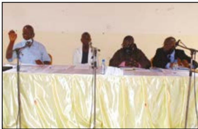
Le présidium du 1er jour de la session

Au cours de son allocution de clôture, l'archevêque a invité tous les responsables à prendre au sérieux le service que l'Eglise leur confie : « Cultivons l'esprit de collaboration et d'unité car tous, nous sommes au service de la même Eglise et nous devons participer à sa croissance et à son évolution. Tout en vous remerciant pour votre participation active aux travaux, je déclare clos les travaux de la session de clôture de l'année