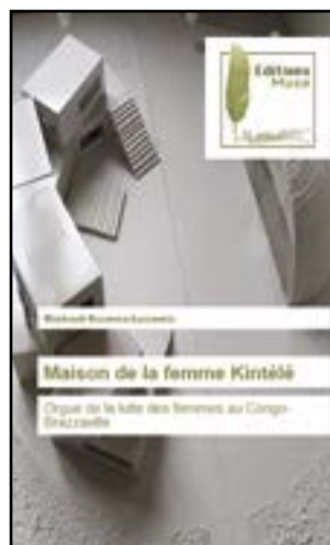
La couverture du livre

femme au développement du ministère de la Promotion de la femme; l'Organisation des femmes du Congo, d'autres associations du type. Dans son ouvrage, l'écrivain et juriste ressourcement l'idée de créer cette institution consacrée à la femme conformément aux instruments juridiques internationaux signés et ratifiés par la République du Congo. Parmi lesquels, la Convention de Beijing de l'an 2000 sur l'évolution des droits des femmes en Afrique subsaharienne; les 25es de Beijing relatives au leadership féminin en matière d'entrepreneuriat; et le Protocole de Maputo conclu en 2002 concernant les violences faites aux femmes.