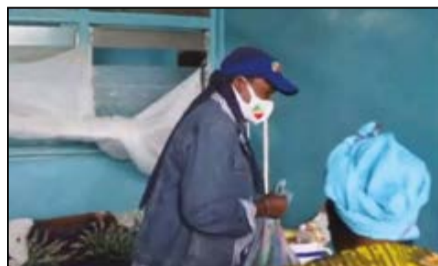
Une malade recevant le don de la directrice

Lors de son récent comité de gestion tenu le 30 juillet dernier, la ration alimentaire des malades était au cœur des préoccupations de l'hôpital, notamment dans la communication de la directrice, très pathétique, lorsqu'elle a évoqué le point sur les ressources humaines, matérielles et financières de son hôpital, en se basant sur la période d'octobre 2020 à juin 2021. La question fait partie des