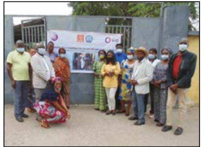
Les organisateurs et les participants

Placée sous l'égide de l'animateur de l'ONDV, cette réunion de concertation a réuni plusieurs personnalités de diverses obédiences œuvrant aussi bien dans l'administration étatique que dans la société civile et a eu pour objectif général de lancer les activités de concertation, de poser les bases de la concertation autour de la problématique des veuves.