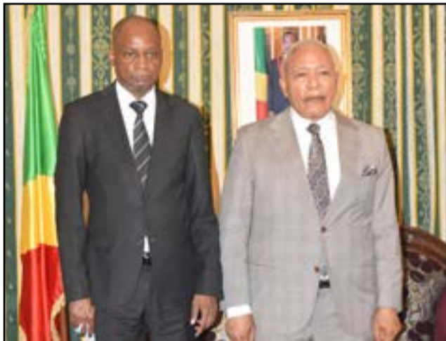
Lo Abou et Isidore Mvouba

Le 11 août, le président de l'Assemblée nationale, Isidore