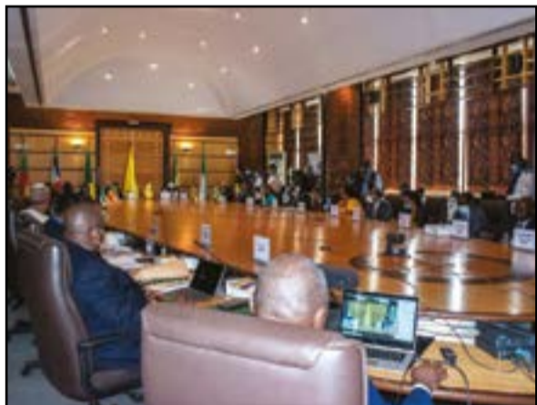
Pendant la séance de travail