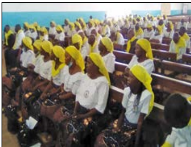
Les membres de la MUCASOC pendant la messe

préférentielle de l'Eglise: être au service des pauvres. Mais, on ne peut servir ou aider les pauvres sans argent. Acquittons-nous, chers membres, de nos cotisations, a-t-il souligné, avant de fustiger la tiédeur des membres qui confine à la fatigue ou à la paresse.