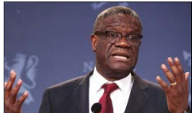
Le Dr Denis Mukwege

Cette justice est destinée à réparer les torts contre les victimes des crimes les plus graves commis depuis plus de deux décennies dans les provinces de l'Est de son pays, dans le Kivu, au Kasai ou au Tanganyika. «Le temps est