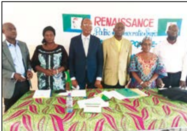
Les membres du bureau fédéral