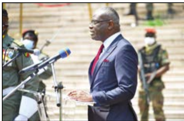
Anatole Collinet Makosso

la corruption et de toutes malversations financières est inébranlable. «L'Etat de droit c'est cet Etat où les décisions de justice rendues au nom du peuple congolais sont exécutées sans surcharge démagogique. Lorsqu'on a fait du tort à l'Etat et à la République, on se doit de faire preuve de contrition, d'humilité et de repentance. L'histoire de notre pays nous enseigne que nombreux sont nos compatriotes, au nom de la République fraternelle, qui ont bénéficié de l'amnistie et du pardon de notre peuple, lorsque dans un élan de repentance ils ont témoigné de l'empathie et regretté les actes posés. Il leur suffisait de s'engager à ne pas revenir sur les lieux de leurs crimes», a-t-il rappelé. Et d'ajouter: «L'Etat dont nous