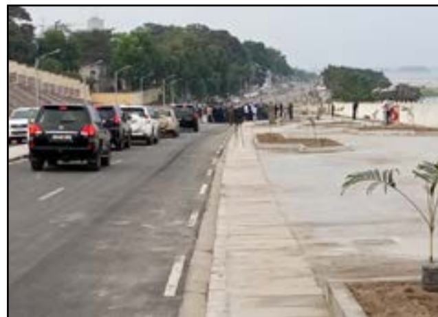
Vue de la corniche

Effondrée dans la nuit du 8 au 9 janvier 2020 suite aux pluies diluviennes, le tronçon de la corniche endommagé, entre le restaurant «Mami Wata» et le rond-point du ministère de la Défense nationale, a été réouverte par Jean-Jacques Bouya, ministre de l'Aménagement du territoire, des infrastructures et de l'entretien routier le samedi 14 août 2021. Les travaux ont duré dix-neuf mois et réalisés par la société China road and bridge corporation (CRBC).