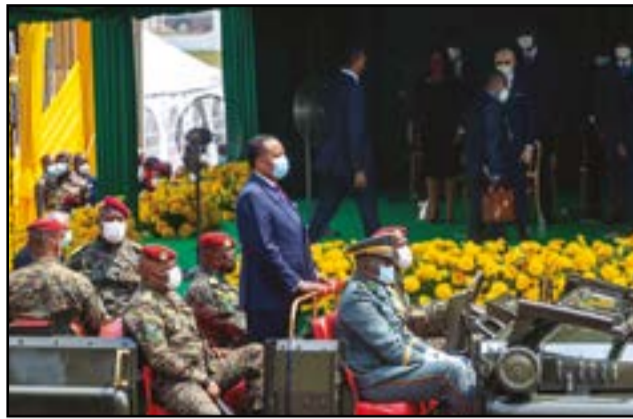
"Pendant la revue des troupes

teurs nous exhortent au travail. Car le travail libère l'homme et l'ennoblit. Un pays ne peut réaliser son développement social, économique et acquérir son indépendance véritable que grâce au travail, et au travail bien fait. Essayons de travailler suivant l'exhortation de Martin Luther King en faisant l'effort, qui que nous soyons, d'être le meilleur, là où l'Etat nous emploie, et que nous accomplissions notre besogne comme s'il s'agissait d'une mission spéciale que nous avait confiée Dieu le créateur». Pour le premier ministre, le choix du drapeau comme symbole de l'Etat, n'est pas non plus le fait du hasard. «Tout semble avoir été bien pensé par nos pères fondateurs. Le drapeau national est représenté par une bannière aux couleurs vert, jaune et rouge. Le vert symbolise la paix et rappelle les vastes étendues forestières de la végétation congolaise intégrées dans le bassin du Congo, deuxième poumon écologique de la planète après l'Amazonie. Il est également le symbole de notre espérance dans l'avenir économique et social du pays. Le jaune exprime notre volonté d'union et de notre traditionnel sens de l'hospitalité, et le rouge exprime le courage et l'ardeur du peuple congolais». Après avoir forgé notre Etat indépendant et souverain, «nous nous sommes investis à créer l'Etat de droit. Oui ! L'Etat dont nous célébrons l'indépendance aujourd'hui est un Etat de droit», a précisé le premier ministre qui pense que la volonté du peuple de promouvoir l'Etat de droit, débarrassé de