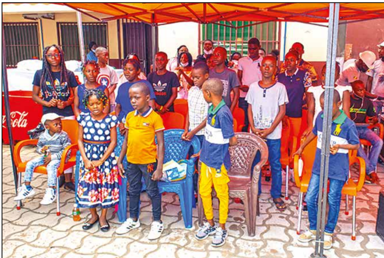
Les enfants de l'orphelinat Inzo ya Bana

enfants à faire un bon usage et à se concentrer sur l'école.