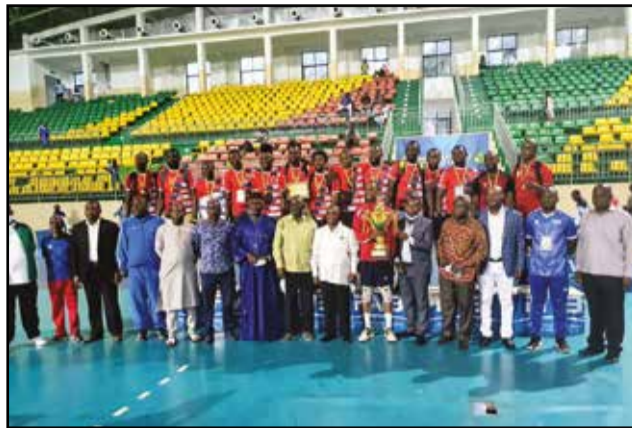
DGSP à l'honneur

Après les championnats nationaux, Brazzaville s'apprête à abriter les Coupes des clubs champions juniors et seniors (Dames et messieurs) de la zone 4 de la Confédération africaine de volley-ball.