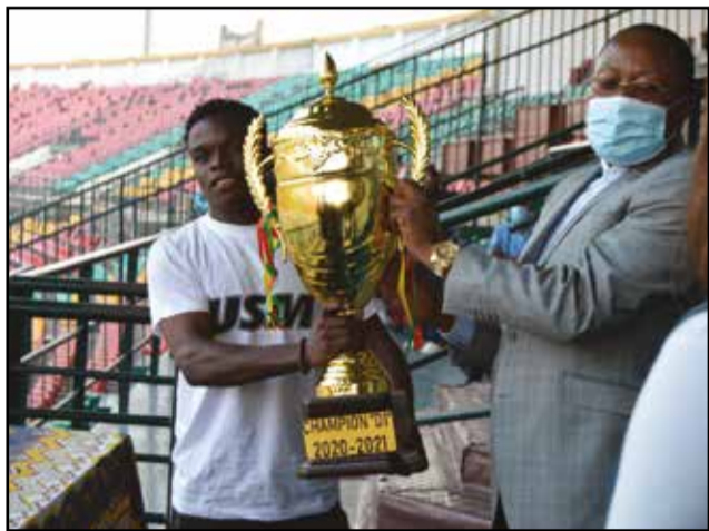
Le trophée du champion de Division 1, Gazon vert

La saison 2020-2021 du football brazzavillois s'est achevée mercredi 22 septembre 2021 au Stade Président Alphonse Massamba-Débat, où les meilleurs acteurs des championnats de Division 1 et de Division 2 ont été récompensés.