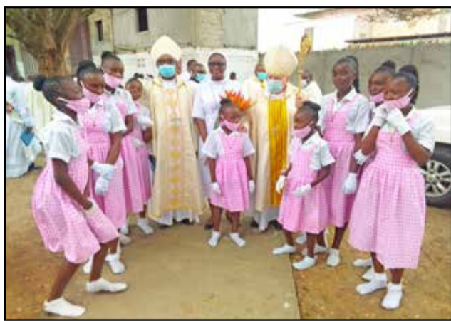
L'élue du jour entourée de l'archevêque de Pointe-Noire (crosse en main) et de l'évêque de Nkayi