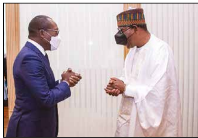
Patrice Talon et Thomas Bony Yayi ne s'étaient pas rencontrés depuis

Anciens amis devenus ennemis suite à des divergences de vues politiques, l'actuel président Patrice Talon et son prédécesseur Thomas Bony Yayi, aujourd'hui opposant, ont enfin pris la résolution de se parler. Ils se sont rencontrés mercredi 22 septembre dernier à Cotonou. De bonnes sources indiquent qu'après cette entrevue, le Bénin se dirige vers un apaisement politique.