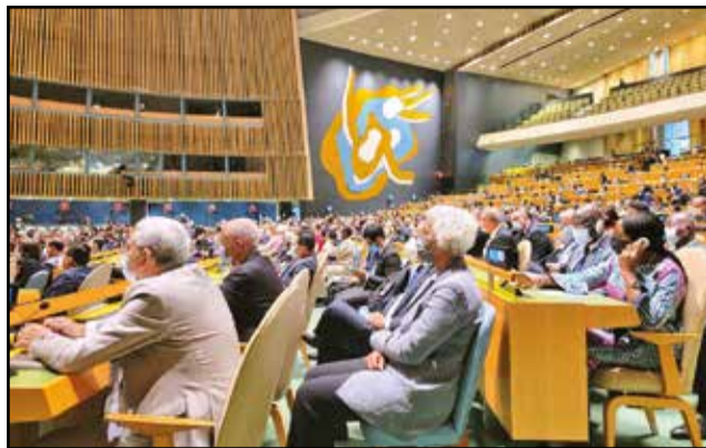
Les participants à l'assemblée générale de l'ONU à New York

La 76 ème session de l'Assemblée générale des Nations unies se tient depuis le 21 septembre 2021 à New York, aux Etats-Unis. Ce grand rendez-vous diplomatique mondial qui dure une semaine, est particulièrement attendu cette année, après la version essentiellement virtuelle de l'an dernier.