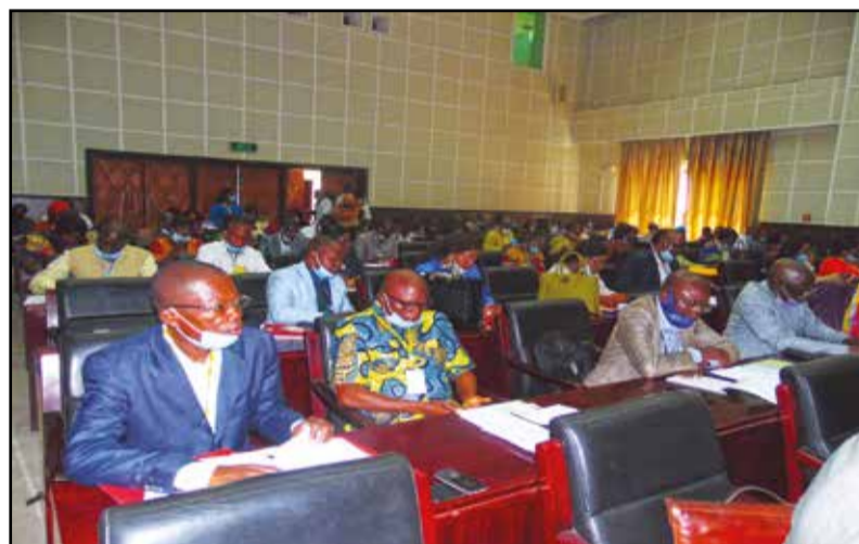
Vue de l'assistance

difficultés dans le système éducatif protestant. L'éducation est le socle d'ouverture d'esprit capable de concevoir et de se mouvoir dans l'univers de la réflexion. Elle nous aide à devenir des femmes et des