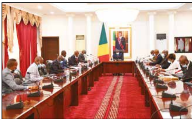
La séance de travail entre le Gouvernement et l'intersyndicale

Toutes les structures de l'Université Marien Ngouabi étaient paralysées. La cohue des étudiants remplacée par des chants d'oiseaux. Une situation qui portait préjudice aux étudiants qui étaient en pleine session et aux nouveaux bacheliers dont bon nombre