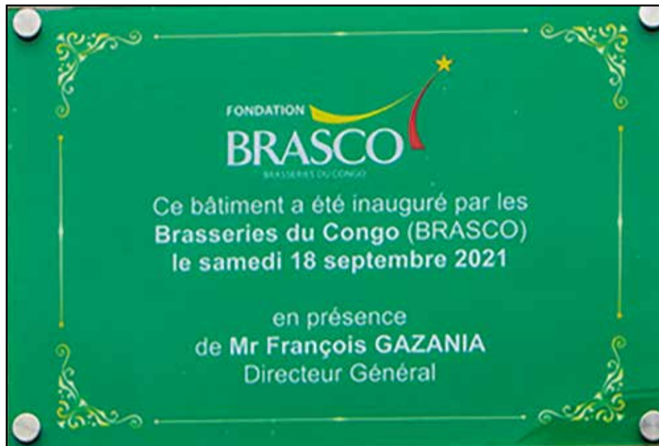
La plaque inaugurale