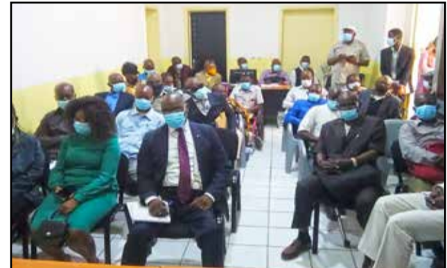
Les participants à la rencontre citoyenne