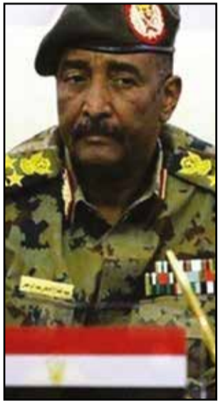
Le général Abdel Fattah el-Burhane (P.7)