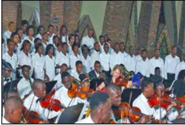
L'orchestre symphonique a tenu le public en haleine

Après avoir bénéficié d'une formation musicale de trois semaines, dispensée par des formateurs allemands venus droit de ce pays, conduits par Ernst Bechert, et dans la foulée des festivités marquant les 62 ans de l'indépendance du Congo, l'orchestre symphonique des enfants de Brazzaville a livré un concert inédit, dimanche 14 août, dans la basilique Sainte-Anne du Congo à Brazzaville. A l'issue duquel, il a tenu le public venu nombreux en haleine par la maîtrise des partitions, des instruments à vent et le savoir-faire des musiciens.