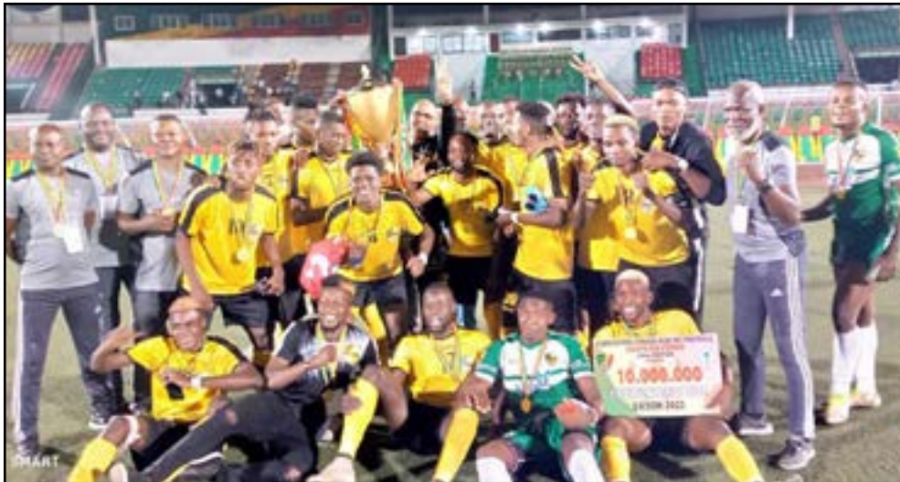
Les ouvriers du neuvième sacre des Diablies-Noirs

Comme ils le font depuis 1989, année de leur premier sacre, les Diablies-Noirs se sont sublimés encore cette année en Coupe du Congo. Ils ont fait l'essentiel, c'est le moins que l'on puisse dire d'une équipe qui ne l'a emporté que par la plus petite des marges (1-0). Mais un but précieux. Il a été inscrit dans le temps additionnel de la première mi-temps. Quelle première mi-temps ! Les Diablies-Noirs semblaient l'ac-