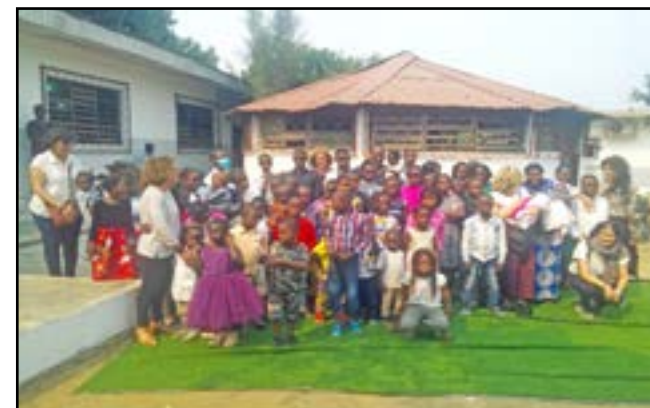
Les orphelins, les membres de la délégation et la présidente de la fondation, posant pour la postérité

Ces cinq tricycles et les deux béquilles ont été remis aux bénéficiaires le vendredi 12 août 2022 par cette délégation