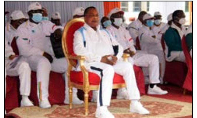
Le Président Denis Sassou-Nguesso