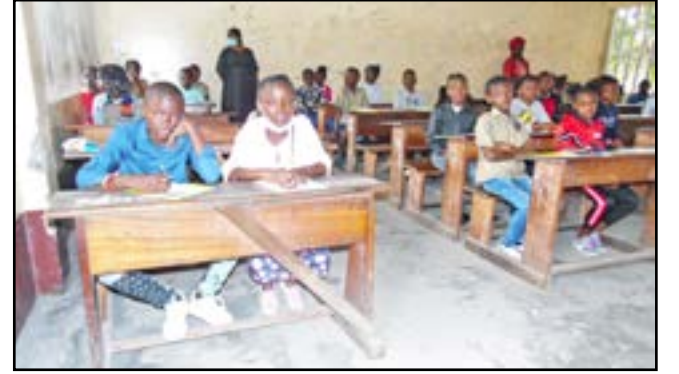
Les candidats pendant les épreuves au CEG de la Fraternité

Ils étaient 577 candidats sur l'ensemble du territoire national dont 276 filles à prendre part au concours d'entrée dans les écoles d'Excellence de Mbounda, dans le département du Niari, et d'Oyo, dans la Cuvette.