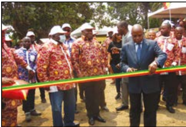
La coupure du ruban symbolisant la remise des forages aux bénéficiaires

La conception de ce projet est partie du constat selon lequel les populations vivant sur cet axe éprouvaient d'énormes difficultés d'accès à l'eau potable. Aussi la Fondation SNPC a-t-elle décidé d'ériger 21 forages sur l'ensemble du projet, dont onze sont déjà réalisés et remis officiellement. Pour cette première remise, les villages concernés sont: Yié (1 forage); Bambou (2 forages); Nkouo (2 forages); Odziba (2 forages); Mbama, Imbimi, Massa, Dieuleveut, un forage chacun. Les profondeurs de ces forages varient entre 135 et 180 m.