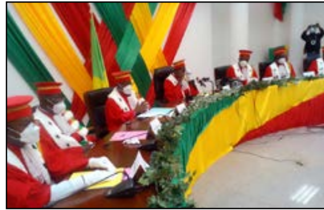
Les membres de la Cour constitutionnelle

Faute de preuves convaincantes, selon elle, la Cour constitutionnelle a rejeté les 30 requêtes de contestation soumises à son appréciation. Le verdict a été rendu le dimanche 14 juillet 2022 par Auguste Iloki, président de la Cour.