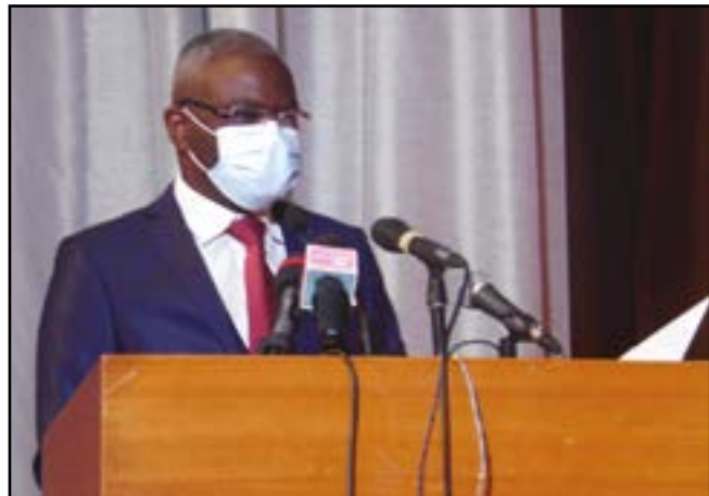
Anatole Collinet Makosso

déposé très bientôt au Parlement», a-t-il fait savoir. Le Premier ministre a levé l'équivoque: «Nous ne le fai-