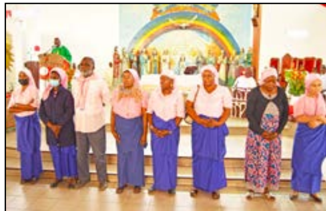
Les nouveaux membres du bureau de la Confrérie Sainte Rita avec à l'extrême gauche la présidente, le S.G (3 e de g à d)

tives. Exprimant sa reconnaissance à la communauté paroissiale pour les trois ans