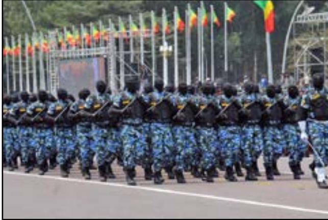
Le défilé militaire

Les Congolais ont célébré dans la joie la fête de l'indépendance. Cet événement historique majeure a été marqué par le message du Président de la République à la nation, prononcé le dimanche 14 août 2022, et surtout du grand défilé militaire organisé lundi 15 août, au Boulevard Alfred Raoul. C'est le Chef de l'Etat, Denis Sassou-Nguesso, accompagné de son épouse Antoinette qui a patronné la cérémonie. En présence des présidents des Institutions de la République, du Premier ministre, des membres du Gouvernement et du Parlement, du préfet du département de Brazzaville, des officiers du haut-commandement de la force publique, des ambassadeurs et chefs de missions diplomatiques, etc.