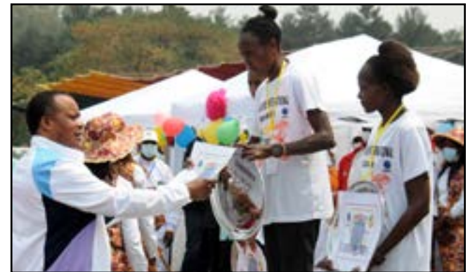
Le Président récompensant un des vainqueurs de la course

Créé en 2001, le SMIB est une course à pied qui a pour objectif de faire germer dans le mental des jeunes Congolais, les valeurs de patriotisme, de solidarité et de compréhension mutuelle, de citoyenneté et de civisme en vue de consolider paix sociale et l'unité nationale, expliquent ses initiateurs.