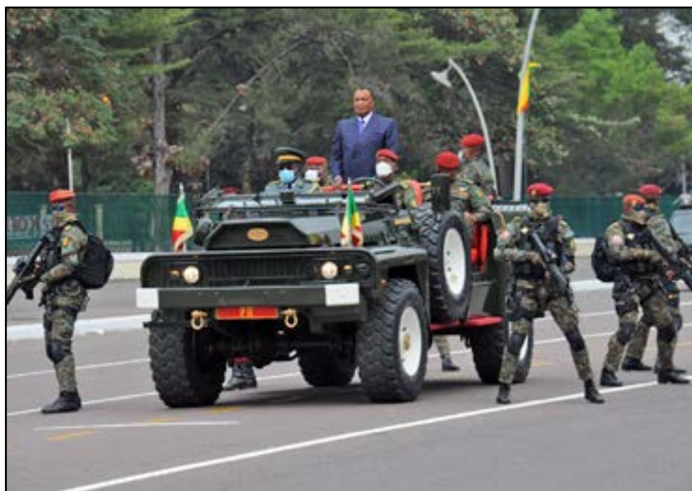
Pendant la revue des troupes (P.3)