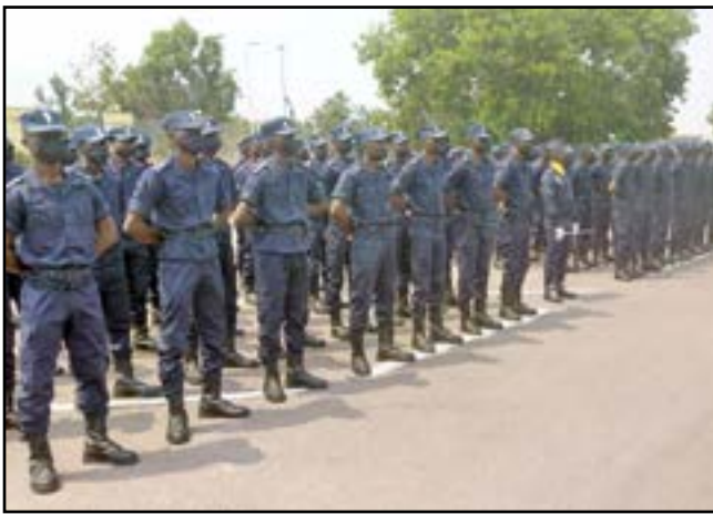
Des élèves gendarmes de la 13 e promotion lors de la cérémonie

merie. Dans l'ensemble les prestations ont été bonnes, et pour accomplir cette mission, 160 encadreurs officiers et sous-officiers, instructeurs ont été admis à la tâche. Sur le plan pédagogique, la formation a porté sur trois modules : l'enseignement militaire ; l'éducation physique militaire et sportive ; l'enseignement général. La finalité des enseignements consistait à rendre les apprenants aptes à l'exécution des missions militaires et à commander une équipe au combat. Au cours de la formation, deux rendez-vous sur objectif ont eu lieu, et au terme de ces deux examens, les résultats se présentent ainsi qu'il suit : effectif des stagiaires à l'entrée 1772, effectif des stagiaires à la sortie 1257, décédés 4, radiés 10, déserteur 1. Effectif ayant composé 1257, effectif admis ceux qui ont obtenu la moyenne de 12 et plus, 1112, taux de réussite 88,8%, moyenne la plus élevée 17,92, la moyenne la plus basse 11,39. Sur l'ensemble des élèves présentés : 33 ont obtenu la mo-