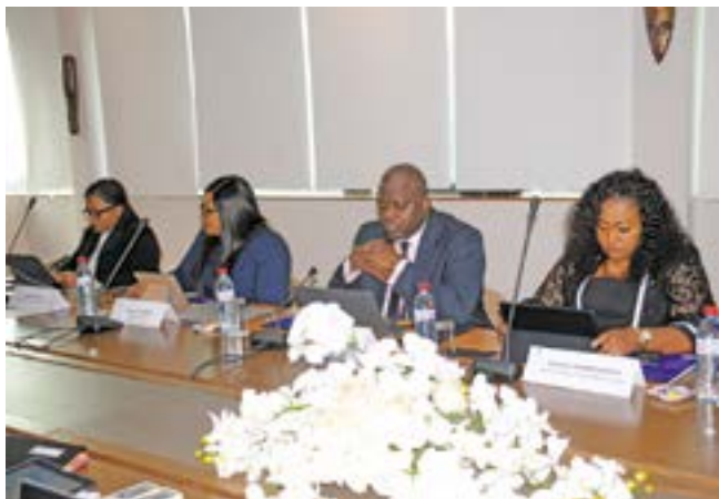
Une vue des administrateurs

Après la rencontre de juin dernier, les responsables du groupe se sont de nouveau retrouvés à Brazzaville. Le numéro un du 1 er groupe financier de l'Afrique centrale a justifié ces dernières retrouvailles par le fait que l'institution dispose d'un « agenda réglementaire qui fait que...aujourd'hui nous examinons la situation du groupe au 30 juin aux fins de décider des perspectives pour la fin de l'année 2022 ». « La banque au 30 juin a fait un résultat conforme à son budget. Donc, nous sommes tout à fait heureux avec la Direction générale ici présente...Avec les réalisations au 30 juin, les perspectives en 2022 ne seront que meilleures, comme le conseil l'a inscrit», a indiqué le PDG du groupe qui, par ailleurs, a