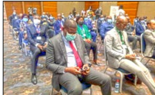
Les participants pendant le séminaire

Un séminaire technique sur le thème : «La protection sociale des travailleurs migrants en Afrique centrale: harmoniser les législations» s'est tenu, les 4 et 5 août 2022, à Brazzaville. Sous la direction de Jean Rosaire Ibara, ministre du Contrôle d'Etat, représentant Firmin Ayessa, ministre du Travail et de la sécurité sociale.