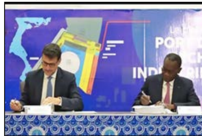
Pendant la signature

superficie de totale de 3,5 Ha, répartis en différentes zones dont une zone de déchargement des poissons, une zone