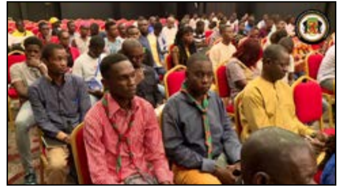
L'atelier de restitution a mobilisé plusieurs jeunes

Mercredi 2 novembre dernier à Brazzaville, cinq des huit jeunes congolais porteurs de projets promoteurs de start-up ayant participé au 5 e Sommet Youth Connekt Africa tenu à Kigali, au Rwanda, ont, au cours d'un atelier, mis leurs collègues venus des quatre coins de la capitale au fait des opportunités de soutiens publics et privés à la création d'emploi qu'offre ce projet continental. Ils ont aussi discuté avec eux de la mise en œuvre de l'initiative Youth Connekt Africa en République du Congo.