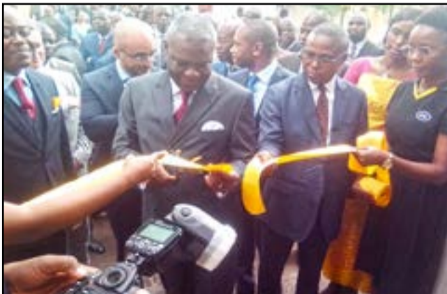
Le Premier ministre coupant le ruban symbolique