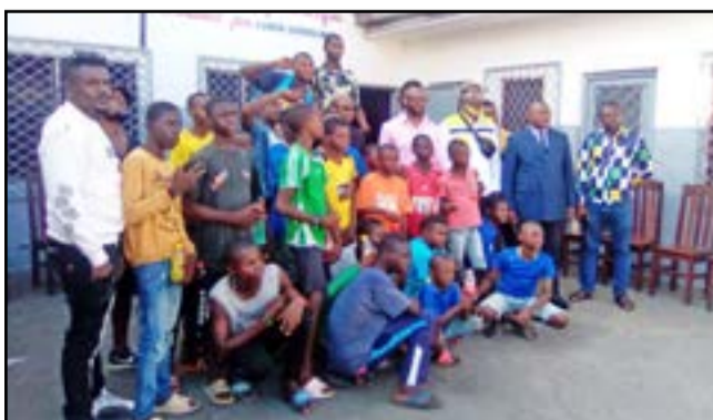
Les organisateurs avec les enfants sans domicile fixe