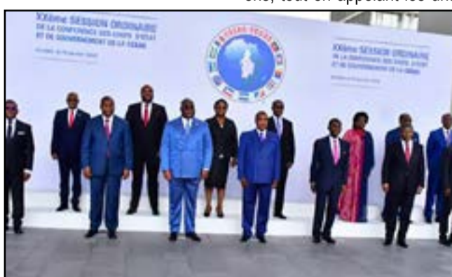
Les chefs d'Etat et de Gouvernement de la CEEAC

Itno, remplacé par l'un de ses fils, Mahamat Idriss Déby. Une cinquantaine de personnes, dont une dizaine de membres de Forces de sécurité, ont été tuées récemment, pendant des affrontements opposant la police et les protestataires, lors d'une manifestation de l'opposition contre la prolongation de deux ans de la transition par le pouvoir du Président actuel. Selon, Saleh Kebzabo, Premier ministre Tchadien, «les décès sont principalement survenus dans la capitale