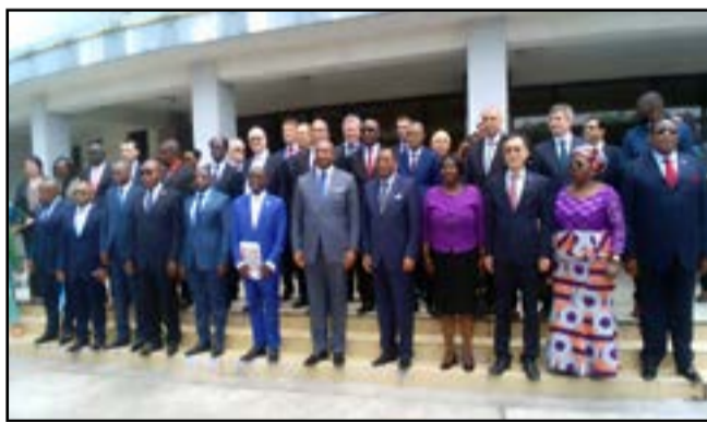
Les officiels à la fin de la cérémonie

Le coordonnateur résident du Système des Nations