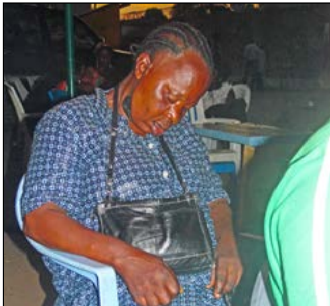
Une femme retraitée non pensionnée fatiguée