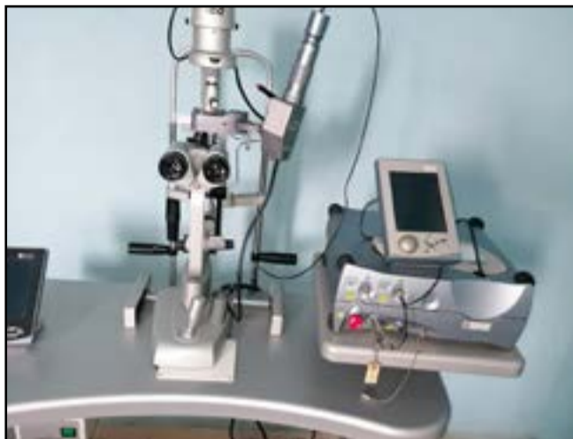
La colonne à laser, appareil ophtalmologique performant

* Il y aura cinq sessions. La première, c'est la conférence inaugurale ou on aura une représentante de l'OMS Afro qui va parler du Pacte mondial contre le diabète. La deuxième