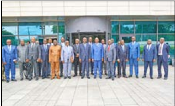
Jean Baptiste Ondaïe (au milieu) entouré des participants