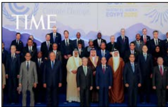
Après l'ouverture des travaux

Reste que ce ne sont que des engagements des pays, non contraignants. En outre, si le Pacte de Glasgow a permis d'engranger quelques «avancées», en particulier sur des promesses de neutralité carbone, les émissions continuent de progresser, et