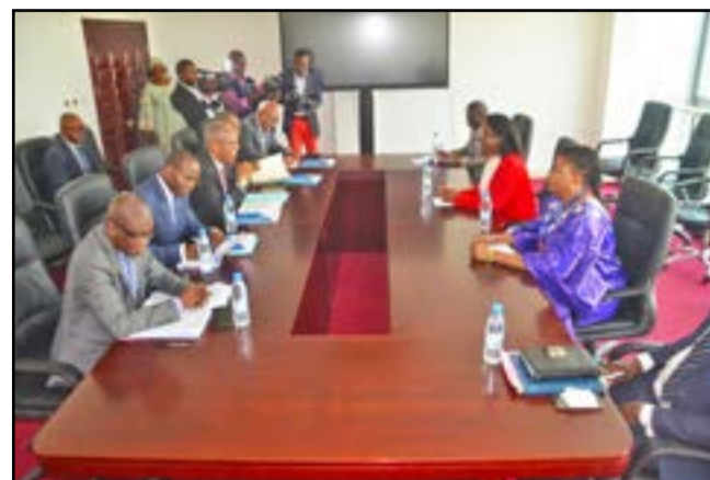
Les deux parties pendant les échanges

S'agissant du Programme pays pour le travail décent, les deux parties s'apprentent à signer un nouveau cadre de collaboration pour exécuter son agenda de mise en œuvre. Un atelier y relatif a d'ailleurs été organisé