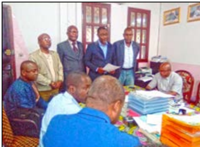
Les responsables syndicaux

Le 28 octobre 2022, le Collège intersyndical de l'Université Marien Nguabi a tenu à son siège sis complexe universitaire Bayardelle, une réunion qui lui a permis de faire le point sur les problèmes liés à la rentrée académique 2022-2023. Dans sa déclaration lue à la fin de la réunion, il exige du Gouvernement la signature, dans les plus brefs délais, d'un nouveau protocole d'accord, le premier signé le 1 er août 2019, étant arrivé à échéance avec un reliquat