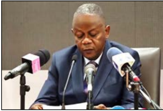
Le ministre Honoré Sayi

Ce projet permettra également à la République du Congo de se doter non seulement d'un véritable port de pêche moderne, mais aussi d'un ouvrage d'accostage moderne devant offrir à la communauté des pêcheurs artisanaux des conditions de débarquement du poisson, en toute sécurité.