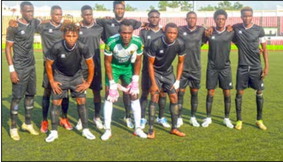
Diabes-Noirs de Brazzaville, un début de saison inédit

Les archives racontent qu'il y avait entre Diabes-Noirs et les coupes africaines interclubs quelque chose d'inexplicable. Jamais depuis leur succès (4-2) à Libreville en 1977 face à V.Club Mangoungou du Gabon, dans l'ex-Coupe d'Afrique des clubs champions, ancêtre de l'actuelle Ligue des champions, les "Jaune et noir" n'étaient plus parvenus à remporter une victoire en compétitions continentales à l'extérieur. En vingt-deux déplacements, entre 1977 (1/8 de finale de la Coupe des clubs champions face au Hafifa FC de Guinée) et 2022 (pre-