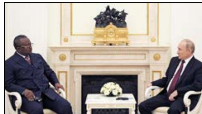
Umaro Sissoco Embalo et Vladimir Poutine

Umaro Sissoco Embalo, Président bissau-guinéen, et Président en exercice de la Communauté économique des Etats de l'Afrique de l'Ouest (CEDEAO), était en séjour de travail à Kiev et à Moscou où il a rencontré les Chefs d'Etat de ces deux pays, actuellement en guerre, à savoir, Volodymyr Zelensky, le 26 octobre, et Vladimir Poutine, un jour avant. Il a proposé une médiation africaine entre les deux parties. Sans succès. Il est le second Chef d'Etat africain à être reçu par Vladimir Poutine, après le Sénégalais Macky Sall, Président en exercice de l'Union africaine qui s'était rendu à Sochi pour demander la fin du blocus de ports ukrainiens à l'origine de la hausse des prix des denrées alimentaires dans de nombreux pays, surtout ceux du continent.