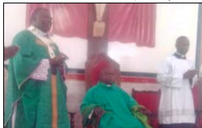
L'archevêque ayant installé le curé

profession de foi et le serment de fidélité qui est un acte essentiel par lequel le curé nommé prend canoniquement possession de sa charge en promettant fidélité à l'Eglise catholique, l'obéissance à l'archevêque et ses successeurs. Puis, le dialogue entre l'archevêque et le curé et enfin, le renouvellement de la