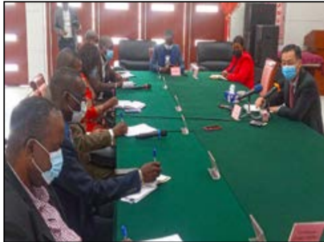
Les journalistes pendant la conférence de presse

à l'occidentale comme voie de développement. Un pays où «les problèmes sont discutés