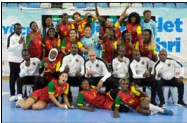
Les Diabes-Rouges pendant leur stage en Turquie

Le tirage au sort des groupes de la 25 e Coupe d'Afrique des nations de handball féminin a logé le Congo dans le groupe B, aux côtés de la Tunisie, de la Guinée, du Maroc et de l'Égypte. On a beau avoir la baguette magique, le fruit le plus consistant ne peut provenir que d'un travail sérieux et méthodiquement mené sur le terrain. L'équipe nationale féminine congolaise était en stage bloqué en Turquie. Le seul problème, c'est qu'il y a eu trop de faits décourageants dans sa préparation avant cette dernière mise au vert, du 25 octobre au 5 novembre 2022