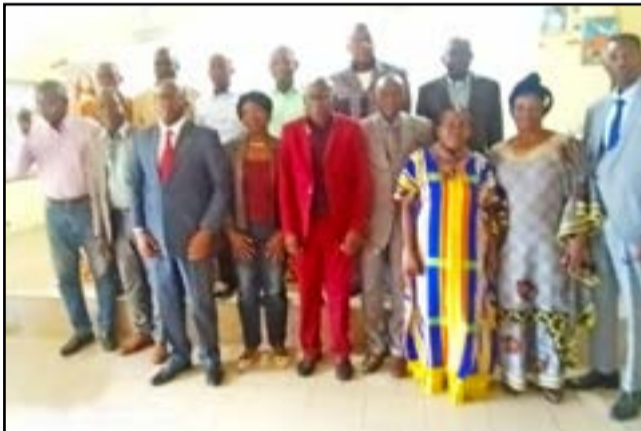
Les participants à la table ronde

plomb qui est un métal toxique et dont l'usage a engendré des conséquences fâcheuses sur l'environnement et la santé humaine à travers le monde. En marge de cette semaine, l'OMS interpelle sur les risques d'exposition au plomb. L'exposition à ce métal peut être à l'origine entre autres de l'anémie, l'hypertension, l'immunotoxicité et la toxicité pour les organes de reproduction. L'OMS a identifié cette substance comme l'un des dix produits chimiques les plus dangereux pour la santé nécessitant une action forte de la part des Etats membres. L'empoisonnement au plomb est entièrement évitable par le