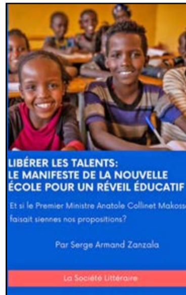
La couverture du livre

Dans ce livre inspirant qui est dédié au Premier ministre congolais, Anatole Collinet Makosso, nous lui adressons un appel passionné pour transformer le système éducatif du pays et libérer le potentiel des jeunes générations. À travers une analyse approfondie et des idées novatrices, nous mettons en lumière les défis actuels du système éducatif congolais et proposons une vision audacieuse pour une Nouvelle École qui donne vie aux talents