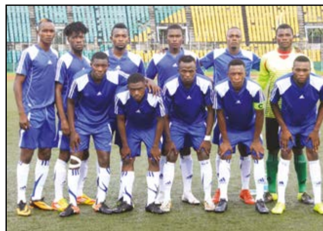
Patronage Sainte-Anne, comme un navire en perdition