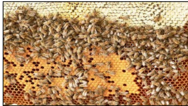
Les abeilles procurent du miel pour le bien-être et la santé pour tous