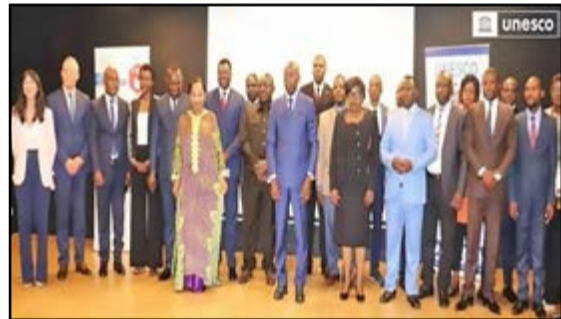
Les officiels et les participants