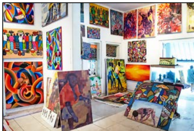
Une exposition des tableaux d'un artiste congolais

La Journée mondiale de l'art a été commémorée le 15 avril dernier à travers le monde, sous le thème: "Vitr art nouveau". Cette journée contribue à renforcer les liens entre les créations artistiques et la société, à promouvoir une meilleure prise de conscience artistique, et à mettre en valeur la contribution des artistes au développement. Cette journée dont la proclamation a eu lieu, lors de la 40e session de la Conférence générale de l'UNESCO en 2019, est également un moment idéal pour célébrer la créativité et apporter de la joie aux autres.