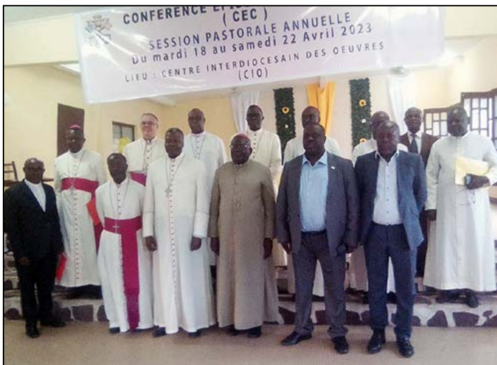
Les Evêques à l'ouverture des travaux (P.8)