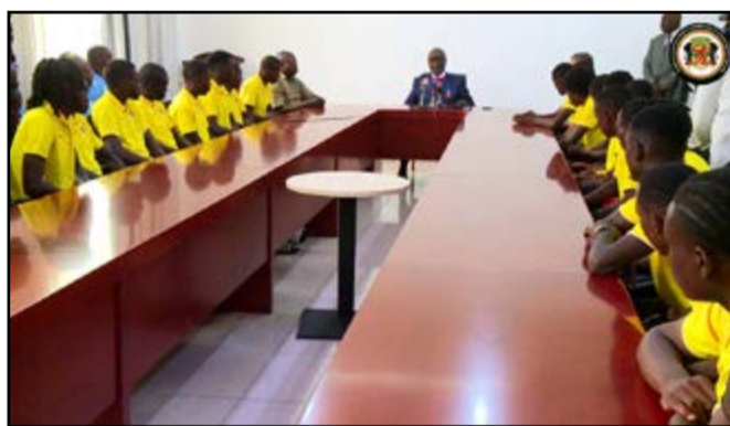
Le ministre s'adressant aux joueurs