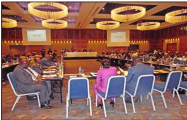
Les deux parties pendant la réunion

Pendant la réunion, les experts ont examiné les points politique, diplomatique et judiciaire. Ils ont mené leur réflexion en vue de contribuer à l'atteinte des objectifs communs: évacuer tant les conclusions issues de la session précédente que le cap juridique, renforcer le cap juridique en concluant de nouveaux instruments dans les secteurs prioritaires et porteurs, identifier ces secteurs prioritaires en vue de diversifier la coopération, mettre en place des plans d'actions sectoriels assortis de projets concrets, etc. Des accords de coopération seront signés dans le domaine de la défense, de la sécurité, de l'immigration et des frontières ainsi que dans le domaine économique, commercial, financière, technique et culturel.