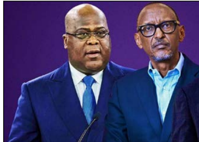
Les Présidents Félix Tshisekedi et Paul Kagame

Nouvelle passe d'armes entre les autorités rwandaises et congolaises par déclarations interposées. En marge de son déplacement au Bénin, le Président rwandais Paul Kagame a justifié la crise actuelle sécuritaire dans l'Est de la RD Congo par l'établissement des frontières à l'époque coloniale, estimant que le Congo actuel avait reçu une partie du Rwanda. Des propos qui ont aussitôt fait réagir Kinshasa.