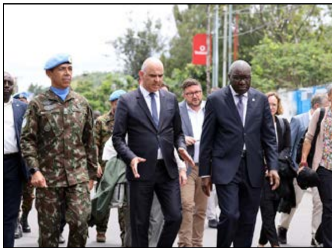
La Suisse préoccupée par les campagnes de désinformation envers la MONUSCO

Le tête-à-tête entre les deux Chefs d'Etat a porté notamment sur les relations bilatérales et la situation sécuritaire dans l'Est du pays. Ils ont évoqué les conditions qui permettraient de favoriser au mieux le progrès économique, la stabilité politique, la sécurité et le bien-être de la population en RD Congo. La Suisse déploie dans la région des Grands Lacs un programme régional et des instruments d'aide humanitaire, de coopération au développe-