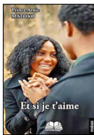
Le recueil des poèmes