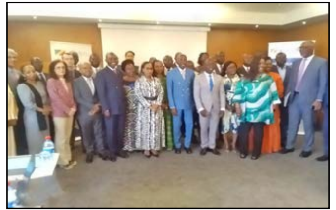
Le ministre et les participants

comprenant des consultations avec les entités gouvernementales, la société civile, le monde universitaire, les organisations non gouvernementales et le secteur privé entre juillet 2022 et janvier 2023. Le budget total dépensé en 2022 pour la mise de ce programme a été d'environ 43 millions de dollars américains, soit un peu plus de 25 milliards de francs CFA. Le plan-cadre de coopération révisé a été pleinement aligné aux priorités nationales exprimées dans le PND 2022-2026, à travers les piliers qui visent à bâtir une forte économie diversifiée et résilient. A noter que l'UNDAF est un