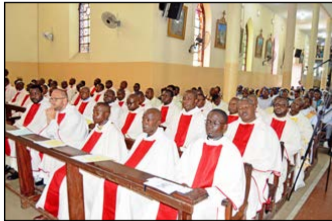
Une vue des prêtres concélébrants

vêque a rappelé: «Pour ne pas se diluer en se laissant tracter par des vents contraires aux fondamentaux de l'Eglise, pour transmettre la Bonne Nouvelle avec tout son éclat, il nous faut nous souvenir que nous sommes et devons être des consacrés