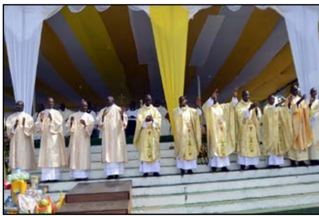
Les nouveaux diacres et prêtres rendant grâce à Dieu

Après l'homélie s'est poursuivie l'exécution des rites des ordinations diaconales et presbytérales.