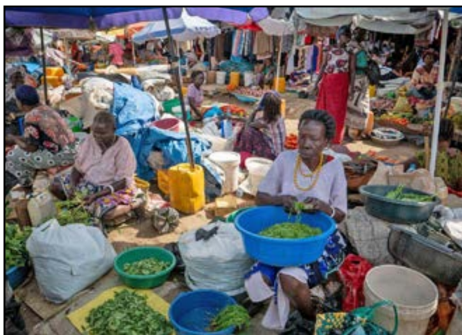
La guerre au Soudan impacte immédiatement le panier de la ménagère en Centrafrique

Les prix des denrées alimentaires et des produits de première nécessité (sucre, huile, farine, carburant, savon, ciment...) continuent à flamber dans le Nord-est de la République centrafricaine. Cette hausse des prix touche particulièrement Birao, dans la préfecture de la Vakaga et Ndélé, dans la préfecture de Bamingui-Bangoran.