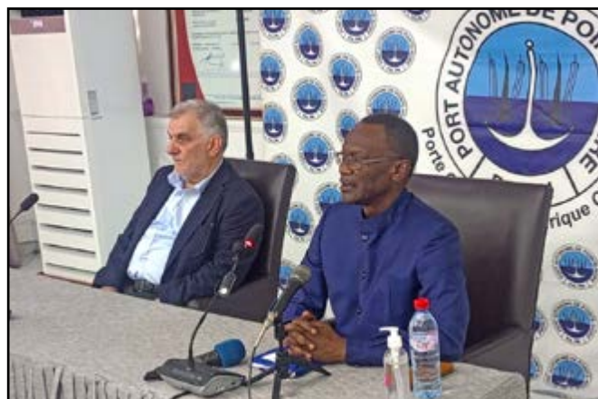
Le DG du Port autonome de Pointe-Noire et celui du groupe Albayrak

Porté sur les fonts baptismaux en 1952, le groupe Albayrak est de plus en plus dans les activités de la gestion portuaire, des