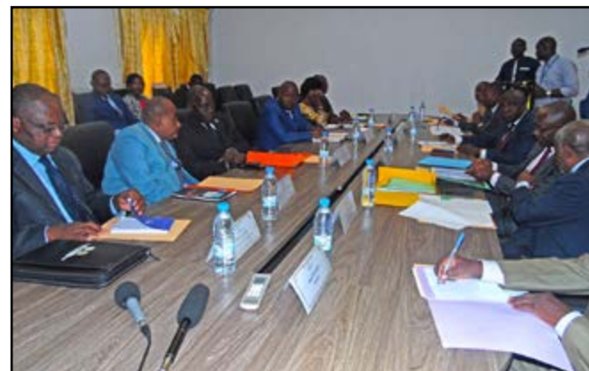
Les deux parties pendant la séance de travail

celles-ci n'ont pas pris part au vote d'adoption des textes. «Pour permettre au Congo de matérialiser juridiquement l'examen et l'adoption des projets, il doit mettre à la HALC, l'ensemble des projets concernés. Cette démarche sera la même pour les pays absents en 2015», a rappelé le président de transition du RINAC. Emmanuel Ollita Ondongo, a affirmé que la HALC est l'institution indiquée pour faire partie du RINAC et est considérée comme membre représentant la République du Congo. Présentant sa structure à ses hôtes, le président a souligné que la HALC a été créée par loi n°3-2019 du 7 février 2019. Elle est une autorité administrative indépendante jouissant de la personnalité morale et de l'autonomie financière. Elle a pour mission la prévention et la lutte contre la corruption, la concussion, la fraude et les infractions assimilées. La HALC a pouvoir de se saisir ou d'être saisi par le président de la République, les présidents du sénat et de l'assemblée nationale sur la base des indices probants; mener les enquêtes ou investigations sur les faits de corruption de concussion, de fraude; obtenir de toute autorité publique ou de toute personne physique ou morale la communication