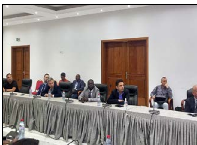
Pendant la séance de travail