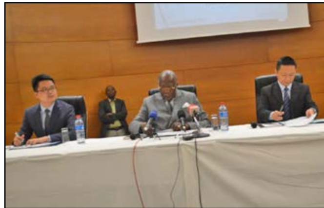
Le ministre d'Etat Pierre Oba et les responsables de la société Luyuan des mines Congo

Pour l'économie congolaise, une lueur d'espoir pourrait venir des gisements de potasse de la réserve de Mboukoumassi (dans la sous-préfecture de Loango). Le projet, piloté par la société chinoise Luyuan des mines Congo qui prévoit d'extraire quelque 2 millions de tonnes de minerai par an en phase I, progresse à pas de géant vers une entrée en exploitation. De quoi faire du Congo un pays référence dans le domaine de l'extraction des sels de potasse.