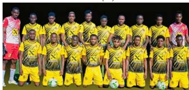
Les Diables-Noirs, vice-champions

De leur côté, avec désormais 50 points, les Diables-Noirs