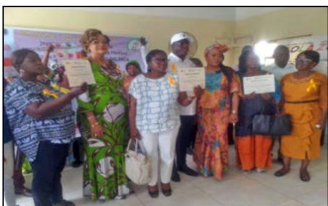
Les soignants, les enseignants et les organisateurs

Les signes d'alerte des cancers de l'enfant sont: la tache brillante dans l'œil; l'augmentation du volume de l'abdomen ou une