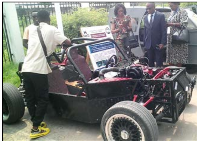
L'une des créations

Les visiteurs ont pu savourer le génie créateur des artisans, surtout le véhicule à deux roues, soit un devant et deux derrière, fabriqué par un jeune; l'électricité tiré à base des petits récipients d'eau; les jus fabriqués à base de divers fruits de la forêt. Tout ceci, à la grande satisfaction des visiteurs et des personnalités présentes à cette