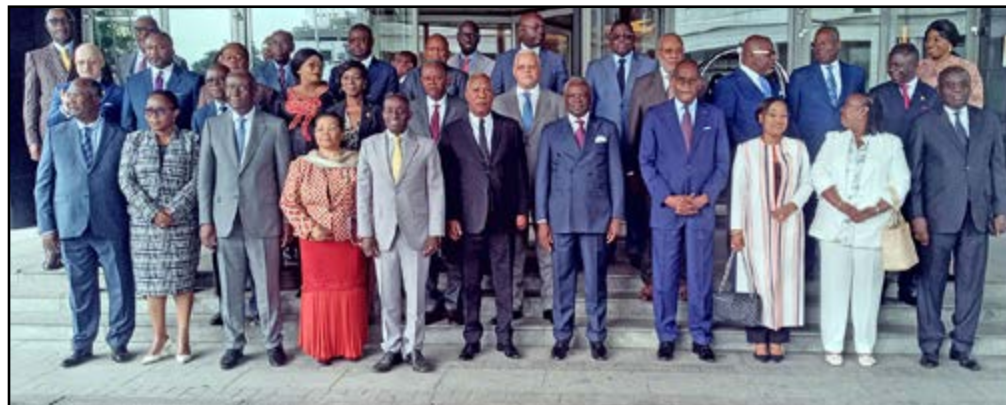
Les membres du Gouvernement et les partenaires techniques

Gouvernement se sont accordés sur la nécessité d'abonder suffisamment le Fonds routier à un niveau permettant d'entretenir convenablement les infrastructures aménagées en vue de les protéger contre les effets de la rigueur du climat pluvieux du pays. «La nécessité de montée en puissance du génie militaire a été soulignée, notamment pour faciliter les in-