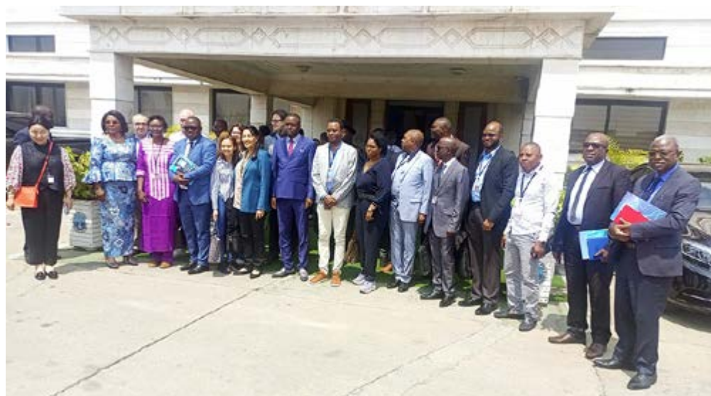
Les responsables du Port et les membres de la délégation de la Banque mondiale

Dans son mot de bienvenue, le directeur adjoint a remercié cette délégation qui, par sa présence, pourrait inciter les investisseurs économiques du Congo.