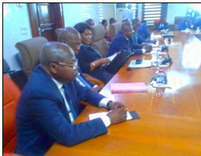
Les cadres du ministère des Finances pendant la rencontre

La délégation du FMI a réaffirmé que la reprise post pandémie s'est ac-