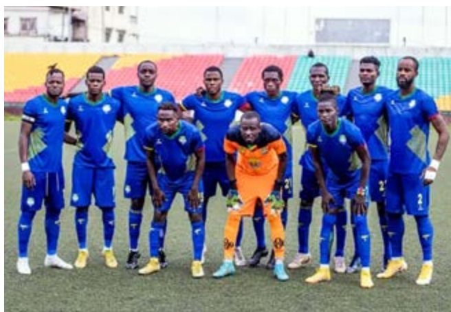
AS Otohô, un sixième titre d'affilée.

Si Etoile du Congo, douze titres (1967, 1978, 1979, 1980, 1983, 1987, 1989, 1992, 1994, 2000, 2001, 2006), Diables-Noirs, sept titres (1961, 1976, 1991, 2004, 2007, 2009, 2011), et CARA, six titres (1969, 1973, 1975, 1982, 1984, 2008), sont les trois clubs les plus titrés, aucun de ces plus vieux clubs