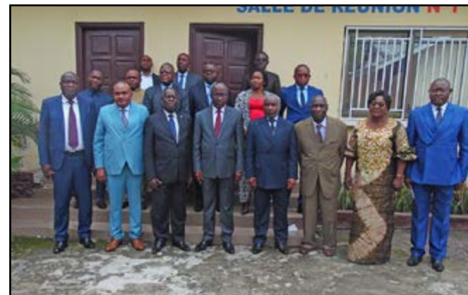
Photo de famille après la réunion