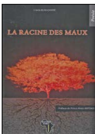
Le recueil de poèmes