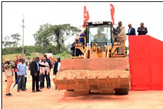
Le lancement des travaux

elle sera bordée des accotements de 2 x 2.0 mètre et comportera un corps de chaussée dimensionné pour supporter un trafic moyen journalier annuel de 1000 véhicules/jour. Le corps de chaussée offrira en couche de fondation, une grave latéritique litho-stabilisée de 22 centimètres d'épaisseur; en couche de base, une grave bitume de 10 à 12 centimètres d'épaisseur, le tout couronné par un revêtement en béton bitumineux de 6 centimètres d'épaisseur, et