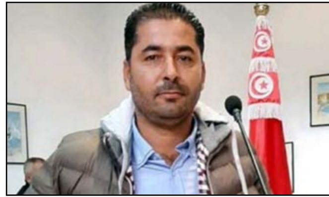
Khalifa Guesmi condamné à cinq ans de prison

Une centaine de journalistes s'est rassemblée pour manifester leur colère suite au jugement rendu par la Cour d'appel de Tunis condamnant à 5 ans de prison le journaliste Khalifa Guesmi. Il est accusé d'avoir divulgué des informations, en violation des dispositions de la loi anti-terroriste et du Code pénal.