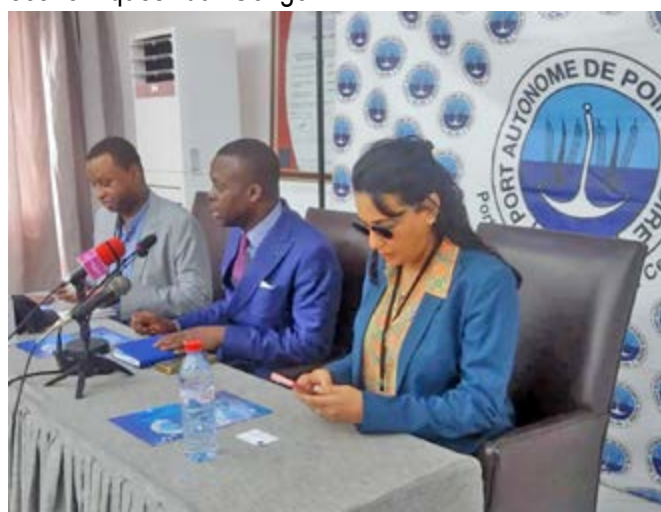
Le directeur adjoint du Port prononçant son mot de bienvenue

La délégation s'est ensuite rendue au Terminal à quai du Port autonome de Pointe-Noire afin de se faire une image réelle de la structure.