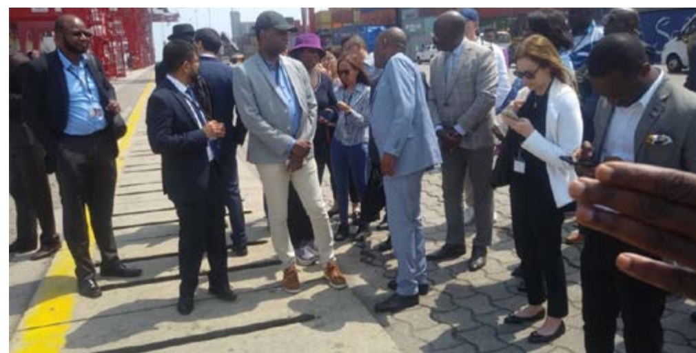
Au terminal à quai du Port