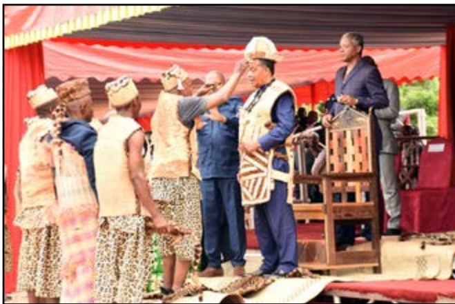
Le Chef de l'Etat recevant les attributs ancestraux

un concassé 0/31,5 pour les accotements revêtus d'un enduit superficiel bicouche. 318 ouvrages hydrauliques de types dalots et 22 ponts seront construits sur l'ensemble du tracé.