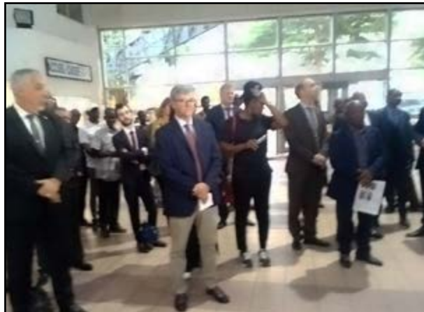
Les ambassadeurs suivant les allocutions à l'ouverture du Mois de l'Europe

La célébration des festivités a été ouverte par deux activités: le vernissage d'une exposition: «L'Europe en BD» retraçant les grandes étapes de la construction européenne depuis 1950; de son élargissement à 27 pays au plan de relance européen. Puis a suivi la projection d'un film relatant la vie des émigrants en Europe, produit par un réalisateur belge et présenté par Jean-Paul Charlier, ambassadeur belge au Congo.