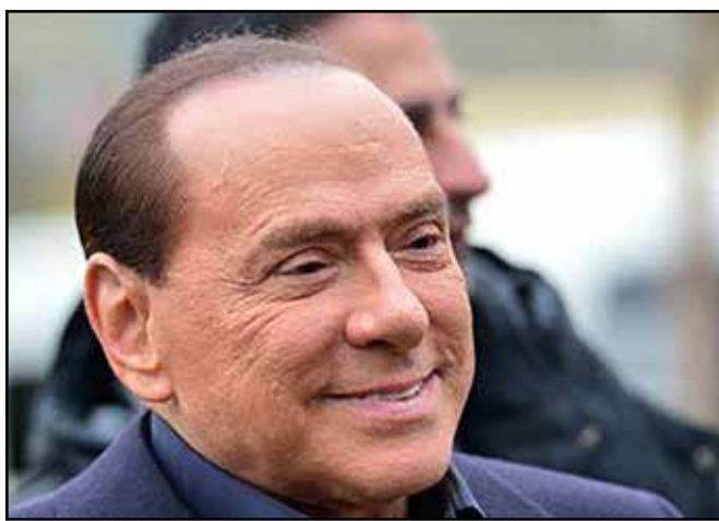
Le milliardaire Silvio Berlusconi s'en est allé

L'ancien Président du Conseil d'Italie, ancien président du club de football Milan AC, Silvio Berlusconi atteint de leucémie est décédé lundi 12 juin 2023 à Milan, à l'âge de 86 ans. Son décès a été salué à travers le monde qui rend hommage à une figure emblématique. Les funérailles de celui que l'Italie avait surnommé «Cavaliere» ont eu lieu en la cathédrale de Milan mercredi 14 juin, décrété jour de deuil national. Jusqu'à sa mort, le riche homme d'affaires était resté sénateur.