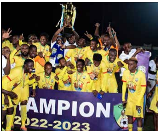
Patronage Sainte-Anne pleure, l'As Otohô (ci-dessus) fête son 6e sacre