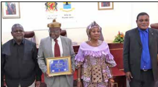
L'ancien écrivain entouré de la présidente du Conseil municipal et maire de Pointe-Noire, du président et du secrétaire général de l'atelier Senghor