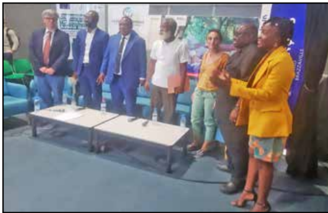
Les panélistes à la fin de la table-ronde