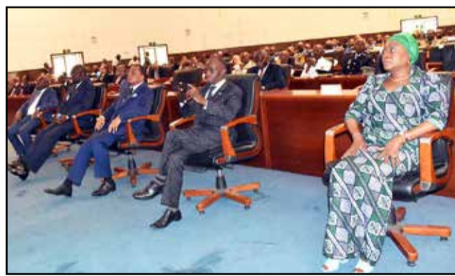
Les ministres et le coordonnateur résident du système des Nations unies au Congo pendant l'exposé. (P.4)