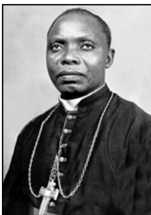
Mgr Théophile Mbemba

La vie de Mgr Mbemba nous donne de voir son amour pour cette Eglise locale, qu'il a aimée et construite à la suite des premiers missionnaires. Bâtisseur infatigable,