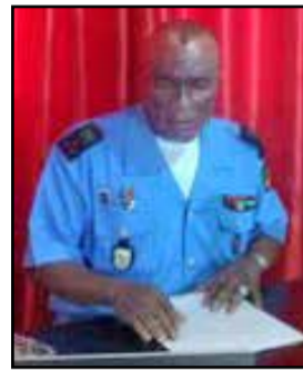
Le colonel de police Serge Pépin Itoua-poto

D'après le colonel Itoua-Poto, 2022 a été une année chargée pour les services de la Sécurité civile qui se sont déployés pour réaliser leurs missions. Au total, 14.408 interventions de différents types ont été réalisées, suite à des accidents de circulation, des accidents domestiques, des incendies, des appels de secours à personne et bien d'autres. Ce bilan en nette augmentation est le reflet entre autres, de la hausse du nombre des secours lors des examens d'Etat et concours. Le rapport précise: "Les questions de secours, au cours de cette période