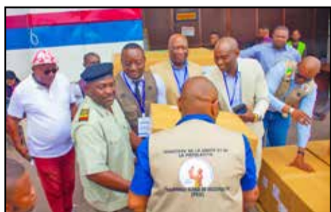
Pendant la remise du vaccin

Dans le cadre du projet de renforcement du système de santé dénommé Kobikisa, le Gouvernement congolais a bénéficié d'une bagatelle de 50.000.000 de dollars américains. Cette somme d'argent a permis l'achat de huit types de vaccins destinés à immuniser les enfants de 0 à 5 ans contre plusieurs pathologies, au titre de l'année 2023. L'initiative vise à accroître l'utilisation et la qualité des services de santé maternelle, reproductive et infantile dans les zones ciblées, notamment parmi les ménages les plus vulnérables.