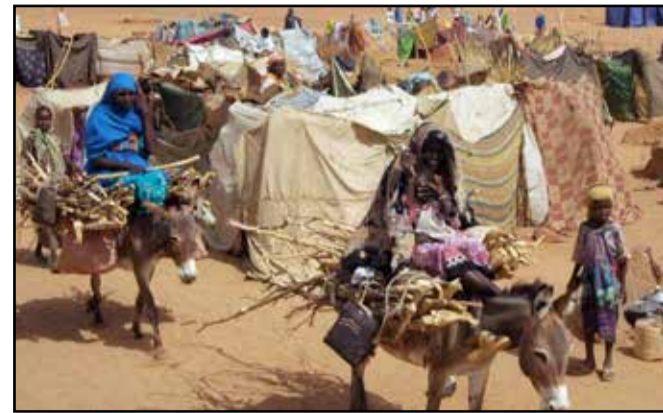
La guerre au Soudan surpeuple les pays voisins

Les cinq millions d'habitants de la ville de Khartoum, ont été réveillés par des tirs d'artillerie et le bruit des combats dans de nombreux quartiers, dimanche 11 juin dernier. Peu après l'expiration d'une trêve de 24h négociée par les médiateurs saoudiens et américains, qui a donné aux habitants un temps de répit pour se ravitailler ou fuir la capitale. Les précédentes trêves avaient été généralement violées dès leur entrée en vigueur.