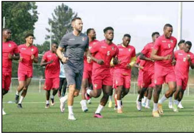
Les Diables-Rouges en séance d'entraînement au Centre technique d'Ignié

Comment l'équipe nationale de football du Congo va-t-elle aborder la dernière ligne droite des éliminatoires de la Coupe d'Afrique des nations? Sur la toile, la question taraude les esprits. Ces derniers jours, le climat au sein des Diables-Rouges semble être affecté par un grand malaise. Tout le monde sait qu'après leur victoire (qui les a replacés à la deuxième place de leur groupe) en déplacement à Dar-es-Salam face au Soudan du Sud lors de la quatrième journée, ils ont exhalé leur mauvaise humeur suite à la décision unilatérale du ministre des Sports de supprimer la prime de présence qui leur est allouée depuis 2013, à l'époque où la gestion de l'équipe nationale avait été confiée à une société dirigée par le Français Gérard Bourgoïn, ancien président de l'AJ Auxerre. D'abord en adressant au patron du sport une lettre de protestation. Ensuite en menaçant de