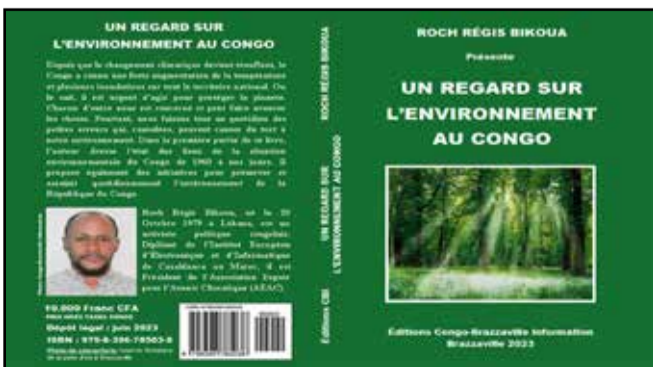
La couverture du livre

l'écrivain et activiste congolais Roch Régis BIKOUA a fait des recherches et organisé des