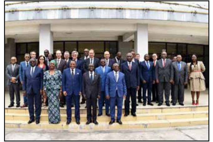
Les membres du gouvernement et les responsables du système des Nations unies à la fin de la cérémonie

Dans l'auditorium du ministère des Affaires étrangères, le ministre des Affaires étrangères a donné la position du Congo sur les opérations de maintien de la paix dans le monde. Il a exhorté la communauté des nations, au-delà des divergences politiques, à unir plus que jamais ses efforts