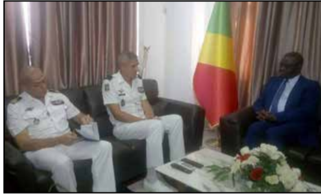
Le ministre Charles Richard Mondjo échangeant avec le général François-Xavier Mabin (au milieu)

Il est revenu sur les propos tenus par le ministre français des Armées, lors de son récent séjour en terre congolaise: «Cette dynamique de coopération est très forte, elle a plusieurs axes. Le premier, c'est l'axe opérationnel que je représente qui consiste à former des unités des FAC, par exemple le Groupement parachutiste commando ou le Groupement naval... Je pense que monsieur le Ministre avait également évoqué la coopération structurelle