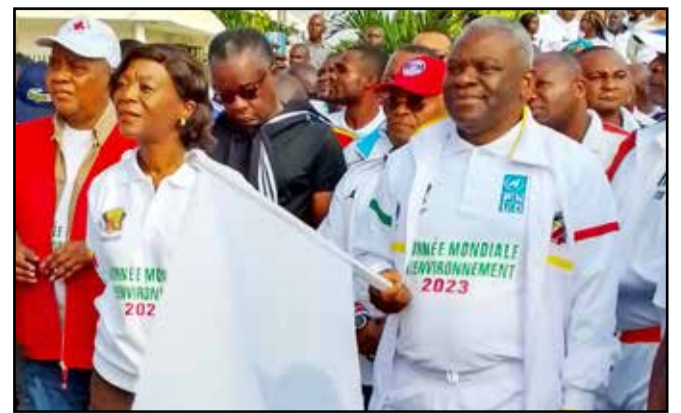
Anatole Collinet Makosso donnant le top de la «Marche verte»

Le Premier ministre a salué les efforts du ministre de l'Environnement et ses collaborateurs pour la mobilisation de la population dans ce combat que mène le Président de la République, premier écologiste du pays. Il a, de même, salué l'accompagnement de tous les partenaires au développement: la Banque mondiale, l'UNESCO, l'UNICEF, et