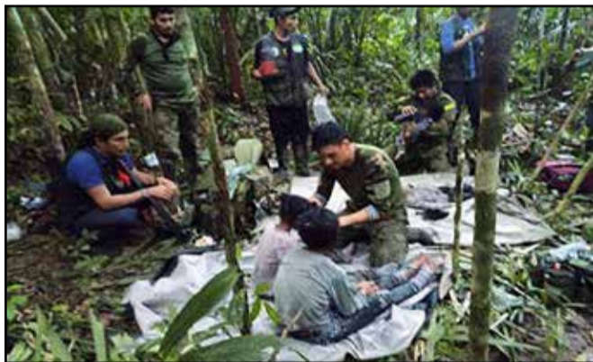
Les quatre enfants rescapés désormais aux soins

Le pilote a été retrouvé mort dans le cockpit. Le chef indigène et la mère de famille ont aussi été retrouvés sans vie. Selon les autorités colombiennes, les enfants avaient pris l'avion avec leur mère pour fuir