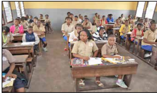
Les candidats au CEPE pendant les épreuves