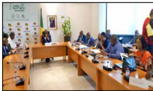
Pendant la réunion

Une réunion du Comité local d'examen du projet (CLEP) de promotion de la croissance par les petites et moyennes entreprises et l'artisanat au Congo s'est tenue le 6 juin 2023 à Brazzaville. Les participants ont passé en revue les objectifs, les conditions de la mise en œuvre efficace du projet y compris les modalités de financement et l'approche de mobilisation des ressources ainsi que les règles et mécanismes de gestion des projets que le PNUD appuie.