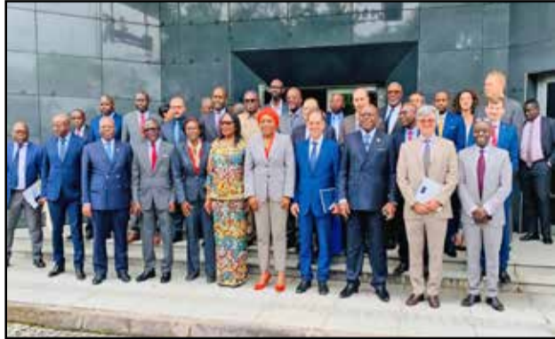
Après la cérémonie de lancement volet européen du PATN

Le ministre des Postes, des télécommunications et de l'économie numérique, Léon Juste Ibombo, a lancé le 8 juin 2023, le volet européen du projet d'accélération de la transformation numérique au Congo (PATN), avec un financement d'environ 27 milliards de FCFA de l'Union européenne et de la Banque européenne d'investissement (BEI). L'objectif général du projet est d'accélérer la transformation numérique au Congo en tant que source d'emplois et vecteur d'une meilleure gouvernance.