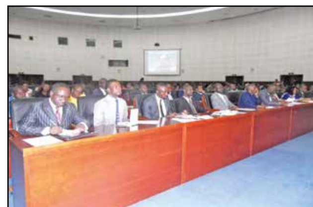
Une vue de l'assistance à l'ouverture de l'atelier

en l'occurrence les différentes agences du système des nations unies, les bailleurs de fonds, le secteur privé national et bien d'autres partenaires au développement pour mobiliser ces financements nécessaires aux engagements pris.