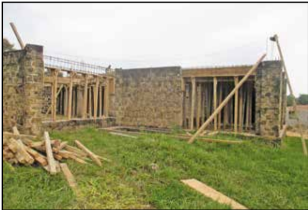
L'église Les Saints-Martyrs de l'Ouganda, en construction