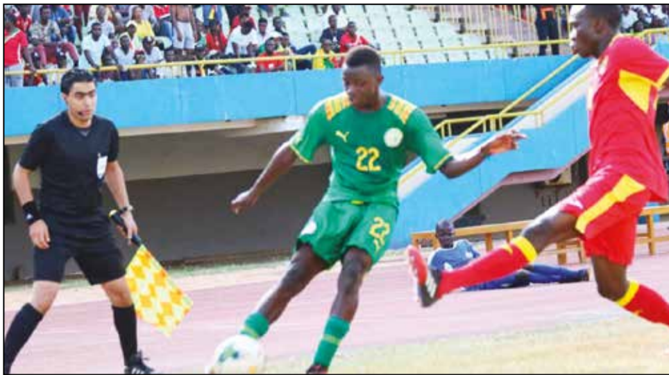
L'expédition dakaraise a tourné au cauchemar pour les Diables-Rouges