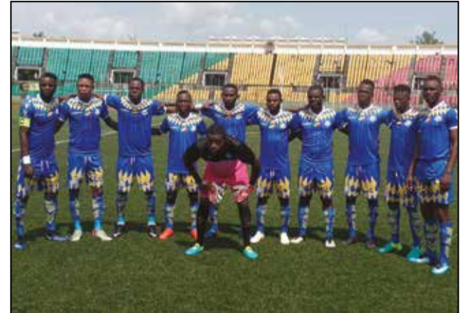
AS Otohô s'empare de la première place

Les journées de championnat passent, mais ne se ressemblent pas. A l'issue de la vingt et unième journée disputée le week-end dernier, AS Otohô revient à la tête de la caravane après l'avoir abandonnée depuis la seizième journée aux Diables-Noirs. Pour s'y hisser, elle a épinglé l'Etoile du Congo dimanche 22 juillet à Massamba-Débat et affiche désormais 47 points à son compte.