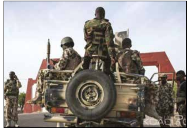
La guerre est toujours rude contre les terroristes de Boko Haram

Le groupe terroriste Boko Haram a encore frappé. Il a tué 18 Tchadiens jeudi dernier. C'était au cours d'une attaque sur le Lac Tchad perpétrée par des hommes identifiés appartenant à ce groupe jihadiste. Ils ont attaqué un village au sud de Daboua, une sous-préfecture du Lac Tchad, non loin du Niger. Outre les personnes tuées, les terroristes ont blessé deux autres et enlevé 10 femmes. La dernière grande attaque de Boko Haram dans cette zone du Tchad remonte à mai 2018 où six personnes, principalement des forces de l'ordre, avaient été tuées dans la localité de Gabalami, non loin de Kinassarom, sur une île du Lac Tchad.