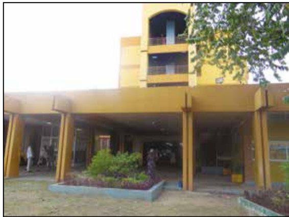
Le CHU, cadre choisi pour réaliser les opérations chirurgicales

Une mission humanitaire israélienne composée de quatre personnes séjournera du 9 au 16 août 2018 à Brazzaville. Elle va réaliser des opérations chirurgicales dans le domaine ophtalmologique, sur cent patients congolais dument sélectionnés au niveau du service ophtalmologique du Centre hospitalier et universitaire de Brazzaville (CHU).