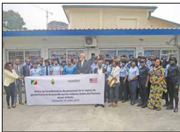
Les participants posant après l'ouverture de l'atelier

Au total 50 gendarmes ont été sensibilisés sur la typologie des violences faites aux femmes et aux enfants, à travers les thématiques suivantes: «Les formes de violence faites aux femmes et aux enfants et leurs conséquences», «Les cas de violence reçus au guichet unique et accompagnement