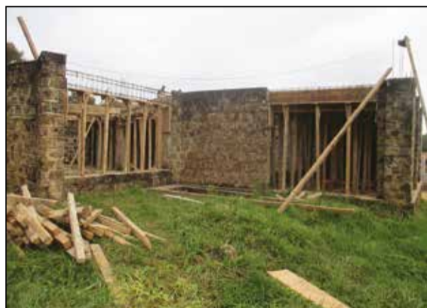
L'église de Mindouli en construction (P.11)