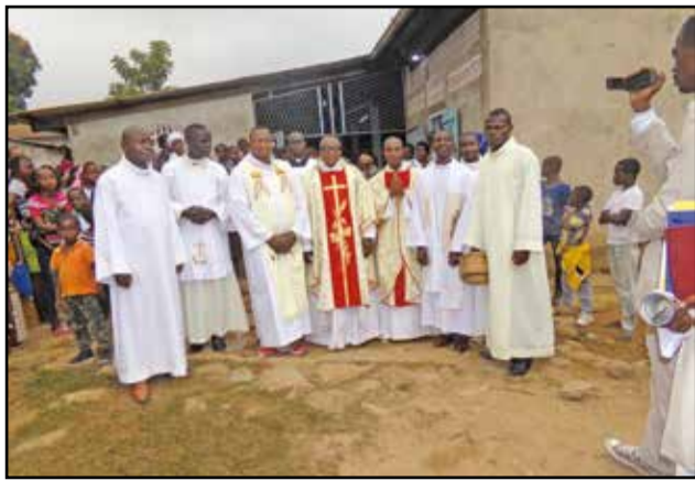
Photo de famille à la fin de la messe