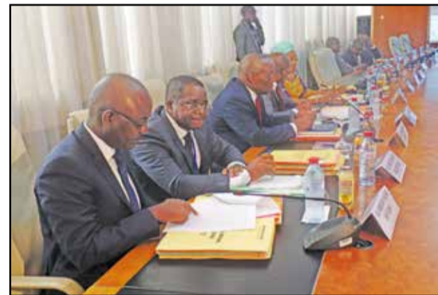
Les administrateurs pendant les travaux

la réforme du nouveau dispositif opérationnel de la banque centrale. Ce dispositif opérationnel comprend l'ensemble des outils qui permettent à la Banque