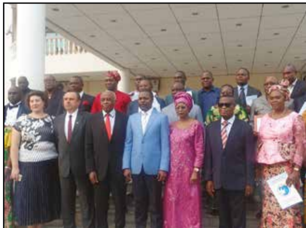
Photo de famille après la cérémonie