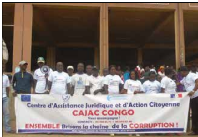
Photo de famille des participants

Dans ce cadre, la Rencontre pour la Paix et les Droits de l'homme a entrepris une mission de terrain dans la Communauté urbaine de Makoua (Département de la Cuvette) et la Commune de Mossendjo (Département du Niari). Dans ces deux localités, l'organisation expérimente le Système d'Intégrité Locale qui est un outil mis en place par Transparency International pour mesurer l'intégrité du système anti-corruption d'une localité. Transparency International a développé le SIL dans le but d'évaluer l'existence et l'efficacité des procédures et mécanismes visant à promouvoir la transparence, la redevabilité et l'intégrité et afin de lutter contre la corruption au niveau local; fournir des recommandations sur les axes de réformes utiles à l'amélioration de la gouvernance locale et élaborer un plan de mesures de suivi pour renforcer l'intégrité locale en collaboration avec les parties prenantes intéressées. Il ne s'agit pas d'indexer une localité comme étant la plus corrompue ou moins corrom-