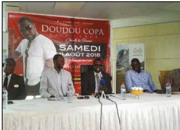
Pendant la conférence de presse