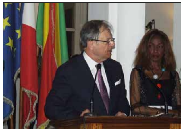
Bertrand Cochery et Madame

Comme à l'accoutumée, la France entière a vibré au rythme des festivités de la Révolution française du 14 juillet 1789. A Brazzaville cette cérémonie a été présidée par Bertrand Cochery, ambassadeur de France au Congo. En présence des membres du gouvernement congolais, des diplomates en poste à Brazzaville, et d'un grand nombre d'invités. L'esprit de fraternité comme gage des solides relations intercommunautaires était au centre des retrouvailles. Car, pour le diplomate français, «sans esprit de fraternité, la France et l'Allemagne n'auraient pas pu se réconcilier après tant de guerres fratricides». C'est donc dans ce même élan de fraternité que la France s'emploie à soutenir le Congo dans la situation de crise économique qu'il traverse.