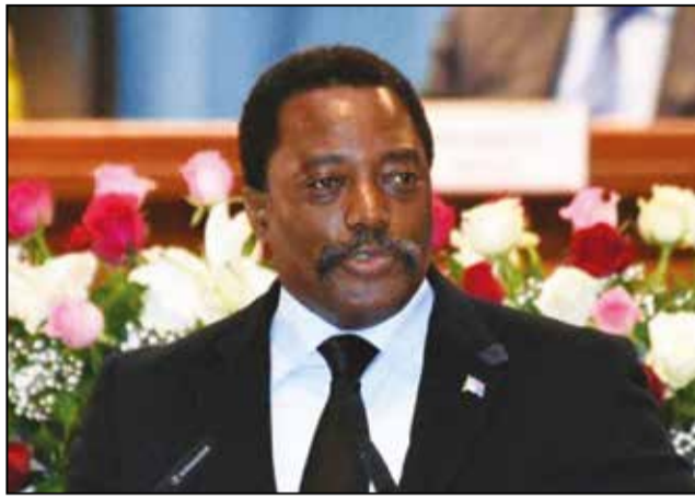
Joseph Kabila Kabange

Le président Joseph Kabila Kabange s'est exprimé jeudi 19 juillet 2018 devant le parlement réuni en congrès au palais du peuple de Kinshasa. Dans son discours sur l'état de la Nation qui a duré plus de deux heures, il a réaffirmé la volonté de son pays d'organiser les élections en décembre prochain. Mais, le président congolais n'a pas fait allusion à son avenir politique. Une fois encore, Joseph Kabila a botté en touche et a laissé durer le suspense.