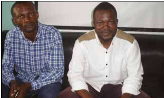
Le président de l'association (à d.) et son collaborateur

où le Président de la République a fait confiance à leur cadre pour participer aux négociations avec le Fonds monétaire international (FMI) que les adversaires du ministre redoublent d'agressivité, de haine et de mensonge grossier dans la presse locale et les réseaux sociaux. La jeunesse de Mfouati s'insurge contre ces méthodes d'un autre âge et apporte tout son soutien au ministre, directeur de