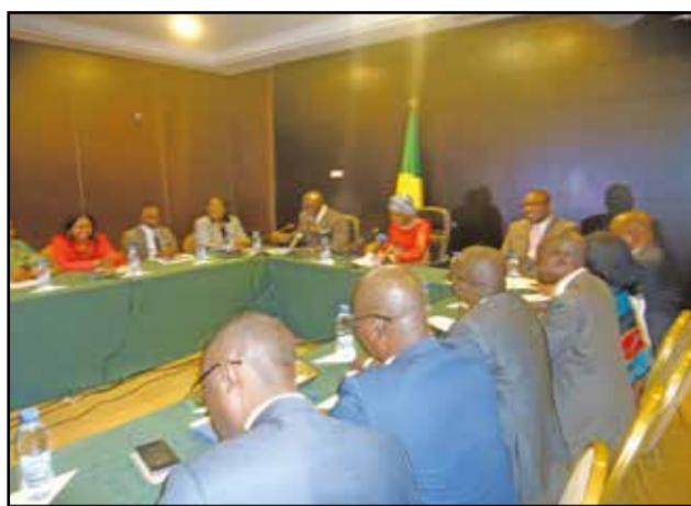
Une vue de la rencontre

«Le Congo vient d'adopter son Plan national de développe-