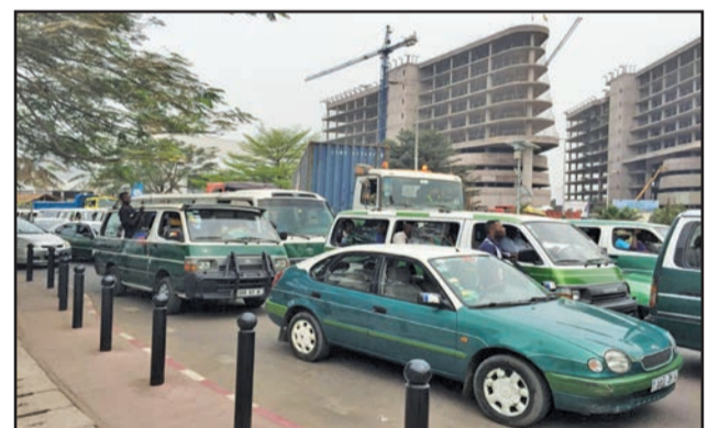
Les transporteurs sont de plus en plus dépités par les taxes de roulage...