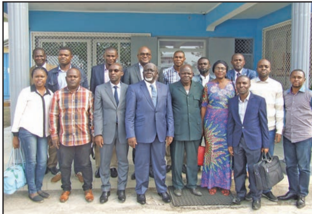
Les participants et le vice-recteur

Dans le souci d'arrimer l'Université Marien Ngouabi aux autres universités membres dispensant des enseignements à distance, l'Agence universitaire de la francophonie (AUF) a tenu du 11 au 13 juillet dernier une formation à l'endroit des enseignants chercheurs de l'unique université publique du Congo, sur les fondamentaux de la scénarisation pédagogique. 25 enseignants y ont pris part.