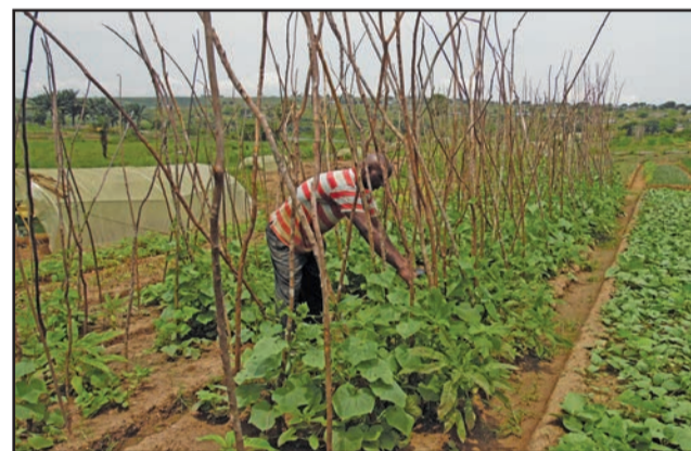
Vue des sillons de légumes

des autres pays tels que le Sénégal et la Côte d'Ivoire, le ministre de l'Agriculture Henri Djombo a remis en programme les agences qui ont pour mission d'appuyer les producteurs dans le domaine de l'agriculture, de l'élevage et de la pêche. «Les techniciens doivent accompagner les producteurs dans la transformation et la production. Le travail se fera dans les départements avec une fixation des agents qui seront recrutés. Les agences vont servir à l'appui technique et financier aux producteurs», a-t-il dit. Benjamin Christian Odjola veut l'apport de tous pour la création de ces agences. «Nous devons tenir compte de notre culture, notre façon de penser de l'agriculture, de l'élevage et de la pêche. Il ne faut pas attendre tout de l'Etat. Les pouvoirs publics doivent penser à la protection sociale des métiers de l'agriculture. Les assurances doivent aussi participer au développement de ce secteur en assurant le risque. Le secteur de l'agriculture est un secteur qui crée d'emploi. Il doit falloir que nous pensions