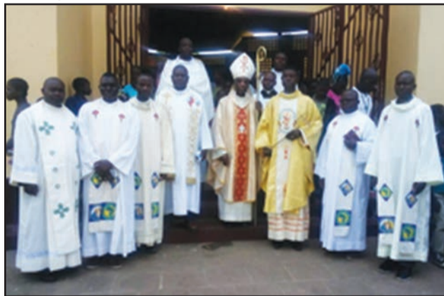
L'évêque de Kinkala et le nouveau curé posant avec les concélébrants

attention particulière comme celle que l'on porte à un enfant à peine né. Jeune de cinquante ans, la communauté chrétienne