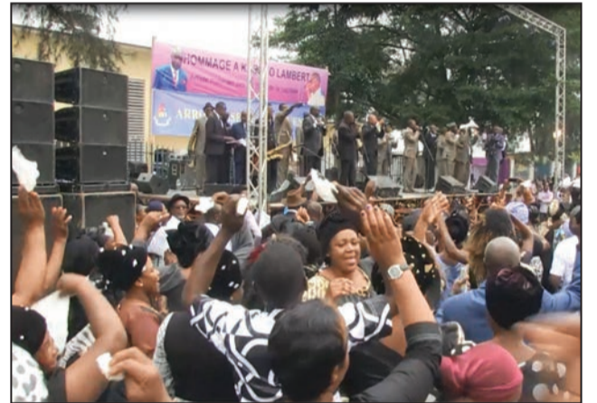
L'orchestre Bantous et une foule immense a rendu hommage au compositeur de la célèbre chanson «Osala nga nini»