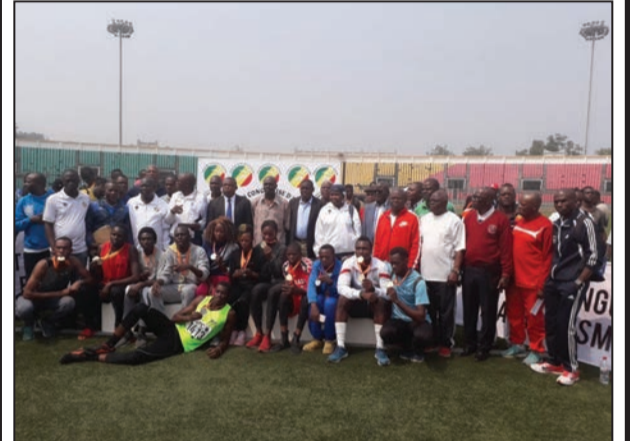
Athlètes et dirigeants à la fin de la compétition