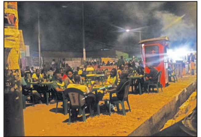
Des Brazzavillois buvant dans un débit de boissons

La ville-capitale du Congo, Brazzaville, la verte, est de plus en plus envahie par des débits de boissons, dits «caves», des «nganda» et autres lieux de distraction où coulent à flot des boissons alcoolisées servies sans se soucier de l'âge du consommateur ou de son état de santé. On y boit de façon déraisonnable; pour peu de frais une flopée de flacons d'alcool est garantie.