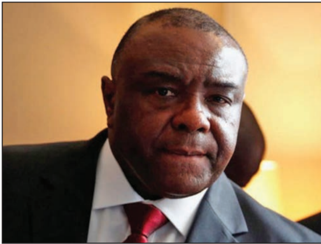
Jean-Pierre Bemba Gombo

C'est sa première sortie médiatique depuis son acquittement dans les exactions de ses troupes en Centrafrique au début de la décennie 2000. L'ancien vice-président congolais Jean-Pierre Bemba Gombo avait convié mardi 25 juillet dernier à Bruxelles, plusieurs médias. C'était au lendemain de l'annonce de son retour à Kinshasa, prévu pour le 1er août. Le président du Mouvement pour la libération du Congo (MLC), Jean-Pierre Bemba, déposera sa candidature pour la présidentielle du 23 décembre prochain. Mais il plaide pour une candidature unique de l'opposition afin de battre le candidat de l'actuelle majorité présidentielle, jusqu'ici pas encore révélé, quoique que des suspicions pèsent sur Joseph Kabila qui garde le suspense sur son retrait ou pas de la scène politique. Selon la constitution de la République démocratique du Congo, M. Kabila ne peut plus se positionner pour l'élection présidentielle. Ses deux mandats constitutionnels ayant expiré depuis décembre 2016