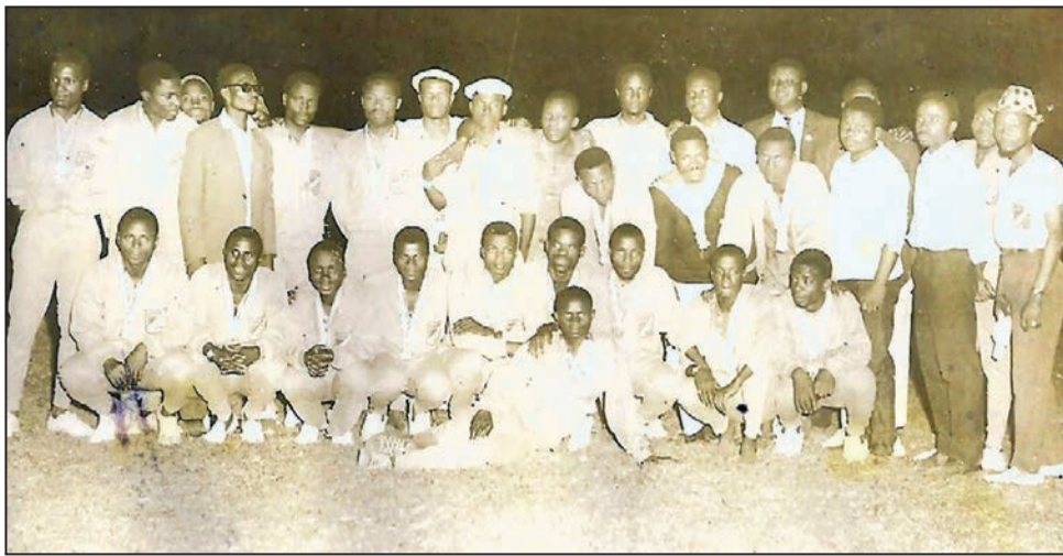
Les footballeurs congolais médaillés d'or des premiers Jeux africains de 1965

Le Congo est indépendant depuis cinq ans quand il organise les 1ers Jeux africains. Malgré le double barrage dressé par les feux Avery Brundage (alors président du CIO) et le marquis d'Exeter (président de la Fédération internationale d'athlétisme), ils sont finalement reconnus et parrainés comme Jeux régionaux par le Comité international olympique, à l'instar des Jeux panaméricains, asiatiques et européens. C'est à Brazzaville qu'ils se déroulent. Quelque 2500 sportifs, toutes disciplines confondues, sont en lice au Stade Omnisports qui