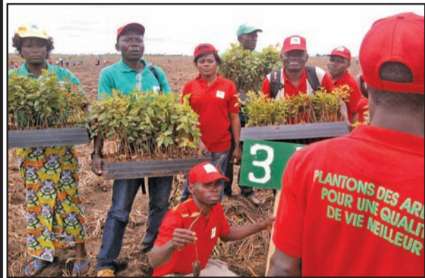
Les membres de l'ONG pendant le planting

climatique; Education environnementale; Vulgarisation des législations; Foresterie et Agriculture climato-intelligente.