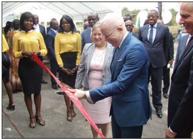
La coupure du ruban symbolique par le ministre de la Communication aux côtés de Madame Amanda Bennett, directrice de VOA

et en wolof. Le lingala et le kikongo étant parlés dans les deux Congo et au nord de l'Angola nécessitent d'être