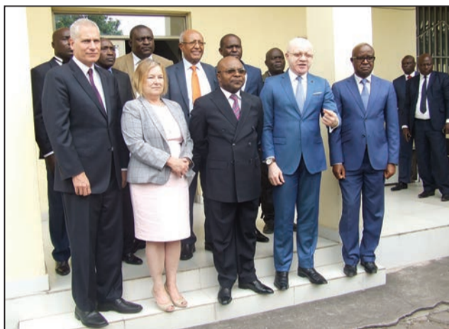
La photo de famille après la signature de l'accord

inscrits, au même titre que les langues précitées, dans les programmes de la VOA pour intéresser des millions