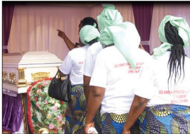
Les Amis Bantous se recueillent devant le cercueil du disparu