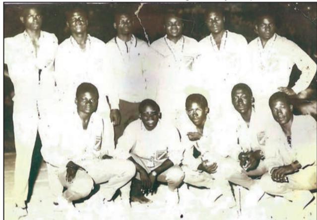
Les volleyeurs congolais médaillés de Bronze en 1965

portera le nom de "Stade de la Révolution" le lendemain des Jeux. Un stade rebaptisé depuis "Stade Président Alphonse Massamba-Débat", édifié là où fut, jadis, la luxuriante forêt de la Patte d'Oie dévorée impitoyablement par des bulldozers de la Société africaine de construction (SAC). Toute la crème sportive africaine est là. Pour la première fois, en effet, Francophones, Anglophones et Arabophones (aucun pays lusophone n'était indépendant) se côtoient sur la piste, la route,