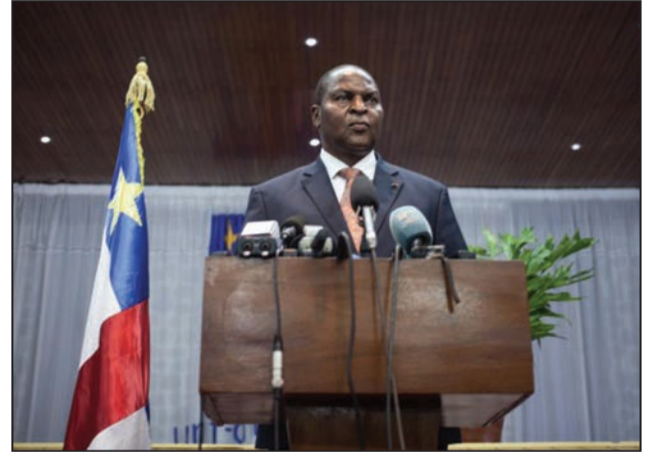
Archange Touadéra prononçant son allocution à l'ouverture du forum

Sous l'égide du président Faustin Archange Touadéra, il s'est ouvert mercredi 25 juillet dernier à Bangui un forum intitulé «gouvernement ouvert». Un forum de trois jours qui marque l'aboutissement d'une première phase de formation de cadres centrafricains pilotée par l'Ecole nationale d'administration (ENA) de Paris, dans un partenariat avec l'Ecole nationale d'administration et de magistrature (ENAM) de Bangui. Quatre-vingt (80) cadres ont déjà suivi une formation sur mesure de six mois. En tout, 200 cadres doivent ainsi être formés et faire émerger des projets pilotes pour la restructuration de l'administration centrafricaine. Une trentaine de projets doivent être débattus dans les tout prochains jours.