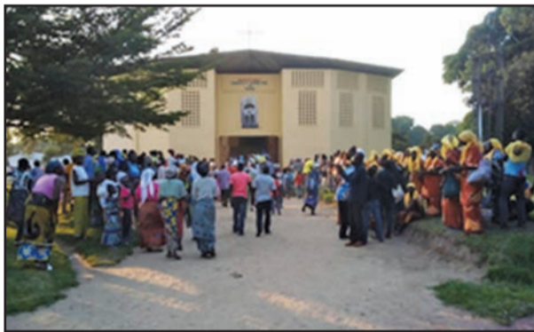
Le peuple de Dieu sur le parvis de l'église (P.10)