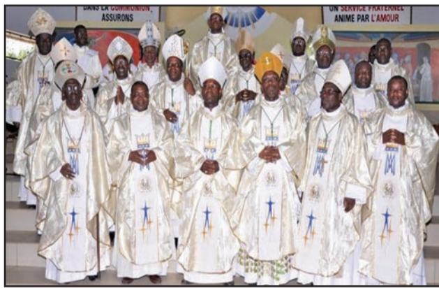
Les évêques ivoiriens

responsabilité «de réaffirmer la position constante de l'Église catholique afin de prévenir toutes dispositions de lois qui pourraient s'apparenter à la culture de la mort contre celle de la vie, au regard de la loi naturelle et de la foi chrétienne». Ils trouvent leurs préoccupations justifiées car «le domaine de la génétique, de la médecine et des biotechnologies appliquées à l'homme, sont des secteurs de grande importance pour l'avenir de l'humanité, mais au sein desquels se vérifient aussi d'évidents abus inacceptables». Les évêques Ivoiriens dénoncent également «les tentatives de donateurs puissants et fortunés, qui obligent les pays en développement à accepter des pratiques sécularisées en matière de sexualité humaine, de vie, de famille et même d'anthropologie fondamentale, comme condition de la réception de l'aide au développement», ont affirmé les évêques.