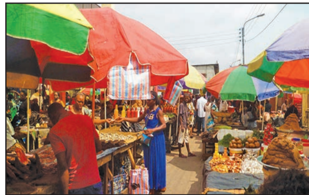
Au marché, la ménagère fait difficilement ses achats à cause de la crise

La conjoncture économique difficile que traverse actuellement le Congo touche tous les secteurs d'activité dans la vie sociale. Pour s'en convaincre, il suffit de faire un tour au marché ou de jeter un coup d'œil rapide dans le panier de la ménagère.