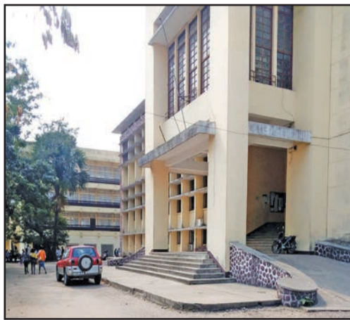
Un bâtiment de la FLASH

appel pour ceux-là qui pensent qu'il est temps pour eux d'aller déposer les dossiers de la campagne de l'année civile 2017-2018. Les agents seront là, pour recevoir vos dossiers. Ce matin, le chef de scolarité m'a signalé que les cursus et les attestations d'inscriptions sont déjà disponibles. Mais pour les étudiants n'ayant pas obtenu leurs cursus, ils doivent attendre que le chef de la Scolarité centrale les signe le plus tôt possible. Pour que, bien sûr, tous ceux qui ont pris leurs inscriptions les aient en leur possession. Nous avons également discuté avec la direction rectorale pour qu'on s'accorde de la nouvelle marche