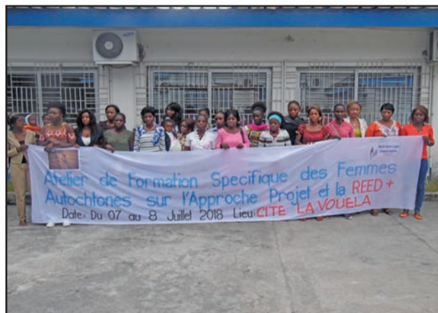
Les participantes à l'issue de leur formation