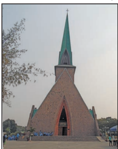
La Basilique Sainte-Anne