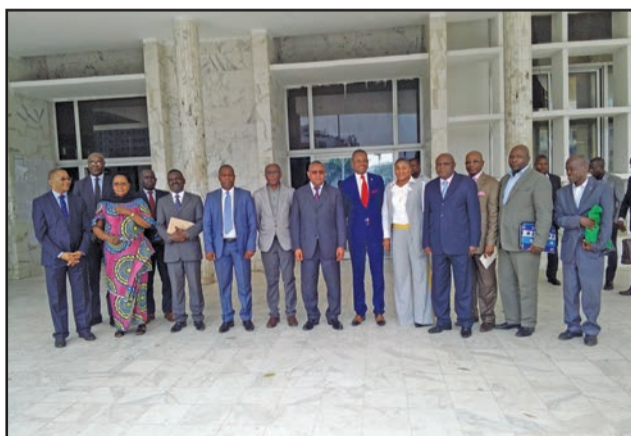
Photo de famille des officiels