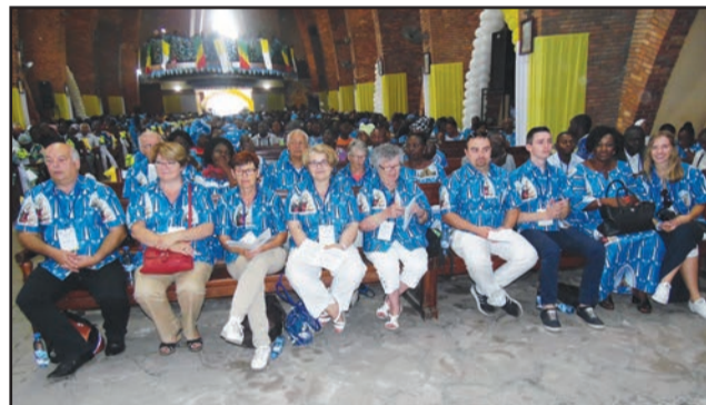
Les pèlerins de Rennes, dont le maire et son épouse (1 er et 2 ème à g.)