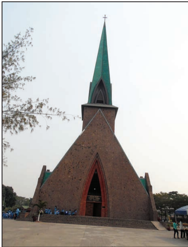
La façade principale de la Basilique Sainte-Anne (P.12)