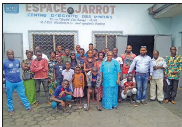
Les apprenants et les encadreurs posant pour la postérité

doit avoir une certaine maturité des actes qu'elle pose et de manière responsable pour que l'enfant qui naît ne puisse pas subir des préjudices dans l'avenir. Pendant l'allaitement, la mère doit éviter les blessures intérieures à l'enfant pour que celui-ci n'est pas un esprit de révolte et de vengeance, tout en respectant ses droits. L'enfant, une fois grandi, doit à un certain âge donné, créer des loisirs sains dans son propre milieu pour se dévouer et d'éviter de tomber dans des travers de grossesses non désirées. Le phénomène des enfants de la rue ditons-le, n'est que la conséquence d'une mauvaise gestion familiale, car la rue n'a jamais enfanter, ce sont des enfants abandonnés par les parents qui sortent dans la rue. Cela se passe par des actes