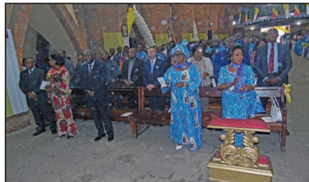
Mme Antoinette Sassou Nguesso, marraine de la Basilique

qui commémorait par la même occasion ses 75 bougies de naissance, à rehaussé de sa présence l'éclat de cette fête du jubilé d'Albâtre. Il y avait aussi, le ministre de la Culture