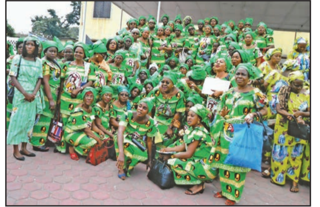
La Fraternité jubilaire posant après la messe