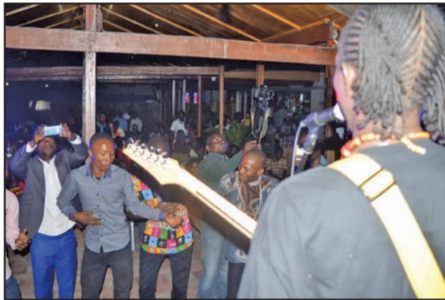
La parfaite communion entre le chanteur et le public

A signaler qu'en entracte du concert, les spectateurs ont eu droit à la prestation de deux jeunes comédiens congolais: Maître Google et Le Phi-