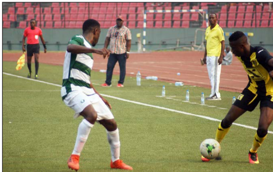
C'était entre Diables-Noirs et AC Léopards à Brazzaville