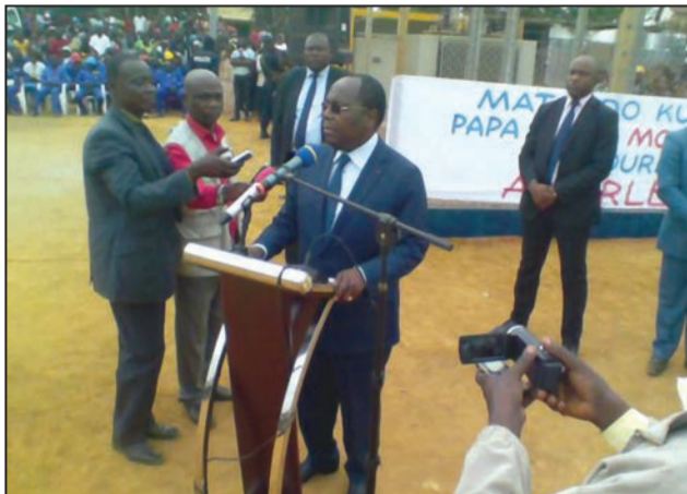
Le Premier ministre prononçant son allocution

Le Ministre a indiqué que Mayéyé se trouve sur la liste d'autres localités à pourvoir en énergie pérenne, après Mabombo et bientôt Abala, dans les Plateaux. Le ministre a annoncé que le Gouvernement était obligé d'assumer sa responsabilité en procédant par petites tranches, en raison de la crise financière que connaît le Congo, une crise qui commande de saisir les opportunités à notre portée.