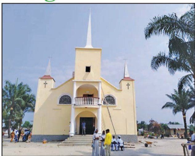
L'église Sainte-Faustine de la Divine Miséricorde de Makotimpoko