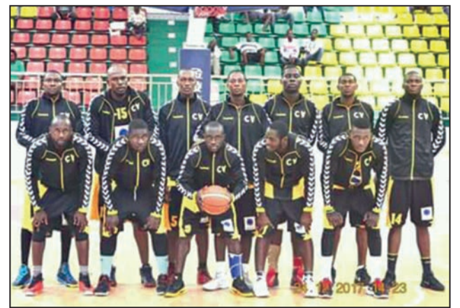
La formation de Diabes-Noirs sacrée pour la quatrième fois

Sur l'ensemble du match, les "Jaune et noir" n'ont pas forcé leur talent pour dominer leur adversaire sous les panneaux. Ils ont atteint la fin du match en tête sur la marque de 84-55. Du coup, ils ont pris leur revanche sur les Aiglons qui les avaient surpris en match de poules. Ce titre de champions de Brazzaville est seulement le quatrième (2012, 2013, 2017, 2018) des diabes du basket en bientôt cinquante ans de vie. Car, la section basket-ball des Diabes-Noirs est née en 1969. Au commencement est BUC (Basket Université Club) du Docteur Hérauld. En 1969, justement, cette formation est dissoute, pour laisser la place à une autre équipe qui s'installe dans le vieil hangar du premier aéroport de Brazzaville