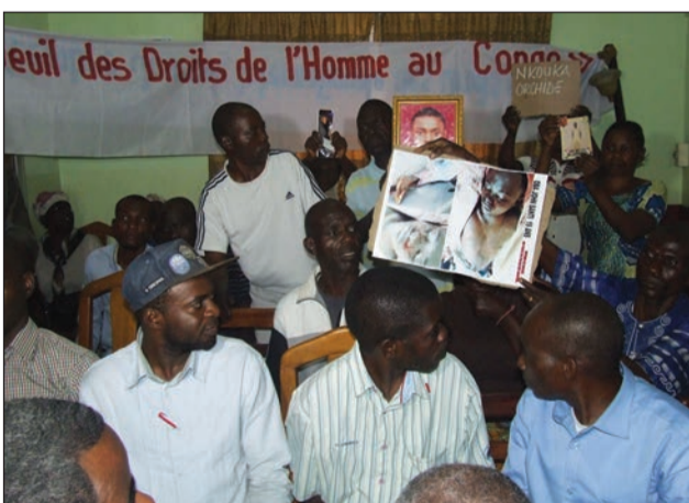
Les parents brandissant les photos des victimes

Un autre parent a fait savoir qu'après avoir constaté le nom de son enfant dans la main courante, pour s'assurer de sa présence dans cette cellule, il a pris le soin de l'appeler. Répondant, l'enfant se plaignait de faim et de soif. «J'ai tout de suite sollicité du policier si je pouvais