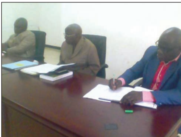
Le Maire, au centre

Au cours de cet échange, le Maire a rappelé les différents textes administratifs pris par le Conseil municipal, qui codifient les activités sur le développement de la commune. Ainsi le recensement à vocation d'état civil est une instruction du ministère de la Décentralisation et vise la tranche d'âge de 2 mois à 18 ans, dans le souci de s'assurer que les déclarations de naissance sont effectives pour cette catégorie de la population. Le recensement administratif