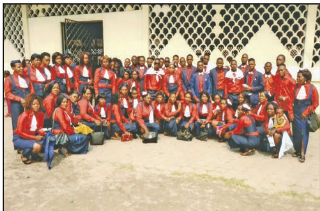
La chorale Saint Curé d'Ars célébrant son 5 e anniversaire