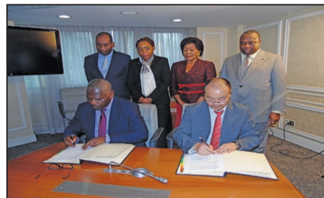
Les quatre ministres assistant à la signature de l'accord-cadre

La partie congolaise a informé COIDIC de l'existence d'un projet similaire en étude avec la société Khalil, société Emiratite, pour mieux exprimer ses besoins en la matière et comprendre le mécanisme en approvisionnement en gaz et de production en électricité. Elle a rencontré les représentants des ministères des Hydrocarbures et de l'Energie et de l'hydraulique qui leur ont donné les informations nécessaires. Au terme de leurs échanges, COIDIC a proposé de transmettre une note à la partie congolaise présentant sa vision sur le développement de la centrale à gaz dans laquelle se dégage deux options, à savoir: la collaboration de COIDIC avec le Gouvernement congolais pour la construction