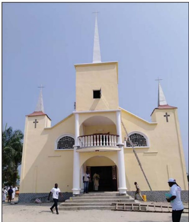
La façade principale de l'église (P.9)

Un Dimanche en paroisse Sainte-Faustine de la Divine Miséricorde de Makotimpoko (Diocèse de Gamboma)