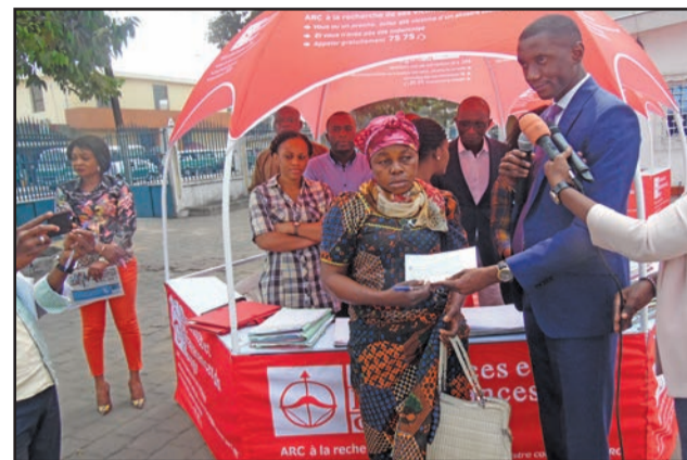
Une victime recevant son indemnisation