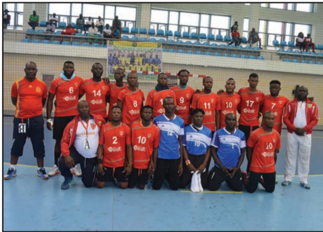
Premier titre pour Pétrosport Orange

Il est certain qu'avant la finale, les nerfs étaient tendus entre le camp de DGSP et les officiels de la Fédération congolaise de handball (FECOHAND). C'est devant les yeux des spectateurs que tout a commencé à dégénérer. On peut dire que c'est cette guerre psychologique qui a mal tourné et il est difficile de situer les responsabilités, les deux camps se renvoyant la balle. Après beaucoup de discussions entre les responsables de la FECOHAND et les encadreurs de DGSP, ces derniers ont maintenu leur décision de ne pas jouer, à la grande