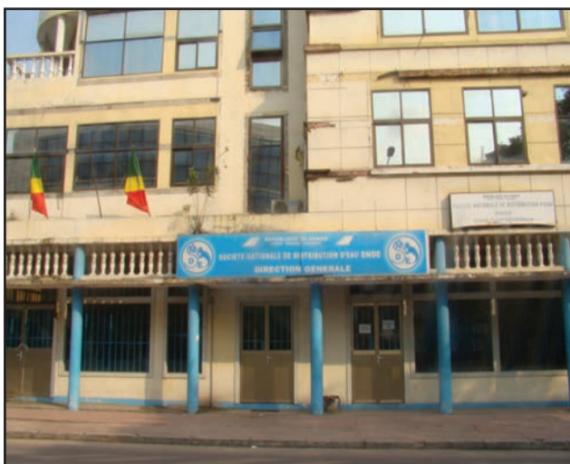
Le siège de l'ex-SNDE

Un imbroglie, c'est le moins que l'on puisse dire de la situation qui prévaut actuellement à l'ex-Société nationale de distribution d'eau (SNDE). Une entreprise publique créée en 1967 et dissoute (comme sa sœur jumelle la Société nationale d'électricité) à cause des contre-performances notoires au niveau managérial, de la production, du transport, de la commercialisation et de la distribution. Ainsi, lors du conseil des ministres du 2 février 2018, le Gouvernement congolais avait décidé de la dissolution de la SNDE qui accusait un déficit de 30 milliards de F. CFA au profit d'une société anonyme de droit OHADA (Organisation pour l'harmonisation du droit des affaires en Afrique). Une décision entérinée par les deux chambres du Parlement. Depuis, le processus de création de la nouvelle société a été enclenché. Mais les choses ne se déroulent pas sans anicroche.