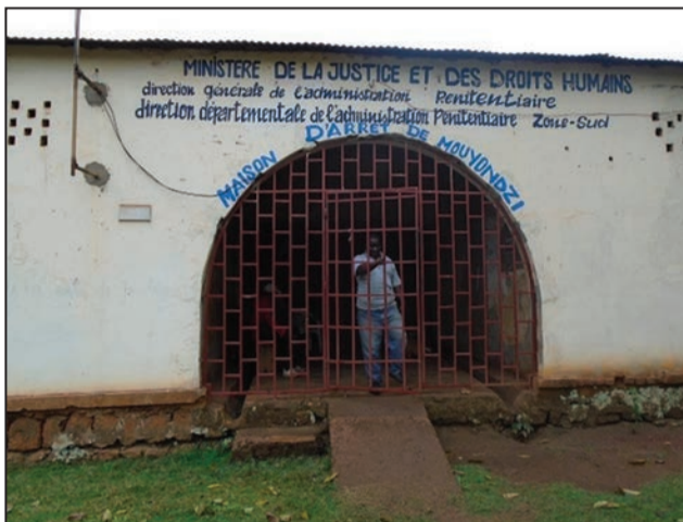
Les maisons d'arrêt de Mouyondzi...

vaises conditions de détention, certains prévenus sont transférés à la maison d'arrêt et de correction de Dolisie. Tout récemment, 16 détenus ont réussi à prendre leurs jambes à leur cou pour disparaître dans les méandres de Madingou. Quelques-uns ont été rattrapés. Cette évasion d'un genre insolite n'est pas sans rappeler la première qui s'est produite à la maison d'arrêt de Madingou. Elles sont légion à cause de la vétusté des murs et des bâtiments qui ne garantissent aucune sécurité. Comme le malheur ne vient jamais seul, le bâtiment à étages qui abritait les bureaux du président du Tribunal de Grande Instance de Madingou, du procureur, du greffier en chef et des autres juges a été consumé par le feu qui a réduit en cendres les archives, les dossiers, l'outil informatique et tous les accessoires des bureaux de l'instance judiciaire. Du bâtiment, il ne reste que la salle des audiences située au rez-de-chaussée. Le bâtiment n'est toujours pas réhabilité