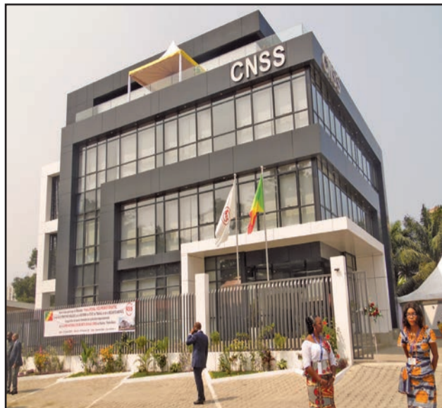
Le nouvel immeuble

convient de le reconnaître, que le chef de l'Etat, Son Excellence Denis Sassou-Nguesso, en a fait l'un de ses engagements majeurs, celui de restructurer la pro-