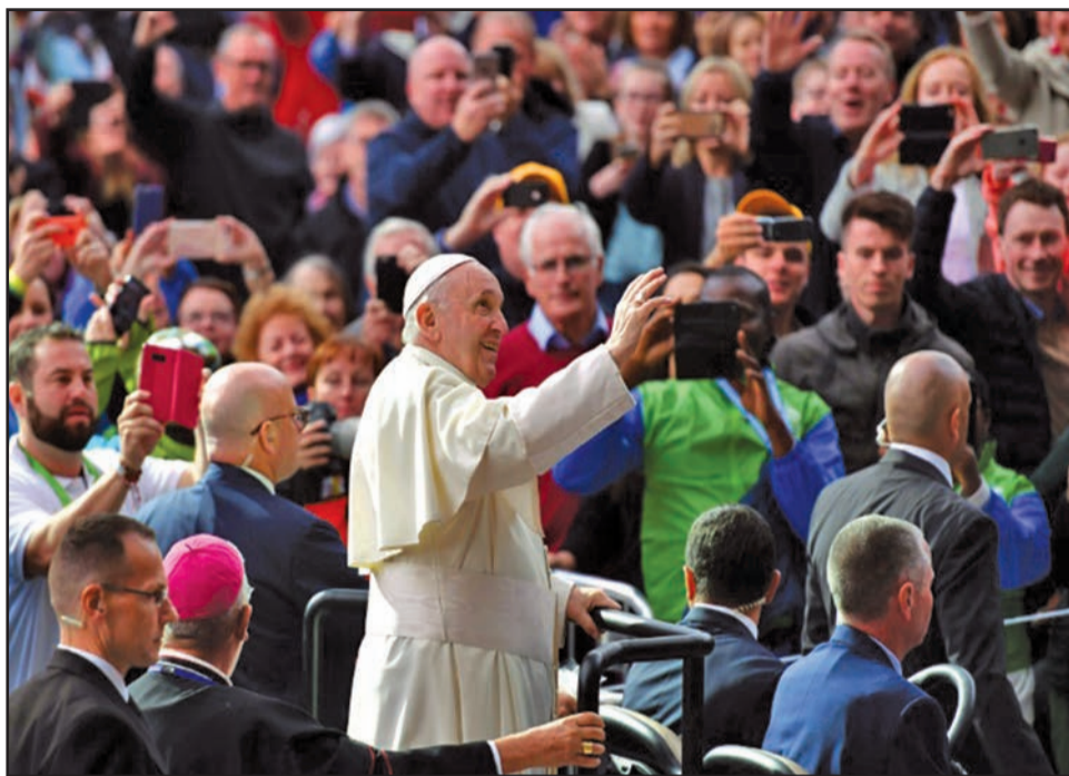
Le Pape François prenant un bain de foule à bord de sa Papamobile, à Dublin

Débutée mardi 21 août à Dublin, en Irlande, par une messe d'ouverture célébrée dans les 26 diocèses d'Irlande avec des familles venues du monde entier, la 9 e Rencontre mondiale des familles placée sous le thème: «L'Évangile de la famille, joie pour le monde», s'est achevée par une messe célébrée par le pape François, dimanche 26 août 2018. Une messe marquée dès le début par une prière pour les abus commis dans l'Église. «Je veux déposer ces crimes aux pieds de la Miséricorde du Seigneur et demander pardon pour ces abus».