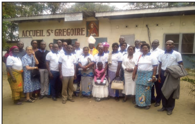
Les équipes Notre-Dame autour de l'évêque de Gamboma

bonheur et sainteté», méditent chaque mois sur un thème de leur choix pour rendre leur foyer Saint», a souligné l'évêque de Gamboma.