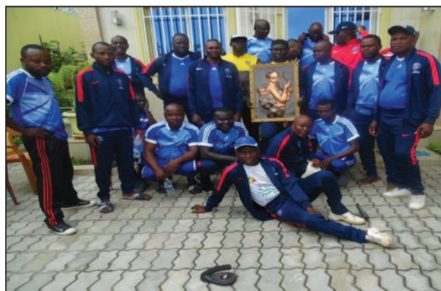
Le club de marche de Gambouissi

Le club, apolitique, a, entre autres activités: marche chaque dimanche matin comme moyen de préserver la santé; vulgarisation de l'esprit de fraternité et de cohésion dans le quartier; assistance équitable de tous les cas éventuels des membres. L'adhésion, sans distinction de sexe, est libre et volontaire. L'emblème du club est composé de plusieurs personnes qui marchent. Sa devise est: le sport nous unis.