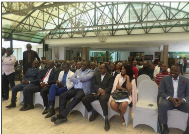
Les invités présents à la cérémonie