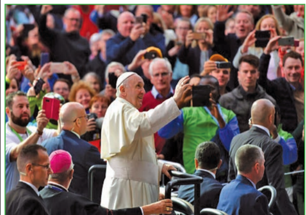
Le Pape François prenant un bain de foule à bord de sa Papamobile, à Dublin (P.8)

Le Pape demande pardon aux victimes des abus sexuels