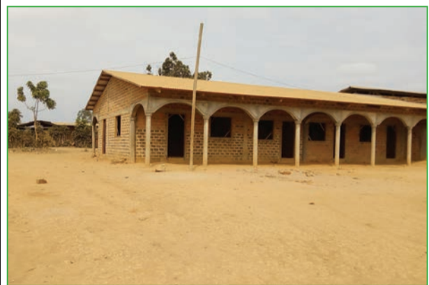
Le presbytère en construction et la chapelle provisoire de St Jean Paul II de Nkayi (P.8)