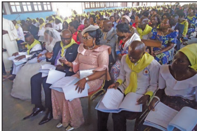
Un anniversaire sur fond de bénédictions nuptiales