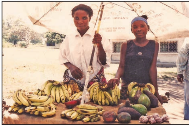
Une vue des produits agricoles

Le programme national de développement (PND) 2018-2022, approuvé par le Gouvernement et adopté en loi par le Parlement au cours de ce troisième trimestre 2018, mise sur l'agriculture pour diversifier l'économie congolaise.