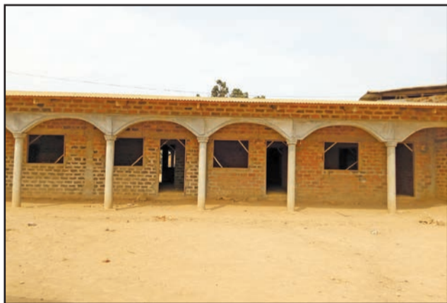
Le presbytère et la chapelle Saint-Jean-Paul II en construction