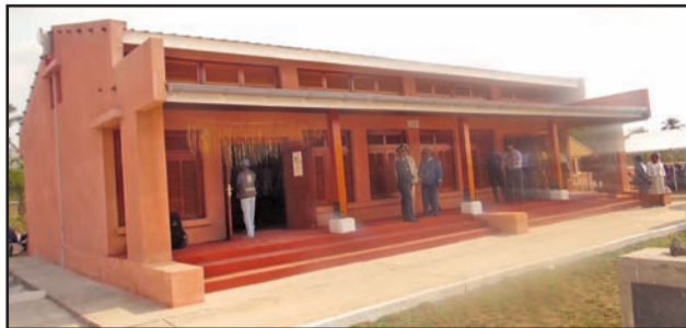
Un des six bâtiments identiques du Musée

peut y trouver des effets personnels des Mâ Loango, ou encore des documents sur la traite négrière. Ainsi, comme pour compléter le projet, Total E&P Congo a aussi entrepris le réaménagement de la route des esclaves appelée encore "piste des