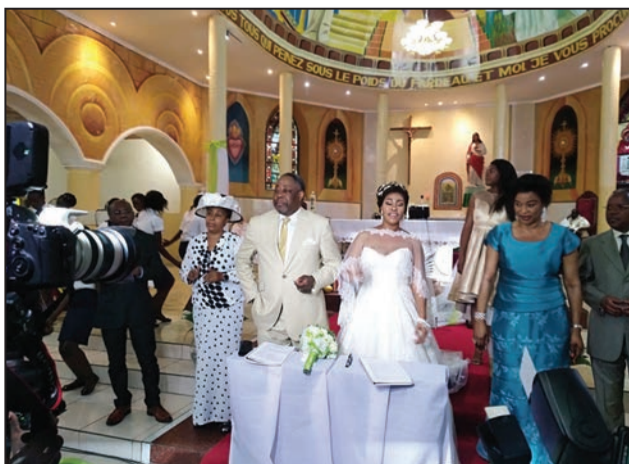
Le couple Nguimbi

La femme est un don de Dieu à l'homme, «une créature non identique, mais complémentaire. Jésus s'appuie sur ce passage de l'Écriture pour proclamer l'indissolubilité du mariage. Au commencement,