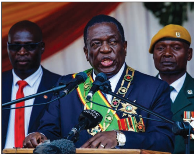
Le nouvel homme fort du Zimbabwe

Vainqueur de l'élection présidentielle du 30 juillet 2018, sous fond de contestation, Emmerson Mnangagwa a été investi président de la République du Zimbabwe, dimanche 26 août 2018 à Harare, avec 50,8% contre 44,3% pour son adversaire Nelson Chamisa, après la validation des résultats définitifs par la Cour constitutionnelle, la plus haute instance judiciaire du pays. Entre autres, les présidents Cyril Ramaphosa d'Afrique du Sud et Joseph Kabila Kabange de la RD Congo ont assisté à la cérémonie d'investiture.