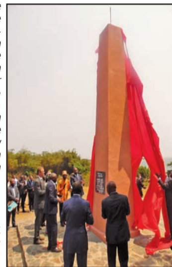
Dévoilement de la stèle aux esclaves

Il s'agit là d'un important investissement que Dieudonné Moyongo, Ministre de la Culture et des arts, a apprécié à sa juste valeur, en adressant des éloges reconnaissants à la société Total E&P Congo qui a gratifié le Ministère de la Culture de ce musée moderne. «Il est construit aux normes architecturales prescrites en matière de conservation et collection muséale... Il nous permettra d'être en contact vivant avec les objets