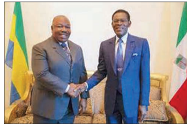
Les présidents Ali Bongo et Obiang Nguema

Dans le cadre d'une visite de travail et d'amitié, le président de la République gabonaise, Ali Bongo Ondimba, a eu un tête-à-tête mercredi 22 août 2018 dans la capitale équato-guinéenne avec son homologue, Teodoro Obiang Nguema Mbasogo. Au cours de leurs entretiens, les deux chefs d'Etat ont partagé leur préoccupation concernant la situation de crise économique qui sévit à l'échelle mondiale en général et dans la sous-région Afrique centrale en particulier.