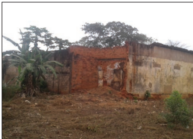
... de Madingou

malgré la municipalisation. Pour les audiences, le tribunal est obligé de squatter la salle de mariages de la mairie de Madingou. A Mouyondzi, la maison d'arrêt construite dans les années 30 avec une capacité de 100 détenus n'est plus subventionnée, elle se débrouille selon les moyens du bord. Pour se nourrir, on oblige les détenus à travailler dans les plantations des particuliers afin de trouver de quoi manger. Parfois, ils se cotisent ou exercent des travaux dans des plantations auprès de tiers moyennant une petite rémunération. Depuis près de deux ans, il n'y a pas de budget de fonctionnement. Des prévenus et les condamnés dorment à