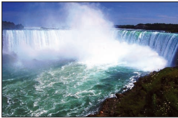
La meilleure gestion des ressources en eau est de nos jours plus qu'une exigence

grès réalisés dans le domaine de l'eau depuis l'adoption de l'Agenda 2030 pour le Développement durable et de l'Accord de Paris sur le climat. A cette occasion, la directrice générale rappellera le rôle de l'Unesco pour une meilleure gestion des ressources en eau grâce au Programme hydrologique international, au Programme mondial sur l'évaluation des ressources en eau et au travail de la Commission Océanographique intergouvernementale», renseigne le communiqué publié par l'UNESCO. Pour rappel, l'édition de La Semaine mondiale de l'eau 2017 avait pour ambition d'apporter des contributions à l'atteinte des Objectifs de développement durable (ODD), en particulier la cible 6.2 relative à la mise en place de services d'assainissement pérennes et efficaces. Selon les trois piliers du développement durable, des grands sujets constituent pour la communauté internationale d'importants défis. Il s'agit du pilier social concernant l'accessibilité de la réutilisation des eaux usées