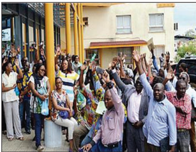
Les syndicalistes pendant la manifestation

Principale plateforme syndicale du Gabon, la Dynamique unitaire a appelé à une manifestation pacifique mardi 28 août 2018 pour continuer à protester contre les mesures d'austérité du gouvernement au détriment des fonctionnaires. Les dirigeants syndicaux appelaient déjà depuis quelques semaines à durcir la protestation contre ces mesures drastiques qui ciblent notamment les fonctionnaires.