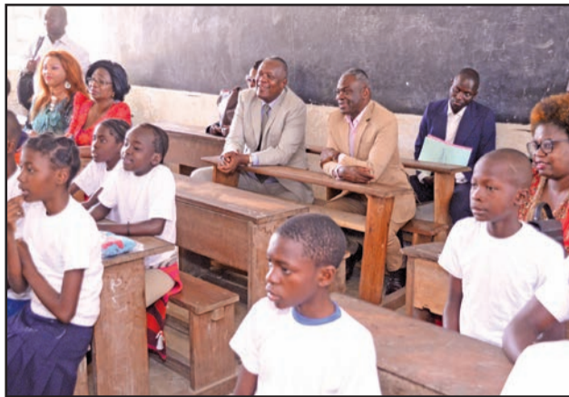
Les officiels et les élèves dans une salle de classe pendant l'enseignement des mathématiques