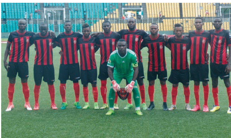
En dépit de leur défaite à Aba, les Aiglons passent en quarts de finale