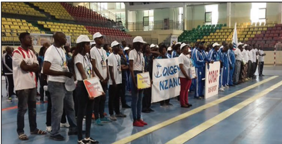
Les délégations pendant la cérémonie d'ouverture des championnats

Les championnats nationaux du sport de travail mobilisent leurs amateurs. Ils se déroulent depuis lundi 27 août à Brazzaville, dans les sites retenus par la Fédération congolaise du sport de travail (FCST): Stade Président Alphonse Massamba-Débat et son annexe, puis le Gymnase Henri Elendé. Certaines disciplines sont qualificatives pour les 1ers Jeux africains du sport de travail. La clôture interviendra ce dimanche 2 septembre.