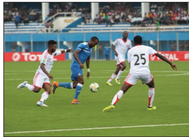
Un attaquant d'Enyimba pris dans la nasse des Aiglons

Les férus congolais de football ont laissé libre cours à leur joie. Pourvu qu'elle perdure. Dans