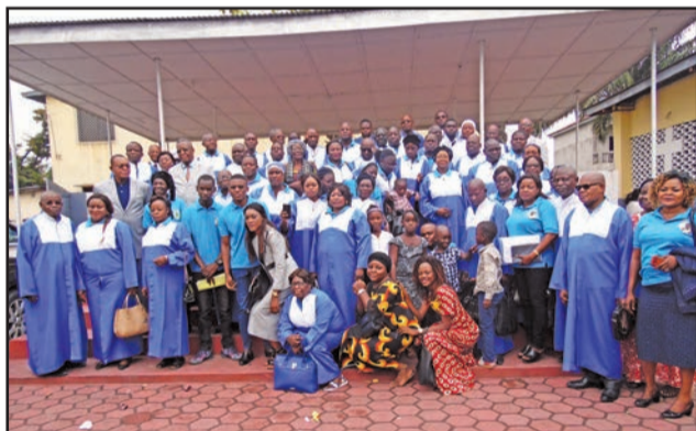
La chorale jubilaire avec ses hôtes