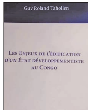
La couverture du livre