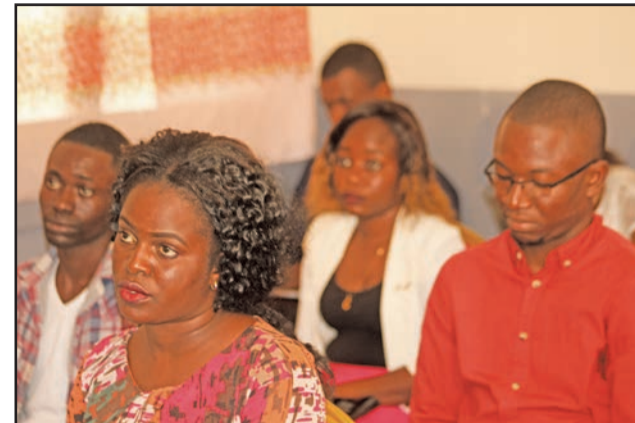
Quelques participants à la formation