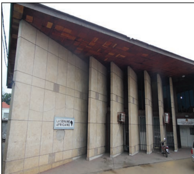
Le bâtiment de La Semaine Africaine

En 66 ans, La Semaine Africaine a gardé une très bonne