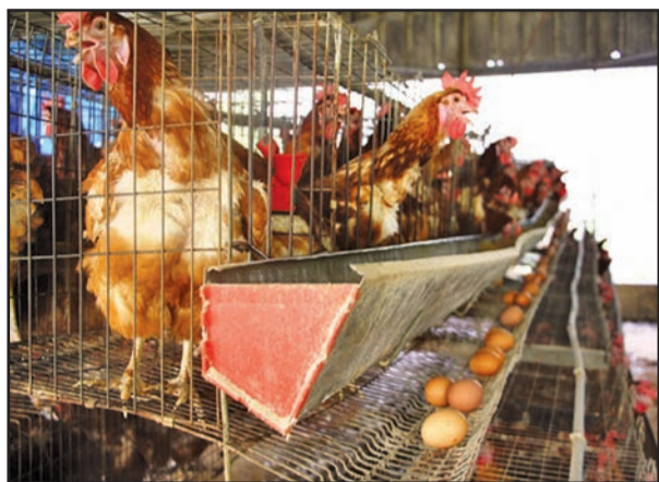
Une vue des coqs et des poules sur les étalages

Pour parvenir à l'autosuffisance par le développement de la production agricole, l'Etat avait prévu 13 milliards de Francs CFA dans le cadre de son programme de lutte contre la crise alimentaire et créé trois villages agricoles expérimentaux. Le village de Nkouo, le premier mis en place avant celui d'Imvouba, est destiné à la production d'œufs de table. Au moment où l'on parle de la diversification de l'économie, les exploitants appellent le Gouvernement à créer les conditions pour l'augmentation de leur production.