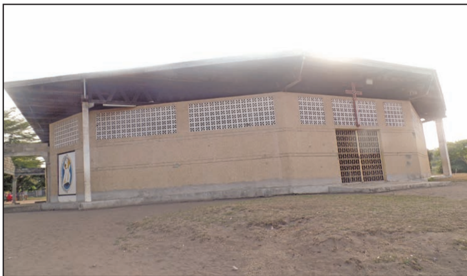
Une vue extérieure de l'église