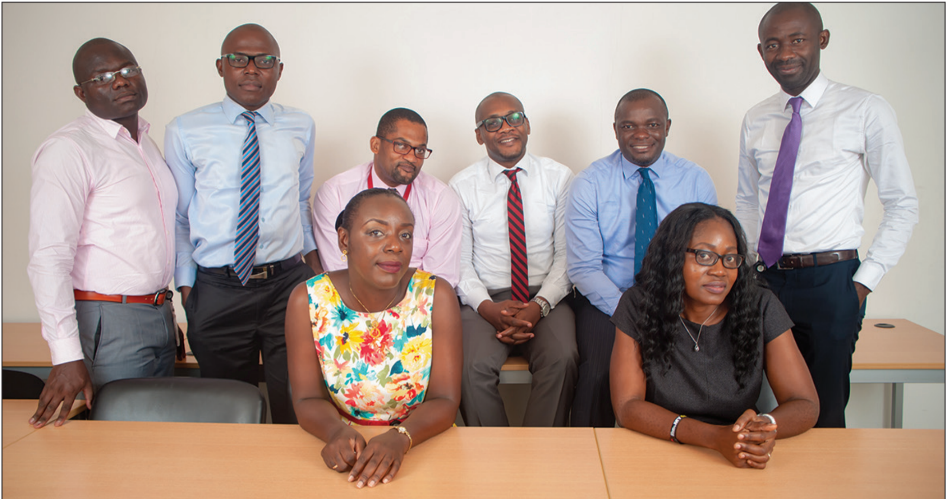
Groupe personnes PwC