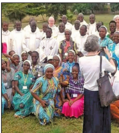
Les participants à la Rencontre des Foyers de charité à Liambou