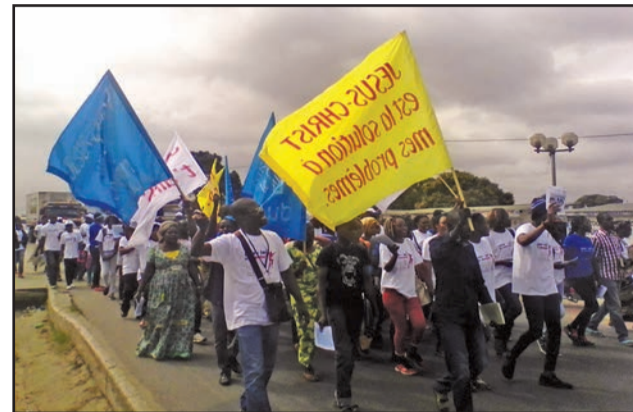
Les chrétiens pendant la marche

Une communauté chrétienne de Pointe-Noire a témoigné sa foi en Jésus le 25 août 2018 par une marche pour Jésus. Plus de 300 chrétiens marcheurs ont participé à cette manifestation partie de l'hôpital général de Loandjili, avec pour point de chute le rond-point de la République dans le 1 er arrondissement, Lumumba.