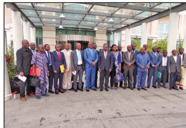
Une vue des administrateurs du PSTAT et de l'INS

posantes et sous composantes ci-après: la première composante concerne le développement institutionnel, ressources humaines et structure et infrastructures organisationnelles. Le projet œuvre pour s'assurer que des statistiques fiables et opportunes sont produites de manière durable grâce au renforcement des capacités des ressources humaines, à l'amélioration de la capacité du système national à attirer et à fidéliser le personnel qualifié et motivé et au renforcement des infrastructures adéquates notamment en ce qui concerne les technologies de l'information et de la communication (TIC) pour produire et diffuser des informations statistiques. La composante 1 comprend trois sous-composantes: l'amélioration de l'organisation, le développement des ressources humaines et la modernisation des infrastructures et du matériel.