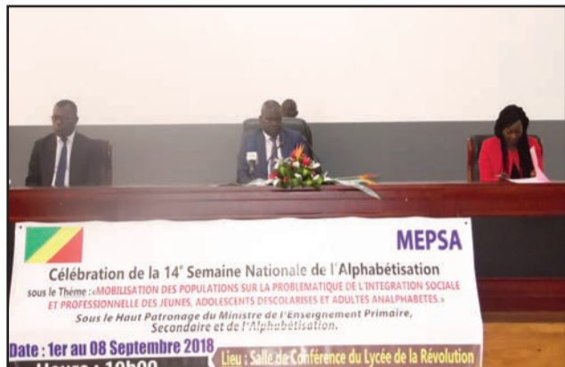
Le présidium au lancement de la campagne

Prélude à la célébration de la 52 e Journée mondiale de l'alphabétisation le 8 septembre de chaque année, le ministère de l'Enseignement général consacre sa 14 e semaine de l'Alphabétisation à une campagne de mobilisation communautaire pour vulgariser les centres d'alphabétisation et de réscolarisation de Brazzaville. Cette campagne a été ouverte le 1 er septembre à Brazzaville, par le ministre Anatole Collinet Makosso, en présence de plusieurs représentants des agences des Nations Unies au Congo.