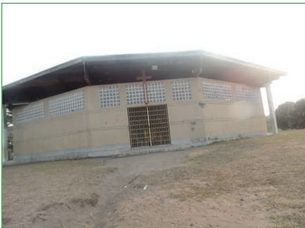
Une vue de l'église (P.9)