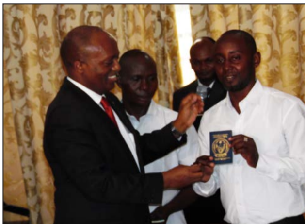
L'ambassadeur rwandais remettant un passeport à son compatriote

socio-culturelle et économique. Je rappelle cependant que, pour pouvoir obtenir les documents nécessaires à l'intégration en République du Congo, les sujets rwandais doivent acquiescer le passeport en se présentant à l'ambassade du Rwanda ici à Brazzaville. La procédure d'acquisition de ce passeport a été expliquée à maintes reprises par des communiqués officiels, au niveau du guichet unique ouvert à cet effet. Aujourd'hui, l'ambassade est disponible pour assister les sujets rwandais qui veulent acquiescer leur passeport. Ce passeport va servir de droit d'intégration locale et aussi pour des déplacements dans d'autres pays qu'ils désirent, contrairement à la rumeur selon laquelle ces passeports ne sont que des cartes pour se déplacer du Congo au Rwanda. Ce sont des passeports internationaux et je félicite les Rwandais qui les ont obtenus. Je saisis cette opportunité pour rappeler aux anciens réfugiés rwandais qui sont actuellement sans papiers sur le sol Congolais pour leur dire qu'ils ne sont pas obligés