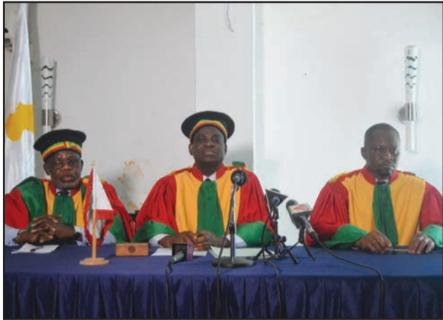
Les juges qui rendront la sentence

Les dirigeants de DGSP avaient récusé la paire arbitrale désignée par la FECOHAND pour diriger la finale féminine des championnats nationaux 2018 entre leur équipe et Abo-Sport. Le match ne s'étant plus disputé à cause de leur désistement, les sanctions fédérales n'ont pas tardé: disqualification de DGSP et rectificatif du classement général, de telle sorte que les militaires de la DGSP ne figurent plus sur le podium de la compétition et ne peuvent disputer la Coupe d'Afrique des vainqueurs de coupe! Depuis, le torchon brûle entre les deux parties. Les dirigeants de la DGSP ont alors saisi la CCAS, produit par le truchement de leur avocat la requête introductive d'instance et le bordereau des pièces qui l'accompagne. Leur requête demande ni plus ni moins l'annulation des décisions rendues à l'encontre de leur équipe. La CCAS entendant statuer dans un délai proche, elle a pris immédiatement une ordonnance fixant l'audience au vendredi 31 août. Le jour J, l'avocat de la partie défenderesse était malheureusement absent. La CCAS a finalement renvoyé