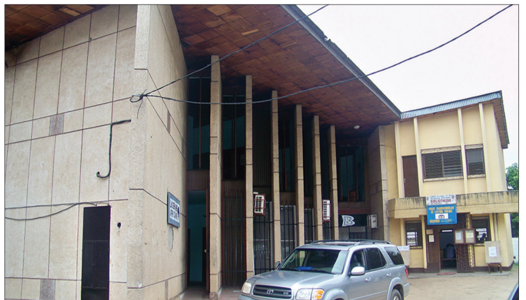
Une vue extérieure du bâtiment de La Semaine Africaine (P.6)

Presse congolaise Les prochaines assises de la presse doivent être un miroir englobant (P.3)