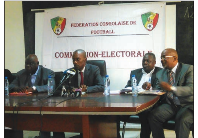
Les membres de la commission électorale