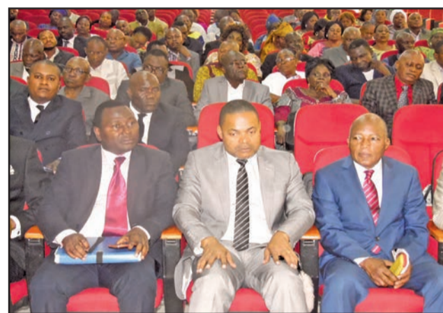
Une vue de l'assistance à l'ouverture des travaux

agences des Nations Unies, des institutions éducatives, des associations, des bailleurs de fonds, etc. La mise en œuvre des ODD