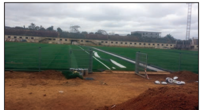
La pelouse synthétique est enfin là

C'est là ! La pelouse synthétique tant attendue par le public sportif congolais depuis quelques jours sur l'aire de jeu du stade Denis Sassou Nguesso de Dolisie! Le meilleur club congolais de la décennie, l'AC Léopards, renouera bientôt avec son stade. L'entreprise adjudicataire de ce marché avait lancé les travaux relatifs à la pose de la pelouse synthétique au début du mois de septembre 2017. Fin octobre de la même année, des lots de matériels étaient déjà acheminés sur le chantier, pour amorcer les travaux d'implantation du gazon synthétique. Malheureusement, mi-novembre 2017, l'opérateur était contraint de les arrêter momentanément à cause des pluies diluviennes qui arrosaient la ville, à cette période. C'est finalement le 8 juin 2018 que l'entrepreneur a pu relancer le chantier avec force et vigueur, la grande saison sèche aidant. En dehors de l'aire de jeu, des nouvelles et pittoresques installations ont été aussi placées à l'espace des bancs de remplaçants. Pour le reste, il suffit seulement qu'on applique une couche de peinture sur les murs pour que le stade refasse peau neuve. Le stade de Madingou, c'est bientôt une page tournée pour les Fauves du Niari qui étaient contraints de l'utiliser pour accueillir leurs hôtes. Finie aussi