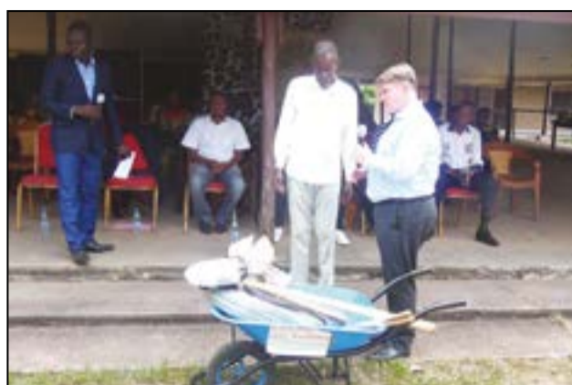
Remise symbolique d'un kit agricole à un bénéficiaire

Des kits agricoles ont été remis aux six coopératives lauréates de l'appel à mini-projets lancé par le Projet d'appui au maraîchage, à la transformation agro-alimentaire et à la commercialisation des produits transformés à Brazzaville (PAMTAC-B). Vendredi 5 octobre 2018, au site d'Agri-Congo de Kombe à Brazzaville.