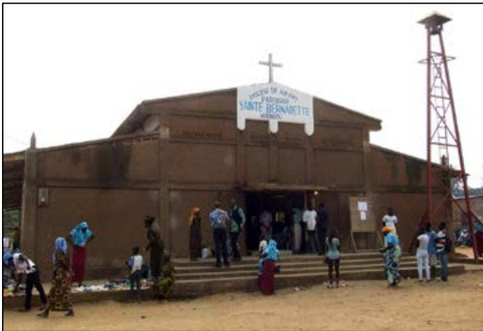
La devanture de l'église