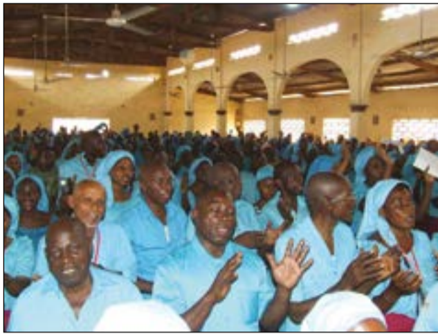
Des fidèles participant à la messe