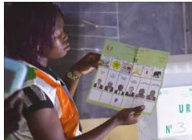
Pendant le décompte des votes