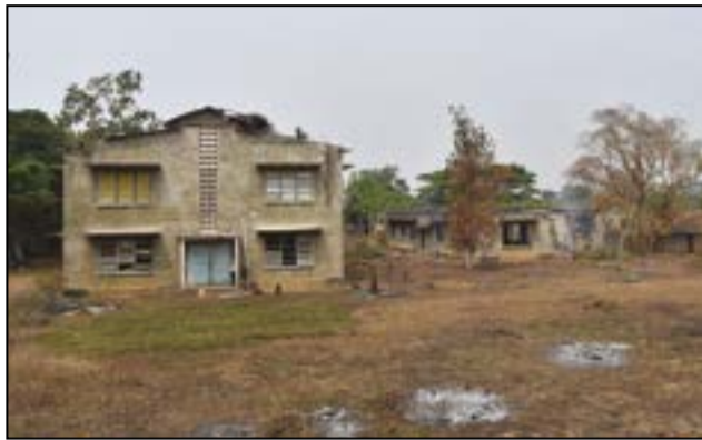
Une vue panoramique du site nettoyé

Le presbytère, belle fierté architecturale, n'a pu être bien entretenu certes. Mais, il est dans un état de délabrement très avancé du fait des bombardements militaires. Aussi nécessite-t-il une restauration de choc dans le but de recréer le plus fidèlement possible l'ensemble des caractéristiques de ce bâtiment patrimonial, si l'on tient vraiment à sauvegarder l'un des forts symboles de l'âme mbamouite. La porcherie, les latrines, le préau, tout comme le bâtiment abritant les deux réfectoires et la cuisine nécessitent également d'importants travaux de réfection si ce n'est de rénovation ou de réhabilitation. C'est selon. Le grand bâtiment encore bien debout, mais modifié, sans style, en certaines de ses parties