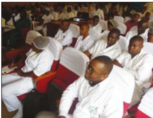
L'assistance pendant la formation

attention particulière car, 972 millions de personnes dans le monde sont hypertendues, et si le travail de sensibilisation n'est pas fait d'ici à 2025 il y aura 1 milliard 500.000 hypertendus dans le monde. En Afrique, plus de 100 millions de personnes sont hypertendus et 90 millions ne sont pas soignées ou prises en charge. L'hypertension qui est l'élévation de la pression artérielle est favorisée par l'obésité, le tabagisme, le stress, une alimentation riche en sucre, en sel et en graisse, ainsi que l'inactivité physique. De même, il faut encourager le dépistage chez les personnes âgées, les diabétiques et les personnes qui ont un poids élevé. Un sujet