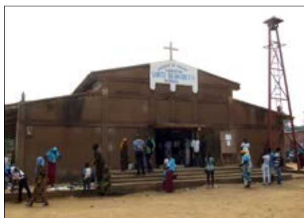
La devanture de l'église (P11)