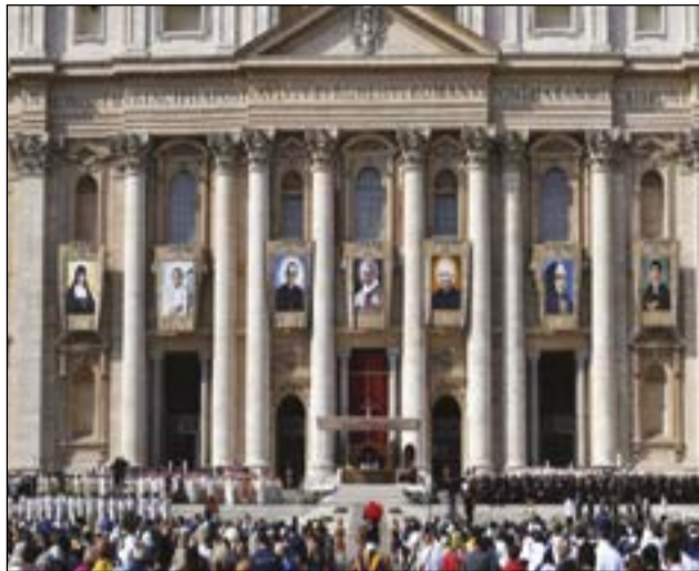
Les portraits des sept nouveaux saints de l'Eglise

A l'occasion du synode sur les jeunes qui se tient au Vatican depuis le 3 octobre 2018, le Pape François a canonisé sept nouveaux saints, lors d'une messe solennelle dimanche 14 octobre place Saint-Pierre de Rome. Parmi eux, Jean-Baptiste Montini devenu Pape Paul VI (1963-1978) et Mgr Oscar Romero, archevêque de San Salvador, assassiné alors qu'il célébrait la messe en 1980. Sa canonisation a drainé dans la vielle éternelle près d'un millier de pèlerins venus de l'île salvadorienne. Avec l'élévation à la gloire des autels de ces bienheureux, le calendrier de l'Eglise s'est enrichi des nouveaux noms de serviteurs de Dieu qui ont imprimé pour l'éternité le témoignage de leur vie au sein de l'Eglise.