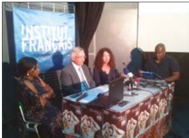
Les animateurs de la conférence de presse