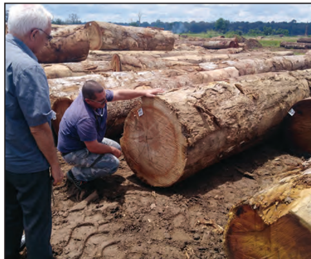
Le bois, richesse du département

pas que les usines aient de nouveau rouvert dans le bassin forestier, ou que des nouvelles entités aient été annoncées, mais au moins Ouesso « fonctionne ». Les marchés sont pleins et