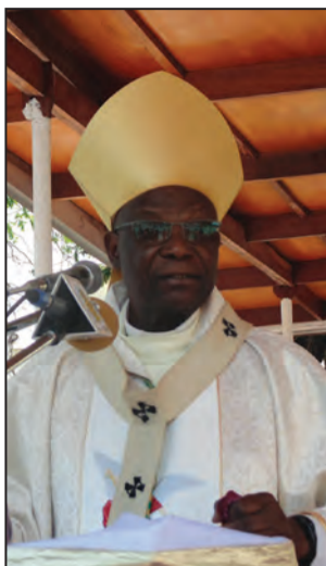
Mgr Anatole Milandou

L'Année pastorale 2018-2019 ayant pour thème: « Combattons les antivaleurs au sein de notre Eglise locale », a été ouverte samedi 6 octobre 2018, au cours d'une messe présidée à la Place mariale de la cathédrale Sacré-Cœur par Mgr Anatole Milandou, archevêque métropolitain de Brazzaville. Il a conféré à cette occasion l'ordination diaconale à douze grands séminaristes ayant achevé leurs stages pré diaconaux dans diverses structures de l'archidiocèse de Brazzaville.