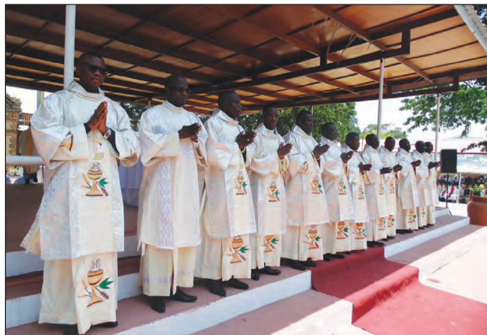
Les douze nouveaux diacres au service de l'Évangile