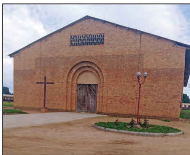
La cathédrale Saint Pierre-Claver

achalandés, les taxis roulent et leurs conducteurs ne font pas la grise mine. Il se dégage de toute la ville une sérénité qui renforce l'idée que Ouesso va résolument vers