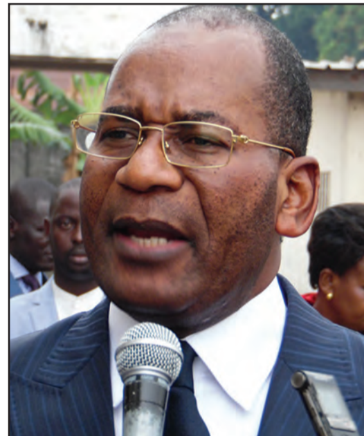
Le ministre Pierre Mabiala