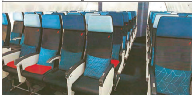
Cabines dotées des meilleures conditions de confort

rification est en négociation pour permettre les échanges