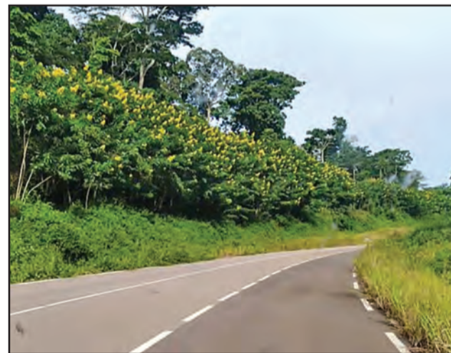
La route est belle, facteur de développement

rounais tenanciers d'épicerie ou de gargotes parlent de la ville à voix basse, mais avec respect. La Cameroun, à peine une quinzaine de kilomètres par endroit, à l'ouest, en traversant la Ngoko, est une autre réalité présente. Beaucoup de produits de consommation sont inconnus d'un Brazzavillois, de l'eau minérale au soda. C'est d'ailleurs visiblement des négociants camerounais qui sont les plus grands acheteurs de la production cacaoyères, le long de la