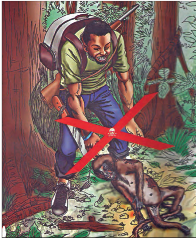
Ne pas toucher ou manger les animaux malades ou trouvés morts

Le Congo qui entretient, avec la R.D.C., des échanges commerciaux avec d'importants trafics transfrontaliers entend être en alerte continue même si aucun cas d'Ebola n'a été signalé. Ce, afin de réduire les risques de transmission et d'éviter d'importants dégâts en