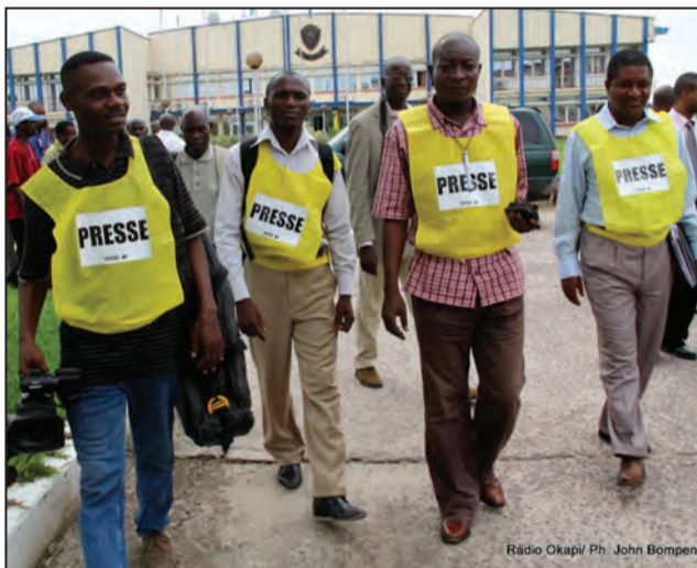
Les professionnels des médias

Les journalistes s'inquiètent de leur condition de travail en République démocratique du Congo, un pays dans lequel le climat de la liberté de la presse se dégrade, notamment dans le Nord et le Sud-Kivu. Interpellations, disparitions et assassinats sont entre autres les situations qui inquiètent les professionnels des médias dans la région. Il y a quelques jours, les journalistes d'Africanews, un trihebdomadaire paraissant à Kinshasa la capitale du pays, ont été interpellés suite à la publication d'articles portant sur des détournements présumés des fonds publics et de rations militaires.