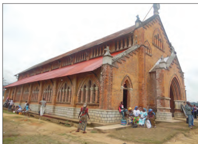
L'église Notre-Dame des Victoires de Pougna