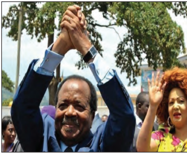
Paul Biya réélu pour un nouveau septennat

Après quatre jours d'examen du contentieux électoral et des recours déposés par l'opposition, du 16 au 19 octobre 2018, le verdict est enfin tombé pour la présidentielle du 7 octobre. Le Conseil constitutionnel a proclamé, lundi 22 octobre la victoire sans surprise de Paul Biya du Rassemblement démocratique du peuple camerounais (RDPC). Crédité de 71,28% des suffrages, le chef de l'Etat sortant devance Maurice Kamto du Mouvement pour la renaissance du Cameroun (MRC), 14,23%, qui conteste les résultats.