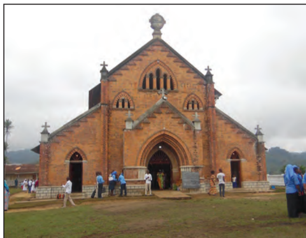
La façade principale de l'église (P.13)