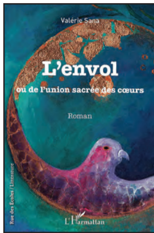
Couverture du livre