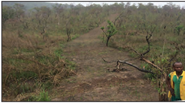
Piste rurale en cours de réhabilitation Moukonkoto-Missié-Missié (District de Mindouli).

contribution, le Gouvernement américain manifeste sa volonté d'accompagner la consolidation de la paix dans le département du Pool, et de renforcer ses relations avec la République du Congo. «Ce type d'assistance humanitaire n'est possible que grâce aux efforts de paix des parties en conflit dans le Pool. Les États-Unis seront toujours aux côtés de la communauté internationale et du Gouvernement congolais pour accompagner cette population, et nous comptons sur la franche collaboration de nos partenaires tel que le PAM.» l'ambassadeur des États-Unis Todd Haskell. «Maintenant qu'elles rentrent chez elles, nous tenons à aider les populations à retrouver une vie normale. Ce projet vient renforcer les efforts du Gouvernement en faveur de la paix, condition du rétablissement durable de la sécurité alimentaire dans le dé-