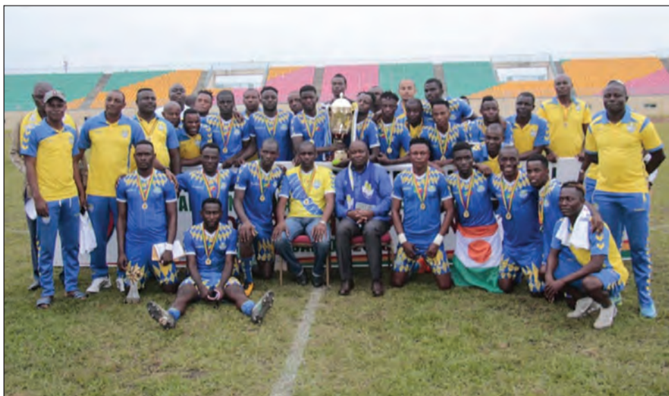
L'AS Otohô entre dans le giron des seigneurs

Classement officiel: 1. AS Otohô (75 points). 2. La Mancha (71). 3. Diables-Noirs (68). 4. AC Léopards (59). 5. CARA (48). 6. AS Cheminots (48). 7. JST (43). 8. Etoile du Congo (41). 9. Inter Club (34, -13). 10. Tongo FC (31, -21). 11. V. Club Mokanda (30, -18). 12. Patronage Sainte-Anne (30, -21). 13. Nico-Nico (28). 14. FC Kondzo (27, -15). 15. JSP (27, -26). 16. SMO (18).