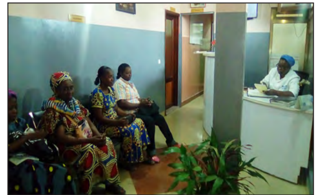
Des patientes pendant la consultation gratuite