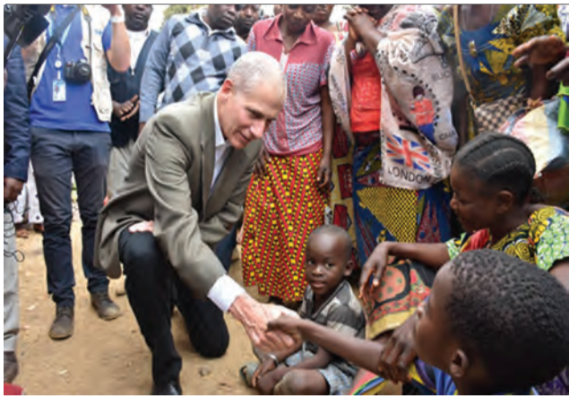
L'ambassadeur Todd Haskell lors de la visite des déplacés du Pool à Loutété dans la Bouenza

Le Gouvernement américain était le premier à répondre à la demande d'assistance humanitaire du Gouvernement congolais pour les déplacés du Pool. L'année passée, près de 6,500 (six mille cinq cent) personnes dans la Bouenza ayant fui les violences dans le Pool avaient pu être assistées. Cette année encore, les États-Unis ont assisté, à travers un financement de l'USAID, environ 9000 ménages déplacés à Mindouli affectés par le conflit du Pool. Et grâce à cette nouvelle