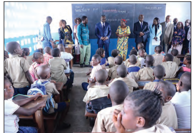
Dans une salle de classe à Loango Marine

Cette année, un accent particulier a été mis sur le volet rescolarisation, lequel reçoit des enfants ayant décroché l'école, subi une déscolarisation ou présentant des difficultés spécifiques dans leur scolarité. «Au travers de la rescolarisation nous prenons en charge, dès le début, des enfants présentant des difficultés scolaires pour ne pas faire courir