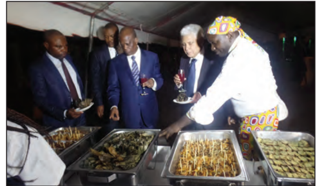
Pendant la dégustation

qui cultivent dans des conditions pénibles arrivent à nous nourrir par les produits du terroir. Pour éradiquer la faim au Congo, nous devons mettre en place les moyens, pour mettre en œuvre la politique du Gouver-