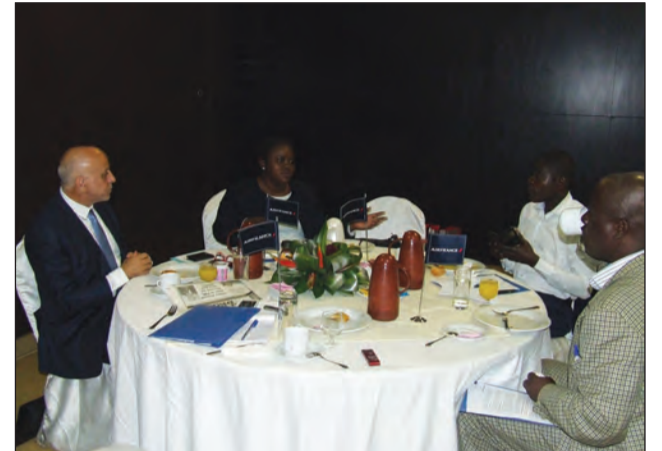
En compagnie des journalistes

A rappeler que la compagnie Air France emploie directement une trentaine et indirectement une centaine d'agents à Brazzaville et à Pointe Noire. Elle assure