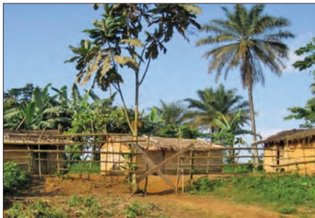
Une vue de Tsimba, chef-lieu du district de Moutamba

se rendre au centre de santé. Ils ont également fait don de kits scolaires aux élèves du primaire de la circonscription. Mais, si ces fournitures ont soulagé les difficultés des parents, deux grandes écoles du district n'ont pas ouvert