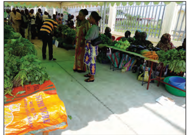
Un stand des produits maraîchers

L'humanité a célébré mardi 16 octobre 2018 la 38 e journée mondiale de l'Alimentation. A Brazzaville, pour marquer cette journée, le Gouvernement et l'Organisation des Nations Unies pour l'Alimentation (FAO) se sont donné rendez-vous au gymnase Nicole Oba, dans le 6 e arrondissement, pour encourager les efforts des maraîchers de la ceinture de Talangaï, et accentuer la production agricole. Elle était placée sous les auspices du ministre d'Etat, Henri Djombo, ministre de l'Agriculture, de l'élevage et de la pêche, qui avait à ses côtés, la représentante de la FAO au Congo, Mme Suze Percy Filippini, quelques membres du Gouvernement, et d'autres personnalités.