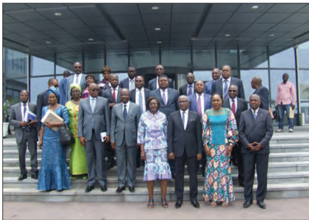
Photo de famille