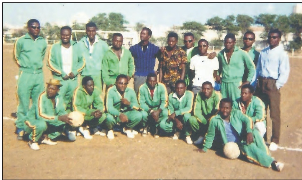
Les footballeurs congolais aux Jeux de Dakar en 1963