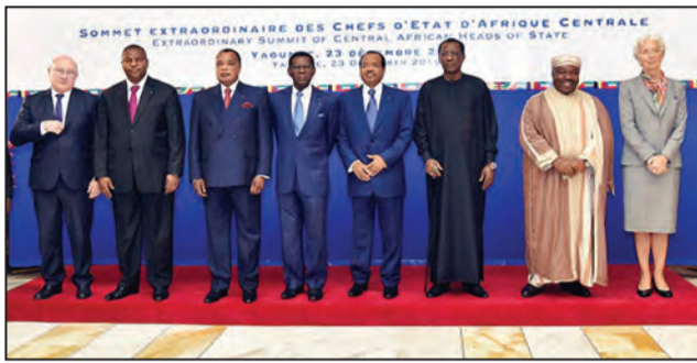
Les chefs d'Etat de la CEMAC lors de la rencontre de Yaoundé, en 2016

Un sommet extraordinaire a réuni les chefs d'Etat de la Communauté économique et monétaire de l'Afrique centrale (CEMAC) à N'Djaména, au Tchad depuis jeudi 25 octobre. La rencontre se déroulant dans la capitale tchadienne a abordé des questions économiques, dans le droit fil de celle de décembre 2016 à Yaoundé, au Cameroun à l'issue de laquelle ils avaient rassuré leurs peuples sur la non-dévaluation du franc Cfa. Convoqué par le président tchadien Idriss Déby Itno, président en exercice de la CEMAC, le sommet de N'Djaména a regroupé autour de ce dernier les dirigeants des cinq autres Etats de la sous-région.