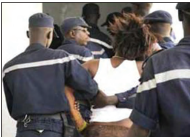
Les pompiers ont dû intervenir

blique d'intervenir parfois avec la manière forte. Les agents de police ont, un moment, utilisé des gaz lacrymogènes pour disperser la foule qui grossissait au fil des heures. De sources hospitalières, aucun mort n'a été enregistré parmi les victimes, contrairement à la rumeur qui en annonçait un, voire deux. Tous les enfants ont pu rejoindre