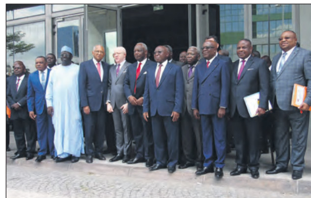
Les officiels après l'ouverture des travaux (P.4)

Enfin les assises de la presse congolaise!