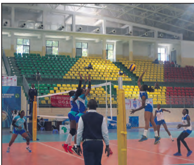
Une opposition en version féminine

Au moment où notre journal était sous presse se disputait le titre féminin entre DGSP du Congo et Canon de la RDC après des demi-finales explosives mercredi 24 octobre au Gymnase Henri Elendé entre DGSP