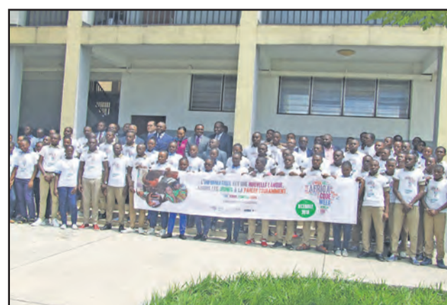
Les élèves posant avec les officiels

La Fondation Bantu Hub, en partenariat avec la société applicative de produits (SAP) et Google, ont célébré lundi 22 octobre 2018 à Brazzaville, la 3 e édition d'Africa Code Week, à l'occasion de la Semaine africaine du code informatique. Pour SAP, l'initiatrice du projet, l'informatique est une nouvelle langue codée qu'il sied d'apprendre aux jeunes élèves afin de la parler couramment. Cette cérémonie qui a connu la participation d'un parterre d'élèves enthousiastes, enseignants et experts dans le domaine du numérique, s'est déroulée sous les auspices de Léon Juste Ibombo, ministre des Postes, des télécommunications et de l'économie numérique. En présence de Jean Julien, chef de la délégation de SAP et de Véronique Mankou, responsable de la Fondation Bantu Hub.