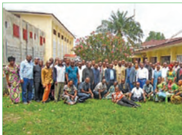
Le président de la C.E.EDU.C. (au milieu en soutane) posant avec les participants (P.9)

Les acteurs de l'éducation catholique appelés à préserver l'environnement