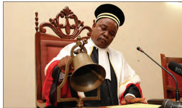
Michel Landry Louanga, président de la CPS

La Cour pénale spéciale (CPS) était attendue en République centrafricaine où le système judiciaire est en pleine restructuration. Elle a tenu sa session inaugurale lundi 22 octobre dernier, à Bangui. Cette Cour, hybride, est composée de 25 juges, 13 nationaux et 12 internationaux pour juger les crimes internationaux commis en Centrafrique depuis 2003. La crise a détruit un grand nombre de Cours et l'instabilité persistante empêche encore la justice de faire son travail dans certaines régions du pays. La CPS vient ainsi appuyer la justice locale et elle a été saluée par les Centrafricains.