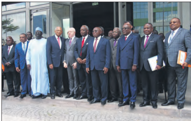
Les officiels après l'ouverture des travaux

Reportées plusieurs fois, les assises de la presse congolaise tant attendues par les professionnels de l'information se tiennent du 25 au 28 octobre 2018 à Brazzaville, sur le thème: «La presse congolaise, vingt-cinq ans après les Etats généraux: bilan, enjeux et perspective à l'ère du numérique». C'est le ministre de l'Intérieur et de la décentralisation, Raymond Zéphirin Mboulou qui en a ouvert les travaux, en lieu et place du premier ministre Clément Mouamba. En présence du ministre de la Communication et des médias, Thierry Lezin Mougala, du président du Conseil supérieur de la liberté de communication, Philippe Mvouo, de plusieurs représentants des structures de régulation et d'auto régulation venus des pays d'Afrique et d'Europe, de l'Organisation internationale de la Francophonie (OIF), etc.