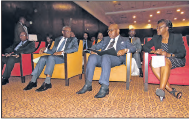
Les officiels à la présentation du rapport

A l'ENS et dans différentes ENI, une prépondérance des contenus académiques d'ordre général dans les enseignements dispensés, au détriment de l'ancrage pédagogique requis, a été constaté. Le rapport épingle le manque de savoir-faire pédagogique chez les formateurs des élèves-enseignants, car la plupart sont des diplômés d'université n'ayant pas forcément d'aptitudes pédagogiques. De même, l'absence de formation des inspecteurs disciplinaires du secondaire rend peu efficace le processus d'évaluation