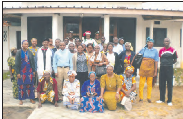
Les retraitants autour du responsable du foyer de charité

3- Qui peut faire partie d'un Foyer de charité?