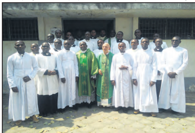
Pères Brel et Aimé entourés des jeunes religieux

ordinations diaconales et presbytérales, et s'engager de manière concrète pour la mission eucharistique dans la Congr-