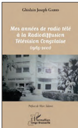
La couverture du livre

En outre, poursuit-il, intéressé par la profession de journaliste, il se présente au «concours d'entrée au studio-école en France d'où je sortirai journaliste, et me