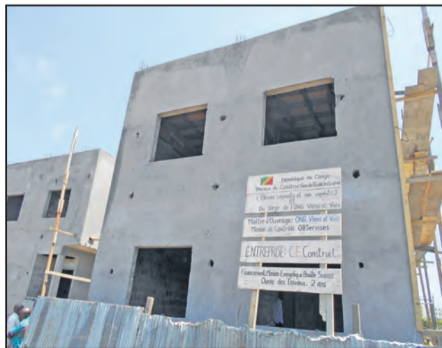
Le bâtiment de l'école en construction

il rassuré, les travaux ont connu une avancée remarquable. Aussi a-t-il loué l'action de la Mission évangélique Braille Suisse au profit des malvoyants dont on ne s'occupe pas assez. Le président directeur général