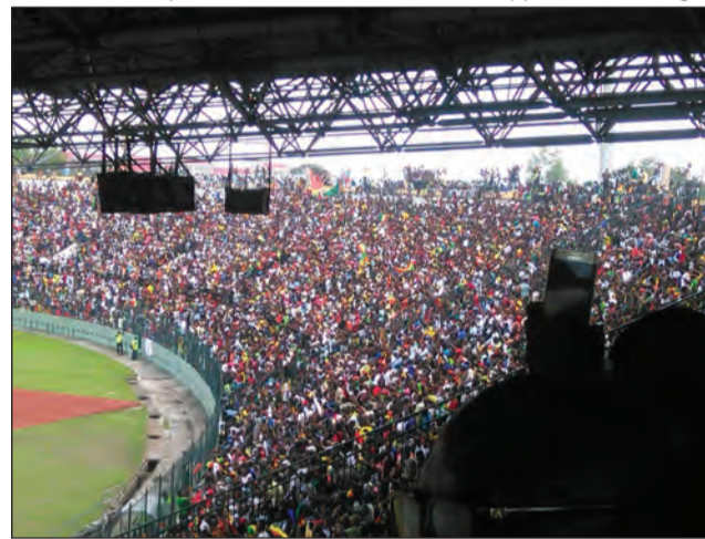
Tout le monde voulait vivre le spectacle

Si les autorités sportives congolaises avaient pris un certain nombre de dispositions, une chose avait été apparemment négligée: