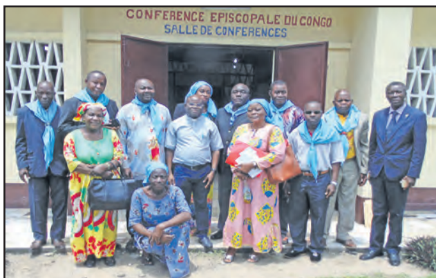
Le secrétaire général de la CEC, l'aumônier national posant avec les membres du bureau national et les participants à la rencontre

service, afin de bien accomplir les tâches qui leur incomberont. Le président sortant a rappelé que son bureau a été élu en avril 2012, à Goma-Tsésé et que le bureau entrant a été élu en juillet 2018, à Owando. Puis il a évoqué les liens de collaboration avec le Mont Saint Michel de France, tout en mettant l'accent sur l'assainissement des relations avec les différents bureaux diocésains de l'Archiconfrérie Saint-Michel du Congo. Après avoir épingle