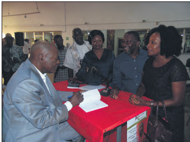
L'auteur dédicant son livre

voilà en 69 journaliste à la Voix de la Révolution congolaise avec toutes les péripéties: producteur d'émissions, animateur d'antenne, journaliste sportif et, par la suite, je serais à la télévision à partir de 1977. Donc, 23 ans à la radio et je resterai plus d'une quinzaine d'années également à la télévision, cela me donnera 33 ans effectivement comme fonctionnaire à la Radio-télévision congolaise. Mais, s'y ajoutent mes années de pigiste, j'aurai facilement une quarantaine d'an-