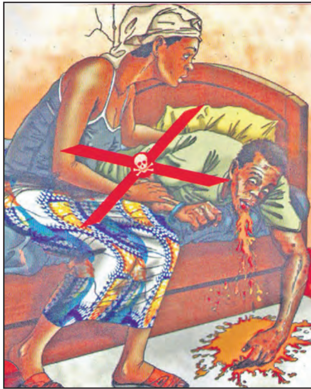
Ne pas toucher le malade et ses vomissures, sueur, sang, sécrétion...

L'OMS a d'ailleurs beaucoup insisté sur le soutien et l'engagement des populations car, lorsqu'elles ne suivent pas les conseils de santé publique, «il est difficile d'identifier les personnes qui sont malades ou leurs contacts, et on fait alors face à une situation où les chaînes de transmission peuvent se perpétuer. L'épidémie peut ainsi avoir lieu dans l'ignorance complète des