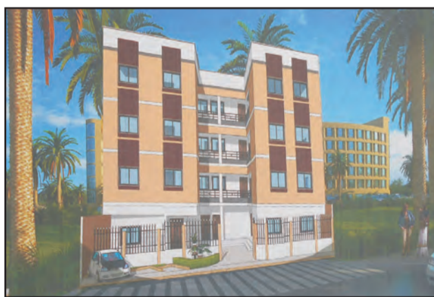
Une vue de la maquette de l'école inclusive

sements qui accueilleront plus de 160 élèves pour l'école inclusive, 40.000 étudiants pour l'université et 600 élèves pour "Terre-d'école" fera de Kintélé un véritable quartier latin de Brazzaville». En une année, a-t-