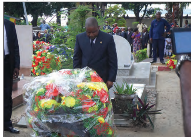
Le recueillement après le dépôt de la gerbe de fleurs