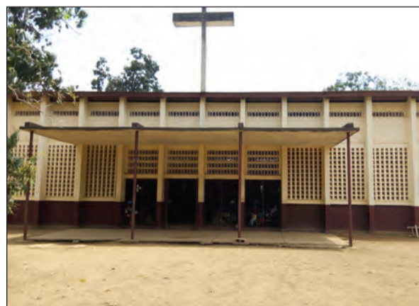
Une vue de l'église (P.9)