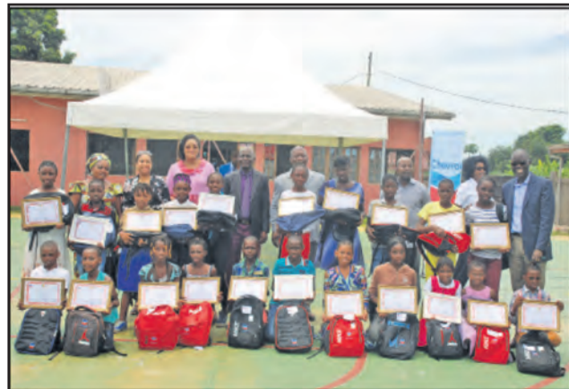
Photo de groupe des officiels avec un échantillon d'apprenants

bons employés susceptibles de contribuer au développement des entreprises qui les embaucheront. C'est dans cet esprit que nous avons conçu ce projet de renforcement des capacités de la langue française, en partenariat avec la direction départementale de l'Enseignement primaire, secondaire et de l'alphabétisation, et le Centre culturel Jean-Baptiste Tati-Loutard. Ce partenariat dure depuis sept ans déjà et la méthodologie utilisée permet à ces enfants d'accroître leur niveau en lecture, grammaire, conjugaison, rédaction, compréhension, bref toutes les facettes de la langue française, afin d'abor-