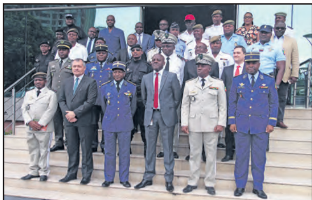
Après le lancement du numéro vert

Pour assurer aux mieux ses missions de force publique, la direction générale de la police nationale et l'Agence de régulation des postes et des communications électroniques (ARPCE) ont lancé mercredi 14 novembre 2018 à Brazzaville le centre d'appel d'urgence de la police nationale, plateforme joignable depuis le numéro 117. C'est le colonel André Fils Obami-Itou, directeur général adjoint de la police nationale, qui a lancé ce numéro vert en présence de Yves Castanou, directeur général de l'ARPCE.