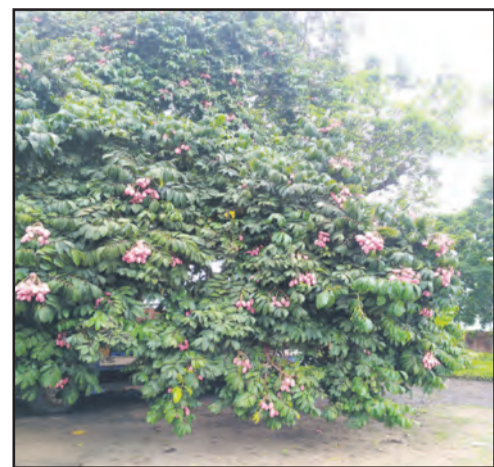
Un safoutier à Djambala

La saison semble bonne aujourd'hui dans le département des Plateaux. A Djambala, la capitale de la région, les safoutiers ont fleuri en abondance et tous les arbres sont porteurs de safous en grappes pleines et généreuses. Il ne s'agit pas de quelques branches seulement, mais de tout le feuillage de ces arbres qui donne l'impression de n'être constitué que de fruits ronds et rouges écarlates. La période des safous s'annonce donc très généreuse dans les terres traditionnellement dévolues à la pomme de terre, à l'oignon et à l'arachide.