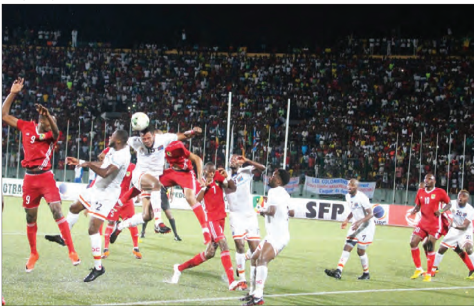
L'âpreté des débats était omniprésente en attaque comme en défense

croire qu'il s'agit d'une pluie spéciale sur commande afin de mouiller le travail obscur de l'adversaire! Cela persiste après plus d'un siècle d'intrusion du football chez nous.