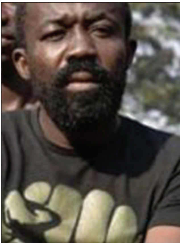
Alfred Yekatom Rhombot dit «Rambo»

Ancien caporal-chef de l'armée centrafricaine et chef anti-balaka, Alfred Yekatom Rhombot dit «Rambo» a été extradé, samedi 17 novembre dernier à la Cour pénale internationale (CPI) La Haye, aux Pays-Bas. Un mandat d'arrêt avait été déposé contre lui le 11 novembre 2018 pour crimes de guerre et crimes contre l'humanité qu'il aurait commis entre décembre 2013 et août 2014 à Bangui et dans l'Ouest du pays. Il avait été arrêté le 29 octobre à l'Assemblée nationale après avoir sorti son arme dans le palais du Parlement. Le rebelle surnommé «Rambo» était un chef de groupe armé très craint en Centrafrique.