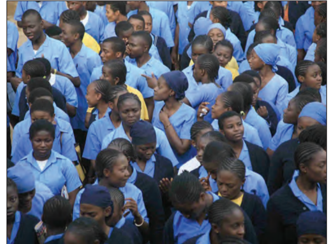
Les élèves kidnappés désormais libres

Les parents d'élèves témoignent que les ravisseurs arrivés