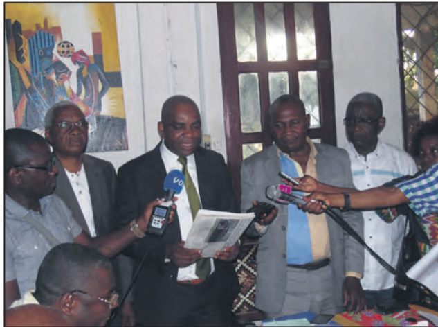
Le collège intersyndicale

grèves à répétition à l'Université Marien Nguabi ne sont pas la conséquence de l'autonomie financière, mais liées au mode de financement du fonctionnement de l'Université qui a montré ses limites. «Le budget de l'Université Marien Nguabi est déficitaire depuis près de 15 ans. Les grèves à n'en point finir observées n'ont pas toujours les mêmes causes. Seules celles de 2017 et 2018 portent essentiellement sur le paiement des salaires».