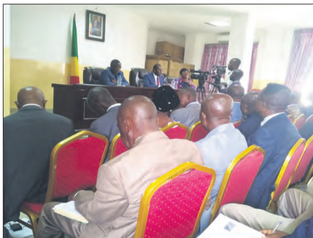
A la Mairie de Djambala: le ministre Pierre Mabiala expliquant la Loi foncière

sens de pédagogie et fermeté. Car une véritable révolution des mentalités va s'amorcer avec la loi nouvelle, qui n'apporte rien de révolutionnaire en soi, mais qui engage une autre manière de se comporter par rapport à sa terre ou à celle des autres. L'Etat y réaffirme son droit de regard, en prélevant sa taxe reconnue dans tous les pays sous forme numéraire. Ou, pour venir en aide aux fonciers qui ne peuvent pas payer, sous forme de prélèvement d'un espace minime. Pas question, donc, de rechercher des millions de francs pour payer son « impôt foncier » quand on possède des étendues de terre. Il suffit de le faire en cédant 5% de cette superficie à l'Etat qui délivre le titre foncier. Jusqu'ici, le Congolais croyait se mettre à l'abri des contrôles et des contestations en brandissant la seule attestation d'achat de sa parcelle ou de son ter-