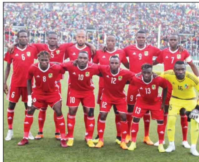
Les Diabls-Rouges accrochés par les Léopards

On s'apprête à achever les éliminatoires de la CAN 2019 qui aura lieu pour la première fois de l'histoire des phases finales en juin. On a joué la cinquième et avant-dernière journée le week-end dernier et la situation est loin d'être décanter dans plusieurs groupes.