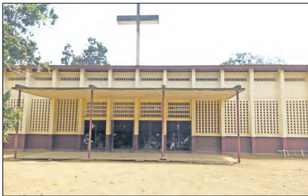
Une vue de l'église

Du point historique, Loudima était le relais des caravanes entre Loango et Brazzaville. Il fut tôt un poste important dans le trafic colonial et par conséquent dans l'évangélisation. En effet, la proximité de la voie ferrée à sept kilomètres, déplaça une grande partie de la population vers la gare. Ce qui donna naissance à Loudima Poste et Gare. La mission ayant suivi le mouvement des chrétiens vers la Gare, le presbytère et l'église de Loudima Poste construits en 1954, furent abandonnés en 1964.