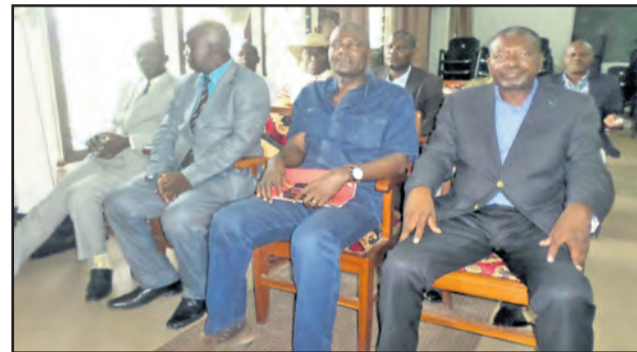
Une vue des syndicalistes

sur les autres revendications non résolues jusqu'à ce jour, notamment: le recrutement à la fonction publique des finalistes, bénévoles et prestataires de l'Enseignement dans les conditions requises répondant