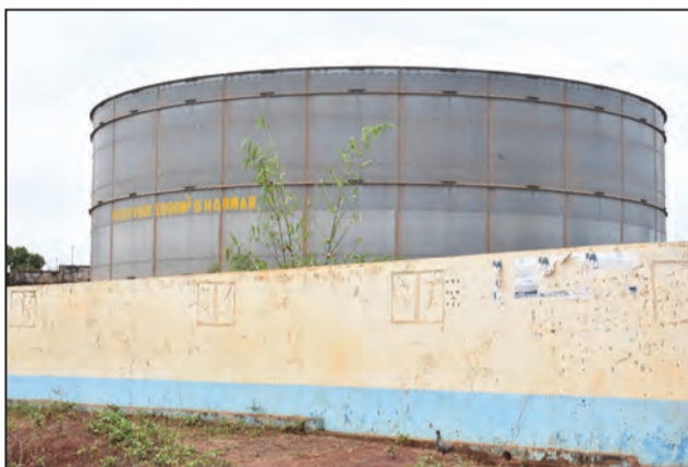
Le château d'eau d'Hammar

Selon les informations recueillies auprès des techniciens de La Congolaise des eaux, il ressort que les besoins en eau potable dans la ville de Dolisie sont estimés à