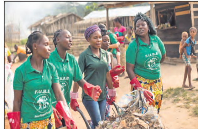
Pendant la salubrité

La communauté de Bomassa, dans le Département de la Sangha, a répondu à l'appel lancé par le Premier Ministre de la République du Congo, Clément Mouamba, pour s'attaquer au lancinant problème de l'insalubrité publique. Exhorté par les chants enthousiastes de l'Association des Femmes Unies de Bomassa pour la Biodiversité (AFUBB), tout le village s'est réuni le 1 er décembre pour retrousser les manches et nettoyer les rues de la localité.