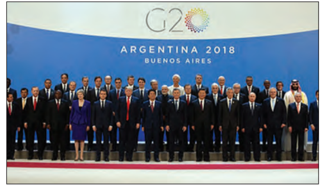
Les dirigeants du G20

Les dirigeants du monde du groupe des vingt ou G20 se sont réunis à Buenos Aires en Argentine vendredi 30 novembre et samedi 1 er décembre 2018. Le sommet s'est déroulé sur fond de protestations au sujet de la guerre commerciale entre les USA et la Chine.