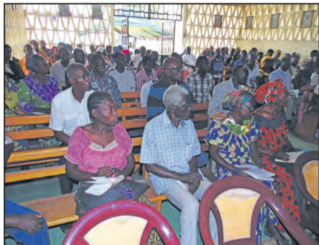
Les acteurs liturgiques et les communautés nouvelles

service dans l'Eglise. Mettant l'accent sur la prière et le service dans l'Eglise, les fi-