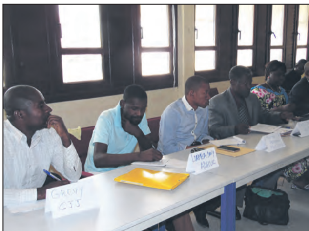
Les participants à la réunion de restitution

Sur le plan judiciaire, il a fait remarquer qu'il y avait une expression étouffée par la communauté dominante, l'éloignement des services de police, de gendarmerie et des parquets. En matière de santé, «on observe l'absence d'une politique de couverture santé chez les Autochtones,