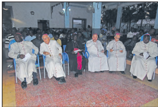
Les évêques du Congo suivant le concert

prière et l'amour. A rappeler que l'Association Afrika Telema (Afrique Lève-toi) a pour objectif de promouvoir