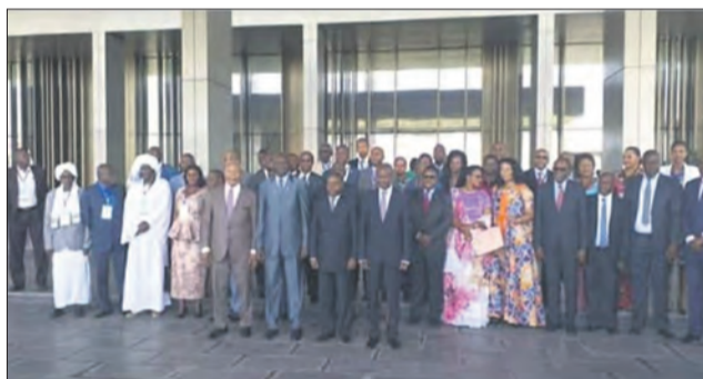
Les présidents des chambres posant avec les parlementaires

Ils ont débattu du budget exercice 2019-2020 de leur institution afin de lui donner les moyens nécessaires pour mener à bien ses missions. A rappeler que le FP-CIRGL vise neuf objectifs principaux. Il s'agit, entre autres, de servir de cadre de dialogue, d'échange d'expériences et de règlement des conflits au sein des parlements des pays membres de cette organisa-