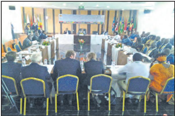
Les experts pendant la réunion