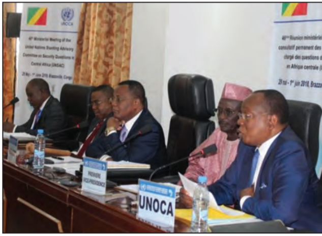
Le présidium à la 46 e réunion de l'UNSCAC

La 47 e réunion du Comité consultatif permanent des Nations Unies chargé des questions de sécurité en Afrique centrale (UNSCAC) se tient du 3 au 7 décembre 2018 à Ndjamen, au Tchad. Comme lors des précédentes sessions, celle-ci permettra de faire le point de la situation géopolitique et sécuritaire dans les onze pays membres : l'Angola, le Burundi, le Cameroun, la République centrafricaine (RCA), le Congo, la République démocratique du Congo (RDC), le Gabon, la Guinée équatoriale, le Rwanda, Sao Tomé et Príncipe, et le Tchad.