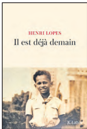
La couverture du livre

et codes, certains passages de ses écrits. Cette démarche cathartique rend transparente et plus intelligible son œuvre.