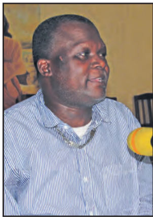
Eric-De-Marie dèles laïcs a dit l'orateur, « sont ceux qui, en tant qu'incorporés au Christ par le sacrement

Des antivaleurs, le conférencier a cité l'orgueil ou l'auto-suffisance comme refus de soumission aux supérieurs hiérarchiques qui créent un dysfonctionnement dans le