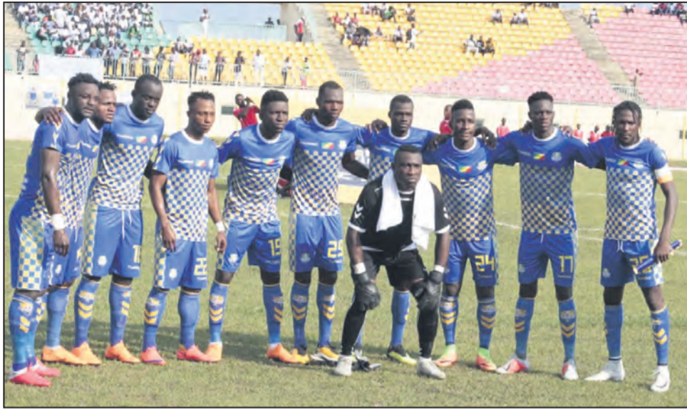
Les auteurs de la qualification épique aux dépens du Primeiro de Agosto

Il s'agit d'un coup de semonce que les Angolais ne prirent pas, semble-t-il, au sérieux. D'autant plus qu'en deuxième période, au fur et à mesure que les minutes s'égrenaient, ils avaient toujours leur qualification jusqu'à la 90e minute, théoriquement la fin de la partie. Il ne restait plus que cinq minutes du temps additionnel pour que les Angolais pavoisent. A la troisième de ces cinq mi-