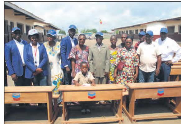
Photo de famille à l'école primaire 31 juillet 1968

Un élève, un table-banc» est une initiative entreprise par la société Chevron Overseas Congo Limited dans le cadre de sa responsabilité sociétale et son programme d'investissement social 2018 pour aider les établissements scolaires publics face à leur déficit d'équipement. A ce titre, un don de 1 000 tables-bancs a été fait à six écoles primaires de la ville de Pointe-Noire, à raison d'une école par arrondissement: 5 février 1979, 31 juillet 1968, Conférence Nationale, 15 août 1960, Samuel David Kouanga Makosso et Tchimbambouka.