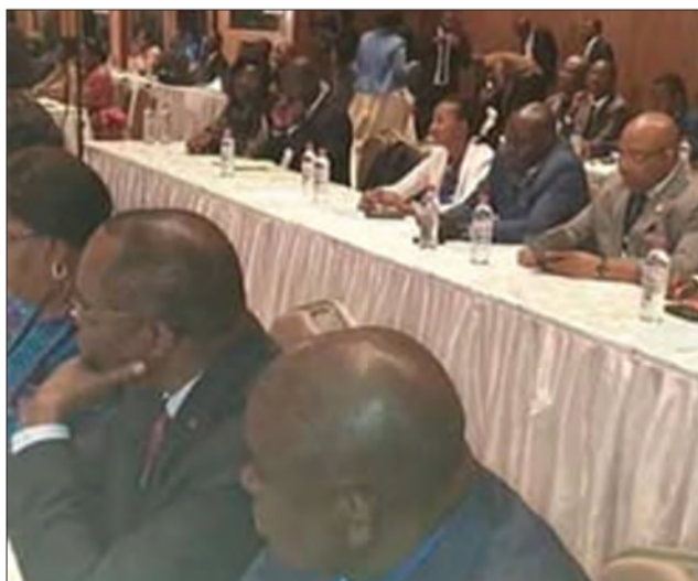
Les parlementaires et délégués présents à l'Assemblée

tion; de renforcer les capacités des membres ainsi que des fonctionnaires qui y évoluent. Le Forum des parlements appuie aussi les efforts des gouvernements dans la prévention et la résolution des conflits, tout en contribuant à la consolidation de la paix et la réconciliation nationale.