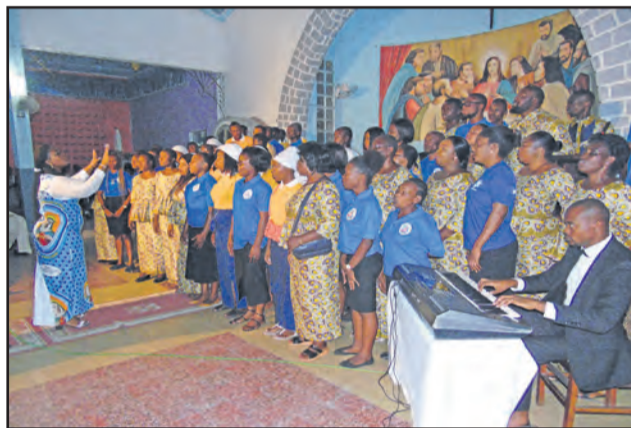
Le Chœur composé par l'ensemble des chorales à l'honneur