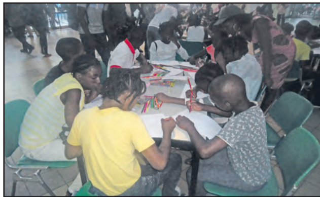
Des enfants s'exprimant par le dessin

l'enfant ouverte au public a fait suite à cette table ronde dans l'après-midi. Différents textes de loi portant sur les Droits de l'enfant et leurs contenus y ont été présentés et un zoom a été fait sur la situation actuelle en République du Congo. Pour mieux édifier le public à cet effet, un film de Garth Davis intitulé