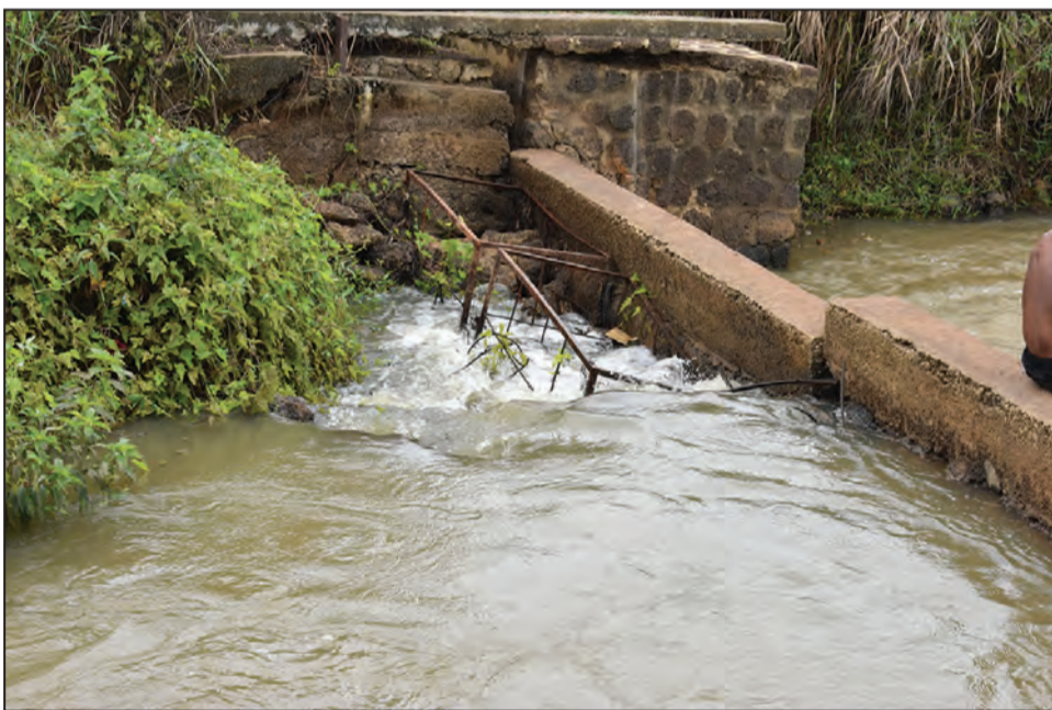
La digue rompue de la rivière Loubomo

Appels urgents pour la construction d'une nouvelle digue!