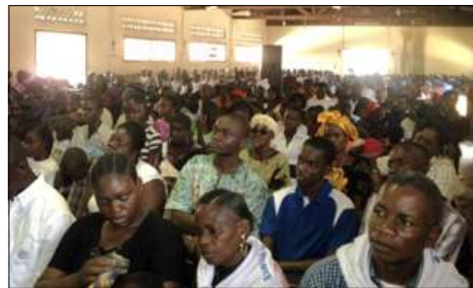
Une vue des fidèles.

téger notre association en la fortifiant de toutes les vertus morales et civiques. Nous existons depuis près de deux ans. Un enfant qui naît, qui marche,