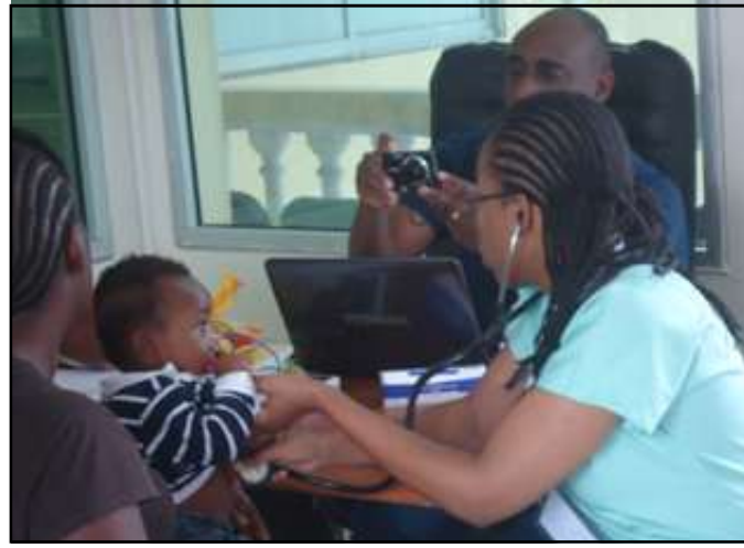
Les médecins examinant un enfant.

ration. «Ces interventions chirurgicales vont se faire par des médecins congolais et l'équipe de Jooko Cleft du Sénégal. Avant toute opération, le patient passera les examens tels que le N.f.s (Numération formule sanguine), le groupe sanguin, et la grasse sanguine. Ces examens vont permettre d'évaluer le taux d'hémoglobines. Au cas où les hémoglobines sont basses, le patient doit suivre un traitement gratuit d'une semaine, après une semaine, un contrôle sera fait