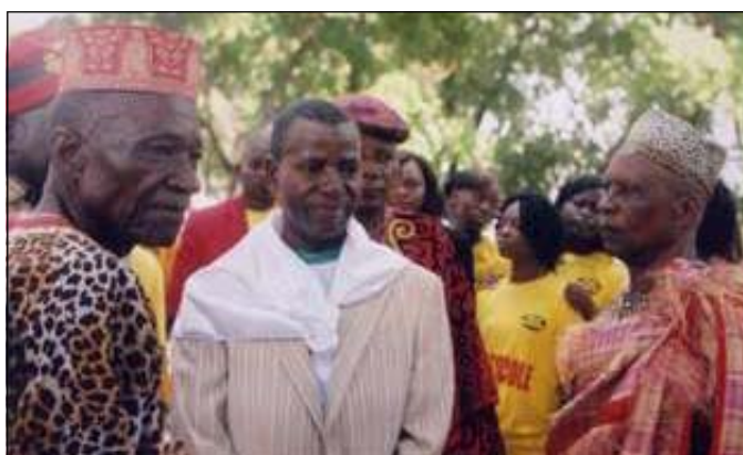
Le président de la Jumf entourés des sages.

nous sommes malades des maladies corporelles aussi, peut-être que vous pouvez faire entendre notre voix. Notre engagement, c'est un oui pour