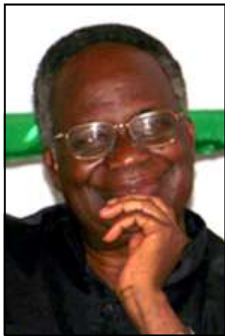
Par Dominique Ngoie-Ngalla.

bots, des forces qui ne sentent ni ne pensent, leur efficacité dépendant uniquement de l'adresse de l'homme à les manipuler? On ne sait pas trop. La seule chose, en revanche, qu'on sait d'observation, c'est que les religions auxquelles ces «mikissi» ont donné naissance n'ont pas pour but, comme dans les religions révélées, la connaissance, l'amour et le service d'un Dieu parfait vers lequel les fidèles doivent s'efforcer de tendre, dans un effort constant d'ascèse et de purification intérieure. Elles ne sont pas des organisations en recherche de spiritualité; elles n'exigent pas de leurs fidèles l'élévation de leur âme vers des réalités infinies. Elles sont juste des techniques, un ensemble de procédés pour s'ouvrir un accès à des forces invisibles et redoutables dont l'homme peut, cependant, se servir comme moyen d'action. Certaines de ces divinités sont, tels les «bissimbi» des Kongo, cruelles et agressives; la connaissance de leur psychologie et de leur caractère par l'homme l'aide à vivre avec elles sans trop de danger. Ainsi, l'homme qui passe dans les parages où se trouvent leurs habitacles, doit, s'il veut éviter qu'elles lui courent dessus, penser à se munir, pour les leur jeter, d'œufs, de poisson fumé ou de bananes mûres (bananes dessert). La faculté que possèdent ces divinités d'éprouver des sensations (ici la faim) et de les satisfaire, fait d'elles des êtres anthromor-