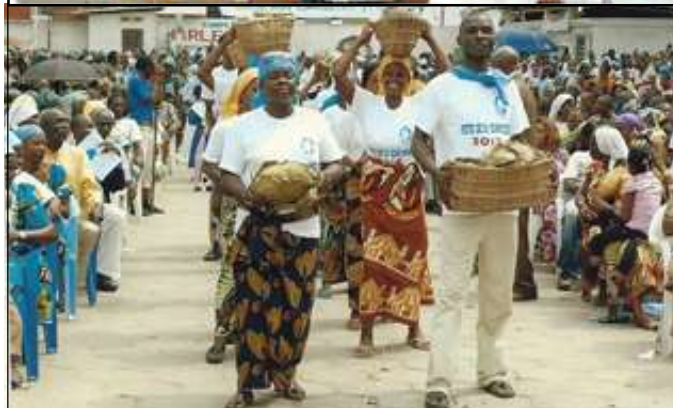
En haut: Mgr Miguel Angel Olaverri et les concélébrants; en bas: les chrétiens de Loulombo pendant la procession des offrandes.