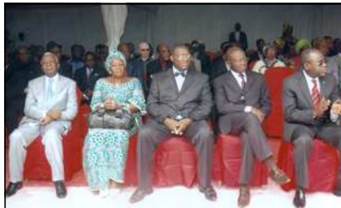
Les responsables du P.c.t pendant la cérémonie.

res à l'érection d'un siège digne. Du 25 février au 25 mai 2012, les Membres, les sympathisants et les partenaires sont appelés, dans un élan de cœur, chacun en fonction de son sta-