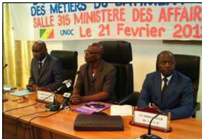
Une vue du présidium.