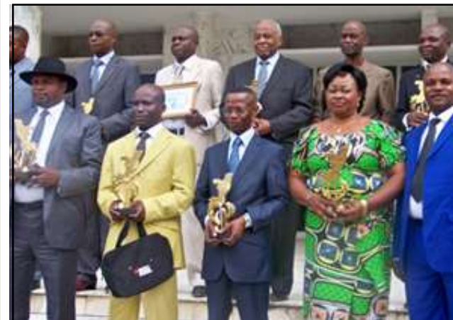
Une vue des lauréats avec le président du réseau.

Le réseau des journalistes africains pour la promotion et l'émulation du citoyen encourage, en effet, les Congolais, qui brillent par le bon exemple et le travail bien fait, c'est-à-dire des cadres, des humanitaires et autres agents exerçant leur tâche sans complaisance. Ils étaient 13 à recevoir les trophées, en dehors de ceux empêchés.