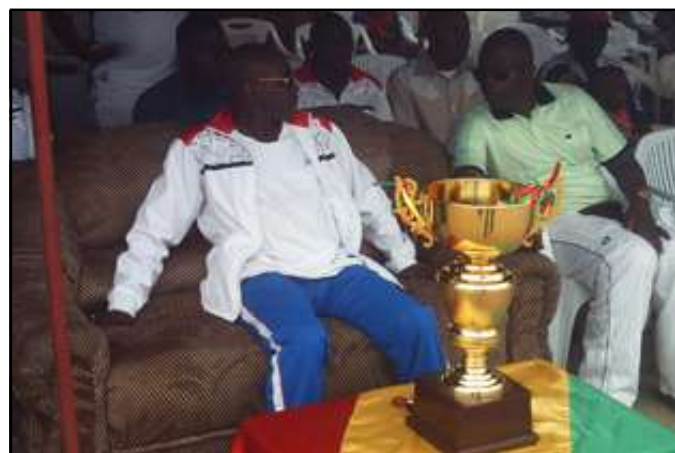
Le trophée remporté par Bana Révolution.