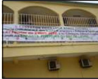
Une vue de la clinique Albert Leyono.