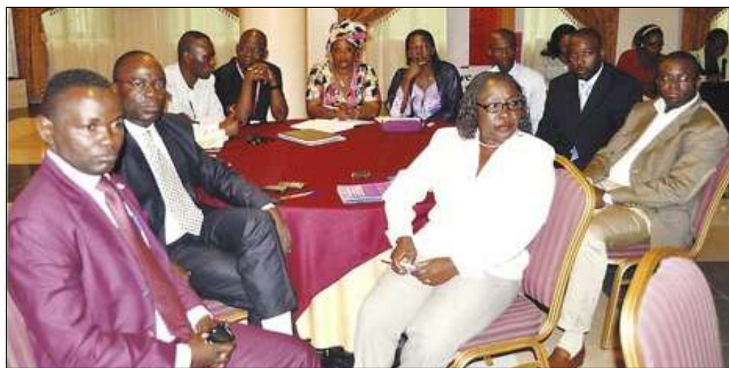
Une vue des participants à la conférence-débat.

conférencier a mis l'accent sur les modifications apportées, d'une part, au code général des impôts, d'autre part, aux textes non codifiés et a présenté, ensuite, les dispositions nouvelles.