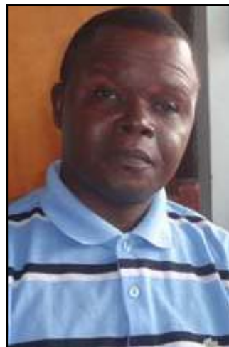
Par François Onday-Akiera.

L e 22 février 1972, le président Marien Ngouabi s'adresse au pays, à une heure matinale, depuis la station régionale de Pointe-Noire où il séjourne en visite de travail. On apprend que «des camarades combattants de deux formations de notre armée, en l'occurrence le bataillon d'infanterie et quelques éléments du bataillon du Groupement aéroporté (G.a.p) se trouvent dans une position opposée par rapport à l'ensemble des forces de l'Armée populaire nationale (A.p.n)».