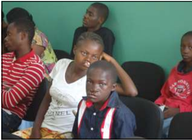
Les patients attendent d'être examinés.

pour, enfin, passer à l'opération. Ces examens sont faits en amont, pour éviter le risque d'hémorragie qui peut être dangereux pour la survie», a-t-il fait savoir.