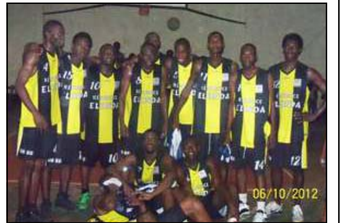
Les Diables-Noirs après leur victoire sur Inter Club.

Les faits semblent le confirmer: les Diables-Noirs seront, peut-être, champions de Brazzaville, cette année! Pourquoi ne pas y croire, quand ses deux rivaux les plus redoutables, CARA et Inter Club, aux prises avec eux, se sont effondrés, l'un après l'autre. En tout cas, ces derniers ont mis les pouces, sans qu'on ne trouve rien à redire.