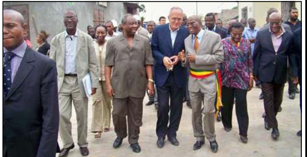
Le ministre d'Etat accompagné des autres membres de la délégation visitant la rue Bandza, à Poto-Poto.

Placé sous la tutelle administrative du Ministre de l'équipement et des travaux publics, et sous la supervision du Ministre de l'économie, du plan, de l'aménagement du territoire et de l'intégration économique, le PEEDU s'étendra sur cinq ans. Sa première phase s'est achevée, avec les travaux de réhabilitation des CSI et des écoles primaires à Brazzaville et Pointe-Noire, le pavage des ruelles dans les quartiers populaires et l'aménagement du site en proie à l'érosion, situé au quartier Massina, dans le 7 ème arrondissement de la ville capitale. Des Centres de Santé Intégrés réhabilités qui comprennent des laboratoires, des pharmacies, des salles d'accueil, de soins, des salles d'attente entièrement équipées en mobilier et appareillages sanitaires, avec un kit de médicaments et des consommables divers pour leur démarrage. Les écoles primaires réhabilitées sont équipées en table-bancs. Après la remise officielle, aux Autorités congolaises, des ouvrages réhabilités à Pointe-Noire, la semaine der-