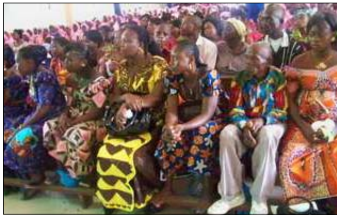
Une vue des nouveaux membres.

stipule: «A l'heure où Jésus passait de ce monde à son Père, il dit à Philippe: je suis avec vous depuis si longtemps,