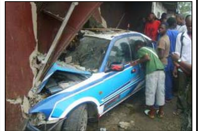
Accident d'un taxi de Pointe-Noire à Dolisie.

On ne le dira jamais assez, les accidents de voies publiques demeurent un véritable casse-tête pour les usagers. Hormis les départements de Brazzaville et Pointe-Noire où on enregistre le plus grand nombre des accidents de voies publiques dans l'année, le département du Niari n'est pas non plus épargné. Le nombre d'accidents de voies publiques enregistré par le B.c.a (Bureau central des accidents), dans ce département, en 2011, s'élève à 214, dont 15 mortels, 40 avec des blessés graves, 46 avec des blessés légers, 34 avec des dégâts matériels importants, et 79 avec des dégâts matériels moins importants. Ces accidents se sont produits avenue de la révolution, laquelle a battu le record, avec un total de huit accidents, suivie de l'avenue de l'indépendance, six accidents, la route nationale n°1 entre Les Bandas et Dolisie occupant la troisième place, avec 4 accidents et, enfin, la route nationale n°3 communément appelé route du Gabon, avec 4 accidents mortels.