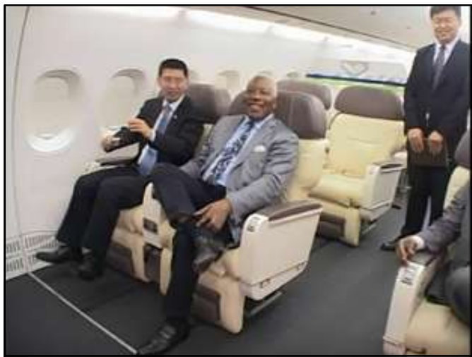
Ici, dans un avion fabriqué en Chine.

précisément en Afrique. Raison pour laquelle une délégation de cette société effectuera une visite au Congo.