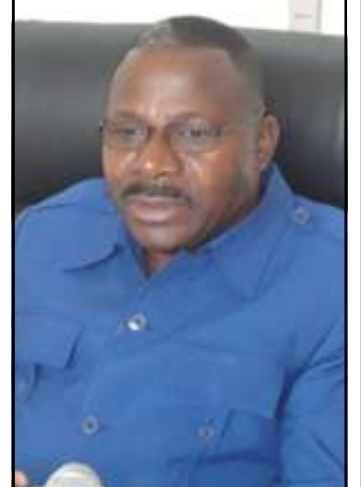
Général de brigade Paul Victor Moigny.

Les sinistrés locataires, a-t-il rassuré, qui n'ont pas encore perçu leur allocation d'urgence, continuent d'être dans les sites, jusqu'au moment où leur situation sera