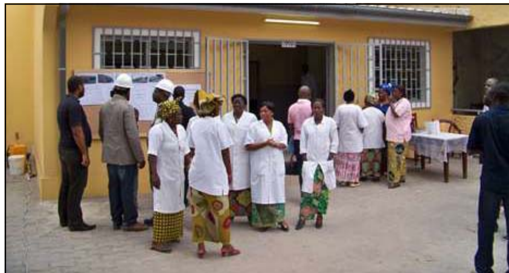
Le Centre de santé intégré de Poto-Poto réhabilité.

a, ensuite, mis le cap sur Baongo, le deuxième arrondissement, pour la visite de l'Ecole primaire de Mbama, située vers la case De Gaulle, ainsi que le CSI au quartier 24 (dénommé Karin Johnson) et l'Ecole primaire Djoué Camp,