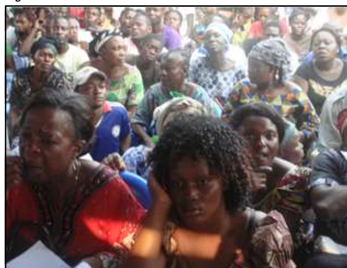
La foule très attentive au discours du député.