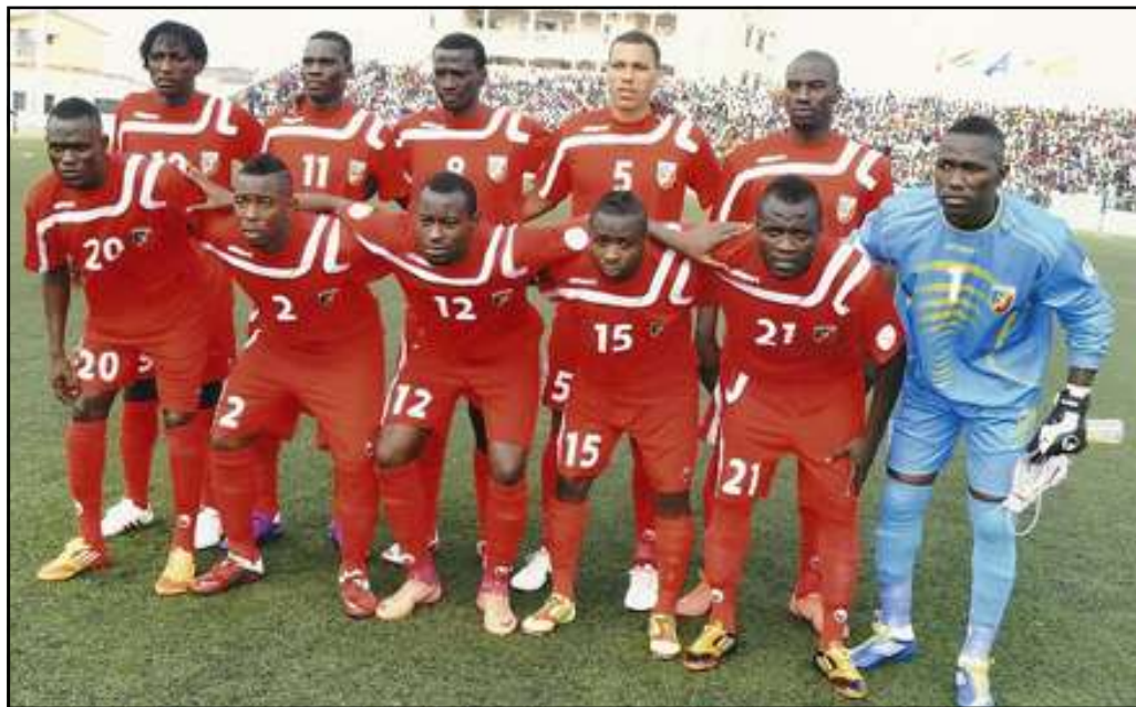
La formation du Congo victorieuse du Niger à Pointe-Noire.

Après les citrons, le même scénario s'est répété. Les Diables-Rouges, poussés par le public, n'arrivaient toujours pas à violer la cage nigérienne. Pourtant, que