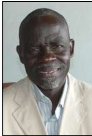
Par Simon Nanitelamio.

La loi scolaire n°25/95 du 17 novembre 1995 qui régit notre système éducatif stipule, au chapitre relatif aux programmes et diplômes: «Les programmes sont élaborés par le Ministère de l'éducation nationale, en collaboration avec les autres ministères et partenaires concernés» (article 25); «Les examens d'Etat sont organisés par le Ministère de l'éducation nationale qui, seul, est habilité à délivrer les diplômes d'Etat. Les élèves des établissements publics et ceux des établissements privés agréés sont soumis aux mêmes examens d'Etat» (article 26). Ils sont ainsi la sanction indispensable des études, garantie par l'Etat.