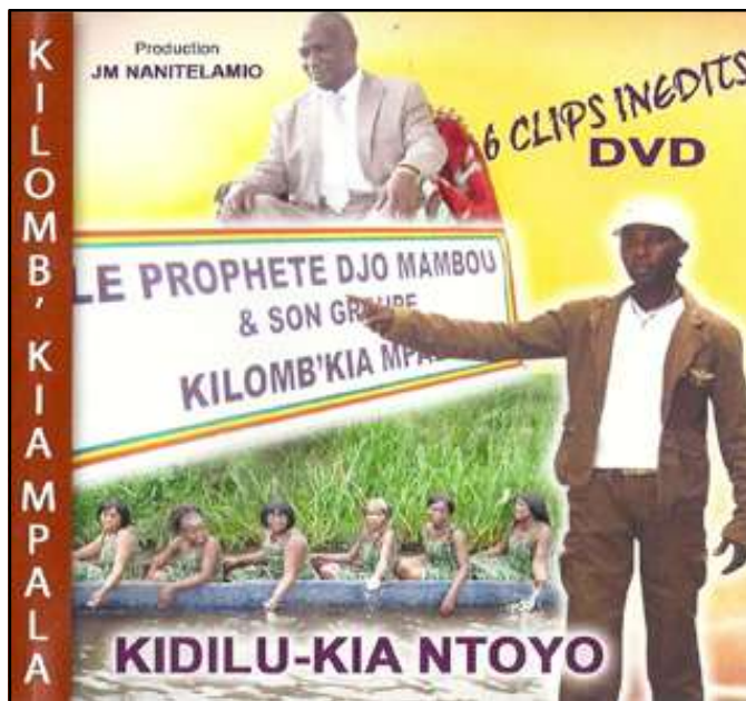
La pochette du Dvd.