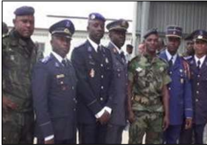
Les stagiaires désormais nantis des nouvelles connaissances.

cette formation, la direction des études de l'E.n.v.r-G.t a affirmé: «Il n'y a pas eu de problèmes majeurs au cours de la formation, en matière d'approvisionnement en carburant. Des stagiaires ont affiché un excellent état d'esprit. Ils ont fait état de belles qualités militaires et maintenu, durant leur formation, une saine ambiance qui leur a permis de tisser des amitiés durables entre eux. C'est au plan mécanique où des problèmes ont été enregistrés, les bio-bétonnières ayant retardé le déroulement du chantier de restitution des travaux publics.» Quant à la formation suivie par les stagiaires, elle a été donnée par des instructeurs congolais, appuyés par des militaires français, à trois occasions, précisément lors des modules spé-