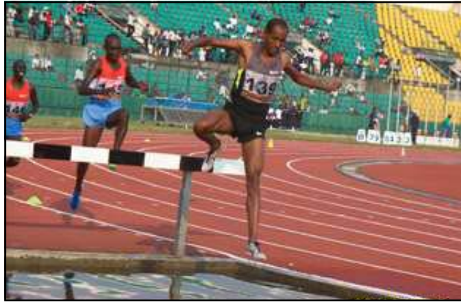
Le 3000 m steeple: une course qui a mis les fourmis dans les jambes du maigre public.

Les éditions passent et ne se ressemblent pas. Chaque édition a sa particularité. Il y a des éditions qui connaissent un grand succès populaire. D'autres, un succès mitigé, comme celle de cette année. Et pourtant, le plateau était très relevé et le panel des champions présentés a brillé, pour certains, aux récents mondiaux en salle ou aux mondiaux juniors, pour d'autres, aux jeux universitaires américains, aux précédents meetings ou aux derniers Jeux africains, voire aux derniers champions d'Afrique. Le public ne s'est pas déplacé en masse. La concurrence de l'Euro 2012 l'a, peut-être, poussé à en suivre les