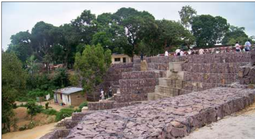
Le site en proie à l'érosion, à Mfilou a été protégé.

de Brazzaville et de Pointe-Noire et améliorer la gestion du secteur de l'eau en milieu urbain; - développer une stratégie pour la réforme du secteur de l'élec-