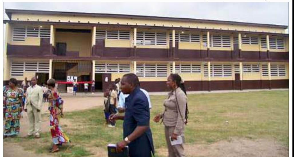
L'école primaire de Mbama réhabilitée.