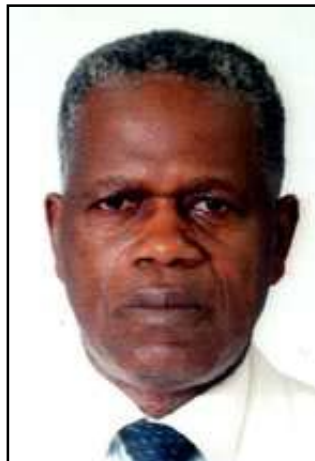
Par Jean-Louis Kombo.

Première halte: le village de Yaka-Yaka, repère des «Très