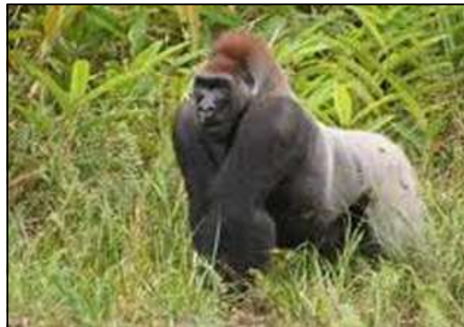
Un gorille, dans la réserve de Lésio-Luna.

ancien volcan, voire entonnoir formé par la chute d'une météorite. Considéré comme un site sacré, le cirque a été longtemps interdit au public. A 25 km, le village de Makana est réputé pour sa vannerie artistique et pour sa sorcellerie. Une légende raconte que les sorciers de cette contrée avaient voyagé à bord d'un avi-