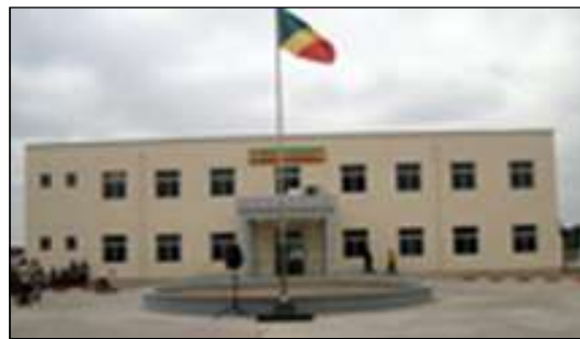
Le siège de La Nouvelle République.

de presse ainsi qu'à de nouvelles capacités de production et de commercialisation. Selon lui, «La Nouvelle République» doit jouer, dorénavant, le rôle de locomotive de la presse congolaise, en commençant par organiser ses ressources humaines et à les ordonner, à déterminer ou à redéterminer les cré-