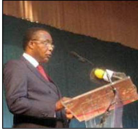
Le président Sassou Nguesso.

Après avoir rappelé les investissements importants dans le domaine de l'eau et de l'électricité, le président Denis Sassou Nguesso a annoncé qu'en faveur de l'année de l'électricité, «il est prévu l'élaboration d'un tarif social d'électricité adapté aux capa-