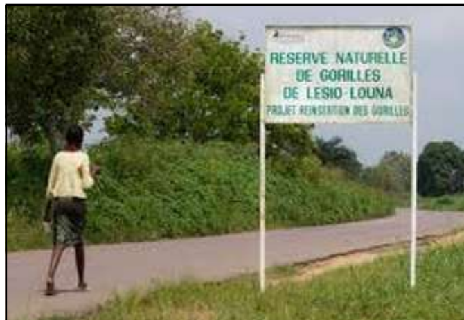
Un panneau annonçant la réserve de Lésio-Luna: l'éco-tourisme est une réalité au Congo.

fâchés». Ce groupe de danseurs et de musiciens déguisés en vieillards, est très en vogue. Il a l'habitude de se produire le dimanche, dans une buvette en plein air où un ballet comique attire les touristes en provenance de Brazzaville. Du carrefour de Nganga-Lingolo, à 11 kilomètres de la capitale, à gauche, sur la direction du fleuve, au bout de trois à quatre kilomètres apparaît. L'église catholique de Linzolo.