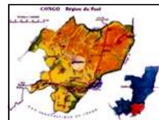
La carte du département du Pool.