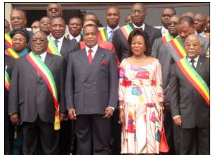
Année de l'électricité et de la santé, 2012 est bénéfique aux Congolais: prix social de l'électricité, assurance-maladie universelle... (P. 3)

Denis Sassou Nguesso met l'accent sur la politique sociale