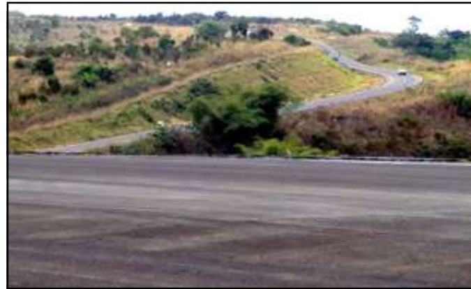
Une vue de la route nationale n°1 à partir de l'héliport de Kinkala.

De Linzolo, la route conduit à Mbanza-Ndounga (53 Km) puis à Kimpandzou (63 km). De là, une piste malheureusement non entretenue mène aux célèbres chutes de Loufoulakari. Dévalant de larges dalles de grès, les cataractes, coupent l'estuaire de la Loufoulakari,