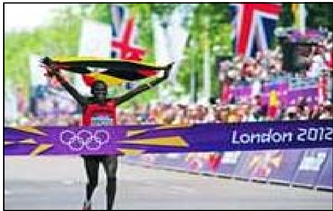
L'Ougandais Kiprotich a remporté la dernière épreuve, le marathon masculin.

La Chine, avec seulement 87 médailles, dont 38 en or, était partie tambour battant dans cette Olympiade, avant de perdre de la vitesse. Le comparatif avec les Jeux de Pékin est cruel: en 2008,