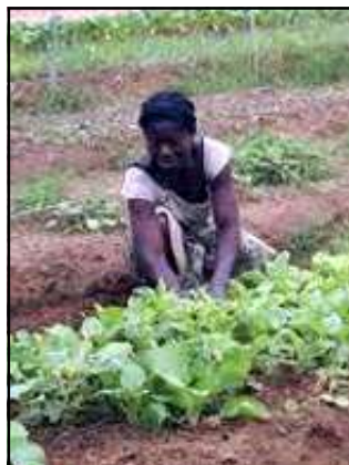
Le Pool est un département essentiellement agricole.