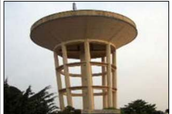
Apporter l'eau potable à plus d'un million de citoyens.

Dans le cadre de la mise en œuvre du P.e.e.d.u (Projet eau, électricité et développement en milieu urbain), il a été décidé de recruter un opérateur économique privé spécialisé en eau, en vue d'accompagner la S.n.d.e (Société nationale de distribution d'eau) dans son processus de réformes. Après un avis d'appel d'offres, c'est la société française Veolia qui a été retenue. A travers ce partenariat, la multinationale française, leader mondial des services collectifs dans les domaines de l'eau, de l'énergie, de la gestion des déchets et des transports, va apporter son expertise pour améliorer les performances techniques et financières de la S.n.d.e, pour apporter l'eau potable à plus d'un million de citoyens dans les villes de Pointe-Noire et Brazzaville.