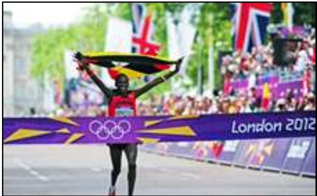
L'Ougandais Kiprotich a remporté la dernière épreuve, le marathon masculin. (P. 16)

Les Etats-Unis grands vainqueurs, l'Afrique en déclin!