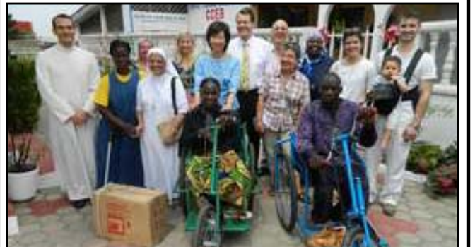
Photo de famille des donateurs et bénéficiaires du don.