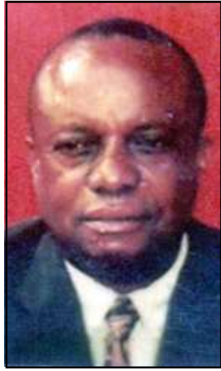
Par A. Bemba-Pokat.

Face à une telle tragédie sociale, quelques solutions, parmi tant d'autres, sont à suggérer. Et, c'est une préoccupation de tous. A ce propos, il convient