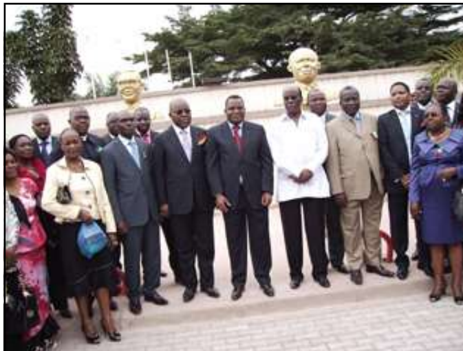
Photo de famille devant les bustes.