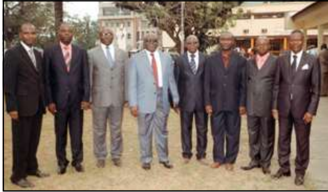
Quelques enseignants chercheurs.

rait judicieux que la Faculté des sciences économiques qui a été absente, marque plus d'intérêt aux C.c.i du Cames; il en est de même de l'E.n.a.m qui, en outre, doit redoubler d'efforts pour améliorer ses performances. Le taux de candidats inscrits obtenu (78,4%), bien que satisfaisant, est inférieur à ceux des trois dernières années, lesquels varient entre 82 et 89%», a-t-il déclaré. Pour lui, la diminution du taux de candidats inscrits résulte, dans 73% des cas, d'une insuffisance