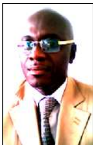
Par annicet Cyriaque Nassy Pratt.

À u moment où la communauté internationale s'apprête à développer des réflexions approfondies pour adapter les économies face aux nouvelles exigences de la mondialisation, certains pays africains, comme le Congo, se contentent de faire davantage preuve de médiocrité dans l'organisation des élections, en tentant de mettre en place un véritable chantier pour une institutionnalisation de la fraude électorale. Ce sont, sans aucun doute, des manœuvres de conservation de pouvoir, au mépris des recommandations de l'Organisation internationale de la francophonie (O.i.f). Les élections législatives de 2012, dans le département de Pointe-Noire par exemple, constituent, naturellement, une illustration manifeste. A l'instar des multiples irrégularités et dysfonctionnements constatés, face auxquels la commission chargée de l'organisation des élections, la Conel, semble impuissante, les pouvoirs publics de Brazzaville s'obstinent à passer à côté des principales recommandations de l'O.i.f, pour une bonne pratique de la démocratie, notamment l'uniformisation et la clarification des textes juridiques applicables aux élections. Ces recommandations sont énumérées dans un rapport de l'O.i.f de 2004, intitulé: «Etat des pratiques de la démocratie, des droits et des libertés dans l'espace francophone». La loi n°9-2001 du 10 décembre 2001 a été, comme on le sait, modifiée et complétée par la loi n°5-2007 du 25 mai 2007, pour respecter, en toute évidence, ces principales recommanda-