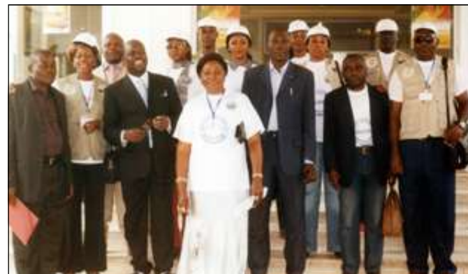
Des observateurs du Fosocel.

-la monopolisation à la limite scandaleuse, des médias d'Etat par les candidats du parti au pouvoir lors du premier tour; -l'inapplication déconcertante