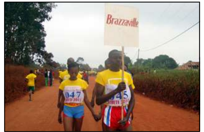
De jeunes athlètes lors du semi-marathon de Sibiti, en 2011.

notre tour? Cette fois-ci, comme on l'a annoncé, officiellement, que le 54 ème anniversaire de l'indépendance du Congo va se dérouler à Sibiti, dans le département de la Lékoumou, nous sommes très heureux. Nous pensons que c'est une bonne occasion rêvée pour l'installation des infrastructures de base dans notre département. Personnellement, je me bats, toujours, pour l'électrification de la Lékoumou. Un branchement pourrait se faire à partir de Loudima ou de Moukoukoulou.