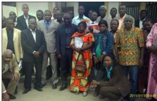
Photo de famille au terme des travaux.

ce que si les professionnels de la communication ont acquis les connaissances nécessaires pour jouer leur rôle, notamment dans la mise en œuvre des stratégies d'adaptation et d'atténuation des changements climatiques. C'est à ce titre que le Carpe a contribué au renforcement des capacités des journalistes dans la maîtrise des questions environnementales. Au cours des travaux, les participants ont suivi une série d'exposés: «Informations sur les mots clés en matière de Redd+: la forêt, la déforestation, la dégradation forestière et les liens entre la forêt et les changements climatiques», «Redd et Redd+: genèse, enjeux et état d'avancement du processus en République du Congo», «Approche de stratégie de commu-