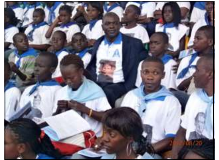
Anatole Collinet Makosso posant avec les boscovites.

Le Ministère de l'éducation civique et de la jeunesse, en partenariat avec le Groupe international «Les amis de Don Bosco», a organisé, le 20 août 2012, une visite à Kinkala, chef-lieu du département du Pool, au profit de quatre cents boscovites. Cette visite est intervenue deux semaines après les colonies de vacances qui ont eu lieu à Dolisie (département du Niari), dans le cadre de la célébration du 30 ème anniversaire du groupe «Les amis de Don Bosco».