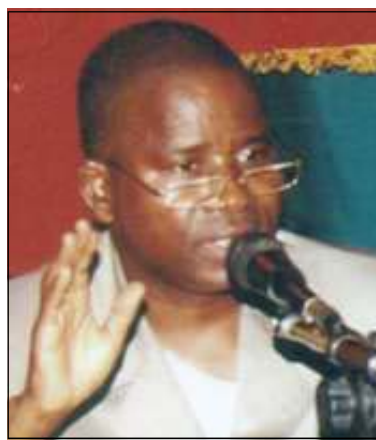
Les responsables des deux partis ont parlé des élections législatives. (Page 3)