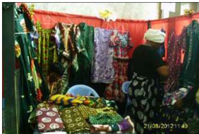
Une vue d'exposition des produits des femmes.

«Promouvoir les compétences et talents des femmes dans tous les domaines d'activités», tel est le thème du premier Salon de la femme, qui se tient du 21 au 24 août 2012, au Palais des congrès, à Brazzaville. Une initiative du Ministère de la promotion de la femme et de l'intégration de la femme au développement, soucieux de valoriser les œuvres féminines dans tous les domaines. Ce salon réunit une centaine de femmes exerçant plusieurs activités spécifiques. La cérémonie d'ouverture s'est déroulée sous la houlette de Mme Madeleine Yila Boumpoto, ministre de la promotion de la femme et de l'intégration de la femme au développement, en présence de Benoît Moundélé Ngollo, préfet de Brazzaville, et d'Eloi Kouadio IV, représentant résident adjoint du Pnud (Programme des nations Unies et pour le développement).