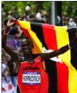
Stephen Kiprotich (Uganda).

aux J.O de Londres, en commençant par l'athlétisme.