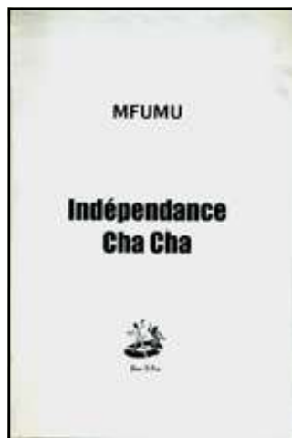
La couverture du livre.

La musique congolaise, dans son ensemble, se porte mal. Le jugement de l'auteur à ce propos est assené sans hésitation aucune: «La musique congolaise est, malgré tout, malade, malade de ses musiciens, une