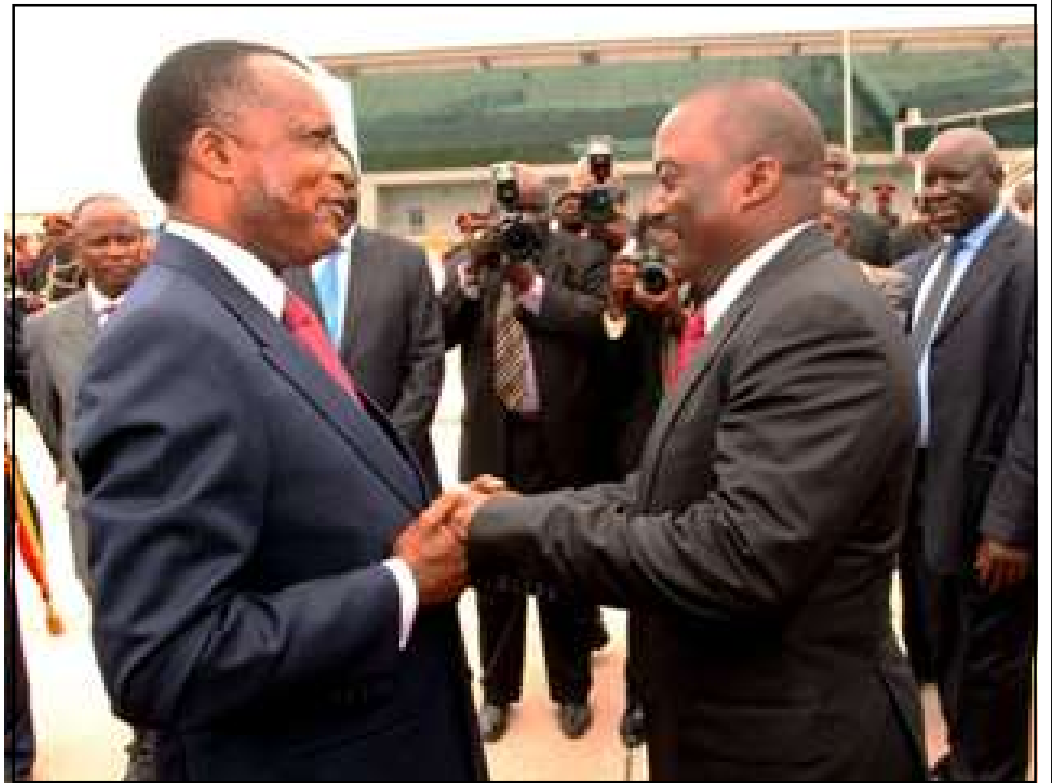
Denis Sassou Nguesso accueillant Joseph Kabila à l'aéroport d'Ollombo (Page 3)

Brazzaville et Kinshasa amorcent le réchauffement de leurs relations