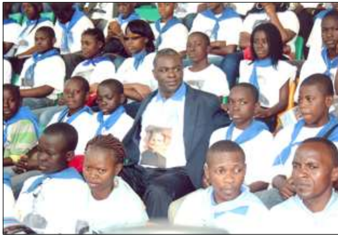
Le ministre Anatole Collinet Makosso entouré des boscovites.

Pendant la colonie, les enfants ont eu droit à des conférences et des entretiens donnés par les visiteurs. La formation spirituelle a été en grande partie ponctuée par la célébration eucharistique. A cela s'ajoute la spiritualité de Don Bosco qui a, toujours, fait l'objet de partage