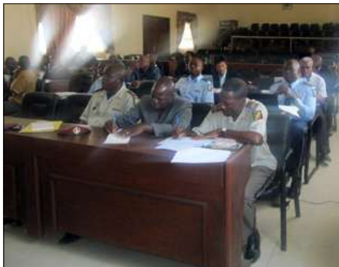
... au cours de la rencontre.

les braconniers, conformément aux dispositions de l'article 110 alinéa 2 et 3 de la loi 37-2008 du 28 novembre 2008 sur la Faune et les