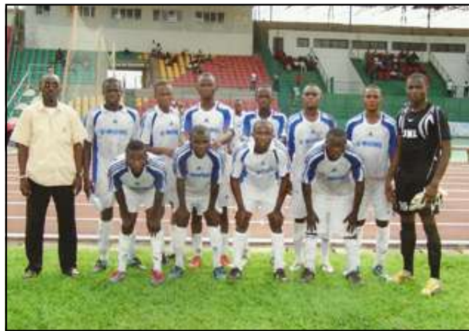
La formation de Saint-Michel de Loukolela, vainqueur d'Inter Club, à Massamba-Débat.

Cela étant, mercredi 12 septembre a démarré la 19 ème journée, dans le groupe A. Avec ce qu'on aurait pu prendre pour des joutes. Il n'en a pas été question, bien au contraire.