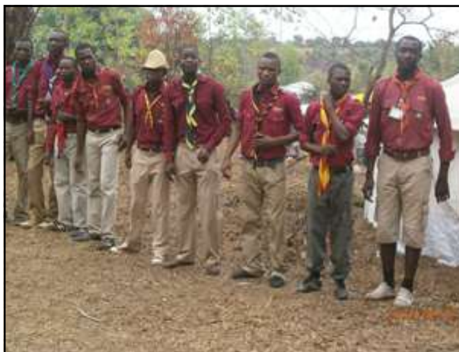
Une vue des scouts.

d'ajouter: «Nous avons un autre combat, c'est de faire en sorte que la jeunesse chrétienne croyante, en général, et la jeunesse scout, en particulier,