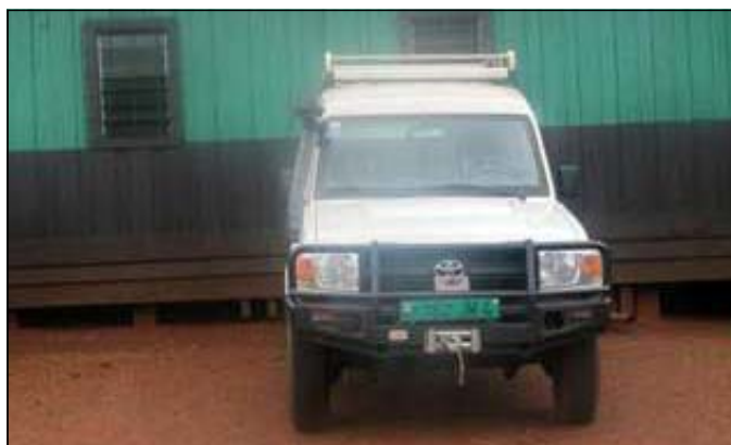
Le véhicule 4x4 Toyota Land Cruiser.

renforcement de l'application de la loi sur la conservation de la faune dans les Ufa (Unités forestières d'aménagement) de Tala-Tala et de Jua Ikié. A titre de rappel, depuis quatre ans, les trois pays (Cameroun, Congo et Gabon) sont bénéficiaires d'un projet d'une durée de sept ans, financé par le Fem (Fonds pour l'environnement mondial) et le P.n.u.d (Programme des Nations unies pour le développement), pour un montant de plus de dix millions de dollars américains. Ce projet est intitulé «Tri-national