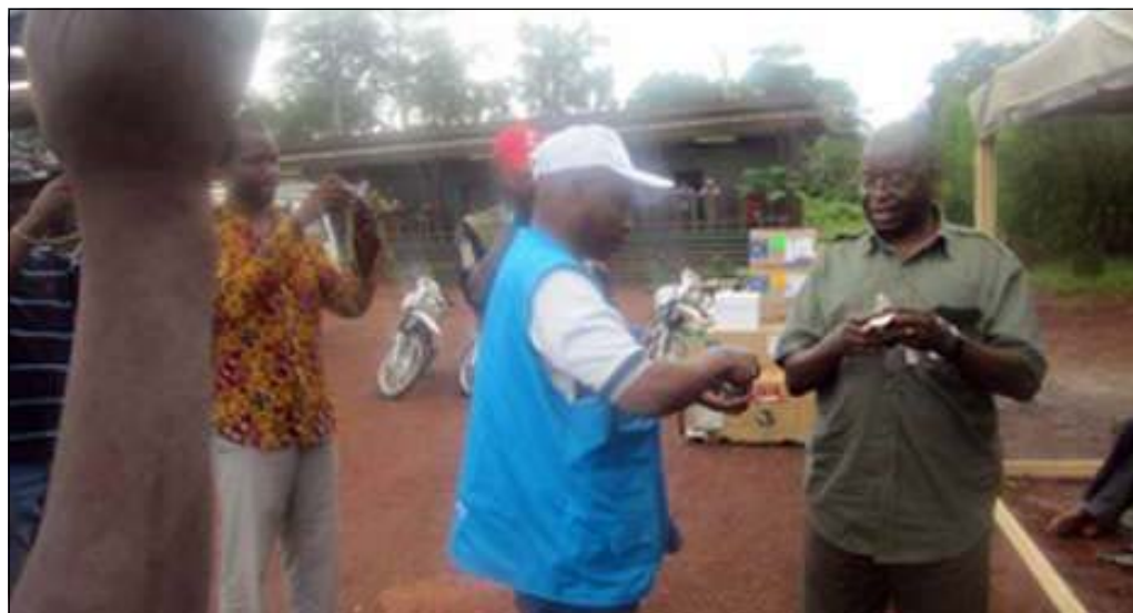
La remise symbolique du don.

Le Congo, a-t-il souligné, n'est pas épargné par ce phénomène qui menace de diminution, certaines populations fauniques. L'objectif général de ce don est de contribuer à la réduction du braconnage de la faune sauvage et, de façon spécifique, au