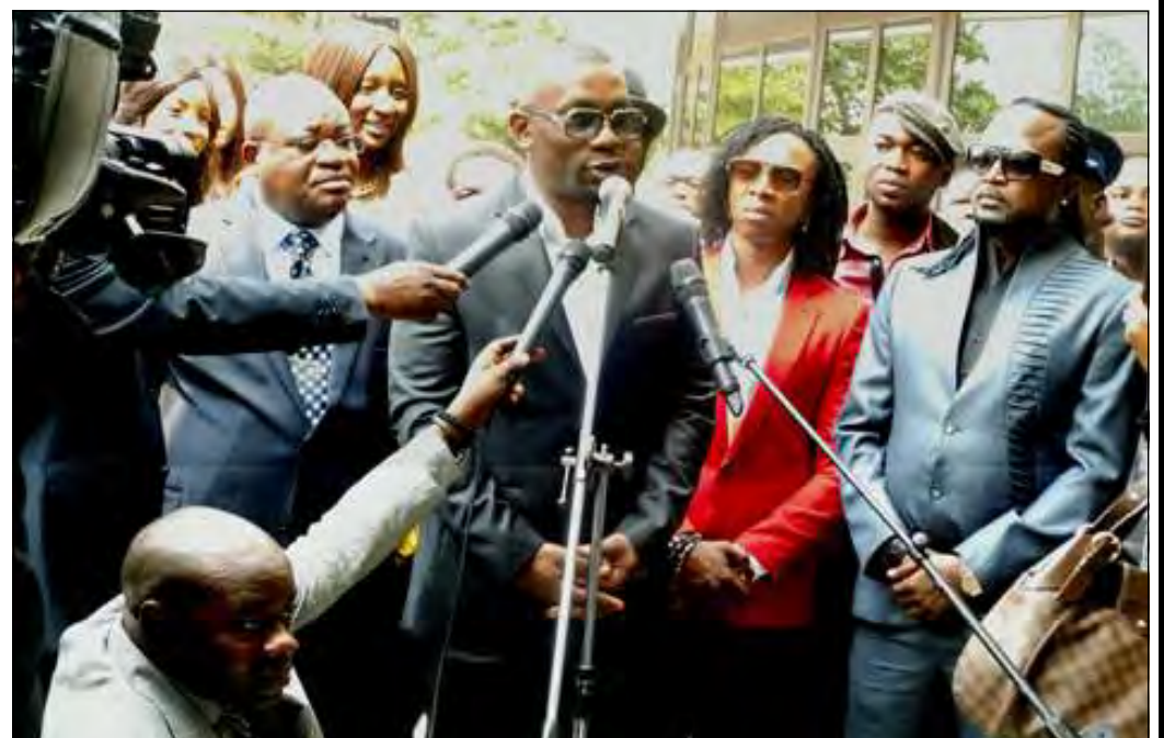
Le rappeur Passi (au milieu), porte-parole des artistes, lors de leur réception par le chef de l'Etat.