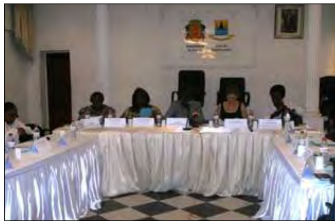
Les participants pendant les travaux.

déjà réuni deux fois. La première réunion a eu lieu en mars dernier à Pointe-Noire. Elle a regroupé les autorités administratives et sanitaires locales. Durant ces assises qui se sont déroulées dans la salle de mariage de la mairie de Pointe-Noire, des réflexions ont été menées sur la facilitation de