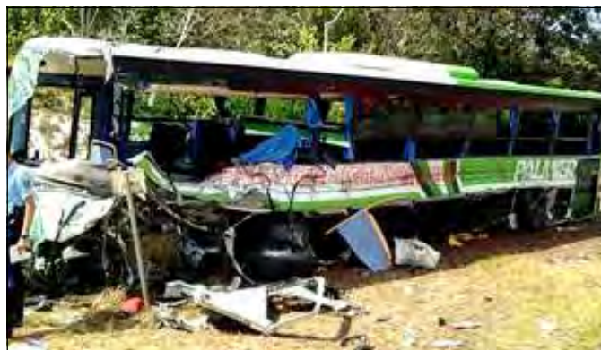
Le bus qui transportait les jeunes de France, irrécupérable.