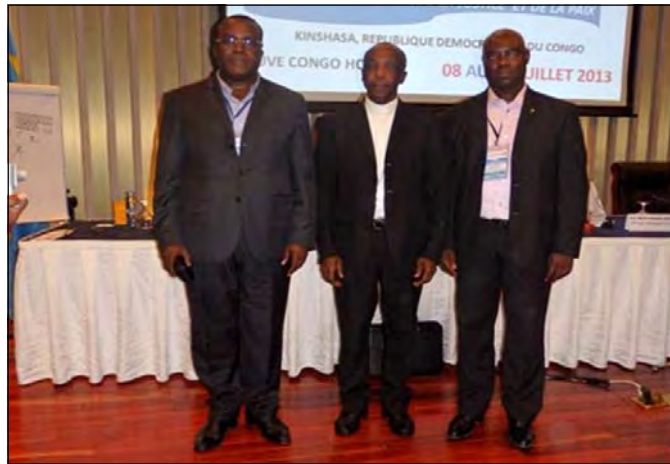
Mgr Portella entouré des abbés Mesmin Massengo (à g.) et Blaise Martin Makiza.

Du 8 au 15 juillet 2013 s'est tenue à Kinshasa, en République Démocratique du Congo, la 16 ème assemblée plénière du Sceam (Symposium des conférences épiscopales d'Afrique et Madagascar), sous le thème: «L'Eglise-Famille de Dieu en Afrique au service de la réconciliation, de la justice et de la paix». Le Fleuve Congo Hôtel de Kinshasa a servi de cadre aux cérémonies d'ouverture et de clôture ainsi qu'aux travaux de séance et aux ateliers. Les messes d'ouverture et de clôture ont eu lieu respectivement, à la paroisse Sacré-Cœur de Kinshasa, le mardi 9 juillet et au stade des Martyrs, le dimanche 14 juillet 2013. A l'issue de cette assemblée, le bureau exécutif du Sceam a été renouvelé, Mgr Louis Portella Mbuyu, évêque de Kinkala, président de la C.e.c (Conférence épiscopale du Congo) et de l'Acerac (Association des conférences épiscopales de la région de l'Afrique centrale) a été élu premier vice-président.