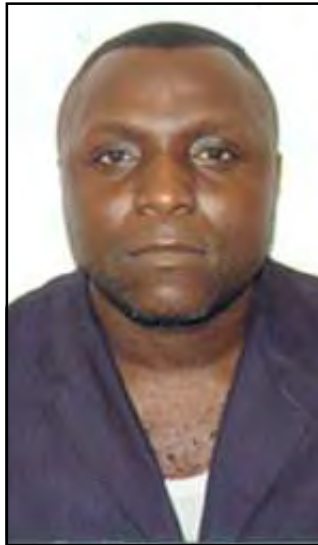
Par Magloire Senga.

tre pays. Ils ont facilement accès dans nos casernes, bases ou camps militaires, sous prétexte qu'ils y déposent tel client qui y travaillerait. Ils ont accès aux aéroports, ports et ils circulent même aux abords de la présidence de la République, sans contrôle. Il n'est pas rare de voir que de tels chauffeurs utilisent une voiture pendant la journée et une autre la nuit, sans que cela n'attire l'attention de quiconque. Mieux, certains ont, sous leurs sièges, des plaques d'immatriculation différentes, qu'ils peuvent remplacer, de sorte que la même voiture peut porter le même jour et à des heures différentes, des plaques d'immatriculation distinctes. Ce grave laisser-aller et laisser-faire peut être source d'insécurité, telle que l'atteinte à la sûreté nationale, le trouble à l'ordre public, le terrorisme, etc. S'agissant des hauts fonctionnaires de l'Etat qui s'investissent dans le secteur du transport en commun, ils jouissent parfois de passe-droit. Aucun policier de la route ne peut verbaliser un chauffeur de taxi appartenant à un officier supérieur ou général, sans recevoir de blâme et même de menaces. Même si le policier constate la présence d'armes de guerre par exemple dans le taxi, il sera impuissant de l'arrêter ou d'alerter sa hiérarchie sur l'éventualité d'une infraction ou d'un coup de force contre les institutions prêt à se commettre, car, à ce moment-là, son chef, l'officier supérieur ou général, sera juge et partie. Les noctambules attentifs qui