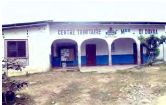
Le centre trinitaire Mgr Di Donna.

En effet, depuis belle lurette les différents quartiers de la Maison d'arrêt de Brazzaville n'étaient plus approvisionnés en eau potable, à cause du délabrement du premier réseau d'adduction; un réseau aussi vieux que la maison elle-même. Grâce donc à ce financement de l'Union européenne, l'aumônerie catholique a pu faire ins-