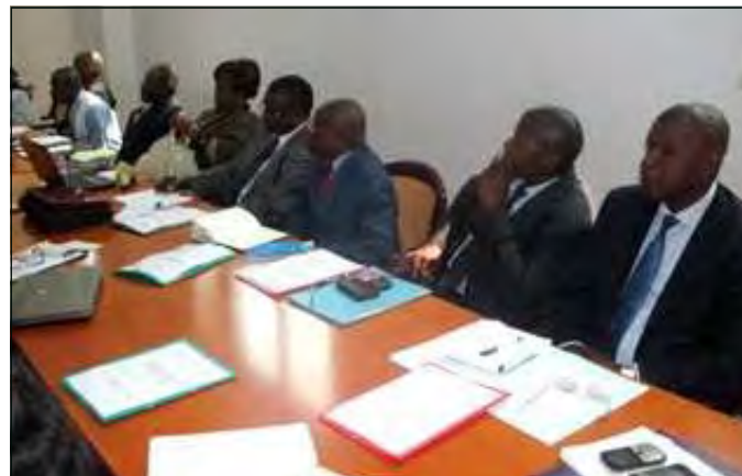
Vue partielle des directeurs des études et de la planifications.

Pendant quatre jours, les directeurs des études et de la planification des 38 départements ministériels ont échangé les