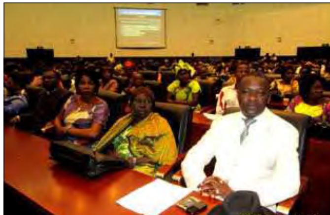
L'assistance composée en majorité des enseignants.

pédagogiques, valoriser l'utilisation de nouvelles technologies, soutenir les instituts de formation. Ce travail est la clé de la démocratie et du développement du Congo» a martelé Irina Bokova.