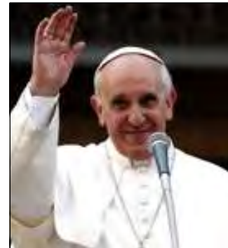
Le Pape François.