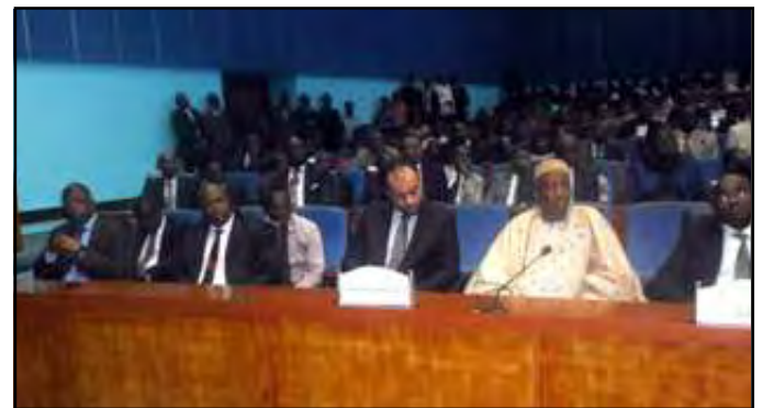
Vue des participants.

Durant les travaux, le bureau de la Comy IV a examiné un rapport d'étape sur la mise en œuvre du programme de la division en charge de la jeunesse de la commission de l'Union africaine; le rapport du bureau et celui de l'U.p.g (Union panafricaine de la jeunesse), plateforme commune pour s'assurer que l'Afrique parle d'une seule voix, concernant la planification et le financement de l'agenda de la jeunesse, le cadre institutionnel, les mécanismes de promotion et de développement des jeunes, les données statistiques ainsi que les processus de suivi et d'évaluation.