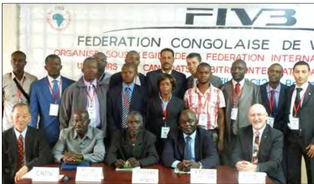
Les officiels (assis) et les candidats (debout) après la cérémonie d'ouverture du cours.

Ce cours s'inscrit dans l'optique du développement de la pratique du volley-ball sur le continent africain. Un objectif fondamental pour la Fédération internationale et la Confédération africaine de volley-ball. L'Afrique a un manque cruel d'arbitres internationaux, comparativement aux autres continents. Deux experts de grande expérience animent ce cours, notam-