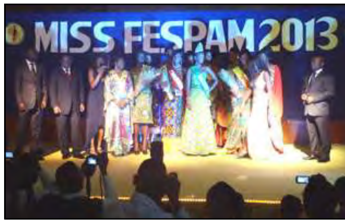
Photo de famille des Miss avec les officiels.

discours très riche, intelligent et porteur d'initiatives en faveur de la jeunesse africaine et du