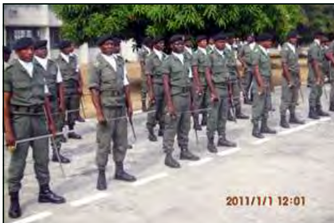
Quelques stagiaires pendant la cérémonie d'ouverture.

fait, exhorté les officiers stagiaires, à faire que des échanges et enseignements qui leur seront dispensés, qu'ils en sortent avec des notions bien comprises d'éthique et de déontologie administrative. Le clou de la cérémonie, rehaussée de la présence des membres du commandement des F.a.c et de la gendarmerie nationale, ainsi que des officiers généraux et supérieurs, a