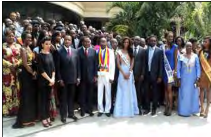
Photo de famille avec le président de la République.

L'autre activité phare du Fespam, c'est la 7 ème édition de l'élection de miss Fespam, qui a eu lieu dans la soirée du mercredi 17 juillet, dans la salle de banquet du palais des congrès, sous le patronage du ministre Gakosso et ses collègues ministres de la culture venu des autres pays africains. C'est une étudiante rwandaise de 21 ans,