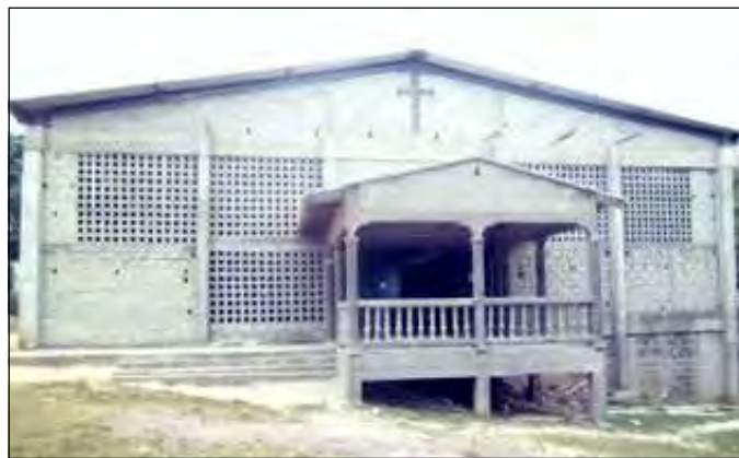
L'église Sainte Trinité en construction.

De même, l'aumônerie catholique a promu et supervise une importante activité maraîchère sur le site. Ce qui, non seulement a substantiellement amélioré l'alimentation des 560 détenus que compte la Maison d'arrêt, mais aussi leur a permis de réaliser des recettes sur la vente des produits de leur travail, à savoir: des légumes feuilles (amarante, oseille, épinard) et des légumes fruits