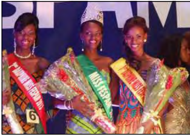
La Miss, au milieu, entourée des deux dauphines.

ser le message de paix, d'unité et d'amour par la musique. Sur son choix, Mme Hapsatou Sy a déclaré que cette Miss n'a pas été choisie, simplement, pour sa beauté, mais par son