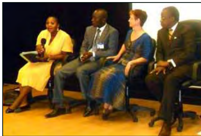
Les trois organisateurs, pendant la conférence de presse (Page 6).

Reiper (Réseau des intervenants sur le phénomène des enfants en rupture)