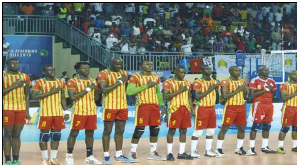
Les Diables-Rouges volley-ball sont parmi les prétendants.

Au moment où nous bouclons ce journal, sept pays avaient confirmé leur participation, notamment l'Egypte, la Tunisie, l'Algérie, le Niger, le Cameroun, la R.D. Congo et, naturellement, le Congo, pays hôte. Encore qu'il faudrait attendre que tout le monde soit à Brazzaville... Toutefois, par le gabarit de certains prétendants,