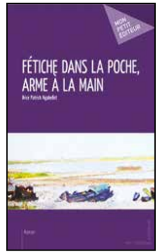
La couverture du livre.

permet de lire ceci: «De retour au pays, après plusieurs années d'études en Europe, François Léta, natif d'un des villages qui se construit et se déplace au gré des saisons sur les rives du fleuve Congo, est très mal accueilli par ses proches. Il retrouve un univers irritant, rongé par l'anarchie, le sexe, la drogue, le fétichisme et le maniement des armes. Les femmes paient un lourd tribut à cette évolution délirante des mœurs dans ce pays où elles sont astreintes au silence, déshéritées, bâillonnées par la coutume ancestrale et enfermées dans les cases, comme des prisonnières, lorsqu'elles perdent un mari. Ces agissements agacent profondément François. Mokitani, une riche commerçante belle et cocasse, qu'il a épousée à son retour au pays, va en faire l'expérience le jour où il est porté disparu. Son veuvage est, tout simplement, délirant...»