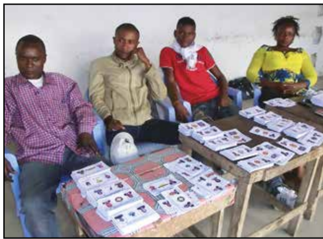
Le bulletin unique va remplacer l'ancien système à bulletins multiples.

est clair que le président de la République a fait de 2016, une année électorale. En effet, en dehors de l'élection présidentielle dont le premier tour est fixé au dimanche 20 mars 2016, il devrait y avoir des élections législatives, pour le renouvellement de l'assemblée nationale, des élections locales, pour le renouvellement des conseils départementaux, et des élections sénatoriales, pour celui du sénat. En principe, au cours de cette période, les institutions pourvues par voie administrative ou par des élections professionnelles devront être également renouvelées, tout comme les nouvelles institutions établies par la nouvelle Constitution, comme le Conseil de consultation du dialogue national. Tout ceci devrait se faire dans la période du 2 janvier au