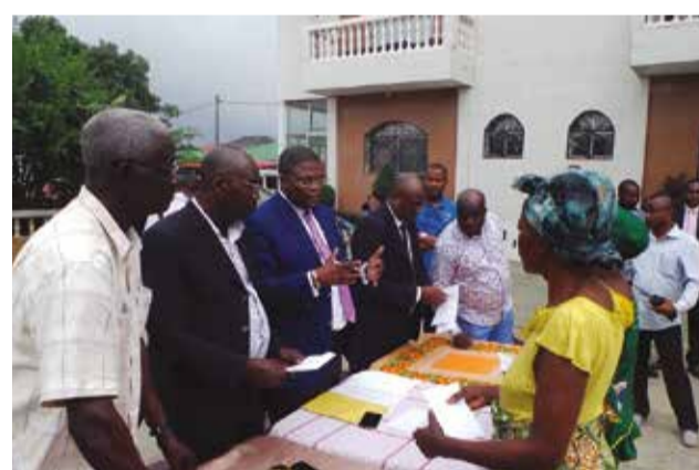
Le député Ossiala (au milieu), pendant la distribution de l'allocation.

Député élu dans la troisième circonscription de Talangaï, deuxième vice-président du bureau de l'assemblée nationale, Sylvestre Ossiala a fait du partage avec les populations, une tradition marquant la période des fêtes de fin d'année. Mais, dans sa circonscription, 2015 s'est achevée en jetant dans la détresse, des dizaines de familles victimes des inondations et de l'ensablement de leurs domiciles, à la suite des pluies qui ont provoqué le débordement des rivières Mikalou et Tsiémé. Face à la détresse de ses compatriotes des quartiers 63 et 66, le député a retroussé ses poches.