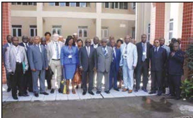
Des participants posant avec Georges Moyen, après l'ouverture de la Manifestation.

Le ministre Georges Moyen a salué, de son côté, le partenariat du gouvernement congolais avec l'A.u.f qui ne cesse d'accompagner de nombreuses actions et initiatives, pour améliorer la qualité du système d'enseignement supérieur dans le Sud, et particulièrement au Congo. «Il n'est que normal qu'après la consolidation par les Universités francophones d'Afrique subsaharienne des cycles de Licence et de Master du système L.m.d, qu'on enclenche bien que tardivement les réflexions sur le cycle de Doctorat et la place des Ecoles doctorales. Nous sommes convaincus que ces réflexions devraient entrevoir les possibilités de l'insertion professionnelle des Doctorants face aux changements