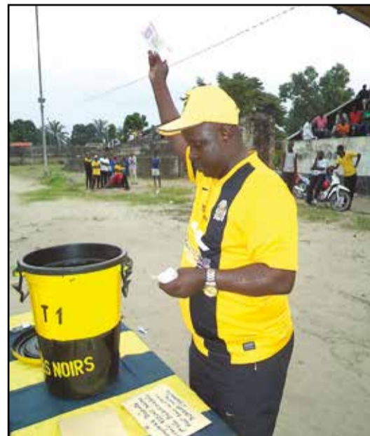
Un geste significatif du deuxième vice-président.

Quoi de neuf chez les Diables-Noirs? Nourrissant de grandes ambitions pour leur club, le plus populaire du pays, la coordination des supporters n'a pas hésité à mettre, désormais, à contribution tous ceux qui se réclament de Diables-Noirs, en lançant, samedi 26 décembre 2015, au Stade Marchand, une collecte de fonds destinée à bâtir, désormais, du solide.