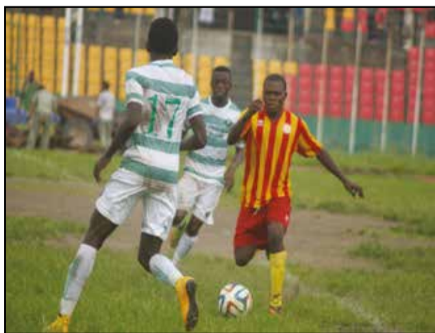
Le public va renouer avec les joutes du National de football.

Le championnat national de football d'élite Ligue 1 du Congo démarre, en principe, le samedi 9 septembre 2016, comme convenu, dernièrement, entre comité exécutif de la Fécofoot (Fédération congolaise de football) et clubs concernés. Le calendrier étant déjà disponible en fin de semaine dernière, il a la particularité de réunir non plus 18 équipes, comme celui qui s'est terminé en lambeaux la saison passée, mais plutôt 20! Ainsi en avait décidé, il y a quelques mois déjà, le comité exécutif de la Fécofoot. Ces équipes sont: A.C Léopards et Jeunes Fauves (promu), de Dolisie, A.S Kimbonguélé (promu), de Kinkala, A.S Cheminots, A.S.P, La Mancha, Munisport, Niconicoyé, Pigeon Vert (promu) et V.Club Mokanda, de Pointe-Noire, CARA, Diables-Noirs, Etoile du Congo, F.C Kondzo, Inter Club, J.S.P, J.S.T, Patronage Sainte-Anne, Saint-Michel de Ouenzé et Tongo F.C, de Brazzaville. Un championnat à 20! Trente-huit journées! Hier, on disait qu'un championnat à 18 était déjà un désastre financier, pour des clubs qui ne cachent plus leur pauvreté. Un championnat à 20 équipes serait-il la solution miracle? Il faudra, peut-être,