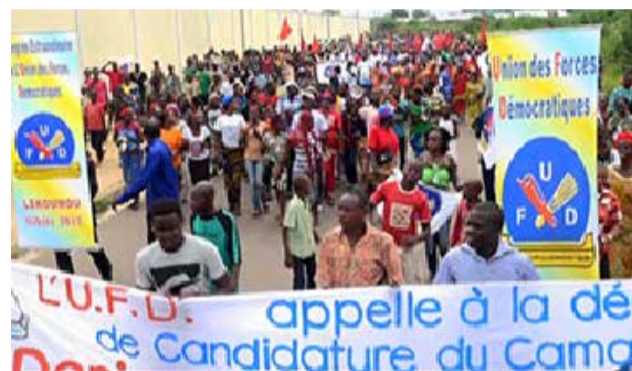
La marche des militants de l'U.f.d à Djambala réclamant la candidature du président Sassou-Nguesso.