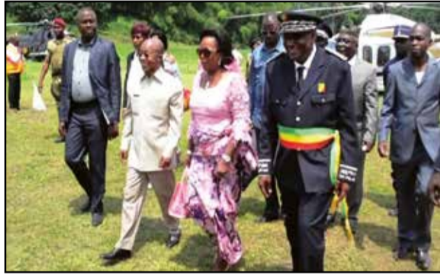
L'arrivée de l'épouse du chef de l'Etat à Mvouti.