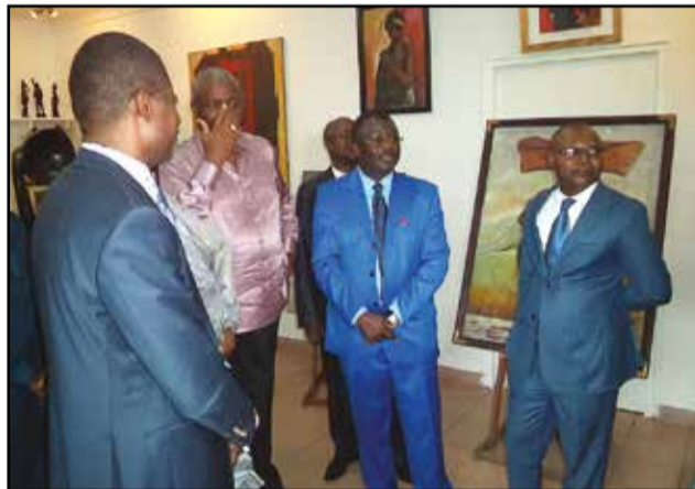
Pendant la visite de la galerie.

La Mairie de Brazzaville a rendu hommage, jeudi 24 décembre 2015, à l'artiste-peintre congolais de renom, Hilarion Ndinga, rappelé à Dieu, en janvier 2015. C'était à l'occasion de l'inauguration de la galerie qui lui est dédiée, située sur la rue Makoko, à Poto-Poto, le 3 e arrondissement de la ville-capitale. La cérémonie était placée sous les auspices du député-maire de Brazzaville, Hugues Ngouelon-délé. Elle s'est déroulée en présence du deuxième secrétaire du bureau du conseil départemental et municipal, Bonaventure Boudzika, du commissaire général du Fespam (Festival panafricain de musique), Gervais Hugues Ondaye, du haut-commissaire à la réinsertion des ex-combattants, Norbert Dabira, et de bien d'autres personnalités.