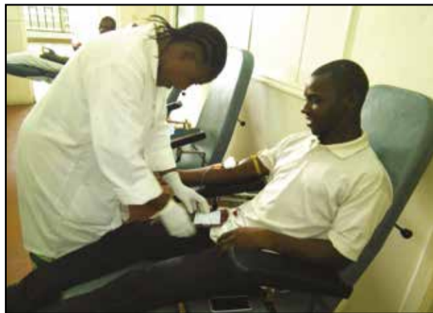
Il donne son sang pour sauver des vies humaines.

Dans les jours à venir, une nouvelle organisation de jeunesse sera portée sur les fonts baptismaux, à Brazzaville. Il s'agit de la Fédération des jeunes de la Likouala pour développement du Congo. Mais, bien avant l'arrivée de cette échéance, une centaine de membres de cette organisation juvénile ont cru de bon aloi d'accomplir un acte philanthropique: le don de sang au C.n.t.s (Centre national de transfusion sanguine) de Brazzaville. C'était le dimanche 27 décembre 2015, en matinée.