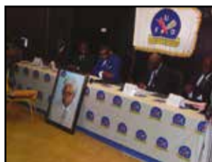
Le bureau politique de l'U.f.d.