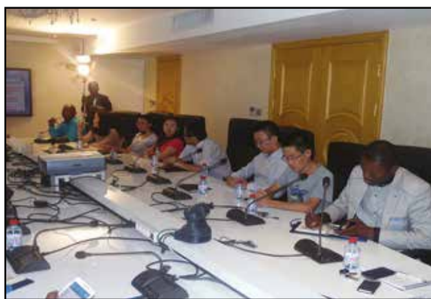
Une vue des soumissionnaires

l'appel d'offres. Le montant proposé tourne autour de deux milliards de francs Cfa. Les délais d'exécution des travaux varient entre