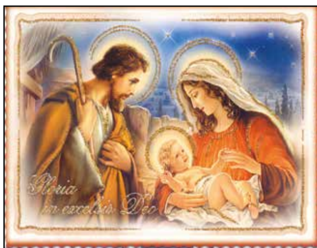
A Noël, le Fils de Dieu nous apporte la paix.

à manier les armes, à faire la guerre pour tuer son semblable. Dire qu'après la guerre, un dialogue est préconisé, des traités de paix sont signés. On peut se poser la question: «Pourquoi alors avoir fait la guerre, avoir écourté la vie des autres?» Ainsi toutes les guerres devaient commencer