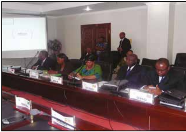
Les membres de la Conférence internationale sur la région des Grands-Lacs.

Grands-Lacs, le contexte des menaces terroristes justifie nos réflexions, car «le panorama des évolutions du terrorisme, de la criminalité organisée, de la piraterie et du brigandage maritime (trafic de drogue, cybercriminalité, criminalité économique et