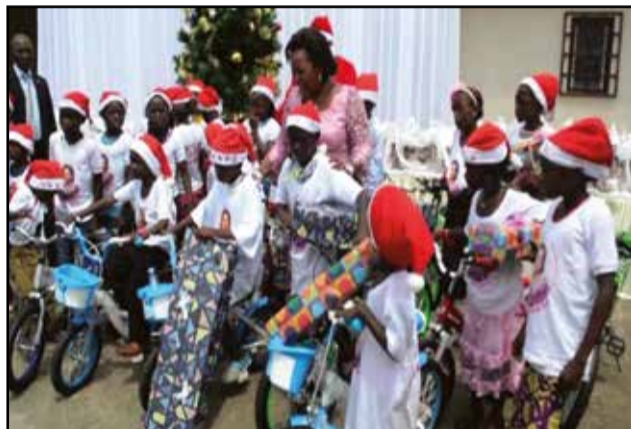
Pendant la distribution des jouets aux enfants.