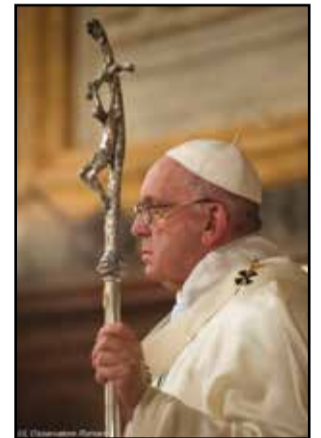
Le Pape François.

Aujourd'hui, nous pouvons dire que tout a été fait au niveau diocésain, puisque le rapport de la commission historique, dernier document diocésain déposé, par nous-mêmes, à la Congrégation