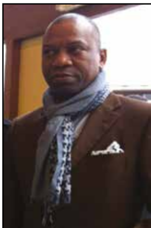
Par Roger Ndokolo.

baril de brut bien en dessous de 50 dollars a fait perdre au Congo 40% au moins de ses recettes pétrolières. La croissance pour la même année est estimée à 2,6%, contre 6,8%, en 2014, et 3,4%, en 2013. Certes, les réserves accumulées au cours des années fastes permettent d'amortir, en partie, le choc du manque à gagner. Mais, il est clair que l'euphorie cède, peu à peu, la place au désenchantement, voire à la déprime. Nous voici confrontés à une sérieuse fluctuation à la baisse, de nature cyclique. On peut admettre qu'elle était relativement imprévisible, ne relevant seulement de paramètres de nature économique stricto sensu , même des modèles économétriques sophistiqués ne laissent entrevoir qu'en pointillés, sur le tableau de bord du futur, la succession des périodes de vaches maigres à celles de vaches grasses. La prochaine augmentation de la production pétrolière, due à la mise en exploitation de nouveaux puits, stimulera, à n'en pas douter, la croissance dont on espère qu'elle pourra atteindre 4% en 2016. Cette prochaine éclaircie devrait entraîner une relative amélioration des recettes budgétaires. En outre, la Banque mondiale