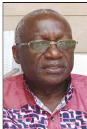
Par Joseph Badila.

travail consiste à rapprocher les os, pour colmater la fêlure. Aujourd'hui, plus que jamais, c'est le Congo qui est visé. Entre un gouvernement orgueilleux de ses cavalcades référendaires et une opposition qui a subi des avaries, mais sans désespérer en se saisissant de l'étourdissement populaire, il faut redéfinir nos ambitions nationales. Les victimes du 20 octobre 2015, quel que soit leur bord, valent notre méditation à tous. Nous devons réfléchir profondément sur le «vivre ensemble». L'autre difficulté, c'est d'évoquer la question de la fracture sociale, sans être taxé d'extravagance. Pourtant, cette fracture menace la cohésion sociale. D'où l'extrême nécessité de recréer un moment de spontanéité et de l'art de savoir-vivre à la congolaise. A tous ceux qui nous gouvernent, à tous ceux qui nous gouverneront, la démocratie, la paix et donc le développement doivent être au cœur des solutions prioritaires à apporter dans notre pays, pour l'éloigner du spectre des divisions. Le Congo doit demeurer « Un et Indivisible », afin de prévenir d'autres foyers de la haine, de l'hypocrisie et de l'ensauvagement. Les moyens de répondre à l'angoisse des citoyens sont connus. Il suffit de demander à chaque citoyen ce qu'il peut faire pour le Congo, en reconstruisant, brique par brique, les trois colonnes censées soutenir