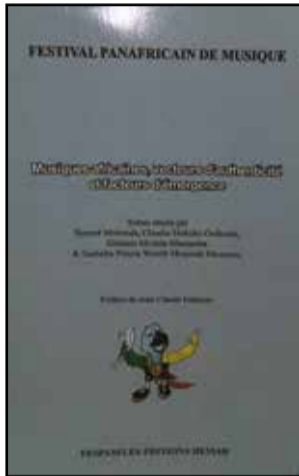
Le nouvel ouvrage.