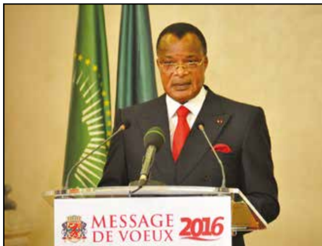
Le président Denis Sassou-Nguesso.

Le phénomène migratoire a connu, en 2015, une recrudescence prenant la forme de crise mondiale aux conséquences souvent tragiques. L'effondrement du cours du pétrole a pro-