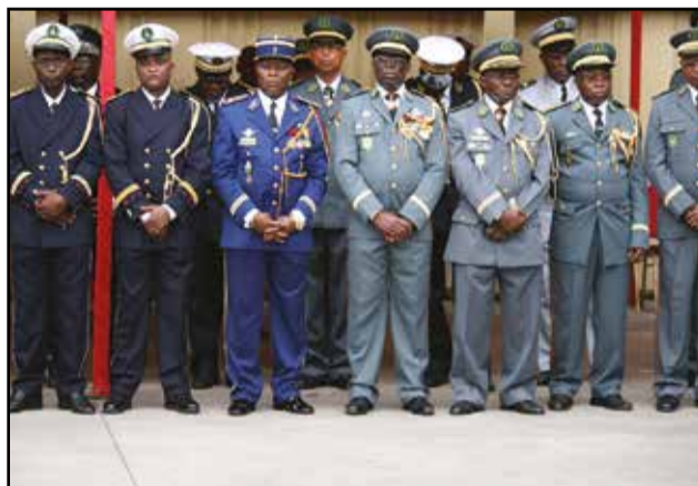
Le personnel de la Force publique attentif à l'allocution du chef suprême des armées.

loi d'orientation et de programmation de 2014. La loi d'orientation et de programmation est l'instrument de modernisation de notre Force publique», a-t-il lancé.