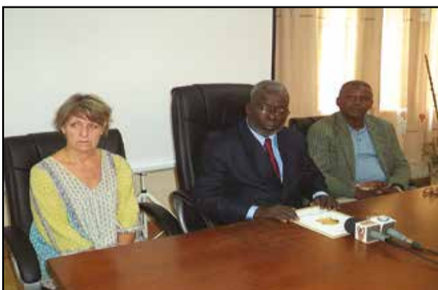
Les membres du présidium.