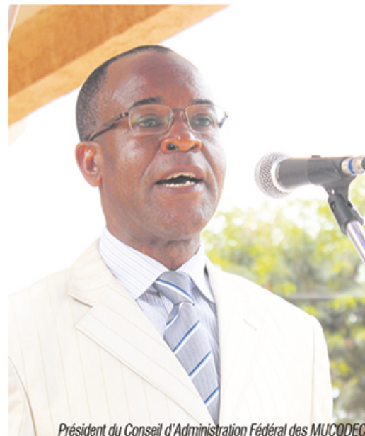
Président du Conseil d'Administration Fédéral des MUCODEC

Avec des résultats en progression, la MUCODEC Sibiti dispose de moyens lui permettant de poursuivre ses ambitions. En effet, la Caisse Locale MUCODEC Sibiti participe activement à irriguer l'ensemble des activités de son territoire. Elle soutient les initiatives économiques locales en donnant aux artisans, commerçants et jeunes entrepreneurs les moyens de réaliser leurs projets.