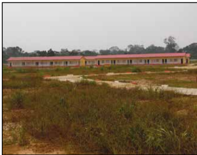
Le lycée de Ouessou.

1- décongestionner le site de Mambéke Boucher qui abrite cinq établissements scolaires: le Collège pilote; l'Ecole primaire Mambéke Boucher A; l'Ecole primaire Mambéke Boucher B; le centre d'éveil et la maternelle; 2- dépeupler les salles très pléthoriques du collège Kwame Nkrumah de Ouessou. Nous pensons être logiques. Alors, d'où vient le problème? Nous avons été surpris, l'ensemble des autorités locales, d'apprendre que le Lycée moderne de Ouessou est érigé en Lycée interdépartemental. L'autorité municipale n'a ja-