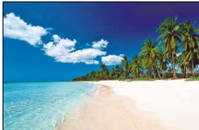
L'océan, réservoir d'oxygène et acteur de premier plan dans l'absorption du CO2.

Réservoir d'oxygène et acteur de premier plan dans l'absorption du Co2, l'océan, peu pris en compte dans les négociations internationales relatives au climat jusqu'ici, a du 3 au 4 décembre dernier fait l'objet d'un forum organisé par la C.o.i (Commission océanographique intergouvernementale) de l'Unesco, la Plateforme Océan et climat et le Global Ocean Forum, en collaboration avec une centaine de partenaires institutionnels climat, à la Conférence des Nations Unies sur le climat ou Cop 21, pour attirer l'attention sur les interactions entre l'océan et le climat.