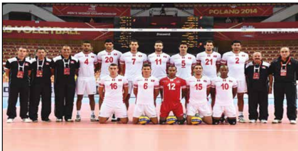
L'équipe de Tunisie, une des favorites du tournoi, a minutieusement préparé le rendez-vous de Brazzaville.

Toutes les délégations étaient attendues, comme prévu sur les lieux mardi 5 janvier, au plus tard. Parmi elles, l'Algérie est arrivée, directement, de Varsovie (Pologne), l'Egypte de Helsinki (Finlande), le Cameroun de Rome (Italie). La Tunisie a séjourné à Belgrade (Serbie), où elle a affronté les clubs professionnels les plus en vue, avant de terminer sa préparation à Tunis, à défaut d'aller en Turquie, cette étape étant annulée, au dernier moment. Cela traduit leur ferme intention