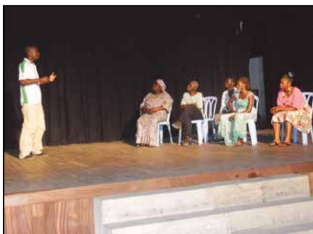
Le théâtre «Des Sans voix» en action.

avoir découvert qu'il était atteint de cette maladie, il décide de noyer sa vie dans la boisson, pour échapper à la réalité. Et grâce au soutien de son ami, Marcel, et de sa petite-sœur, Flora, il retrouve, peu à peu, l'espoir de vivre. Aussi, grâce à une association de lutte contre le Sida qui s'est rendue dans son quartier, pour une opération de sensibilisation, il prend conscience et décide de se battre aussi pour les autres, afin qu'ils ne tombent dans le même piège que lui.