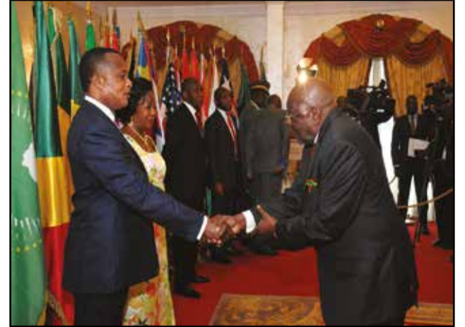
Les diplomates ont présenté les vœux de nouvel an au couple présidentiel.

Pour sa part, par la voix de sa doyenne, Mme Marie Charlotte Fayanga, ambassadeur de la République Centrafricaine, le corps diplomatique accrédité au Congo a pris acte de l'évolution des institutions au Congo, avec l'instauration d'une nouvelle Constitution. Faisant le bilan de l'année 2015, la diplomate centrafricaine a beaucoup insisté sur les grands fléaux qui menacent la paix dans le monde, notamment la montée du terrorisme et le péril migratoire en Méditerranée des migrants en détresse à qui «l'Etat islamique a imposé le choix cornélien entre la valise et le cercueil». Dans son allocution, le président Sassou-Nguesso, approuvant la doyenne du corps diplomatique, a reconnu que «l'année 2015 a été marquée par un contraste entre les espoirs d'un monde de paix et de sécurité souhaité par tous et les nombreux défis