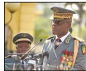
Le général Okoï.

Prononçant son allocution d'orientation, le président de la République a, de nouveau, renouvelé ses félicitations à l'endroit de la force publique, comme lors de son passage à