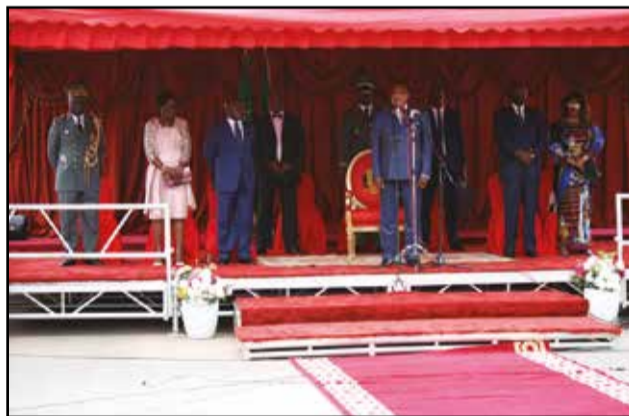
Le président Sassou-Nguesso prononçant son allocution.