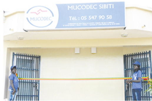
Façade principale de la Caisse Locale MUCODEC Sibiti

tion constante. Elle a été alors délocalisée à Pointe-Noire, puis à Nkayi. C'est le 18 mars 2003 qu'elle a été ramenée à Sibiti, où elle était logée dans le bâtiment de l'ancien magasin OFNACOM, et puis dans les bureaux de la MUGEF, suite aux travaux de la municipalisation accélérée de Sibiti en 2014.