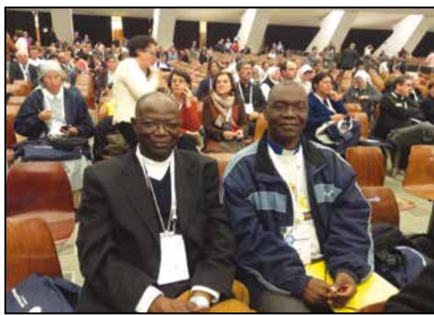
Mgr Anatole Milandou posant avec un congressiste.

A l'occasion de la célébration du cinquantième de la déclaration du Concile Vatican II « Gravissimum educationis » et du 25 e anniversaire de la constitution apostolique « Ex Corde Ecclesiae », la Congrégation pour l'éducation catholique (dicastère de la Curie romaine) a organisé, du 18 au 21 novembre 2015, à Rome, en Italie, un congrès mondial sur l'éducation catholique, intitulé: « Eduquer aujourd'hui et demain. Une passion qui se renouvelle ». Près de deux mille présidents des commissions épiscopales pour l'éducation, recteurs des institutions catholiques éducatives et universitaires y ont pris part, parmi lesquels, Mgr Anatole Milandou, archevêque métropolitain de Brazzaville, président de la C.e.edu.c (Commission épiscopale pour l'éducation catholique) au Congo.