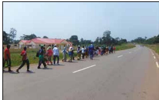
Les pèlerins sur la route de Mokeko.