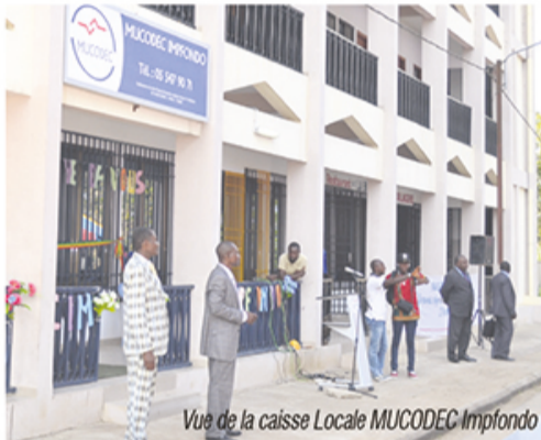
Vue de la caisse Locale MUCODEC Impfondo