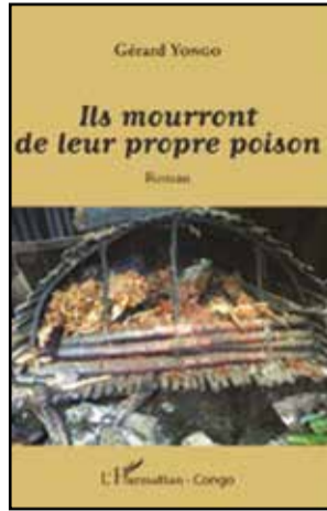
La couverture du livre.