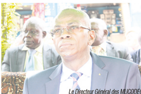
Le Directeur Général des MUCODEC

Implantées depuis plus de 26 ans dans le département de la Lékoumou, la Caisse Locale MUCODEC Sibiti compte près de 2 383 sociétaires. Son fonctionnement est assuré par une équipe composée de : trois salariés dont un Gérant, plus dix élus, membres du Conseil d'Administration.