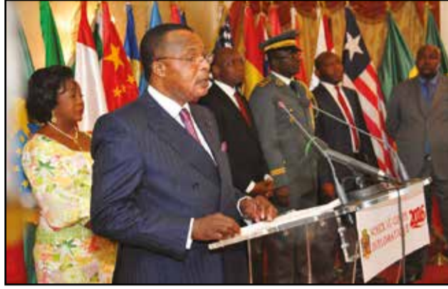
Le président Denis Sassou-Nguesso.

La traditionnelle cérémonie de présentation de vœux au chef de l'Etat par le corps diplomatique, mercredi 6 janvier 2016, au palais du peuple, à Brazzaville, a permis au président Sassou-Nguesso d'interpeller la communauté internationale sur la nécessité d'accompagner le Congo «vers la tenue du prochain scrutin présidentiel», car le 20 mars prochain, les électeurs congolais se rendront «aux urnes, pour choisir, librement, la femme ou l'homme qui devra présider aux destinées de la République du Congo, pour les cinq prochaines années».