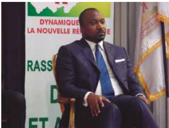
Denis Christel Sassou-Nguesso

La collecte des fonds organisés pour soutenir le candidat, dont le montant n'a pas été révélé, a constitué l'un des temps forts de cette rencontre. Trois raisons fondamentales ont justifié le choix de la D.n.r, plateforme d'organisation de la société civile : - premièrement: consciente de la fragilité de la situation politique et économique nationale; - deuxièmement: convaincue que la stabilité socio-politique est la condition sine qua non du développement; - troisièmement: rassurer, par votre expérience et vos états de service, dans l'exercice des responsabilités publiques.