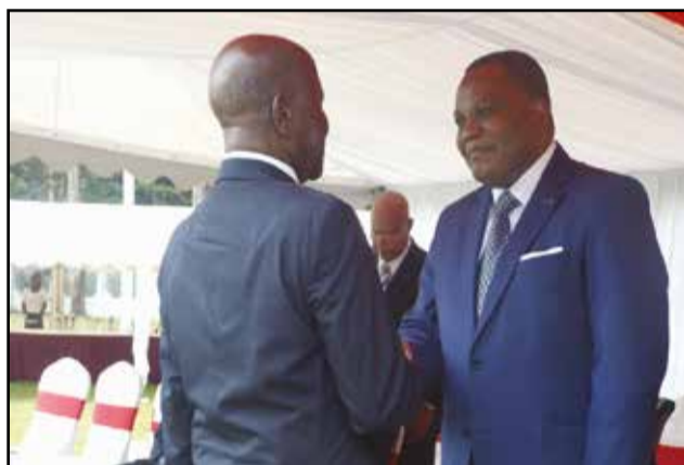
Pendant l'échange des vœux.

diplomatique aussi chargé que la précédente année: 26 e session de la conférence des chefs d'Etat et de gouvernement de l'Union africaine; sommet de la conférence des régions des Grands-Lacs; réunion de la 4 e Ticad; 4 e sommet du forum de coopération Afrique-Amérique du Sud, etc. Enfin, au cours des prochains mois, période électorale oblige, la diplomatie congolaise va intensifier le travail d'information, d'ex-