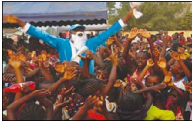
Le père Noël Azur au milieu des bénéficiaires.

voire les enfants de la rue. Nous avons aussi tenu compte des enfants autochtones que nous avons enregistrés à Pokola. La prochaine étape sera Madingou et Sibiti».