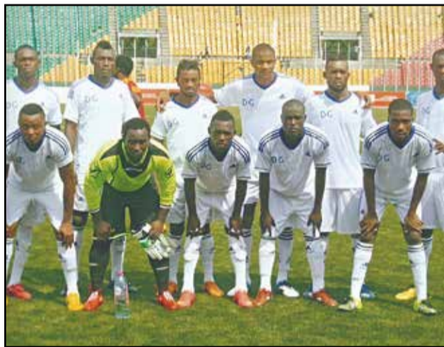
La formation de Patronage Sainte-Anne victorieuse d'Inter Club.

La deuxième journée a été quelque peu mouvementée, notamment mercredi 13 janvier. L'on a enregistré la victoire la plus spectaculaire, celle de Patronage Sainte-Anne qui a désarmé les militaires d'Inter Club. De son côté, l'A.C Léopards fait du surplace. Il a encore concédé un match nul, à Dolisie, face aux Jeunes Fauves de la même ville. D'entrée de jeu, il faut signaler le match nul (1-1) arraché par V.Club Mokanda, mardi 12 janvier, dans son fief de Pointe-Noire, face aux Brazzavillois de Saint-Michel de Ouenzé. On jouait les derniers instants, dans le temps additionnel, quand les lo-