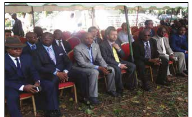
Vue des invités à la cérémonie.