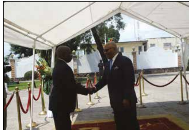
Isidore Mvouba échangeant les vœux avec ses collaborateurs.

A l'occasion de la cérémonie d'échange des vœux, au Ministère du développement industriel et de la promotion du secteur privé, samedi 9 janvier 2016, au siège dudit ministère, à Brazzaville, le ministre d'Etat Isidore Mvouba a fait savoir, dans ses orientations pour 2016, que «la conjoncture économique n'est pas des plus favorables, notamment avec un prix du baril de pétrole en chute vertigineuse. Mais, cette conjoncture, difficile à plus d'un titre, peut être un mal pour le bien, parce qu'elle est une nécessité absolue pour aller vers la diversification de notre économie».