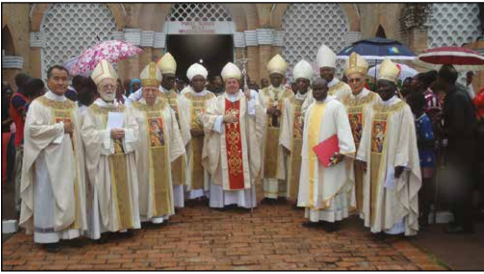
Mgr Jan Romeo Pawlowski entouré de tous les évêques du Congo.