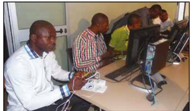
Les étudiants faisant des recherches.

d'initiative, pour que les jeunes s'épanouissent et poursuivent leurs études. Nous avons, également, la possibilité de faire des recherches, gratuitement, tionnel et le public peut faire des recherches. Notre connexion Internet est disponible 24/24.» Créée en janvier 2010, la M.i.c offre une plateforme de travail