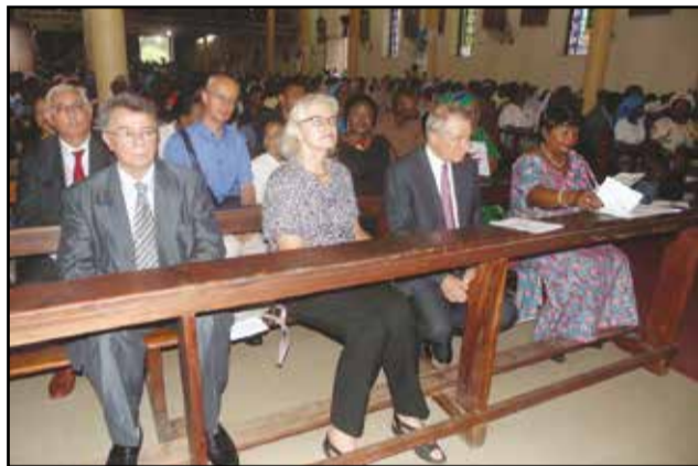
Les membres du corps diplomatique (au premier plan) participant à la messe.