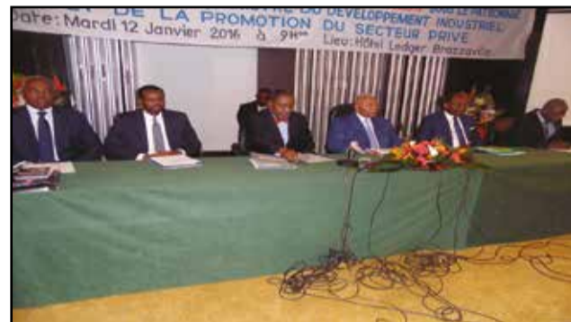
Une vue du présidium.