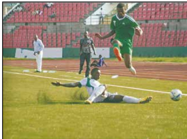
Duel musclé entre J.S.P et Etoile du Congo.

Les têtes continuent de tomber à la Fifa. Déjà privée de son président, Sepp Blatter, suspendu pour huit années de toute activité liée au football, en attendant son audience en appel, l'instance mondiale du football vient de voir son numéro deux subir une sanction bien plus lourde. Relevé de ses fonctions de secrétaire général depuis le 18 septembre, Jérôme Valcke a, officiellement, été limogé, mercredi 13 janvier 2016, après enquête de la commission d'éthique de l'instance. Il est mis en cause dans une affaire de revente de billets au marché noir et lié à une «série d'allégations», d'après la Fifa qui a ainsi pris la décision de le relever de ses fonctions.