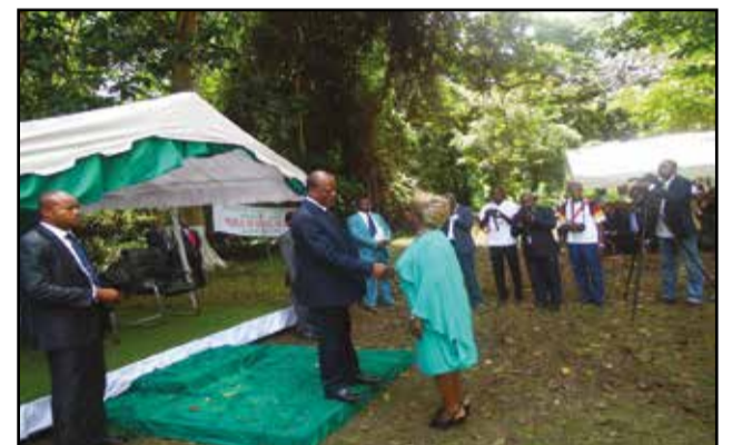
Présentation des vœux par la poignée de main entre Henri Djombo et ses travailleurs.

Pour 2016, Henri Djombo entend réaliser la stratégie nationale de lutte contre les fléaux qui menacent la biodiversité, l'économie et la sécurité nationales. C'est l'objectif qu'il a fixé à son département. Il l'a dit, à l'occasion de la cérémonie de vœux organisée au parc zoologique, à Brazzaville, lundi 11 janvier. Pour cela, il a appelé les fonctionnaires, les agents et les collaborateurs relevant de son département ministériel à se mobiliser, pour « réaliser les tâches avec responsabilité ».