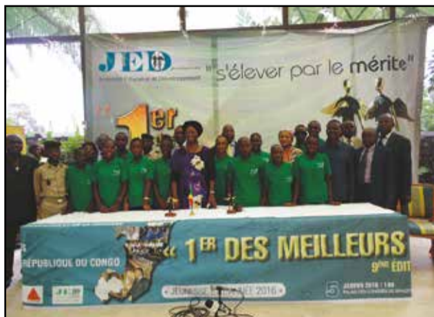
Les meilleurs élèves du Congo autour de la présidente de la fondation J.e.d.

Cette année, la fondation a apporté quelques innovations, en décernant à chaque lauréat un diplôme signé, conjointement, par la présidente de la J.e.d et les ministres de l'enseignement primaire et de l'enseignement technique. Une autre innovation est