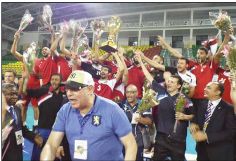
Les Egyptiens savourant leur qualification pour les J.O de Rio de Janeiro.

Sur les vingt-trois pays annoncés, sept ont finalement participé au tournoi. Il s'agit du Congo, de la R.D.Congo, du