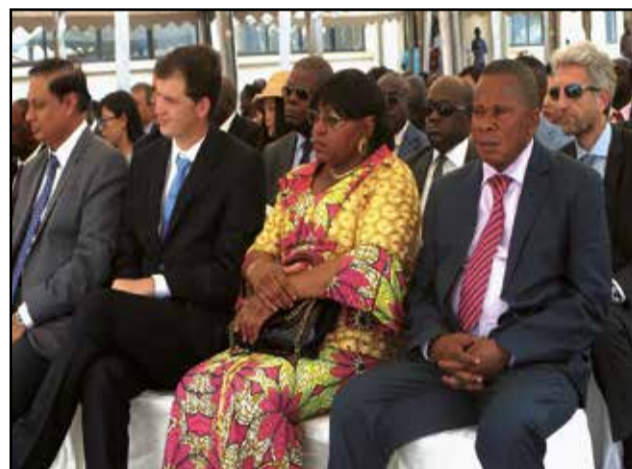
Une vue des cadres et chefs d'entreprises sous tutelle du M.d.i.p.s.p.

S'appuyant sur le forum Investir au Congo-Brazzaville (I.c.b 2015), que le Ministère du développement industriel et de la promotion du secteur privé a organisé en partenariat avec le Centre d'appui au développement, le ministre d'Etat Isidore Mvouba, après avoir félicité ses collaborateurs, «pour leur sens élevé de responsabilité, malgré les vicissitudes qui les ont contrariés l'an passé», notamment le manque de financement de certaines rubriques, il les a appelés à promouvoir les nombreux atouts «que nous possédons, pour attirer, dans notre pays, un flux important d'investissements directs étrangers. I.c.b 2015 a permis d'offrir à nos potentiels investisseurs, un éventail riche et varié d'opportunités d'affaires à réaliser au Congo, le tout, dans un esprit gagnant-gagnant», a-t-il indiqué. Le ministre du développement industriel et de la promotion du secteur privé espère que «l'année 2016 connaîtra le lancement de grandes unités industrielles, à l'instar de plusieurs cimenteries, dont Dangoté et autres, pour une production annuelle d'environ 3 millions 300 mille tonnes, en prenant en compte la production de la Sonocc, Cimaf, Forspak, pour une demande intérieure de l'ordre de 2 millions de tonnes. Le Congo pourra ainsi exporter, dans la sous-région, le surplus de sa production cimentière».