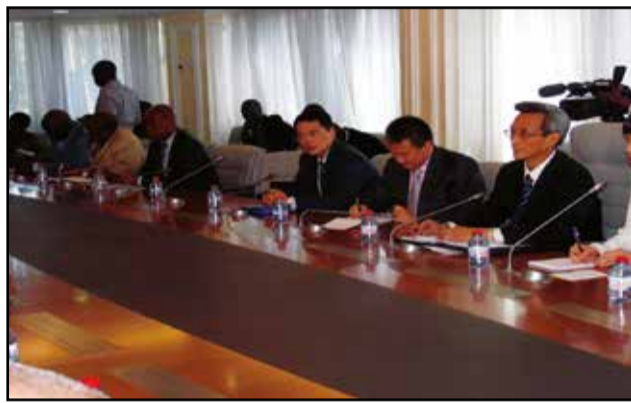
Pendant la séance de travail entre les deux délégations.