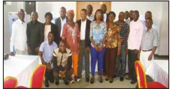
Les journalistes participants à la fin des travaux.

Organisé vendredi 18 décembre 2015, à la préfecture de Brazzaville, par l'agence de communication Glad services, une agence recrutée dans le cadre de l'exécution du projet Lisungi, l'atelier d'information et de sensibilisation de journalistes au fonctionnement du projet Lisungi a accouché d'un réseau des journalistes des filets sociaux constitué d'un bureau de trois membres.