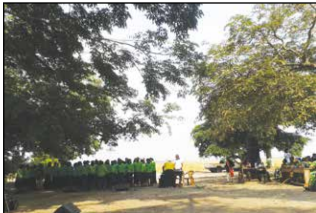
La chorale animant la messe sous les bois.