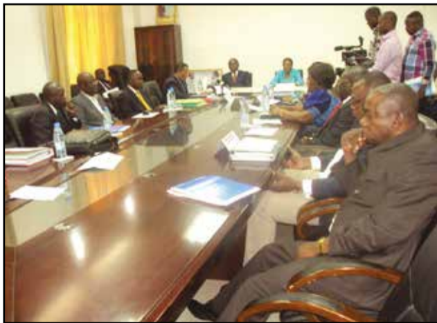
Pendant les travaux.

unique des ménages, ainsi que le document de stratégie d'inclusion productive. Cette stratégie permettra de comprendre les mécanismes prévus pour conduire les ménages bénéficiaires vers l'autonomisation. Les participants ont également saisi cette opportunité pour faire le bilan à mi-parcours de Lisungi-système des filets sociaux, une année après sa mise en œuvre. Et, lors de son lancement, l'unité de gestion du