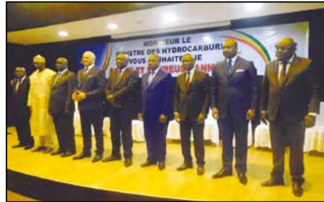
Le ministre avec les membres du directoire de la S.n.p.c, le secrétaire exécutif de l'Appade, le directeur de cabinet et le D.g. des hydrocarbures.

Président de la République; le démarrage du champ de Lianzi, le 27 novembre 2015,