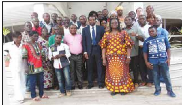
Les participants posant à la fin des travaux.

pants ont été édifiés sur le Pif/Redd, les programmes Dgm global et Dgm, et sur le processus Dgm en République Démocratique du Congo. Ils ont mis en place, à l'issue des travaux, un comité de pilotage de dix membres pour élaborer un plan d'action. Le représentant de la Banque mondiale au Congo, Dibrilla Issa, a réitéré, à cette occasion, l'appui de la Banque mondiale au gouvernement congolais dans l'amélioration de l'efficacité des dépenses publiques et des politiques publiques de façon générale. «Il s'agit, donc, d'examiner comment sont allouées les ressources au niveau central, de voir si les effets bénéfiques de ces ressources atteignent les populations et comment ces bénéfices sont récoltés par les populations autochtones», a-t-il affirmé, en précisant que sur les Dgm, ils ont maintenant les outils qu'il leur faut. «Nous connaissons,