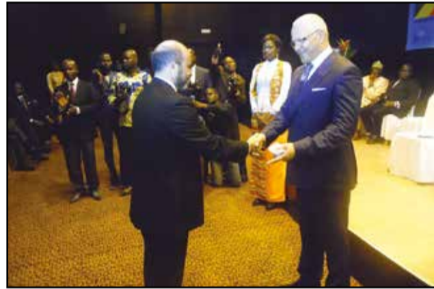
La présentation des vœux au ministre.

passée de 741.689,105 tonnes en 2014 à 858.134,294 tonnes en 2015, soit une augmentation de 15,70%. Le parc des