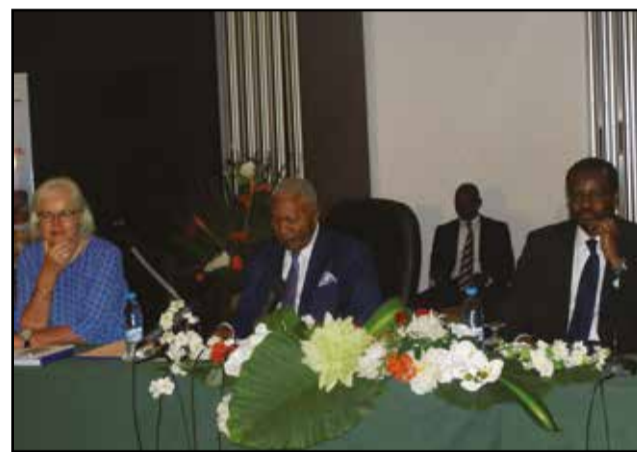
Isidore Mvouba (au milieu).