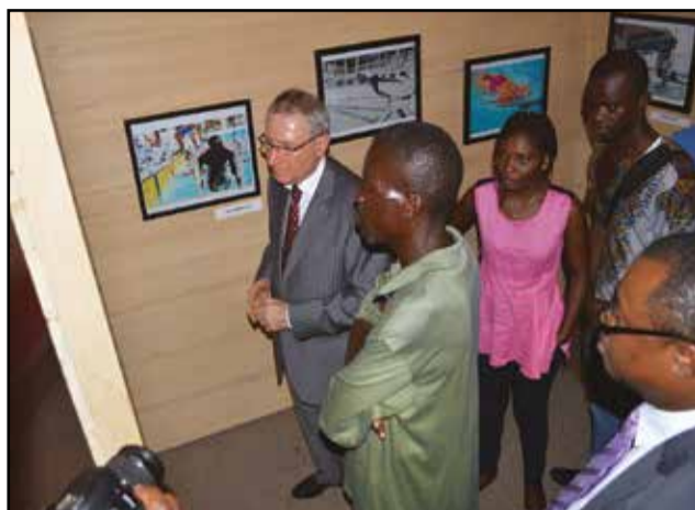
Pendant la visite de l'exposition.

joies de réussir et parfois leurs peines d'échouer. Tous, nous retiendrons l'esprit de dignité, l'esprit d'équipe, l'esprit de fraternité de tous les participants qui se sont sublimés, durant ces deux semaines, pour donner le meilleur d'eux-mêmes», a-t-il affirmé. Et d'ajouter: «Les compétiteurs auront donné au public, plein de ferveur, des moments inoubliables, par leurs performances et leur approche professionnelle des sports qu'ils pratiquent, mais également, par leur volonté d'en faire un authentique moment de partage et de célébration de l'esprit olympique. C'est ce que reflètent ces photographies, quand on y découvre les expressions des visages, les émotions du corps, la beauté du mouvement. On peut y lire la rage de perdre, la violence de l'effort, la volonté de la puissance, la fragilité de la coordination corporelle. On peut y voir l'équilibre entre force et talent, entre vitesse et dextérité, entre la grâce du geste et la brutalité de l'objectif, vaincre. On comprend dès lors comment hommes et femmes se transcendent pour gagner, et d'abord, pour gagner contre eux-mêmes, contre leurs limites, celles inhérentes à leur condition humaine. La