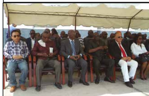
Les cadres et partenaires présents à la cérémonie.