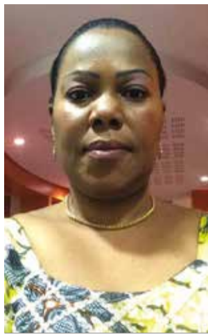
Par Gisèle Goulou.

De tous les droits qu'ont pu obtenir, depuis une éternité, les femmes congolaises, singulièrement le droit de se scolariser, de travailler et de choisir son conjoint, la situation a stagné comme si le moment n'était pas encore venu, pour accorder plus de droits aux femmes, quand bien même ces dernières les revendiquent sans cesse. Par exemple, malgré le combat mené contre la polygamie, qui est légalisée jusqu'à quatre épouses pour un homme, son abolition a été renvoyée aux calendes grecques. Lorsqu'il est évoqué des libertés de la femme en phase avec le modernisme, les sexistes s'appuient sur les us et coutumes, pour justifier cet état de fait. Pour les femmes congolaises en général, et les féministes en particulier, le statu quo devient ahurissant, étant donné qu'on assiste même à une certaine régression. En effet, il y a des femmes qui sont à la merci de leurs supérieurs hiérarchiques, auxquels rien ne peut être refusé, au risque de subir continuellement sermons et châtements, pouvant aller jusqu'à un licenciement abusif, sans aucun recours fiable. Par des mécanismes de piston ou de copinage, aux contreparties avilissantes, certains pro-