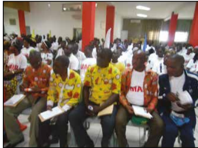
Des militants et sympathisants du M.a.r.