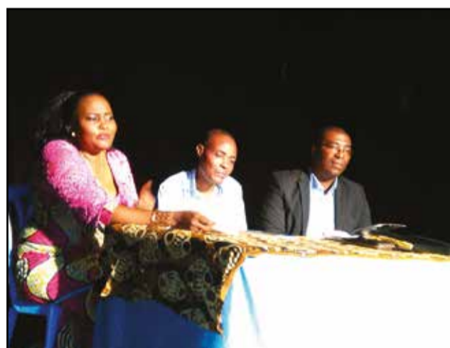
L'auteur (au milieu), pendant la présentation du livre.

avoir purgé une décade en prison, pour avoir commis un crime passionnel, retrouve, enfin, la liberté. De cette rencontre découle un mariage qu'un crime va exposer au regard inquisiteur de la police. Rusée, Aïnata parvient à dissimuler les preuves de sa culpabilité quant au meurtre commis sur son époux. Avec la découverte du cadavre de Douzaïna dans la piscine par les enfants qui jouaient dans le jardin, Max-X, l'inspecteur