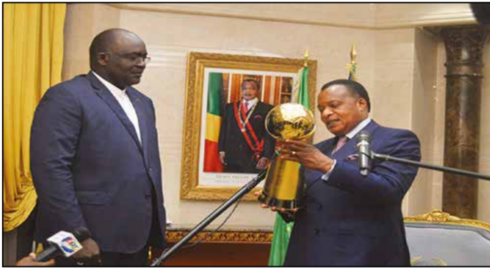
Denis Sassou Nguesso présentant un des deux trophées.