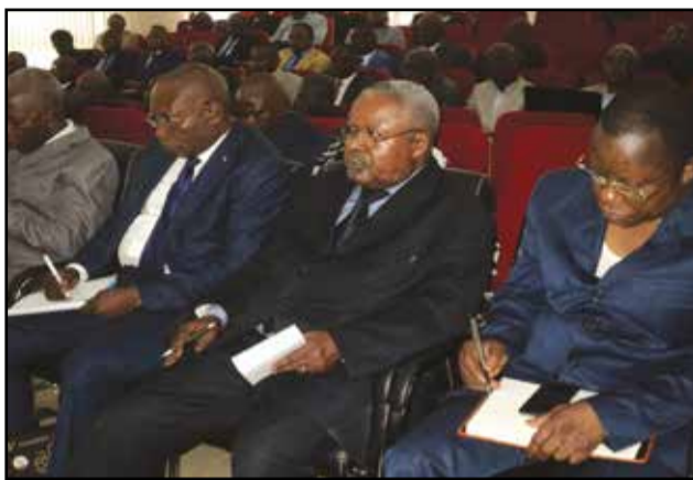
Vue des dirigeants des organisations syndicales congolaises.

a rassuré les membres du comité que les dispositions ont été prises pour que cette opération reprenne en 2016. Sur l'harmonisation des textes des enseignants, il a informé le comité que le travail se poursuit. A ce jour, tous les 514 dossiers y afférents sont traités et remis dans le circuit d'approbation. S'agissant du paiement de la dette de l'Etat, le ministre en charge des finances a fait savoir que le gouvernement fourni des efforts dans ce domaine. Ainsi, 330.000.000.000 F.Cfa d'arriérés de salaires ont été payés; 55.000.000.000 F.Cfa payés au titre de 47 entreprises et établissements liquidés et d'autres sont en cours de paiement. Rappelant, à l'ouverture des