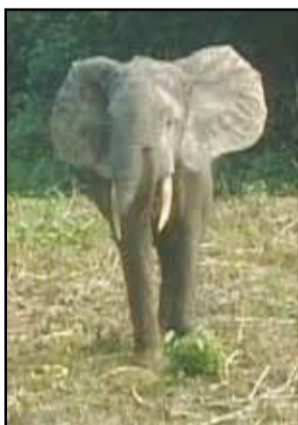
Elephant (espèce protégée).

fin au commerce illégitime de l'ivoire. L'E.p.i. est une initiative internationale, qui regroupe des Etats faisant partie ou non de l'aire de répartition des éléphants d'Afrique, des Ongs nationales et internationales; le secteur privé et des particuliers collaborant, ensemble, pour protéger les éléphants et mettre un terme au commerce illégitime de l'ivoire. Cette initiative demande, en effet, à tous les pays de s'engager à fermer les marchés de l'ivoire