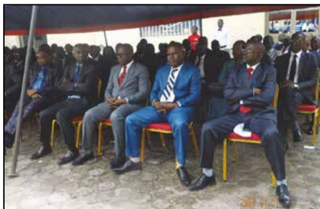
Des agents du ministère.

2016, malgré la chute drastique du coût du baril de pétrole. Rappelons que le directeur de cabinet, qui a esquissé le bilan 2015, s'est félicité de la médiatisation réussie