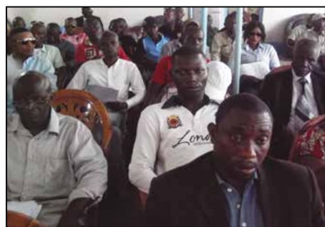
Une vue des militants.