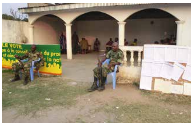
Un bureau de vote à Brazzaville.

A la suite des recommandations du dialogue national de Sibiti et la tenue du référendum constitutionnel, le gouvernement a soumis au parlement, le projet de loi modifiant et complétant certaines dispositions de la loi électorale, en vue d'améliorer la gouvernance électorale. L'adoption de ces dispositions a eu lieu en séances plénières, le 14 janvier, à l'assemblée nationale, sous la direction de Justin Koumba, et le 16 janvier 2016, par le sénat, sous la direction de son président, André Obami-Itou, et dans les deux chambres, le gouvernement était représenté par Raymond Zéphirin Mboulou, ministre de l'administration du territoire et de la décentralisation. La nouvelle loi électorale institue une Commission électorale nationale indépendante, en sigle Ceni.