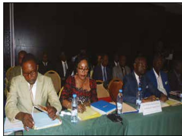
Des participants à la rencontre.