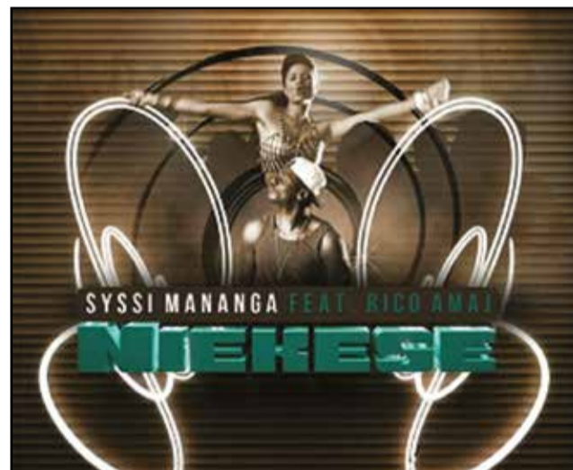
La pochette de la nouvelle oeuvre.