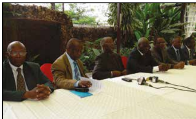
Vue des membres du bureau.

cation, par le président de la République, du corps électoral pour le 20 mars 2016, en vue de l'élection du président de la République, nous, Association des anciens ministres de la République: - exhortons tous les acteurs politiques à favoriser un climat de paix et de concorde, en vue de l'aboutissement heureux de ce processus électoral; - exhortons tous les acteurs