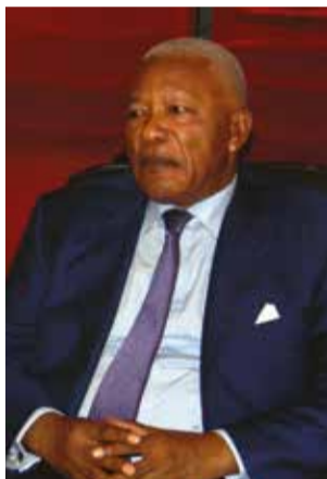
Isidore Mvouba, président du C.c.a.s.

Lancée en 2012, la réalisation des projets relatifs à la municipalisation accélérée du département du Pool n'échappe pas, depuis l'année dernière, à la conjoncture économique internationale marquée par la chute du prix du baril de pétrole. Les participants se sont réjouis de l'achèvement d'un certain nombre de projets comme l'électrification de Kinkala, à partir d'une ligne haute tension partant de Mindouli, mais ils souhaitent la reprise des travaux. La suspension des travaux de la route Kinkala-Mindouli (54 Kms), depuis le 2 novembre 2015, les préoccupent profondément. Le gouvernement n'a versé, au mois de janvier dernier, que 2 milliards de francs, sur sa contre-partie qui est de 24,5 milliards de francs Cfa. Ce que le groupement d'entreprises en charge des travaux a jugé insuffisant pour reprendre le chantier. Or, la suspension des travaux est assortie d'une pénalité de 1,2 milliard de francs Cfa par mois pour l'immobilisation des engins. Par ailleurs, l'érosion menace les travaux de terrassement déjà réalisés. Si le gouvernement ne trouve pas une solution urgente pour relancer ce chantier, il risque de déboucher sur un énorme gâchis. Le président