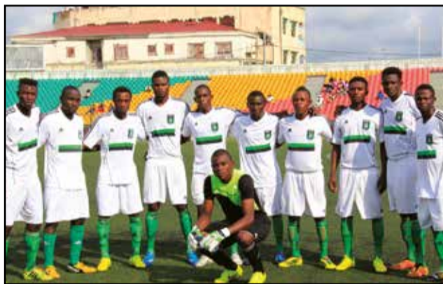
V. Club Mokanda de Pointe-Noire

limiter les dégâts, mais, en gagnant. Pour envisager la suite de la compétition avec un peu plus d'optimisme. Cela est