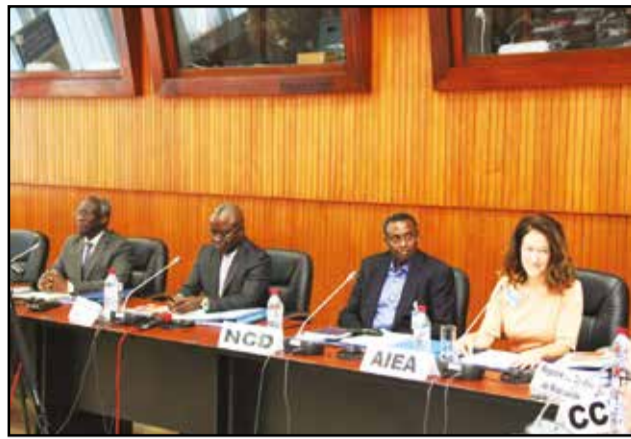
Le présidium, à l'ouverture de l'atelier.