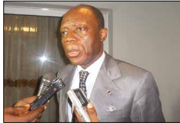
Jean-Marie Michel Mokoko.

Le retour à Brazzaville, mardi 9 février 2016, par le régulier de Taag, la compagnie aérienne angolaise, du général Jean-Marie Michel Mokoko, qui a déclaré sur les médias internationaux, sa candidature à l'élection présidentielle anticipée du 20 mars 2016, a été émaillé d'incidents graves, au parking de l'aéroport international Maya-Maya, qui se sont soldés par des blessés et des dégâts matériels importants, notamment des véhicules endommagés. Rentré de Paris (France), lui et les sympathisants venus l'accueillir ont été victimes, à la sortie de l'aérogare, de bombes lacrymogènes et de jets de pierres de la part d'éléments incontrôlés. Quelques journalistes venus, simplement, faire leur travail de presse ont été tabassés et certains ont perdu leurs biens, dont une caméra. Des personnes innocentes, venues simplement à l'aéroport accueillir un parent, ont été malmenées et rouées de coups. Une scène ahurissante et décevante qui n'augure pas de perspectives meilleures pour notre démocratie, à la veille de ce scrutin présidentiel.