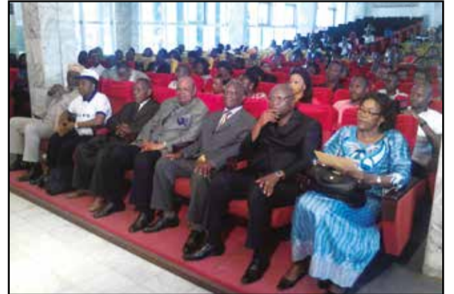
Les participants à la rencontre fraternelle.

Pour les ressortissants du Kouilou, le choix porté sur le président Denis Sassou-Nguesso tient à «sa capacité à promouvoir des grandes valeurs, telles que le dialogue social, politique et surtout la consolidation de la paix, un des piliers du développement de la République du Congo». Une hypothèse soutenue par de nombreuses autorités politiques présentes à cette rencontre, à l'image du ministre Anatole Collinet Makosso.