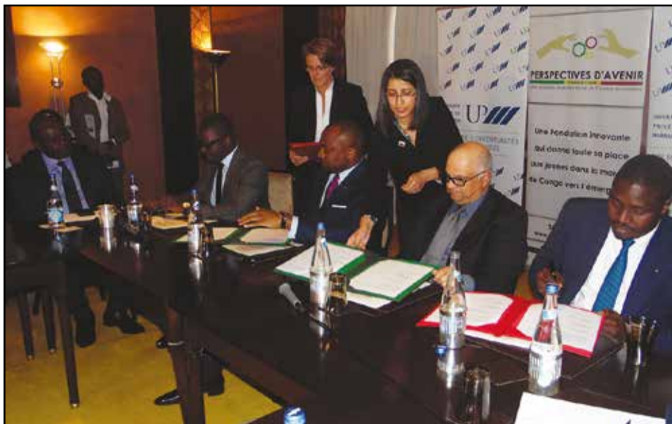
La signature des mémorandums.