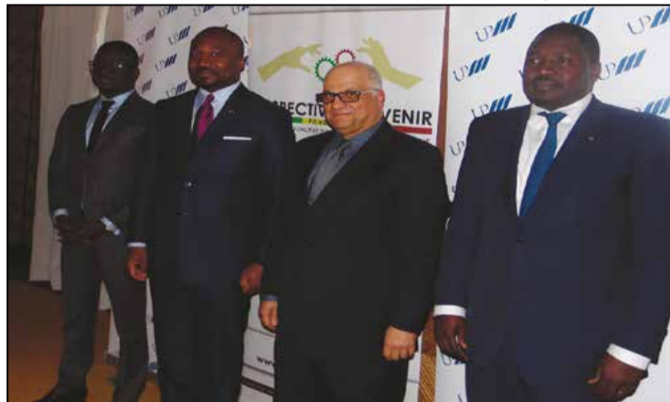
Les signataires des mémorandums.