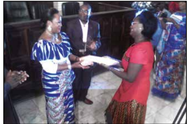
Antoinette Sassou-Nguesso recevant la contribution des compatriotes du Kouilou.

La première Dame, Mme Antoinette Sassou-Nguesso, était à la mairie centrale de Brazzaville, samedi 7 février 2016, pour une rencontre citoyenne dite «familiale», avec les fils et filles des départements du Kouilou et de Pointe-Noire, pour exprimer leur choix à l'élection présidentielle anticipée du 20 mars 2016. A cette occasion, les participants ont, à l'unanimité, lancé un appel solennel à la candidature du président Denis Sassou-Nguesso à la présidentielle du 20 mars prochain.