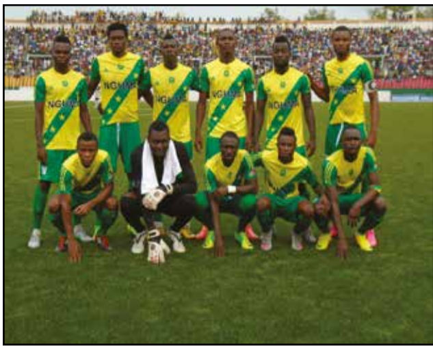
Etoile du Congo.

A Pointe-Noire, V.Club Mokanda s'apprête à accueillir, samedi 13 février, les Nigériens d'Akwa United F.C, dans son antre du Complexe sportif de la capitale économique congolaise. Sa rentrée marquera son retour en compétition africaine, sa dernière participation remontant à l'année 2000. Un pronostic? Plutôt un souhait, malgré un début de saison quelconque et pas rassurant: une large victoire garantira la carrière africaine de V.Club Mokanda.