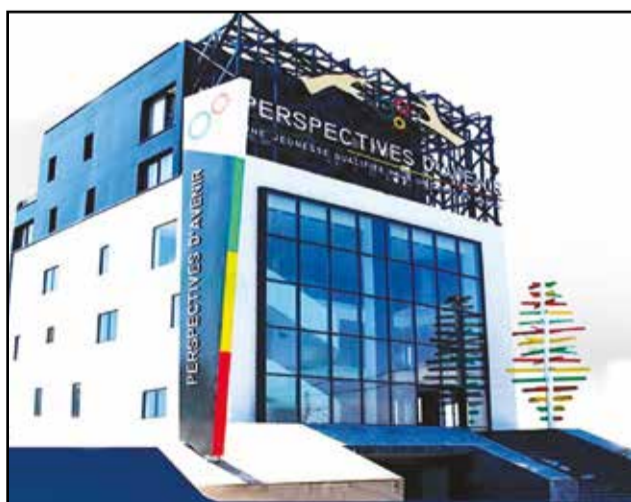
Le siège de la Fondation Perspectives d'avenir à Brazzaville.

seront organisées, du 12 au 14 février. Il est prévu un forum sur «la contribution des jeunes à la construction d'une émergence durable en Afrique et au Congo», en partenariat avec l'Unesco (Organisation des Nations unies pour l'éducation, la science et la culture), un dîner de gala de charité ainsi qu'un semi-marathon de l'unité. Le dîner de gala, qui connaîtra la participation de nombreuses personnalités nationales et internationales du monde politique, des affaires et du show business, a pour objectif de mobiliser des ressources financières au bénéfice des fonds «Kelasi» pour les bourses et «Telemas» pour l'entrepreneuriat mis en place par la Fondation perspectives d'avenir, en faveur des jeunes Congolais issus