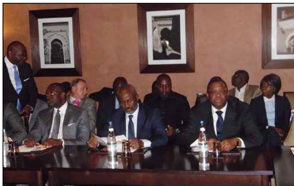
L'assistance. On reconnaît à l'extrême droite, l'ambassadeur du Congo au Maroc.

s'implanter et, à une certaine mesure, à réaliser au Congo et plus précisément dans le Département de la Cuvette, et le District d'Oyo, dont je suis l'élu, un projet universitaire, pour permettre, justement, non pas seulement aux étudiants congolais, mais également, de faire ce pôle universitaire puisse servir de pôle académique aux autres