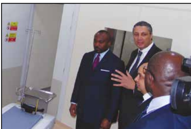
...A la clinique Le Marrakech.

Africains qui souhaiteraient venir étudier dans cette zone du Congo. Donc, voilà un peu l'action principale de ce partenariat que je souhaite fructueux, parce que je considère que sans formation, il n'y a pas de développement possible et ça, il faut que les générations