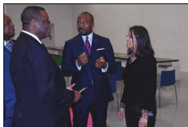
Pendant la visite à l'Université privée de Marrakech...

Quelles sont les prochaines étapes, après la signature de ces mémorandums? «Pour nous, la partie ma-