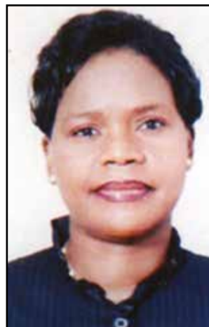
Par Lydie-Patricia Ondziet.

se choisit pour l'incarner, à la fois dans le pays, mais aussi à l'étranger. Il est le visage et le porte-parole des citoyens, dans ses déplacements internationaux. Visage intérieur donc, mais aussi représentation extérieure. La qualité de candidat à la présidence de la République ne s'improvise pas. Il faut afficher une expérience politique de très haut niveau. Une longue phase d'apprentissage paraît donc indispensable. Le bon candidat est celui qui parvient à articuler un discours jugé réaliste et des propositions fortes. Les gens votent d'abord pour un candidat ayant à leurs