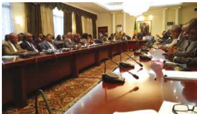
Les participants pendant la réunion.

de la République tient à la réalisation de cette route, mais sa volonté doit se traduire par la mobilisation des ressources financières, à l'heure où les caisses de l'Etat sont à l'épreuve de la chute du prix du baril de pétrole. Durant son séjour à Kinkala, le président Denis Sassou-Nguesso procédera à la pose de la première pierre de l'hôpital général et il visitera, sans doute, l'usine de verrerie en construction par une société chinoise à Kinkala. Le chef de l'Etat tiendra une rencontre citoyenne avec les