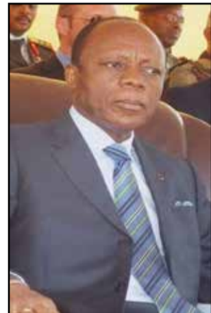
Jean-Marie Michel Mokoko.

Des esprits sains, l'âme chevillée à la patrie, ayant résisté au tropisme de la politique du ventre, savent bien que les acquis de la Conférence nationale souveraine de 1991 ont été, purement et simplement, immolés sur l'autel des appétits des différents politicards congolais. De fait, les jalons pour une mise en route d'un processus démocratique normal, posés lors de cette grand-messe nationale, ont été allégrement piétinés. Et le Congo a réalisé une grande régression sur tous les plans. L'on s'accorde ainsi à dire que