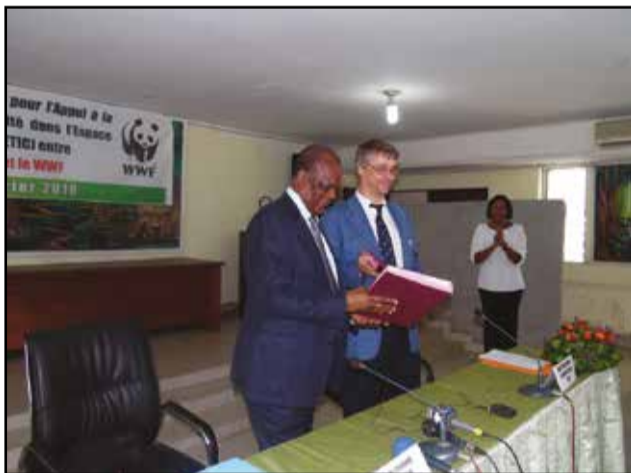
Echange de parapheurs entre Henri Djombo et Marc Languy.

Le gouvernement congolais, représenté par Henri Djombo, ministre de l'économie forestière et du développement durable, a procédé, mercredi 10 février 2016, à Brazzaville, à la signature d'un protocole d'accord pour l'appui à la gestion durable de la biodiversité dans l'espace Tridom interzone Congo (Etic), avec l'O.n.g internationale Wwf, représentée par Marc Languy, son directeur régional pour l'Afrique centrale. Cet accord valable, pour une durée de cinq ans, a pour but d'apporter un appui technique et financier conséquent dans l'Etic (Espace Tridom inter-zones Congo), ainsi que de promouvoir la conservation et la gestion durable de la biodiversité, le développement des activités alternatives à la chasse, au profit des communautés locales et des populations autochtones, tout en contribuant à la réduction de la pauvreté.