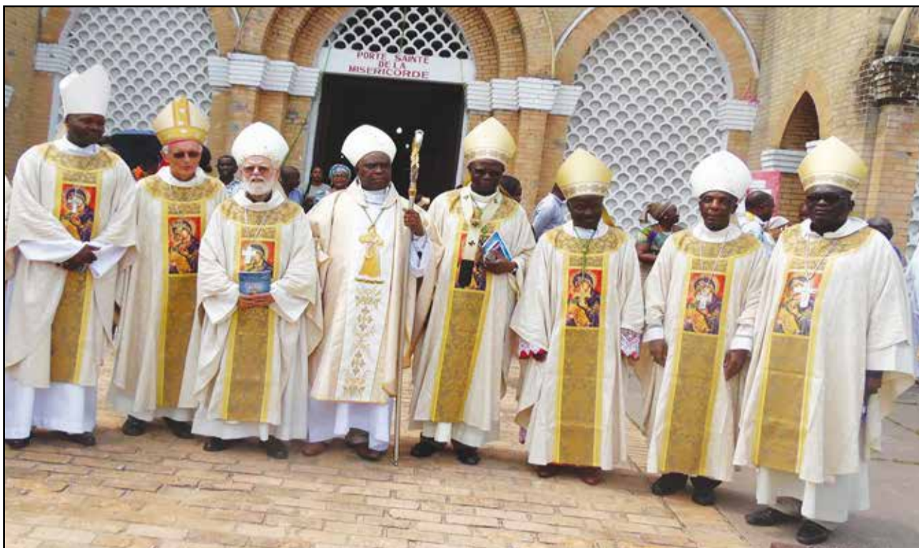
Les évêques du Congo posant pour la postérité.

Aux hommes politiques de notre pays, nous disons que la miséricorde est un acte politique par excellence, à condition de définir la politique dans son sens le plus noble, c'est-à-dire, la prise en charge de la famille humaine à partir des valeurs éthiques, dont la miséricorde est une composante principale, qui s'oppose à la violence, l'oppression, l'injustice et l'esprit de domination. Nous vous invitons, par la miséricorde de Dieu, à ne pas faire de la politique le lieu de règlement de comptes, ni de résolution de vos conflits d'intérêt. « Le domaine de la politique, dit le Pape Pie XI, est le champ de la plus vaste charité, la charité politique ». Ainsi, dans la gestion des affaires de notre pays, ne vous limitez pas à vos intérêts personnels; au contraire, cherchez à privilégier le bien commun, pour donner au Congo un souffle nouveau (Message de Noël des Evêques du Congo,