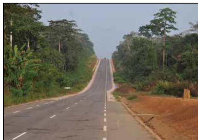
Un tronçon de la route. (P.3)

Le président Denis Sassou-Nguesso a inauguré la route Ketta-Sembé