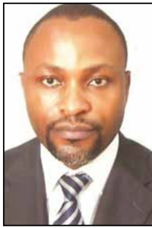
Par J.C. Ondaye-Ebauh.

Au sein d'une même famille ou entre amis, entre collègues de bureau ou au quartier, ces transactions sans support existent. Elles se nouent et se dénouent plus ou moins bien. Cette finance de l'ombre «désintermédiée» et dématérialisée est une part de la finance africaine. Elle n'a pas pris le train de la bancarisation. Elle n'a pas réussi à s'insérer dans celui de la microfinance. De toute évidence, elle est restée en marge des tentatives de régularisation. Dès lors, la question qu'on peut se poser est celle de savoir si cette finance, qui a déjà inventé ses propres instruments de fonctionnement, accèdera à la reconnaissance des régulateurs. Dans le prolongement de ce questionnement, peut-être devrait-on parler