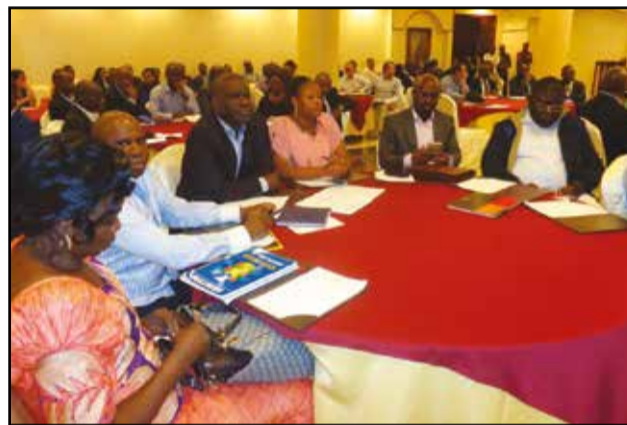
Une vue des participants.

experts du Cabinet Price sont aussi revenus sur les redressements récurrents, sur lesquels ils ont attiré l'attention de leurs clients et partenaires qui sont des