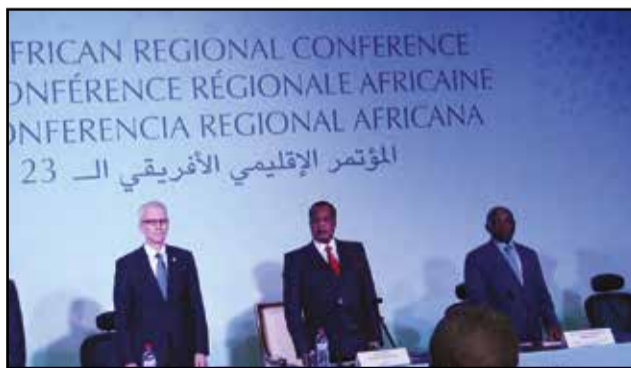
Le président Denis Sassou-Nguesso entouré de Jürgen Stock et Zéphirin Mboulou.

trafic de stupéfiants, la cybercriminalité, etc. Des recommandations ont été prises, au nombre desquelles la réalisation de l'initiative 20-20. Selon le secrétaire général d'Interpol, le seul moyen de lutter avec succès contre ces menaces pour la sécurité est de leur opposer une réponse coordonnée, en utilisant l'infrastructure, les capacités et le réseau des polices à travers Interpol, en association avec l'expertise les services chargés de l'application de la loi de toute l'Afrique et au-delà. «Après trois jours d'échanges