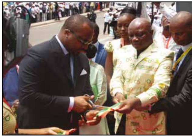
Denis Christel Sassou-Nguesso coupant le ruban symbolique.

La Fondation s'est orientée, ensuite, vers la préparation des jeunes à l'entrepreneuriat, en vue de l'auto-emploi.