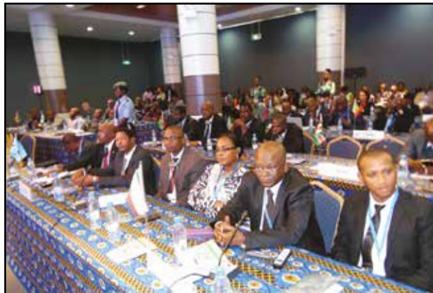
Vue partielle des participants à la conférence.