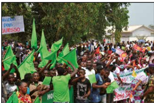
Une vue des populations, pendant la cérémonie.

Initialement prévu à 121 kilomètres entre Ketta et Biessi, le premier tronçon a été porté à 169 kilomètres, pour atteindre la communauté urbaine de Sembé, soit un supplément de 48 km. Réalisée en 42 mois, par la société chinoise Sinohydro corporation, pour la somme de 101 milliards 143 millions 640 mille 428 francs Cfa, cette route, entièrement bitumée relie d'un trait Ketta à Sembé, à travers la forêt. Ce qui était un rêve il y a quelques années. Département à la végétation forestière, la Sangha est confrontée à un sérieux problème de circulation. «Pour nous rendre, ne serait-ce qu'à Ouesso, le chef-lieu du département, ou circuler d'un point à l'autre du département, il fallait passer des semaines, voire des mois. La montagne Bessié, qui a causé tant d'accidents et de morts, a été aplanié. Avec la construction de la route Ketta-Sembé, nous débordons de joie et nous voulons dire merci au président de la République, grâce à qui nous avons cette