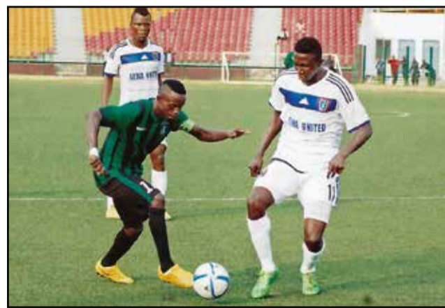
Le public n'a pas répondu présent en grand nombre lors de la venue d'Akwa United à Pointe-Noire. C'était un mauvais présage.