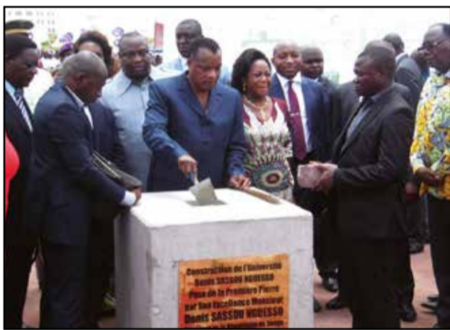
La pose de la première pierre par le Président de la République.