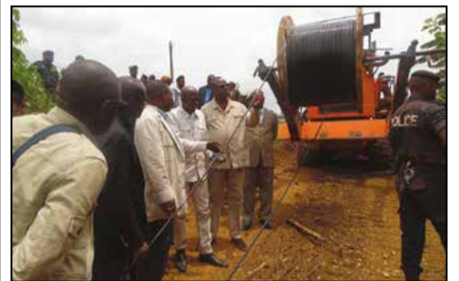
Le ministre Hellot Matson Mampouya à côté de Yvon Didier Miehakanda, coordonnateur du projet Cab, et sa délégation constatant l'évolution des travaux

Co-financée par la Banque mondiale et les Etats de l'Afrique centrale, la construction des infrastructures de télécommunications de très haut débit dans la sous-région, à travers un réseau d'interconnexion en fibre optique, progresse avec grand espoir. L'interconnexion du Congo au Gabon, à travers le réseau de fibre optique qui est en train d'être placé entre Dolisie et Mbinda, sera bientôt une réalité. Le ministre des postes et télécommunications s'en est lui-même rendu compte.