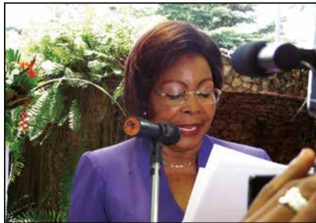
Mme Yvonne Adélaïde Mougany.

Le Ministère des petites, moyennes entreprises et de l'artisanat va organiser, cette année 2016, la première édition des assises nationales de l'entreprise congolaise. C'est ce qu'a annoncé Mme Yvonne Adélaïde Mougany, ministre des petites, moyennes entreprises et de l'artisanat, samedi 23 janvier 2016, lors de la cérémonie de vœux au sein de son département ministériel, organisée à l'hôtel Olympic palace, à Brazzaville. Objectif de ces assises nationales sur l'entreprise: avoir une vision de l'opérationnalisation de celle-ci qui sera consignée dans le document portant sur la contribution des entreprises à l'émergence du Congo d'ici à 2025.