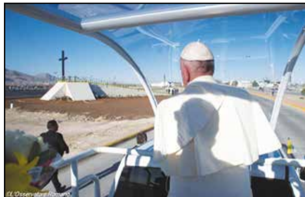
Le Pape a célébré sa dernière messe au Mexique à Ciudad Juarez, devant le mur de séparation entre les Etats-Unis et le Mexique.

Revenu du Mexique, voyage ponctué par l'historique rencontre avec le Patriarche orthodoxe russe Cyrille, à La Havane, le 12 février, le Pape François a renoué avec les activités habituelles. Ainsi, vendredi dernier, il a suivi la première prédication du Temps de Carême donnée en sa Chapelle Redemptoris Mater par le capucin Raniero Cantalamessa. Le prédicateur de la Maison pontificale a axé sa réflexion sur la liturgie, soulignant que le Concile œcuménique Vatican II lui avait donné comme un supplément d'âme; qu'elle était l'un des fruits majeurs du Concile. Mais, a-t-il mis en garde, le chrétien doit adorer Dieu «en esprit et en vérité». Car la liturgie ne consiste pas en une répétition mécanique de ritournelles et de rites. «La tradition est comme une musique. Que serait une mélodie si elle s'arrêtait sur une note, en la répétant à l'infini? Cela arrive avec un disque qui s'use et nous savons l'effet désagréable que cela produit», a dit le