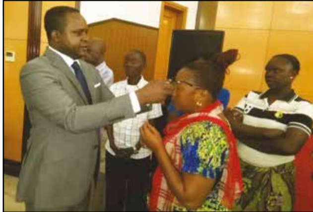
Le président de l'A.p.c faisant porter les lunettes à une patiente.

C'est donc, simplement, dans le but de répondre à une forte demande des populations que l'Opération lunettes pour tous a été conçue», a-t-elle expliqué. Avant d'annoncer la mise sur pied de la Fondation A.p.c, qui aura, dorénavant, la responsabilité d'exécuter les actions sociales et humanitaires, en lieu et place du parti A.p.c.