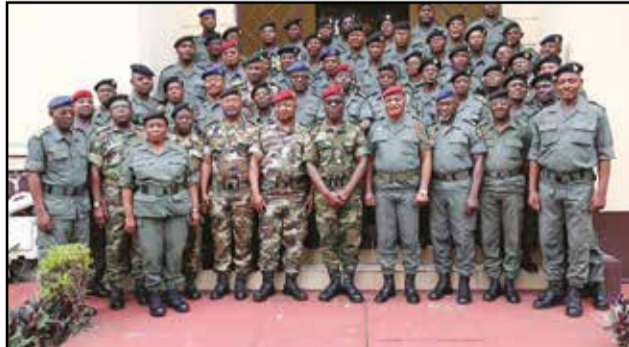
Les militaires retraités posant avec les autorités des F.a.c.

deuxième sentiment, c'est que je quitte cette corporation qui m'a vu naître, parce que j'ai passé toute ma vie dans les F.a.c, c'est-à-dire, je suis passé à l'Ecole général Leclerc et je termine dans les F.a.c. Et une vie comme ça, on ne l'oublie pas facilement». Une parade militaire, suivie d'un repas, a clos la cérémo-