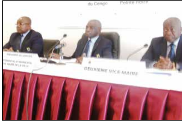
Le présidium de la rencontre.

L'ouverture de cette session ordinaire en cette période pré-électorale a donné l'opportunité au président du Conseil départemental et municipal de parler de l'élection présidentielle du 20 mars prochain. Il a, une fois de plus, exhorté les acteurs politiques et au-delà, les citoyens