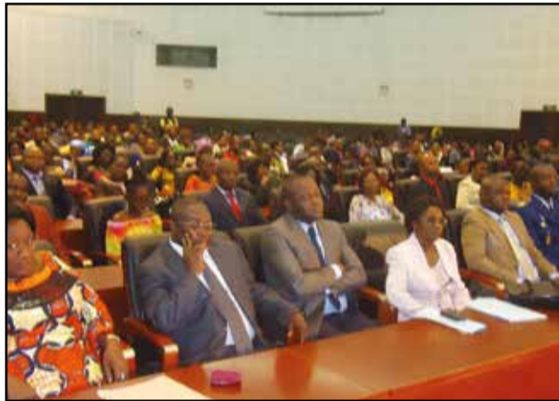
Les cadres et agents du ministère des affaires sociales.

tégie d'inclusion productive des ménages bénéficiaires des transferts sociaux», a-t-elle dit. Concernant l'I.n.t.s (Institut national du travail social), créé avec une première promotion de 60 étudiants, les cours ont été correctement assurés, grâce au concours du Ministère de l'enseignement supérieur. Courant 2016, a-t-elle annoncé, le deuxième concours sera organisé au titre de l'année académique 2016-2017. Par ailleurs, cette année, des sessions de formation continue seront organisées, en vue de la requalification des travailleurs sociaux de terrain.