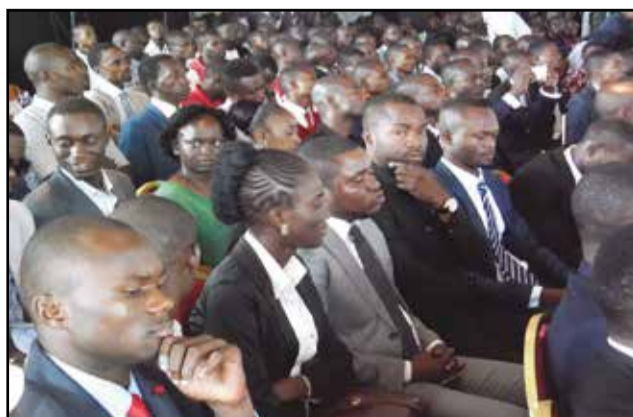
Les participants au «dialogue intergénérationnel entre le président de la République et les jeunes».

Et les jeunes n'ont pas eu leur langue dans la poche.