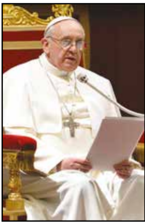
Le Pape François.