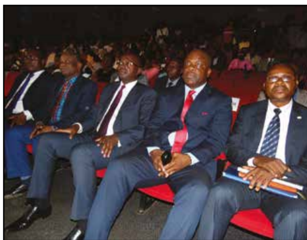
Les officiels pendant la cérémonie.

Okiémy. Remerciant les lauréats et le manager des Sanzas de Mfoa, le ministre de la culture et des arts a, dans son mot de circonstance, invité les artistes à jouir du fruit de leur travail, en faisant de telle sorte que leurs œuvres soient protégées. Signalons que le concept