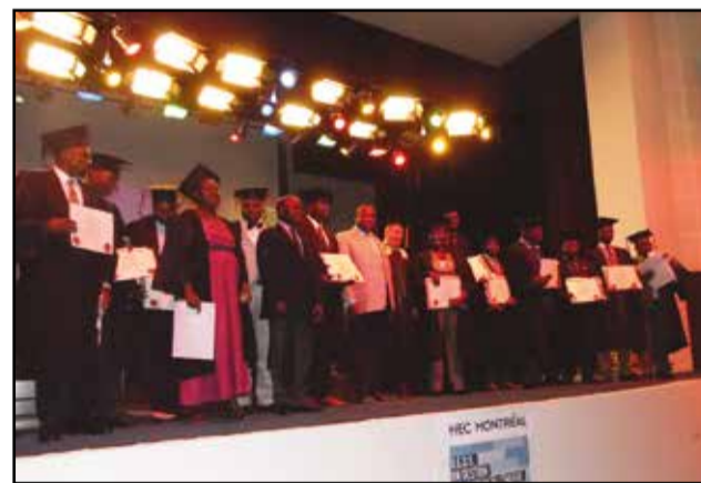
Photo de famille des diplômés avec les officiels.