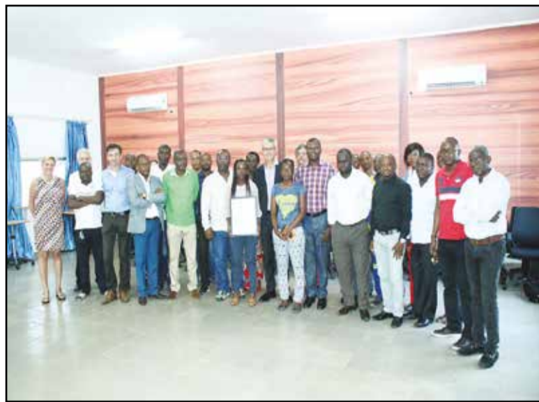
Cette nouvelle certification vient compléter les précédentes obtenues respectivement en 2013 (pour le Shipping) et en 2014 (pour les Solutions logistiques et la Logistique Pétrolière)

Import/Export - Agence Express - Manutention portuaire.