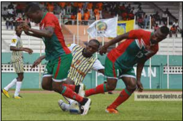
Africa Sport-Diabes-Noirs à Abidjan

Les matchs retour des préliminaires des coupes africaines des clubs ressemblaient bien à un défi pour les trois représentants congolais. Au sortir de cette étape, acceptable en est le bilan. Excepté les Diabes-Noirs, qui ont lamentablement échoué, une fois de plus à cette étape, V.Club Mokanda de Pointe-Noire et Etoile du Congo, de leur côté, ont obtenu, brillamment, leur qualification pour les seizièmes de finale.