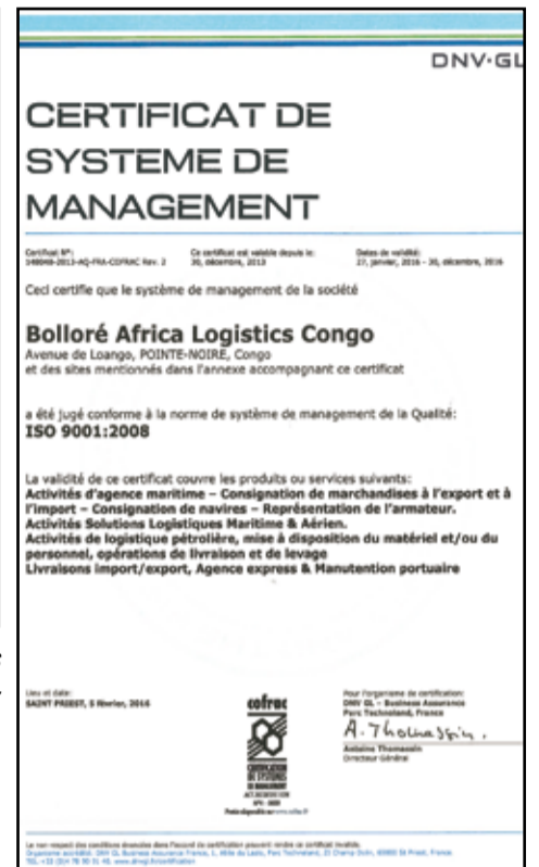
Le certificat ISO.

d'œuvre pour migrer, d'ici la fin de l'année 2016, vers la nouvelle norme ISO 9001 : 2015 pour l'ensemble de nos métiers certifiés. Ceci dans un souci constant de conformité garantissant la qualité de service délivrée à nos clients.