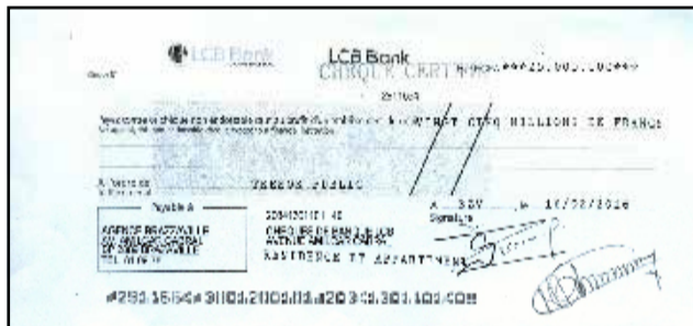
Le chèque certifié de 25 millions de francs Cfa et la déclaration de recettes qui lui a été délivrée.