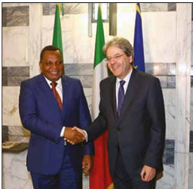
Jean-Claude Gakosso et Paolo Gentiloni.

de la Chapelle Sixtine. «Mais, peut-être parce que les trésors de la Chapelle Sixtine s'offrent au regard de tous sur Internet, c'est plutôt la magnificence de la Basilique Saint-Pierre qui m'a le plus impressionné», a-t-il confié. Le ministre était venu en Italie pour consolider une coopération italo-congolaise qui ne cesse de se nourrir de symboles forts et de marques qui ne sont pas seulement de courtoisie. Le ministre italien des affaires étrangères, Paolo Gentiloni, a invité son homologue à la Farnesina, l'imposant siège de la diplomatie italienne, en bordure de Rome, pour le suivi et la concrétisation de dossiers d'intérêt commun entre les deux Etats. C'est le Congo que le premier ministre italien Matteo Renzi avait choisi, en juillet 2014, comme l'un des trois pays qu'il devait visiter, lors de la toute-première tournée africaine d'un premier ministre italien en exercice. Il s'arrêtait à Brazzaville et revenait alors de Maputo, au Mozambique, avant de se rendre à Luanda, en Angola: trois pays au cœur de la stratégie énergétique italienne «pour les trente prochaines années», comme on aime à rappeler à Rome. Le président Sassou-Nguesso s'est aussi rendu en Italie