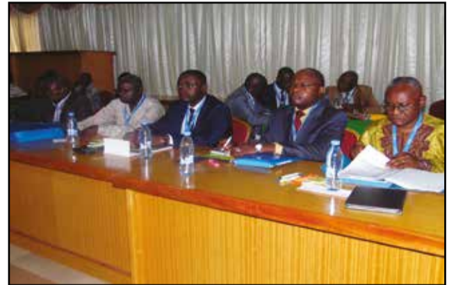
Les participants pendant les travaux.