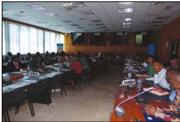
Les participants venus des différents pays.

Ouvert par le ministre de l'enseignement supérieur, Georges Moyen, l'atelier de formation à l'enregistrement des registres africains francophones des cancers s'est tenu du 8 au 12 février, au siège du bureau régional de l'O.m.s pour l'Afrique, à Sangolo, dans le 8 e arrondissement, Madibou.