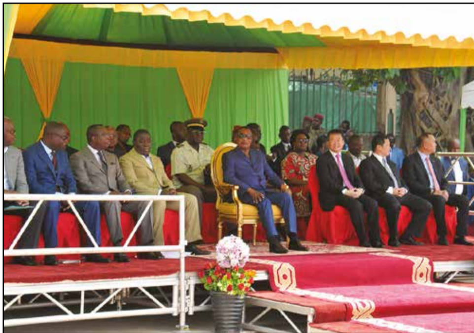
La tribune officielle.

nion, tandis que la salle informatique et celle des archives seront logées au deuxième étage. «La direction générale et les départements techniques ainsi que les quelques