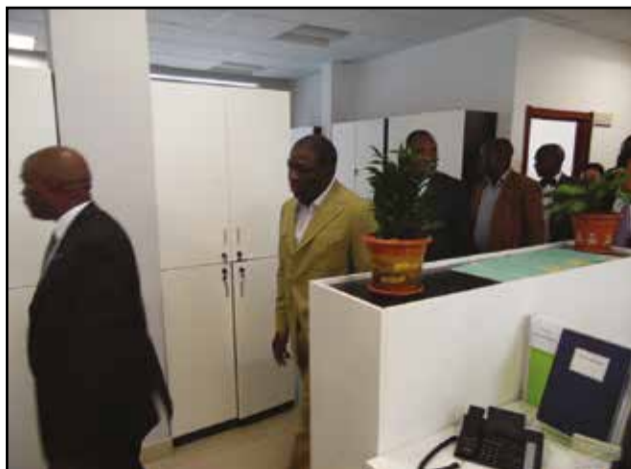
La visite du siège de l'agence de Brazzaville.