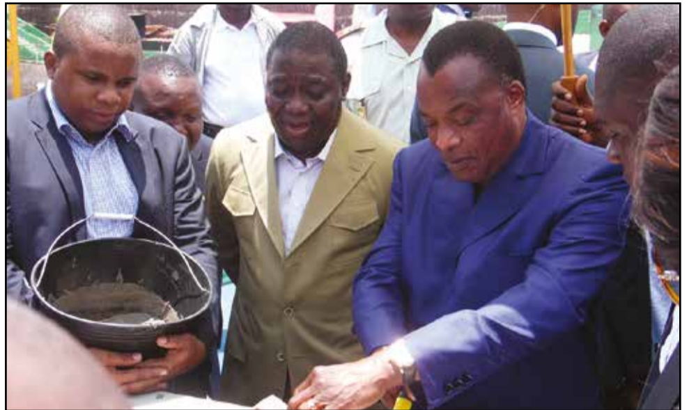
Denis Sassou Nguesso posant la première pierre.

Le Président de la République, Denis Sassou-Nguesso a procédé, jeudi 25 février 2016, à la pose de la première pierre pour marquer le démarrage officiel des travaux de construction du siège social de la BSCA Bank (Banque Sino-Congolaise pour l'Afrique) à Brazzaville. Bâti à l'ex-piscine Caïman, au centre-ville, le siège de cette nouvelle banque est un immeuble de quinze étages, d'un coût total de 30 milliards de francs Cfa y compris l'équipement, entièrement financé sur ressources propres de la BSCA Bank. C'est la société CSCEC (China State Construction and Engineering Corporation) qui réalise les travaux, sous le contrôle de la société congolaise Architecture, Imagerie et Construction d'Eugène Okoko.