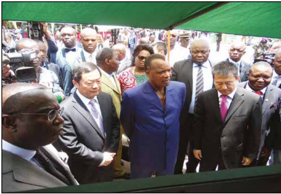
Explication technique du chantier.