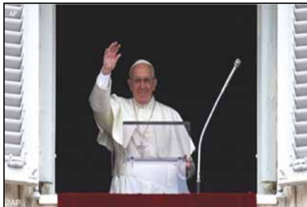
Le Pape François.

«Chacun de nous ressemble un peu à un arbre qui, pendant des années, a donné de nombreuses preuves de sa stérilité», raconte le Saint-Père aux fidèles. «Mais, heureusement pour nous, Jésus est comme le paysan qui, avec une patience sans limite, obtient encore une extension du figuier infécond: «Laissez-le encore cette année» dit le maître. «Nous verrons s'il portera des fruits à l'avenir». (V.9). Une «année» de grâce: le