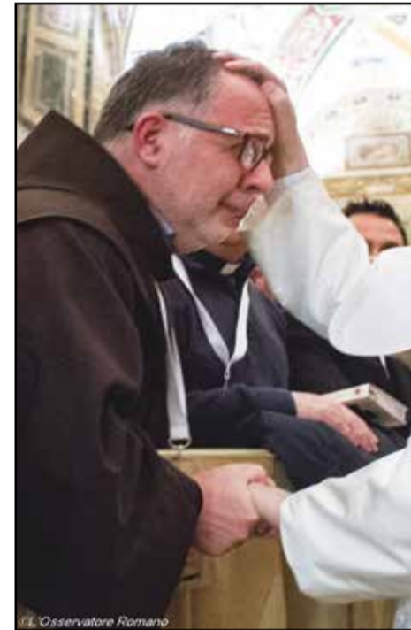
Les missionnaires de la Miséricorde envoyés aux quatre coins de la planète, reçus par le Pape au Vatican.

Dans l'actualité de la semaine au Vatican, signalons tout d'abord que c'est le cardinal italien Gualliero Bassetti, archevêque de Pérouse, que le Pape François a chargé de rédiger les méditations du chemin de croix de cette année. Elles seront lues en présence du Pape lors du chemin de croix du Colisée, le vendredi-Saint (25 mars). Le cardinal indique qu'il a choisi, lors des 14 stations du chemin de croix, le thème de la souffrance de l'homme d'aujourd'hui, de la famille et des persécutions, avec comme fil conducteur l'amour et le pardon. Vendredi à midi, le Pape a rencontré, au Vatican, les membres du