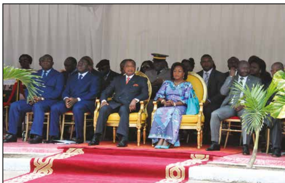
Vue de la tribune officielle.

ces performances et l'efficacité des services délivrés à sa clientèle. Ce nouveau siège ultra-moderne répond parfaitement à cet objectif, celui de renforcer l'ancrage du Groupe BGFI Bank au Congo... En renforçant notre ancrage au Congo, nous confirmons et poursuivons, avec la plus vibrante énergie, notre volonté d'accompagner non seulement les grandes entreprises et les institutionnels, mais également les PME et les PMI créatrices d'emplois, les particuliers et, généralement, les classes moyennes émergentes. L'un de nos plus grands défis reste encore de faciliter l'accès du plus grand nombre à nos services financiers. Et c'est bien là un challenge que nous partageons tous. Comment contribuer à l'accroissement du taux de bancarisation sur notre continent? Assurément, je le pense, grâce à une plus grande inclusion financière capable d'accompagner le financement de l'économie réelle! C'est tout le sens de notre engagement. Depuis notre implantation, BGFI Bank Congo a accompagné la réalisation de plusieurs projets structurants. Et j'aimerais vous en citer quelques exemples forts: -la réhabilitation des installations du Chemin de Fer Congo-Océan, qui facilite la fluidité des déplacements des personnes et des marchandises entre le Port de Pointe-Noire et la capitale, Brazzaville; -la construction de la Centrale électrique du Congo, maillon essentiel du boulevard éner-