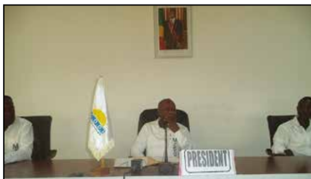
Le présidium, pendant la session.