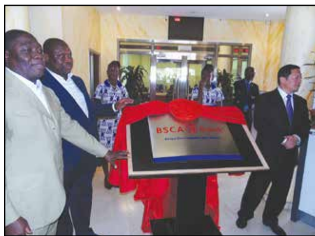
Dévoilement de la plaque.