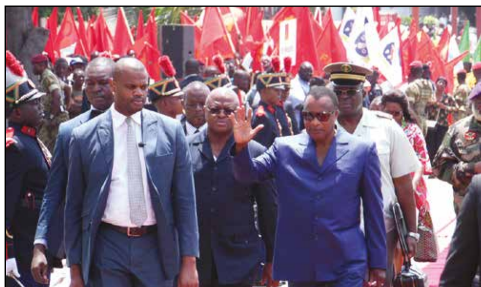
Le chef de l'Etat prenant un bain de foule.

vés congolais et français (21,5%), la société Magminerals Potasses du