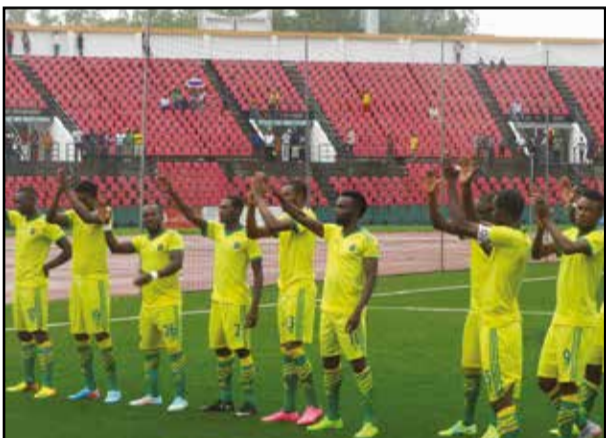
Les vainqueurs stelliens de Manga Sport du Gabon. (P.23)

La triple gagnée d'Etoile du Congo fait un malheur!