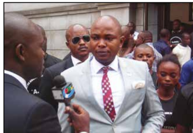
Ici, il répond aux questions d'un journaliste.