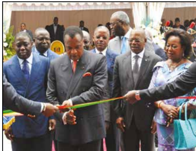
Le Président de la République procédant à la coupure du ruban symbolique.

commerciaux internationaux, pour citer ceux-là. Le Groupe BGFI Bank, c'est plus de mille milliards de francs Cfa de financements en cinq ans, consacrés au financement pour le développement économique du Congo. Mais, le groupe BGFI Bank, c'est aussi un engagement, celui de contribuer au bien-être des populations dans tous nos pays d'implantation avec la Fondation BGFI Bank pour les générations futures. Notre Fondation a ainsi contribué à hauteur de 50 millions de francs Cfa aux projets initiés par la Fondation Congo Assistance, pour la réalisation d'une structure dédiée aux personnes du