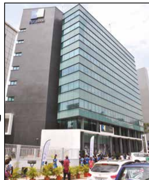
Le nouveau siège social de BGFIBank. (P.3)

Le Président Denis Sassou-Nguesso a inauguré le siège social à Brazzaville, un immeuble ultra-moderne