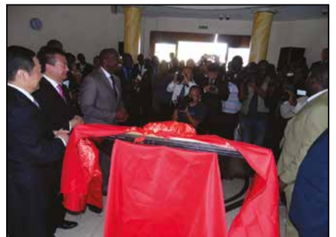
L'ambiance avant le dévoilement de la plaque.

Il sied de signaler que la BSCA Bank avait ouvert son agence de Brazzaville, depuis le 1er juillet 2015. Son programme national pour l'année 2016 prévoit l'ouverture d'une agence à Pointe-Noire, le 1er juillet, et une autre agence à Brazzaville, sur l'avenue Amilcar Cabral, avant le 30 septembre, ainsi que le déploiement de 30 distributeurs automatiques de billets dans les quartiers de Brazzaville et Pointe-Noire. A partir de 2017, la BSCA Bank ouvrira, progressivement, des agences ou bureaux dans les dix autres