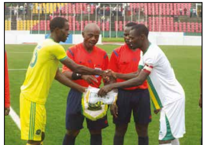
Echange des fanions entre les capitaines de deux équipes.