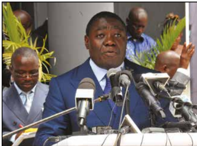
Le ministre d'Etat Gilbert Ondongo.

gétique qui relie le Sud et le Nord du Congo, permettant ainsi d'éclairer plusieurs centaines de milliers de foyers; -les travaux d'extension du Port Autonome de Pointe-Noire, qui ont favorisé le doublement du trafic des conteneurs; -les travaux de réhabilitation du Port fluvial de Brazzaville, qui ont fortement contribué à améliorer la sécurisation de cette plateforme incontournable dans les échanges