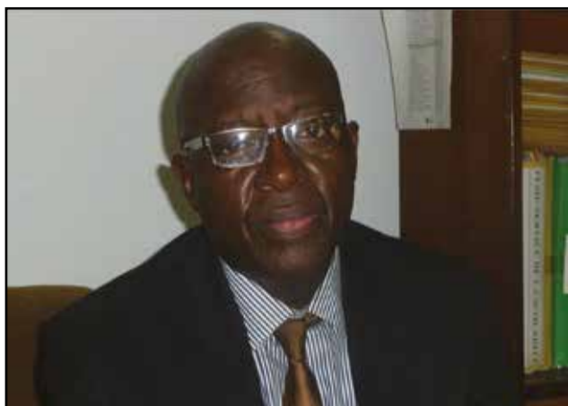
Dieudonné Tsokini.

Des chercheurs, des enseignants et des étudiants de l'Université Marien Nguabi, ainsi que des jeunes écrivains congolais, ont, de manière érudite, porté un regard critique sur la littérature et la langue dite de Molière. Les premières journées scientifiques de la formation doctorale Ellic ont été organisées, le 6 mai 2015, par la F.I.s.h (Faculté des lettres et des sciences humaines) de l'Université Marien Nguabi, dans les murs de cet établissement.