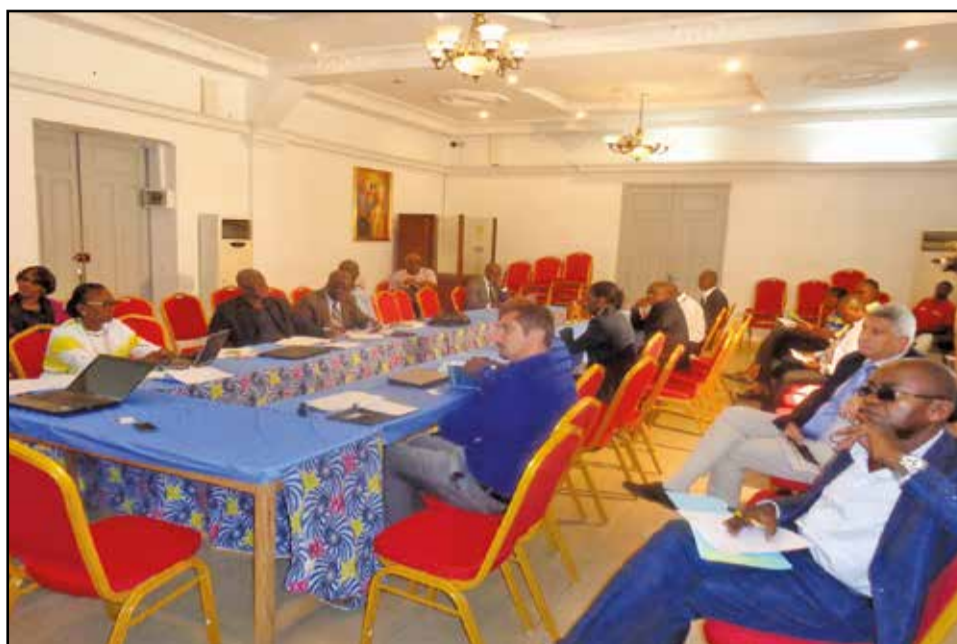
Les participants à l'atelier.