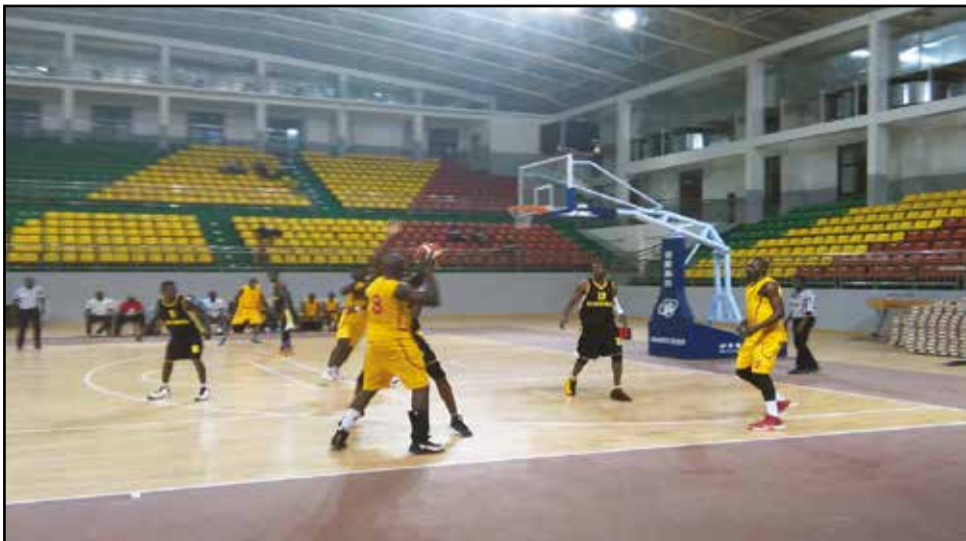
Inter Club-Diables-Noirs dominé par les militaires.