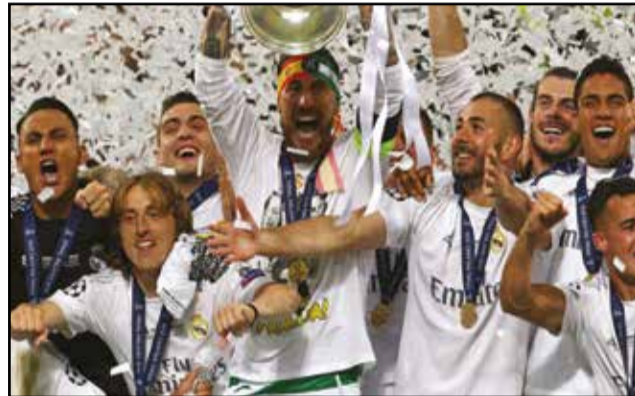
Le triomphe du Real Madrid.

de C1, après avoir concédé l'égalisation, à la 120 e minute, en 1974, et en prolongation, après s'être fait rejoindre à la 94 e minute, en 2014. Même si on s'attendait à mieux, sur le plan du jeu, c'était une belle finale, à Milan. Un rendez-vous des artistes. En premier lieu des défenseurs qui ont muselé les meilleures offen-