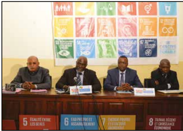
Le présidium, à l'ouverture de l'atelier.

O.m.d (Objectifs du millénaire pour le développement) fixée au 31 décembre 2015, les 17 nouveaux objectifs se fondent sur les huit objectifs des O.m.d établis en 2000 et visant à lutter contre la pauvreté. Au cours des 15 dernières années, les O.m.d ont encadré les actions pour le développement dans le monde. Des progrès ont été réalisés, ce qui témoigne de la valeur d'un tel programme unificateur par des objectifs et des cibles précis. En l'espace de 20 ans, 40% des personnes vivant dans la pauvreté ont pu se libérer des affres de ce fléau social. Cependant, malgré ces progrès, la pauvreté accable encore un grand nombre de personnes. D'où la portée et l'ambition du nouvel agenda, qui pourra permettre de faire des progrès appréciables en termes de développement