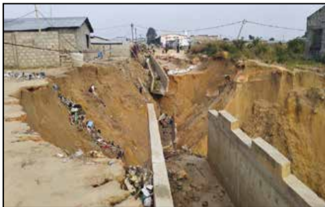
L'érosion a déjà emporté plusieurs maisons.

Non seulement sa maison a été emportée par l'érosion, mais encore l'érosion s'est agrandie, en emportant d'autres maisons et en menaçant, aujourd'hui, de couper la route goudronnée de la deuxième sortie Nord. Là-bas, le ministre de la ville pense qu'il faut