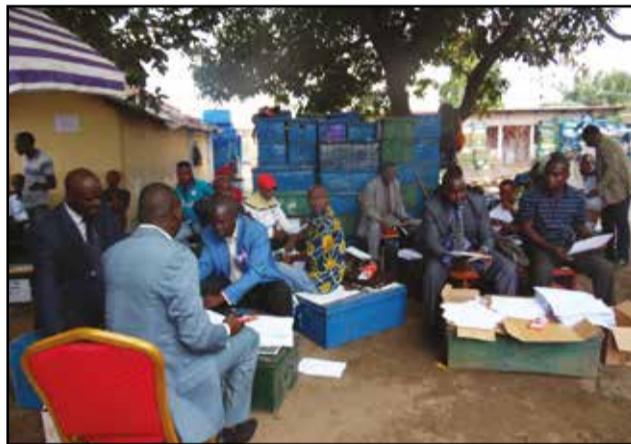
Les membres du jury de la D.e.c générale à pied d'oeuvre.

Cela n'est plus une chose à tolérer. Ma visite m'a permis d'être rassuré que rien ne pourra se reproduire, en 2016», a-t-il indiqué.