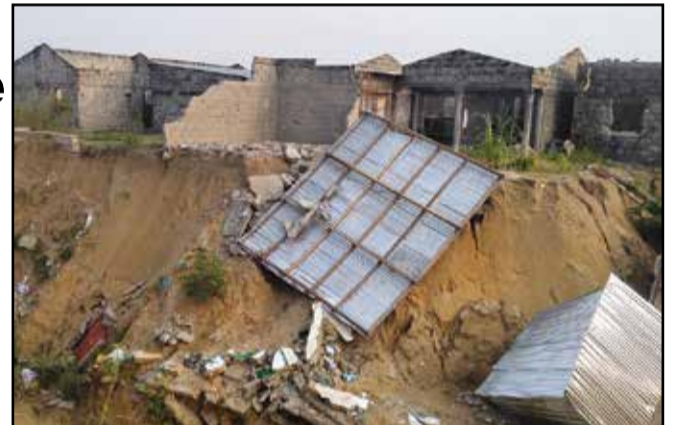
Un ravin au quartier Mont Boukiero, à Brazzaville (P.7)

Claude Alphonse N'Silou face au phénomène des érosions à Brazzaville