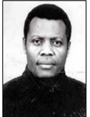
Abbé François Dominique Wambat.

Ainsi, les amis de la Communauté Abbé François Wambat, qui compte organiser un colloque pour honorer sa mémoire, pourront s'appesantir sur des thèmes variés, tels que: «François Wambat, un prédicateur infatigable, un propagateur intrépide de l'évangile»; «L'abbé Wambat et les malades»; «François Wambat, l'enseignant»; «François Wambat, l'historien et le chercheur»; «François Wambat et les étudiants»; «L'abbé Wambat et le Café des chercheurs»; «L'abbé Wambat, l'auteur-compositeur»; «François Wambat et les médias»; «L'abbé Wambat, l'écrivain»; «L'abbé Wambat, l'universitaire et l'intellectuel». En attendant ce rendez-vous, vous êtes invités à visiter ou à revisiter ce poème à lui dédié, publié dans notre recueil de poèmes, Épines de roses, aux éditions AMA, 2014. Ce poème témoigne de l'éternelle présence de l'abbé Wambat parmi nous, avec Dieu.