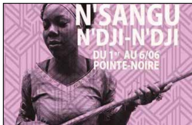
L'affiche de la 12 e édition.

«Cette année, nous allons encore rapprocher, bien que pour un petit temps, l'art et la culture des populations des quartiers, à travers la tenue de la douzième édition du festival international des musiques et des arts N'Sangu Ndji Ndji. Les artistes de grande expérience de la scène internationale, qui viendront de l'étranger, seront nos amis de tous les jours. La population de Pointe-Noire,