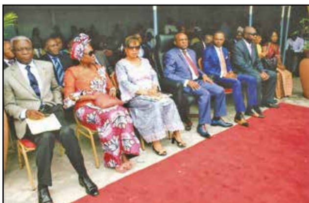
Les officiels pendant la célébration de l'évènement.

citoyenne de proximité visant à faire découvrir au grand public un échantillon des trésors issus du génie inventif des créateurs d'instruments traditionnels de musique du Congo et du continent africain», a-t-il affirmé, avant de saluer la signature de l'accord de partenariat entre le Fespam et l'E.s.g.a.e. Pour la représentante de l'Unesco, «les musées sont