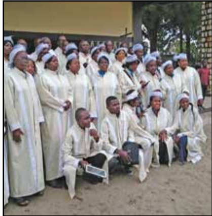
La chorale Père Paul Ondia à Boundji.

les installations ont été placées dans la cour de la paroisse devant le podium pour le début de la