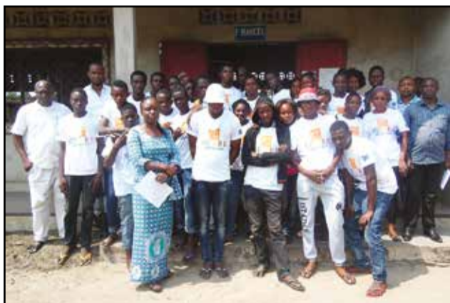
Les participants à la campagne posant avec les organisateurs.

missariat est d'interpeller la conscience des jeunes au changement de mentalités, d'attitudes et de comportements. Il faut les amener à abandonner les comportements violents de nature à perturber la sérénité dans les familles, les quartiers et la société tout entière.