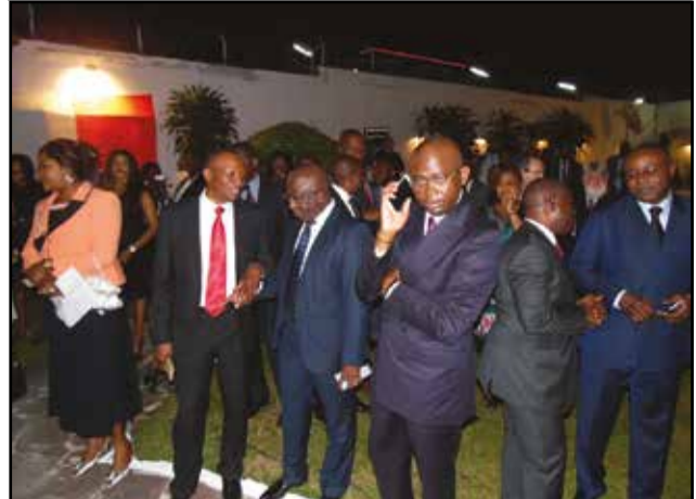
Les membres du gouvernement et quelques invités.

politiques respectifs et de les rendre cohérents les uns avec les autres, de la manière la plus efficace possible».