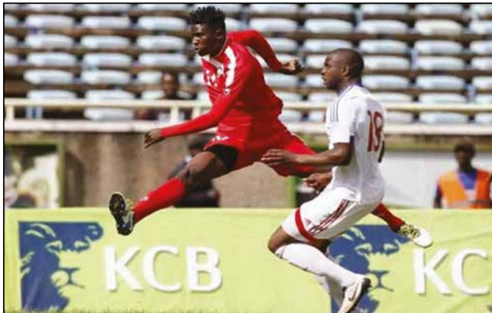
Kenya-Congo Dikamona à la peine.

terminera premier, quel que soit le résultat de la cinquième et dernière journée, en septembre prochain. Parce qu'avec 10 points à son compteur, contre 6 points seulement pour le Congo et la Zambie, puis 4, pour le Kenya, elle ne peut plus être rattrapée.