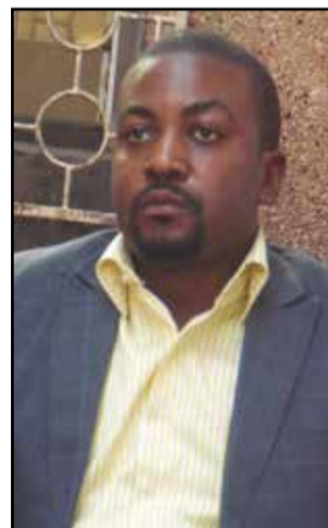
Prince Merveilleux Nsana

Jeune acteur politique, Prince Merveilleux Nsana a lancé un parti politique dénommé: P.d.r (Parti des démocrates pour le renouveau). Situé au centre, ce nouveau parti entend, selon lui, défendre les «vraies valeurs du centre». «Devant ce qui constitue comme un impératif du temps incontournable, nous déclarons résolu, à travers cette structure politique, de faire de l'unité nationale une vraie préoccupation permanente», a déclaré Prince Merveilleux Nsana, au cours d'un point de presse qu'il a animé, dimanche 29 mai 2016, au siège dudit parti, à Bacongo, le deuxième arrondissement de Brazzaville.,