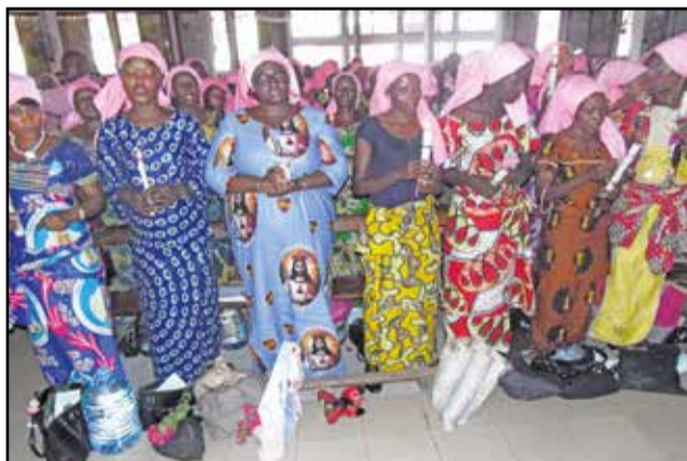
Les nouveaux membres pendant la promesse.

dévoit de Sainte Rita de mieux connaître Jésus, à travers Rita, dont la richesse est inestimable.