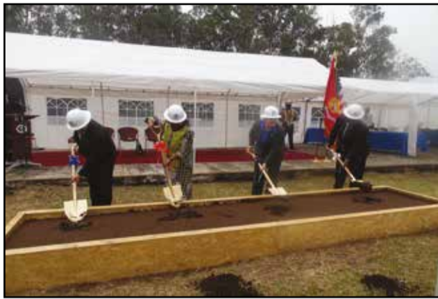
Pendant le lancement des travaux de l'extension de l'ambassade des U.s.a.

Pour Mme Stéphanie Sullivan, le projet d'extension de l'ambassade américaine est un signe concret des liens durables entre les Etats-Unis d'Amérique et le Congo, établis le 15 août 1960, et d'un partenariat solide traduisant l'intention des Etats-Unis de rester engagés au Congo. Ce projet combine l'innovation et la créativité des ingénieurs avec leur savoir-faire. Il va employer 150 Congolais qui n'auront pas seulement du travail, mais qui vont aussi accroître leur expertise technique dans le domaine de la construction. «La conception écologique reflète un domaine important de la coopération bilatérale. Etant donné que le bassin du Congo inclut la deuxième plus grande