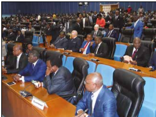
Les membres du gouvernement.

Nommé premier ministre, chef du gouvernement, le 23 avril 2016, par le président de la République réélu, Clément Mouamba a présenté, vendredi 3 juin 2016, aux députés, le programme d'action du gouvernement, au cours d'une plénière spéciale présidée par Justin Koumba, président de l'assemblée nationale. C'était en présence des membres du gouvernement. Une heure vingt minutes, c'est le temps qu'a duré la communication du chef du gouvernement qui, «face à la détresse sociale» de ses compatriotes, a décidé de faire de la «justice distributive», la base de son action gouvernementale. L'emploi, qui sera l'une des priorités des politiques publiques, est l'un des grands facteurs de cette «justice distributive».