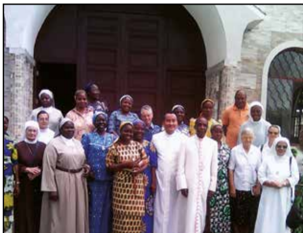
Les participants à l'assemblée autour de l'évêque de Kinkala et du chargé d'affaires. (P.12)

Vivre concrètement les appels de l'année de la miséricorde