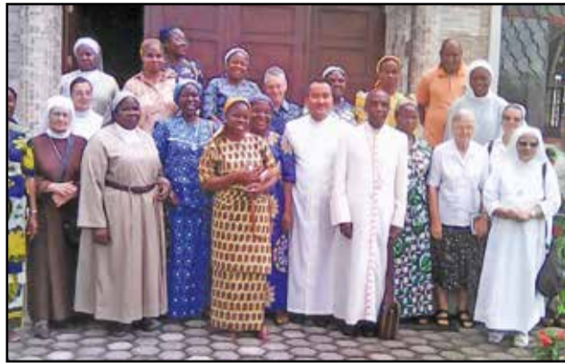
Les participants à l'assemblée autour de l'évêque de Kinkala et du chargé d'affaires.