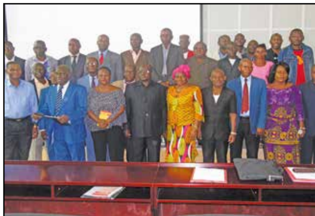
Les organisateurs et participants à la fin des travaux.

A l'issue de la formation, ils ont reconnu avoir amélioré la notion d'utilisation et de la valeur commerciale des ressources génétiques dans différents secteurs exploitant et utilisant ces ressources. Ils ont souhaité, également, au regard de la formation reçue, une permanente et franche collaboration entre pouvoirs publics, secteur privé, organisations de la société