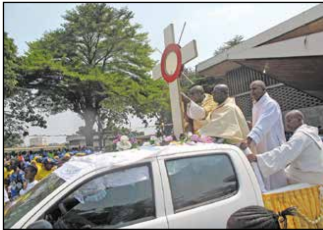
Le début de la procession dans le quartier.