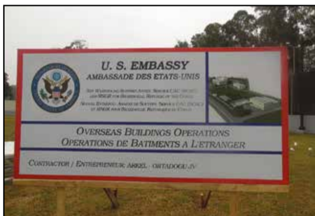
Une vue de la maquette.

forêt vierge au monde et abrite une faune d'animaux menacés et six mille plantes tropicales, il est donc approprié que le nouvel aménagement ajoutera plus de cinquante nouveaux arbres», a-t-elle indiqué. Selon elle, les Etats Unis vont tout faire pour soutenir le deuxième poumon vert de la planète, en réduisant les émissions de carbone.