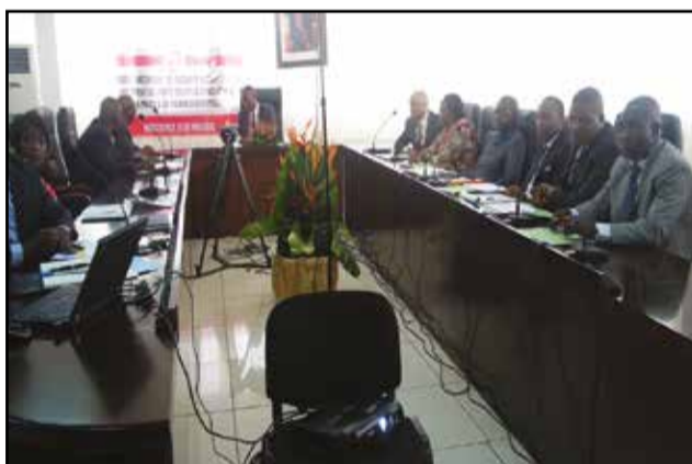
Le personnel de la C.n.s.s et l'équipe du cabinet Ernest & Young, pendant le lancement des travaux de l'audit.

c'est-à-dire le fichier à base duquel on paie les retraites. Après cela, nous passerons, alors à une seconde étape qui consiste à recueillir les données physiques des retraités, pour constituer la base de données biométrique qui permettra de payer les retraites et de contrôler les retraités. L'opération concerne tous les pensionnés ayant droit rentier. Il y aura une campagne d'information particulière, laquelle prévoit un