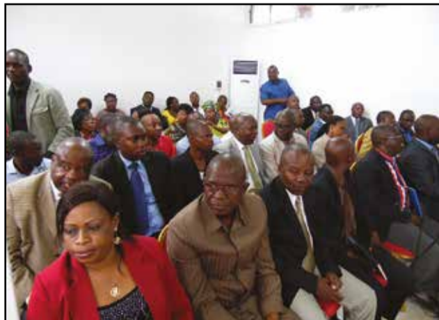
Des participants à la conférence-débat.

visant à préserver et valoriser le patrimoine national. Cette conférence-débat a été ponctuée par des communications thématiques: «Bref aperçu sur les concepts clés du patrimoine et les enjeux de la convention de 1972 concernant la protection du patrimoine mondial, culturel et naturel, ratifiée par le Congo...»; «Les sites de la liste indicative du Congo et l'inscription des sites congolais sur la liste du patrimoine mondial»; etc. «En novembre 2015, la Conférence générale de l'Unesco a décrété, le 5 mai de chaque année, Journée du patrimoine mondial africain et a invité tous les Etats membres à commémorer cette journée», a affirmé la représentante de l'Unesco. Qui a, par la suite, lu le message de la directrice générale de l'Unesco, Irina Bokova, à