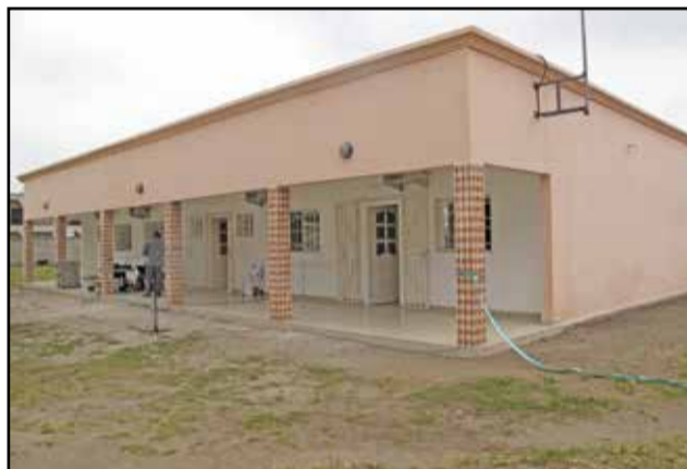
La façade principale du bâtiment récemment inauguré.