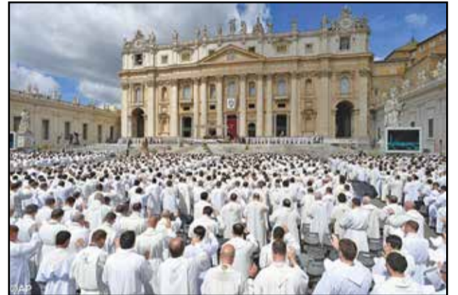
La messe de clôture du Jubilé des prêtres sur la Place Saint-Pierre, vendredi dernier.

Une importante conférence a rassemblé pendant deux jours au Vatican, jeudi et vendredi, des magistrats et des experts du monde entier sur le thème de la lutte contre la traite des êtres humains et des drogues. «Parvenir à l'éradication des nouvelles formes d'esclavage», a dit le Pape François, passe par des magistrats «libres» de toutes pressions; des gouvernements aussi bien que des «structures du péché» comme la criminalité organisée. Et le mouvement, a-t-il insisté, doit toucher la société «de haut en bas», des «périphéries au centre et vice et versa». Sans ces juges, il n'y a «ni ordre, ni développement durable et intégral, ni même de paix sociale».