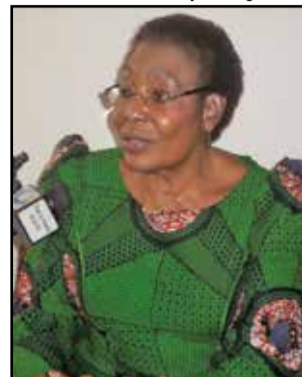
Antoinette Dinga Dzondo.