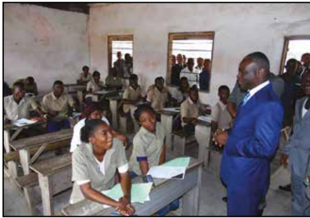
Le ministre donnant des consignes aux élèves le dernier jour de l'examen.

Pour clôturer les épreuves du B.e.p.c (Brevet d'études du premier cycle), qui se sont déroulés du 21 au 24 juin 2016, le ministre de l'enseignement primaire, secondaire et de l'alphabétisation, Anatole Collinet Makosso, s'était rendu dans quelques départements, pour s'assurer que l'examen d'Etat bouclant le premier cycle secondaire s'est bien passé. Au terme de ce périple, il ressort que d'une manière générale, la session qui a enregistré, au total, 111.006 candidats, s'est bien déroulée et les sujets ont été abordables, selon les candidats. A Ewo, chef-lieu du département de la Cuvette-Ouest où il y avait 1.312 candidats, le ministre Collinet Makosso a lancé l'épreuve d'expression écrite (rédaction), au centre du collège Ambendza d'Ewo, le dernier jour de l'examen.