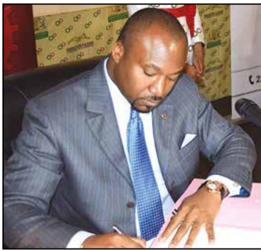
Denis Christel Sassou-Nguesso. (P.8)

Accords de partenariat avec trois départements ministériels, pour la formation des jeunes