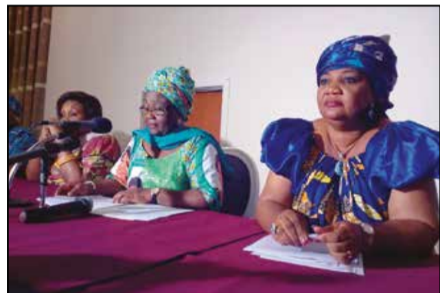
Mme Diop (au milieu).

Les membres du Collectif des femmes des départements du Kouilou et de Pointe-Noire se sont réunies, le mercredi 29 juin 2016, à l'Hôtel Le Gilbert'S, à Pointe-Noire, pour exprimer leur indignation devant l'interpellation de la Première Dame congolaise, Mme Antoinette Sassou-Nguesso, par la justice américaine, via le cabinet d'avocats «White and case». Ils ont opposé un «non» catégorique à cette démarche qu'ils qualifient d'«éhontée et provocatrice» et s'y opposent «vigouusement».