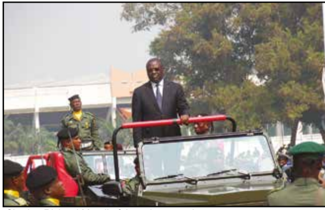
Charles-Richard Mondjo faisant la revue des troupes.

Comme indiqué, plusieurs manifestations ont été organisées, pour marquer les 55 ans de l'Armée: journée du souvenir avec le dépôt de gerbes de fleurs à la stèle aux morts de la Force publique par les ministres Mondjo, Mboulou et Mottom Mamoni; journées portes ouvertes à l'Ecole de la gendarmerie nationale, de génie travaux, à la Base aérienne 01/20, au 32 e groupement naval, à l'Hôpital central des armées Pierre Mobengo; rencontres avec les veuves et autres agents de la Force publique; déploiement de l'Hôpital gynéco-chirurgical de campagne à l'E.m.p.g.l (Ecole militaire préparatoire général Le Clerc); culte