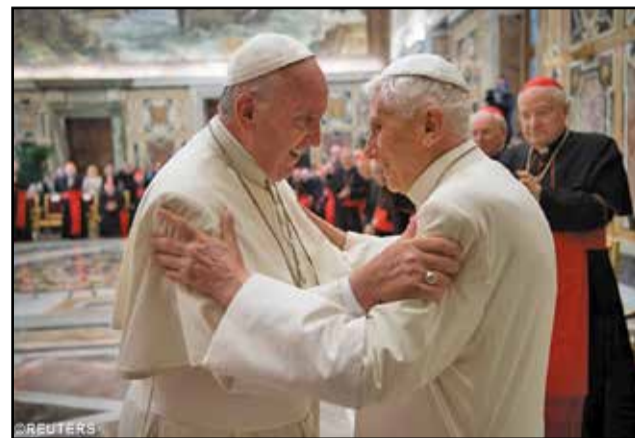
Les deux Papes, François et Benoît XVI, se donnent l'accolade à la fin de la cérémonie du mardi 28 juin au Vatican (sous le regard du cardinal Sodano, doyen du Collège des cardinaux, en arrière-fond).

L'audience générale habituelle du Pape n'a pas eu lieu, mercredi mais, jeudi 30 juin. Car mercredi, l'Eglise universelle a fêté Saints Pierre et Paul, patrons de l'Eglise de Rome, et donc jour férié dans la capitale italienne et son pourtour du Latium (Lazio).