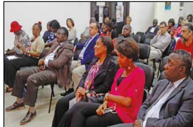
Une vue des spectateurs.

C'est la chorale Karisma Afro-Gospel, composée de 21 filles et six garçons, qui a ouvert le bal, à environ 18h00. Agnus Dei; Mélodie; Weti mbila; Ecclésiaste; Si ya Kudumisa; Mungu ni mungu; Nzambi tata unsakumuna; et Buana yesu, tels sont les chants qui ont été merveilleusement exécutés par les membres de cet ensemble musical. Sous les acclamations nourries du public. Succédant à Karisma Afro-Gospel, le Chœur Credo, composé de vingt personnes (dont douze filles et sept garçons), a, aussi fait parade de son talent, en exécutant, tour à tour: Ave Maria, de Schubert; Tu virginum corona; The trumpet; Cool chike; Canon de Pachelbel; Vin ou bière. Des titres prévus dans le programme. Et puis, en bonus, les spectateurs ont eu droit à deux chants, dont «Conquest of paradise», de Vangelis, exécutés par les membres des deux groupes à l'honneur, réunis. Le spectacle a pris fin à environ 19h33 minutes. Avec une standing ovation du public.