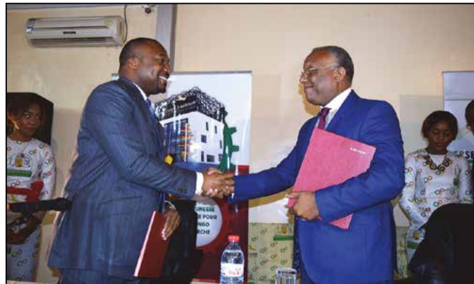
...Et Thomas Nicéphore Antoine Thomas Fila Saint-Eudes.

L'accord de partenariat avec le Ministère l'enseignement technique et professionnel, de la formation qualifiante et de l'emploi porte sur les échanges scientifiques et techniques, la recherche conjointe des financements, le partage d'informations et d'expériences, la coopération et la collaboration à la réalisation des activités spécifiques, etc. Il couvre la plupart des domaines