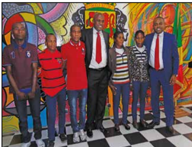
Le ministre de la culture et des arts avec les membres du groupe Ndima.

Avec l'ambassadeur de la République populaire de Chine, Xia Huang, il s'est agi du renforcement de la coopération bilatérale entre les deux pays, dans le domaine culturel, mais