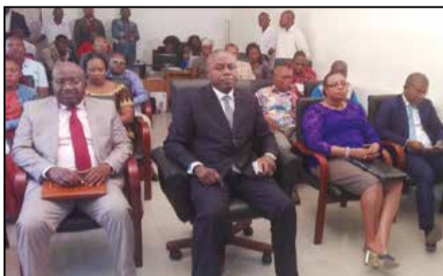
Léon Juste Ibombo (2e, à partir de la g.) entouré de ses collaborateurs, pendant la cérémonie.

Le Ministère des postes et télécommunications a, désormais, un site Internet. Son lancement officiel a eu lieu, le mercredi 29 juin 2016, au siège dudit Ministère, à Brazzaville, au cours d'une cérémonie présidée par Léon Juste Ibombo, ministre des postes et des télécommunications. Ayant l'adresse suivante: www.postetelecom.gouv.cg , ce site a été conçu et développé par Horizon web, une startup de jeunes informaticiens congolais.