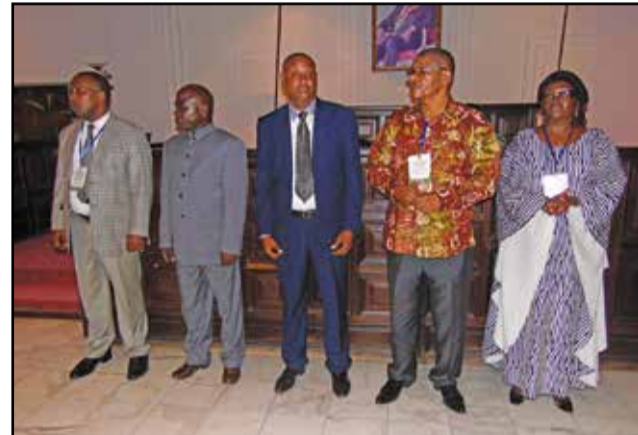
Le nouveau bureau exécutif national

des mutualistes. Une motion de remerciement a été également adoptée à l'endroit du