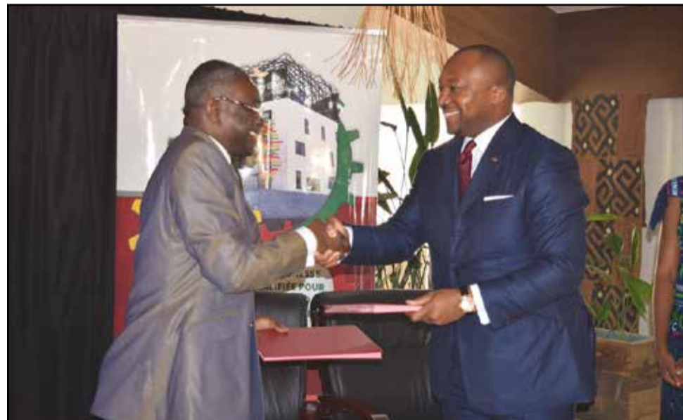
L'échange de parapheurs entre Denis Christel Sassou-Nguesso et Anatole Collinet Makosso.