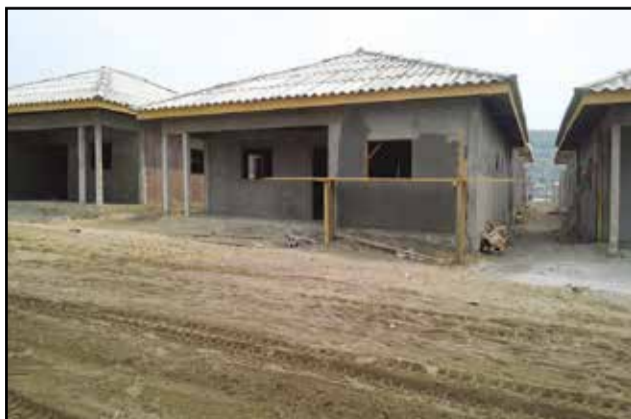
Des maisons en construction.

aux jeunes les plus démunis du quartier». Aussi, évoque-t-elle le phénomène d'urbanisation du quartier qui, souvent, est à l'origine des érosions et des inondations. Signalons que 70% des jeunes