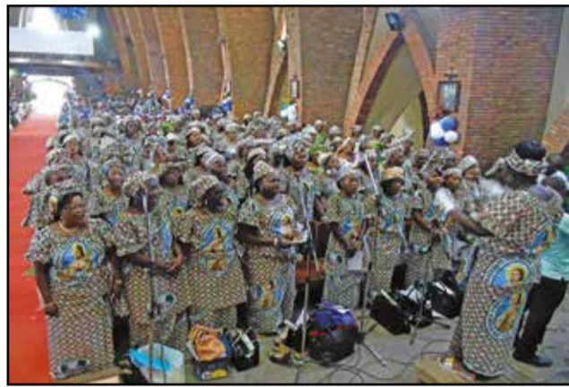
La fraternité jubilaire animant la messe.

En 40 ans d'existence, la fraternité Sainte Maria Goretti de