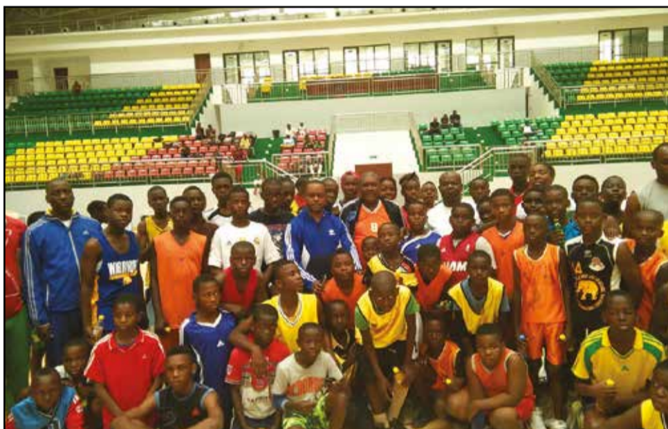
Grace au soutien d'un partenaire et la participation massive des enfants, la Ligue de Brazzaville a remporté le pari de l'organisation.

levier conquérant du basket national», a demandé aux enfants d'«être toujours à l'écoute de leurs encadreurs». Il les a, également, encouragés et exhortés à venir nombreux, le dimanche 24 juillet, pour participer à la troisième journée d'initiation et assister à la finale de la Coupe de la Ville. Cette initiative est à saluer, car elle peut permettre aux instances dirigeantes du basket-ball congolais, à l'image de ce qui se fait ailleurs, servir de journées de détections, repérer les potentiels et les talents prometteurs, pour assurer un