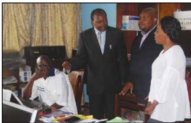
L'ambassadeur d'Afrique du Sud dans la salle de rédaction.

articles relatifs à la visite, en 1991, du président Nelson Mandela à Brazzaville où il avait été accueilli par le président Denis Sassou-Nguesso lui ont été remises. Au terme de sa visite, le diplomate sud-africain a dégagé ses impressions, en ces termes: «La Semaine Africaine est une bibliothèque vivante, au regard de la manière dont elle conserve les informations. Pour moi, c'est une librairie vivante.