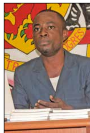
Prince Arnie Matoko.

Diplômé de l'E.n.a.m (Ecole nationale d'administration et de magistrature), il exerce, actuellement, en qualité de magistrat.