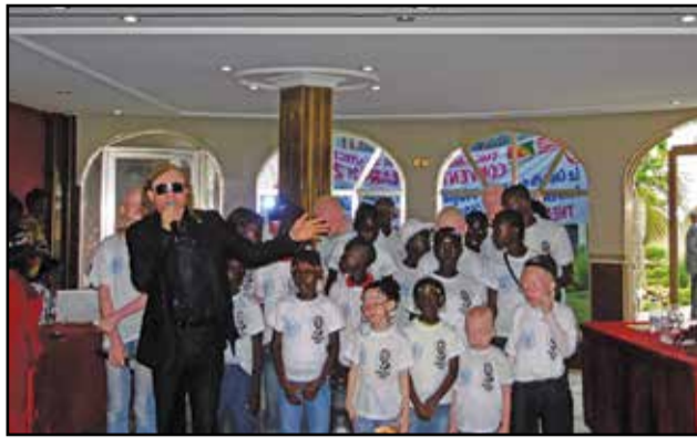
Les albinos donnant une prestation dans un centre d'apprentissage de langue anglaise