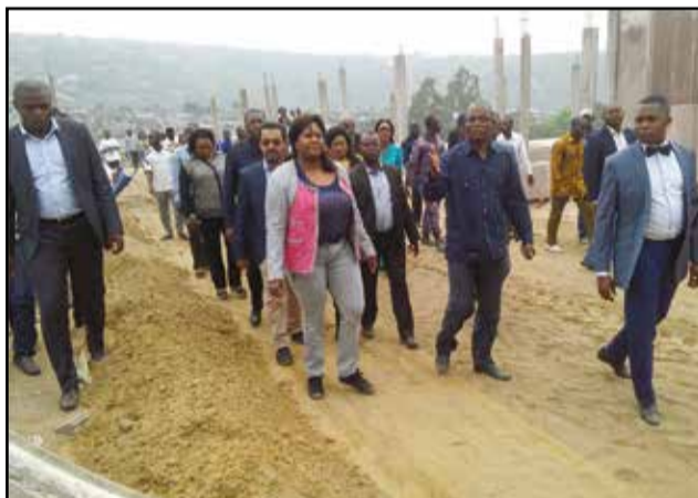
Claudia Ikia Sassou-Nguesso visitant le chantier.

mètres-carrés. Ce sont des dalles préfabriquées, en lieu et place des agglos qui servent à la construction des cent logements sociaux et autres structures. Tous ces logements présentent la même configuration et comportent, chacun, trois chambres à coucher, un salon, une cuisine, une salle de bain et une véranda. Pour l'élue de la 5 e circonscription, ce projet lui a été soumis par le propriétaire terrien du quartier Manianga, peu avant sa mort, de songer aux jeunes de la contrée, à travers des activités entrepreneuriales. «C'est un projet qui vise le renforcement des capacités et la réinsertion des jeunes du quartier dans l'entrepreneuriat artisanal, pour leur auto-prise en charge. Il s'agit donc de formaliser le secteur informel, diminuer le taux de chômage, par la création d'emplois, améliorer les conditions de vie des populations, promouvoir la réduction de la pauvreté et la redistribution du pouvoir d'achat. L'accès à ces logements sociaux sera prioritairement réservé