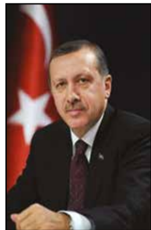
Recep Tayyip Erdogan.

général de l'armée turque que les putschistes ont annoncé leur intention de «vouloir restaurer la liberté et la démocratie», tout en affirmant qu'ils détenaient en otage le chef d'Etat-major général. Le même communiqué a été repris, dans la nuit, par la chaîne de télévision nationale, tombée sous le contrôle des putschistes. Très vite, des chars et des militaires armés avaient déjà occupé certaines places publiques, à Ankara, la capitale politique, et à Istanbul. Le président Erdogan, qui était en déplacement, a été sauvé