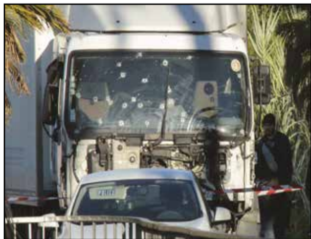
Le camion à l'origine du carnage. (P3)

Attentat terroriste à Nice, sur la promenade des Anglais