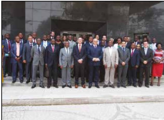
La photo de famille après la réunion.

tisfaits, parce que quelques performances nous ont surpris: le brut de référence dans le monde, s'est bien comporté, malgré les causes qui tiraient ses prix vers le bas, notamment le Brexit, la sortie de la Grande-Bretagne de l'Union européenne. A cela s'ajoutent des problèmes qui ont eu lieu au Nigeria et ailleurs. Les tendances haussières l'ont emporté et les bruts moyens, aussi bien le Djéno que le NKossa, sont fixés à une moyenne de prix de 43,3 dollars par baril, alors que dans notre budget, nous étions en dessous de 40 dollars», a-t-il dit. Pour les experts et les directeurs généraux des différentes sociétés, au deuxième trimestre, le prix du brut a continué à grimper. Il a ouvert le trimestre à 36,5 dollars par baril et l'a clôturé à