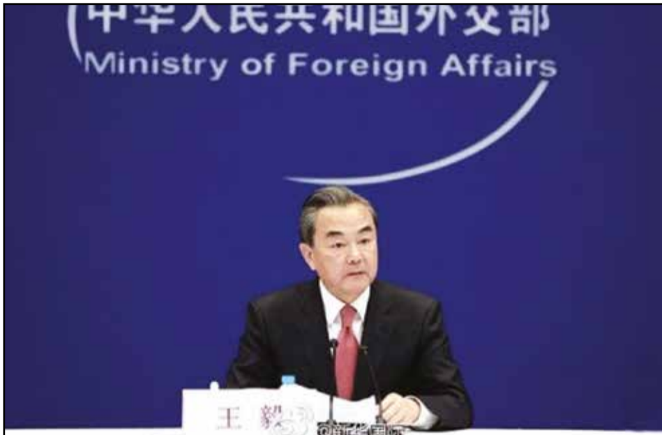
M. Wang Yi, Ministre chinois des Affaires étrangères.

Au sujet de la sentence rendue le 12 juillet 2016 par le Tribunal arbitral constitué à la demande unilatérale de la République des Philippines dans l'arbitrage concernant la Mer de Chine méridionale (ci-après dénommé «Tribunal arbitral»), le Ministère des Affaires Étrangères de la République Populaire de Chine déclare solennellement que la sentence est nulle et non avenue et n'a pas de force obligatoire et que la Chine ne l'accepte ni ne la reconnaît.