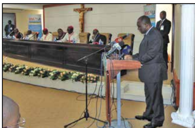
Une vue de la cérémonie d'ouverture, avec Manuel Vicente (debout à dr.), vice-président angolais.