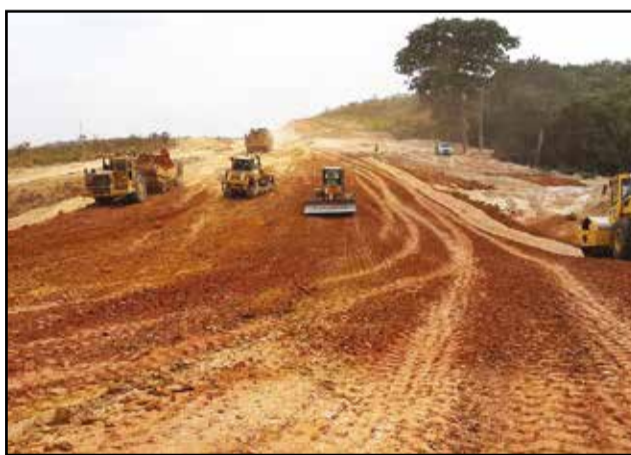
Un tronçon de la route.