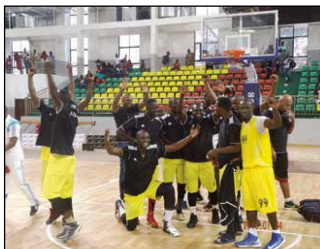
Les joueurs de l'A.S.G dans l'attente d'un premier titre.

plus tôt, l'A.S.G a dicté sa loi à l'Inter Club, par 90-67. Et se hisse en tête du classement. Il ne lui restait plus qu'à battre Patronage Sainte-Anne, jeudi 28 juillet, pour remporter son premier titre communal. Ce qui serait un coup de maître, pour sa première saison sportive. Les autres résultats glanés au cours de la quatrième journée sont les suivants: Avenir du rail-Etoile du Congo: 58-66 Patronage Sainte-Anne-Diables-Noirs: 63-60.