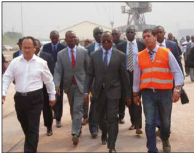
Gilbert Mokoki visitant le chantier du port de Brazzaville.

Gilbert Mokoki, ministre des transports, de l'aviation civile et de la marine marchande, a effectué, jeudi 21 juillet 2016, une visite de travail au Port autonome de Brazzaville, qui a commencé au site où s'effectue le dragage du sable au fleuve Congo, s'est poursuivie là où se réalisent les travaux de réhabilitation du port public, en vue de sa modernisation et qui s'est terminée au débarcadère assurant le trafic entre Kinshasa et Brazzaville. A ce niveau, la zone fluviale est, actuellement, confrontée à l'étiage, rendant ainsi difficile la navigation. La visite de ces trois chantiers a été close au siège de la direction générale du P.a.b.p.s (Port autonome de Brazzaville et ports secondaires) par une séance de travail avec le staff dirigeant, au cours de laquelle Gilbert Mokoki a donné des orientations, pour la bonne marche de cette structure économique.