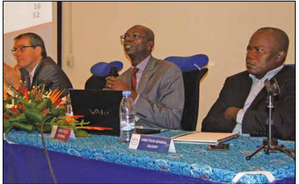
Vue des dirigeants MUCODEC.

Pour être plus près de leurs Sociétaires, les MUCODEC ont mis en place plusieurs produits et services, dont l'épargne qui permet d'accéder au crédit et de bénéficier d'une ristourne annuelle; Cette ristourne qui n'est autre que le bénéfice annuel réalisé et distribué à l'ensemble des sociétaires; les crédits variés (revolving, commerce, habitat, agriculture, artisanat, etc.); la carte monétique (près de 350.000 cartes monétiques distribuées gratuitement à tous les sociétaires) pour plus de 64 distributeurs automatiques de billets (DAB) fonctionnels tous les jours, 24 heures sur 24 heures. Toutes les opérations aux DAB sont gratuites aux MUCODEC; 16 terminaux de paiement (TPE) pour le service Biso Cash qui permet d'effectuer des paiements avec la