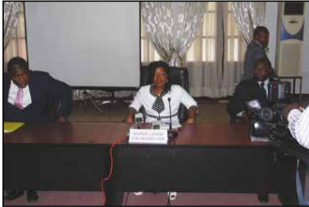
Mme Destinée Doukaga pendant le lancement du projet.

En partenariat avec le P.n.u.d (Programme des Nations Unies pour le développement), Destinée Hermelia Doukaga, ministre de la jeunesse et de l'éducation civique, a procédé, mardi 26 juillet 2016, au lancement du projet de prévention de la radicalisation de la jeunesse du Congo. Financé par le gouvernement japonais à hauteur d'un million de dollars américains, ce projet est une réponse à la problématique de la radicalisation de la jeunesse, à travers des mécanismes adaptés d'éducation civique, de sensibilisation des jeunes aux valeurs républicaines, de démocratie et de citoyenneté, d'insertion socio-économique par les activités génératrices de revenus et les métiers.