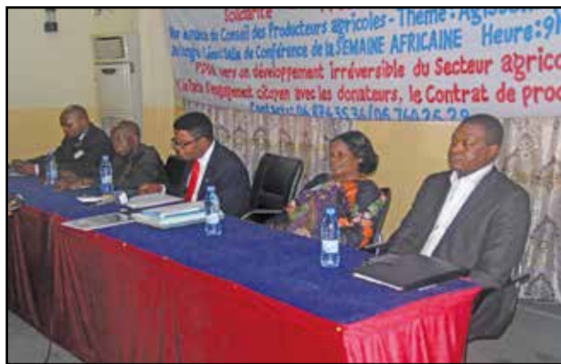
Le présidium lors de la mise en place du conseil.