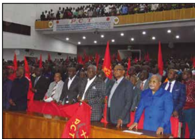
Des cadres et militants du P.c.t.

se tenir, selon nos prévisions. Ce qui est sûr, c'est qu'il va se tenir. Nous nous battons pour