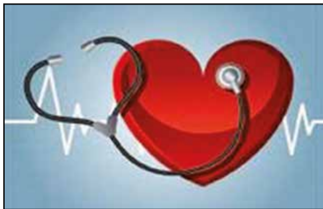
Prenez le temps de vérifier votre rythme cardiaque.