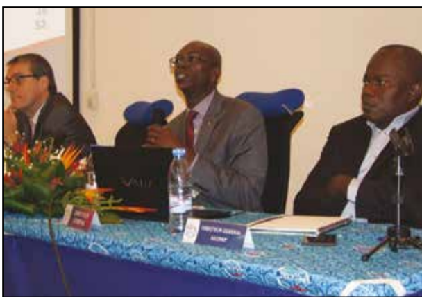
Les dirigeants des Mucodec pendant la rencontre. (P.13)

La Direction générale à l'écoute des Sociétaires entrepreneurs, pour mieux les accompagner dans leurs projets de développement