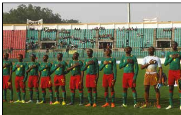
Des Camerounais rassurants.

sur les vrais minimes, les vrais cadets et les vrais juniors. Cela étant, l'organisation est plus ou moins parfaite, et l'ambiance, bonne et empreinte de beaucoup de fair-play. De quoi surprendre les hôtes du Congo qui découvrent, non sans étonnement, un public exigeant, bien que n'étant pas massif, qui en vient, parfois, à manifester son hostilité à sa propre équipe au cours d'un match lorsque celle-ci ne montre pas assez d'entrain à conduire le ballon... Chacun des cinq pays est arrivé avec ses atouts: la fougue ou l'enthousiasme, la technique d'orfèvre ou la sécurité, etc. Certains entraîneurs choi-