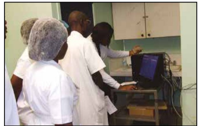
Pendant l'essai technique du capteur plan au C.h.u.