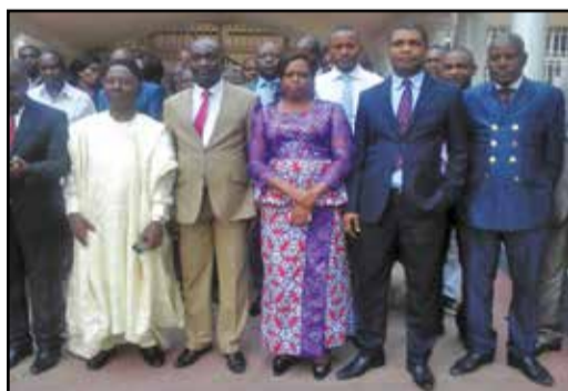
Les participants à l'assemblée générale.

Cette entité culturelle qui rassemble des bibliothécaires, des archivistes, des documentalistes et des muséologues du Congo, sert de cadre d'échanges et de partage d'expériences entre les acteurs de ce secteur. La structure résulte de l'assemblée générale constitutive tenue, le 22 juillet 2016, à Brazzaville.