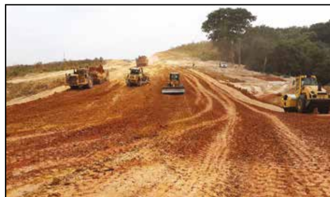
Les travaux de la route Kinkala-Mindouli réalisés par le groupement Dragages - Razel. (P.3)

Probable arrêt des travaux, si le gouvernement ne met pas la main à la poche