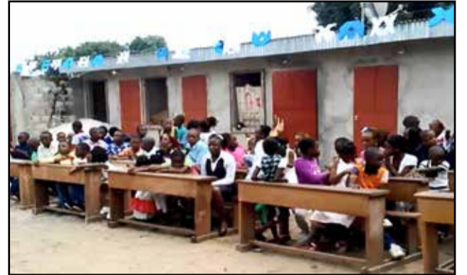
Une vue des élèves avant la remise des prix.