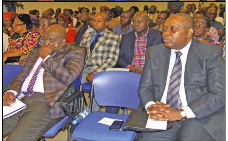
Vue des sociétaires.

carte BISO dans les pharmacies et commerces partenaires des MUCODEC; des virements à l'étranger; des retraits et versements déplacés; la domiciliation des salaires.