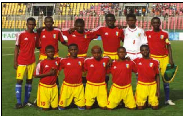
Un tournoi test pour les jeunes Tchadiens.

genre de tournoi, la course effrénée vers la victoire ne mène nulle part. A la longue, c'est un risque de dénaturer l'esprit du tournoi. Or, l'objectif reste, évidemment, le développement du football en Afrique centrale. Car, il apparaît d'évidence que, l'avenir du football africain repose sur une solide politique des vrais jeunes. Il faut investir