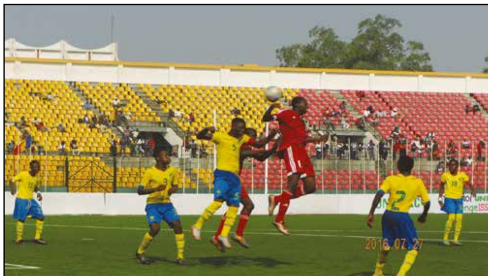
Duo dos à dos, lors du match Congo-Gabon.

Ce tournoi marque la relance des compétitions de l'Uniffac et le réveil de cette instance régionale, après plusieurs années de coma. Mais, tous les pays ne sont pas là. Malheureusement! Et pourtant ils avaient juré relever le défi en participant, massivement, à Brazzaville, à la première édition de la nouvelle compétition. Ainsi, cette édition a été réduite à une quintuple participation: jeunes footballeurs de la Guinée Equatoriale, de la R.C.A et de Sao Tomé et Principe s'étant défilés, les uns après les autres. Seuls