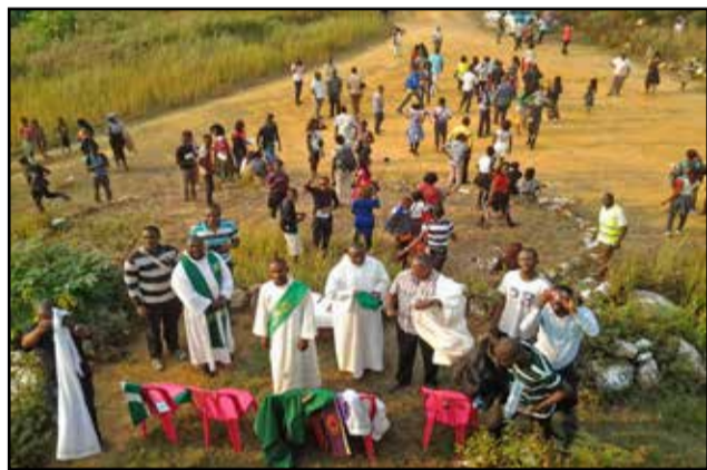
Moment intense de prière et de louange.

l'adoration de Jésus eucharistique; la compassion; l'évangéli-