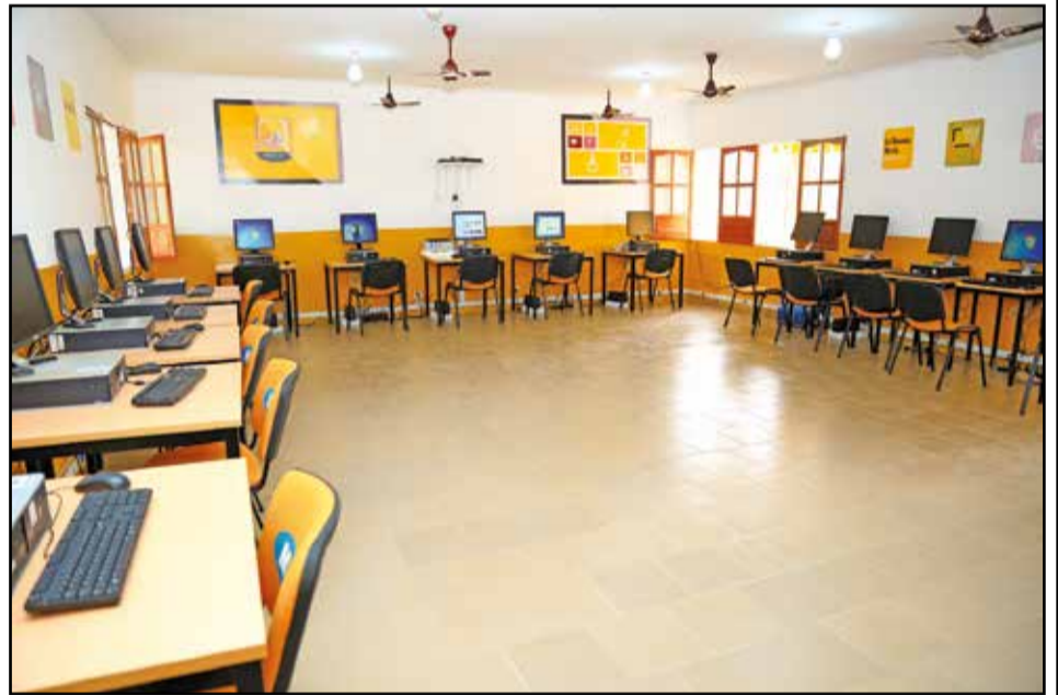
Une vue intérieure de la bibliothèque, à gauche, et de la salle School Connectivity, à droite.

dance de la République du Congo, cela à travers la mise en œuvre de ses programmes communautaires axés, principalement, sur l'éducation, dénommés : Y'ello School Connectivité et Y'ello 100 Bibliothèques pour tous.