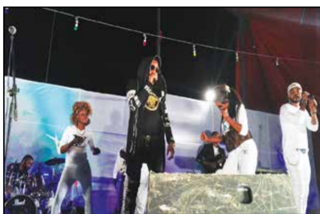
L'orchestre Patrouille des stars authentique a subjugué le public.

autres, d'un toboggan et de jeux vidéo. La Foire Holidays, c'est aussi plus d'une centaine de stands, véritables vitrines permettant aux commerçants et autres entreprises de vendre leurs produits et services. C'est, éga-