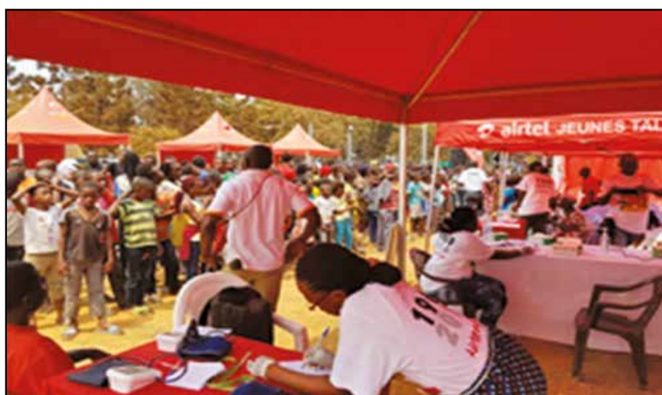
... a connu une grande affluence.

riale, du Bénin, de la Centrafrique; le gouvernement et toutes les autorités locales, Airtel Congo avait mis, gratuitement, à disposition des populations, un centre multimédia équipé de 9 ordinateurs et 2 formateurs, un centre de santé, dans le cadre de son programme de responsabilité sociale: Airtel santé, ainsi que d'un village commercial.