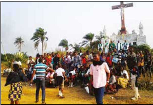
Les prêtres et le diacre posant avec les jeunes. (P.9)

Une délégation a participé au forum international de la jeunesse à Kinshasa