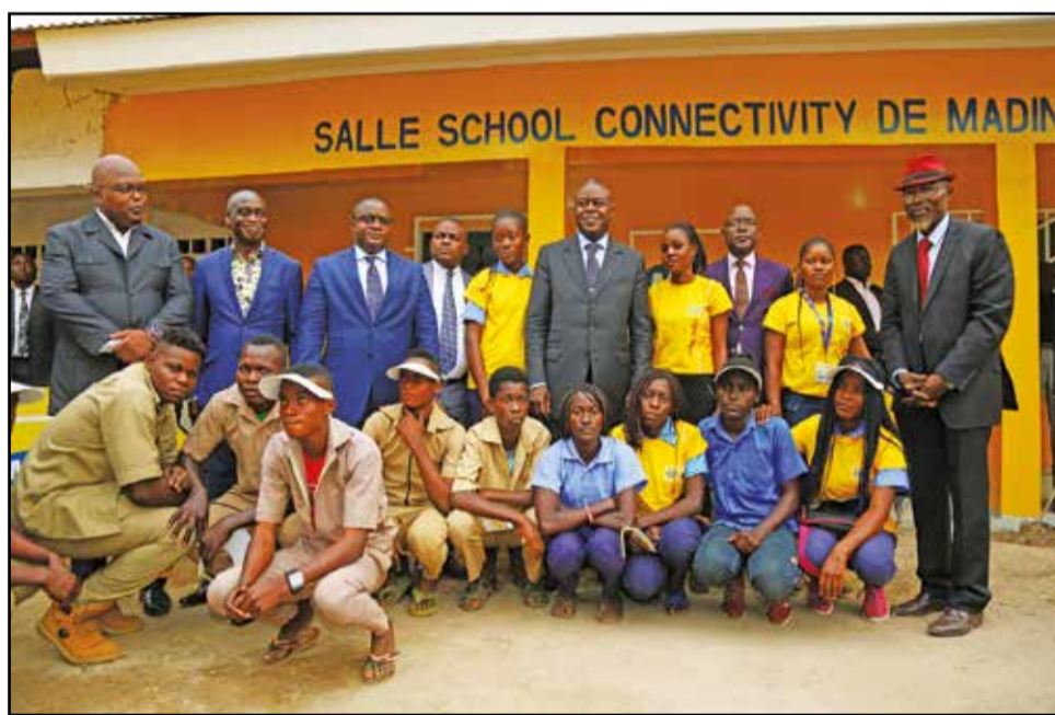
Photo de famille avec les élèves.