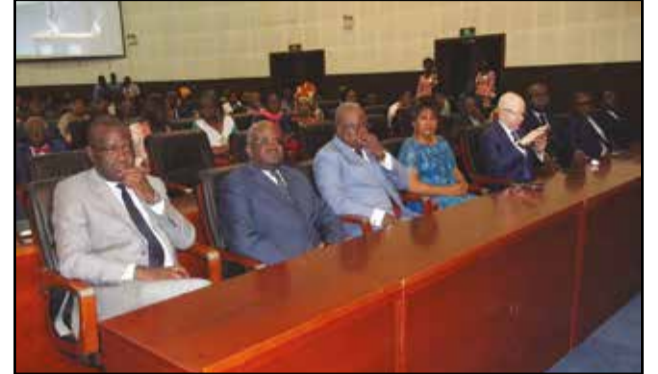
Les membres du gouvernement présents à la célébration.

Afrique a célébré, le 31 juillet, la journée de la femme africaine. Au Congo, l'évènement a été marqué par la tenue d'un forum national sur le leadership féminin, les 30 et 31 juillet, à l'auditorium du Ministère des affaires étrangères et de la coopération. Présidé par le premier ministre Clément Mouamba, ce forum a eu pour objectif d'identifier les facteurs limitant l'accès des femmes, dans les sphères de prise de décisions en politique, et les participantes ont formulé, à cet effet, plusieurs recommandations, parmi lesquelles, la création d'un observatoire congolais, pour l'égalité professionnelle.