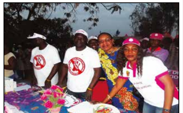
L'équipe de campagne du ministère en pleine action.

Dans le cadre des festivités de l'indépendance du Congo, le 15 août 2016, le Ministère de la promotion de la femme et de l'intégration de la femme au développement a organisé, du 5 au 16 août 2016, à travers l'Unité de lutte contre le Sida, une campagne de sensibilisation sur les questions liées à la sexualité précoce, au V.i.h-Sida dans le département de la Bouenza, notamment à Madingou, Nkayi et Loutété.