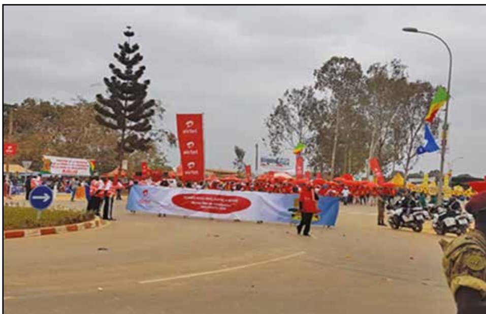
Airtel Congo a pris une part active au défilé civil.

Le centre multimédia, innovation pour cette 56 e célébration de la fête nationale, a connu la fréquentation d'environ 200 jeunes qui ont navigué, gratuitement, sur Internet ou ont été formés à la recherche d'information sur In-