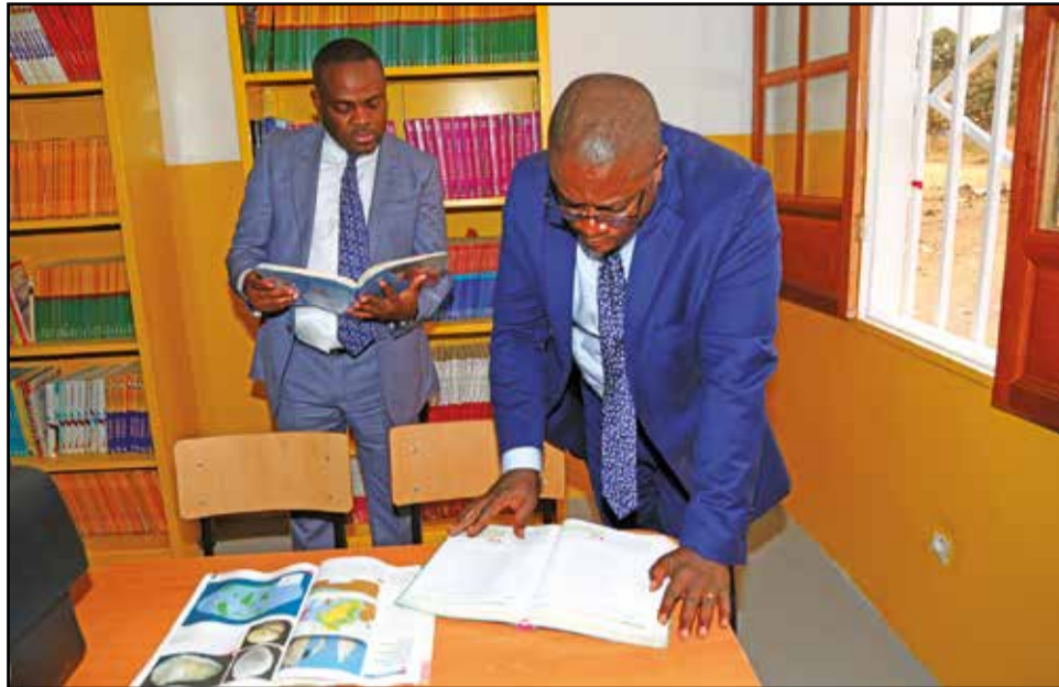
Deux lecteurs dans la bibliothèque.