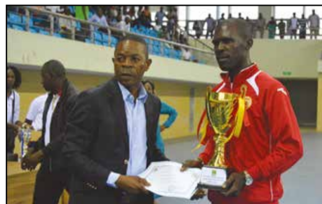
Inter Club hommes récompensé pour son titre.

Abo-Sport, intouchable, n'a laissé aucun point sur le chemin du titre communal, ses adversaires étant relativement trop faibles: quatorze victoires en autant de matchs joués. Une performance que ne réussit pas n'importe qui. Chapeau bas! Seul, en définitive, Inter Club a rencontré de la résistance, en abandonnant trois points à ses adversaires. Des matchs étaient au programme de la dernière journée.