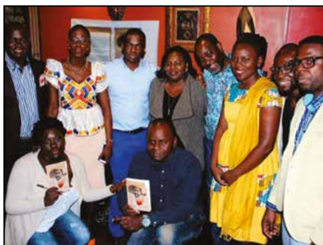
Dix des coauteurs, lors de la présentation de l'ouvrage le 5 mars 2016 à Paris (France).

qui traversent le recueil témoignent de la richesse de l'œuvre de Franklin Boukaka. Clément Ossinondé et Pierre Eboundit le rappellent à bon escient, dans leur contribution respective au recueil: l'homme était un artiste engagé et un militant politique très impliqué dans les luttes politiques de son temps. Ce double statut présentait à la fois un avantage et un inconvénient. Un avantage parce que, son statut de militant lui permit de parcourir le monde, pour y livrer ses prestations de chanteur: Moscou, Berlin, Belgrade, Pékin, Pyongyang, Madrid, etc. Il est bien évident qu'il n'eût jamais visité ces villes s'il n'avait pas été militant. Un inconvénient parce que, en tant que militant politique et auteur de chansons dont certaines portaient une charge politique éminemment critique, il dérangeait nécessairement certains