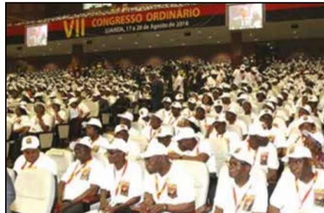
Des participants au congrès du M.p.l.a.

Le VII e Congrès ordinaire du MPLA se tient à un moment où le peuple d'Angola, comme celui du Congo et d'autres pays, est confronté à des défis sérieux dictés aussi bien par un environnement économique-financier austère que par des