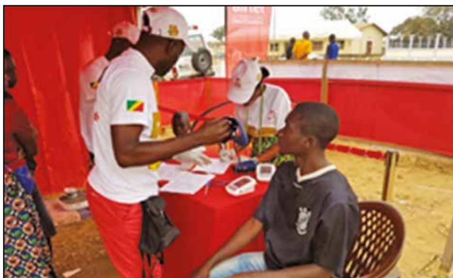
Le centre de santé...

riale, du Bénin, de la Centrafrique; le gouvernement et toutes les autorités locales, Airtel Congo avait mis, gratuitement, à disposition des populations, un centre multimédia équipé de 9 ordinateurs et 2 formateurs, un centre de santé, dans le cadre de son programme de responsabilité sociale: Airtel santé, ainsi que d'un village commercial.