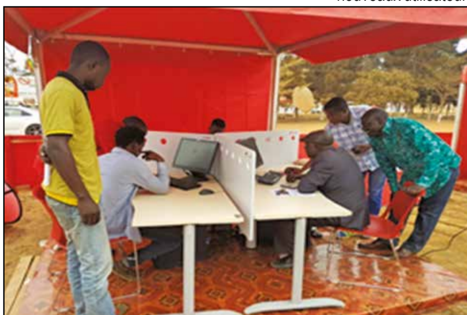
Une vue du centre multimédias.