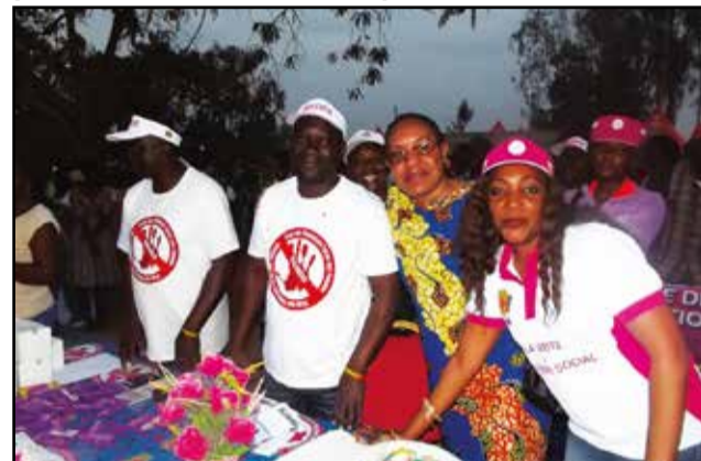
L'équipe de campagne du ministère en pleine action.

Objectif de la campagne de sensibilisation: contribuer, essentiellement, à réduire la vulnérabilité au V.i.h-Sida, au sein des populations, notamment auprès des filles et garçons. Plus spécifiquement, la campagne a eu pour objets de lutter contre la féminisation du V.i.h-Sida; renforcer les connaissances des jeunes en matière de sexualité; améliorer les connaissances et attitudes des jeunes sur le V.i.h-Sida; encourager les pratiques et comportements sexuels à moindre risque auprès des populations; promouvoir l'utilisation du préservatif féminin.