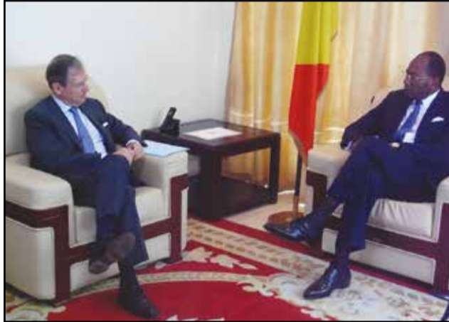
Bertrand Cochery et Pierre Mabiala.

A l'issue d'un entretien avec Pierre Mabiala, ministre de la justice, des droits humains et de la promotion des peuples autochtones, mardi 23 août 2016, l'ambassadeur de France, Bertrand Cochery, a annoncé la formation et le recyclage de 30 magistrats congolais par les experts et formateurs français, en novembre prochain. L'objectif est de les mettre au même diapason que les magistrats des grandes Nations et de les rendre compétents et compétitifs, en vue d'exercer leur métier avec professionnalisme.