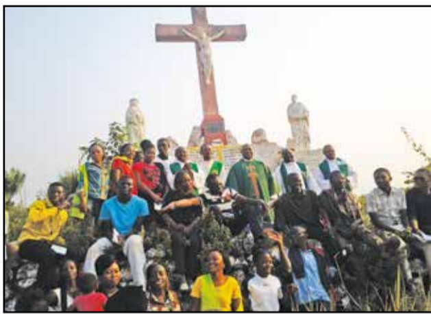
Les prêtres et le diacre posant avec les jeunes.