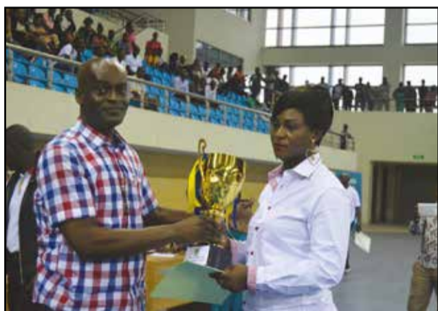
Le président de la ligue remettant le trophée de champion féminin au capitaine d'Abo-Sport.

Les rideaux sont tombés, jeudi 18 août 2016, dans le magnifique gymnase Nicole Oba de Talangaï, sur les championnats brazzavillois de handball, masculin et féminin, en consacrant dames d'Abo-Sport "Djérééré" et hommes d'Inter Club "Machette-On part, on part", chez les seniors. Ces championnats entrent dans l'histoire comme étant les premiers disputés dans une salle moderne, à Brazzaville. Cinquante et un ans, souvenons-nous-en, après l'intrusion du jeu à sept au Congo, à la faveur des 1 ers Jeux africains, en 1965.