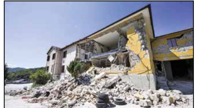
Les ruines laissées par le tremblement de terre du 24 août au centre de l'Italie.

«La non-violence: style d'une politique pour la paix»: tel est le titre de ce message. Au contraire de la guerre et du conflit, la paix a des conséquences sociales positives; elle permet de réaliser un progrès réel: nous devons donc faire tout le possible pour négocier des chemins de paix, même là où ces chemins semblent tortueux, voire impraticables. De cette façon, la non-violence aura une signification plus étendue, nouvelle: elle n'est pas simplement une aspiration, un désir, un rejet moral de la violence, des barrières et des impulsions destructrices; elle est une méthode politique réaliste, ouverte à l'espérance.