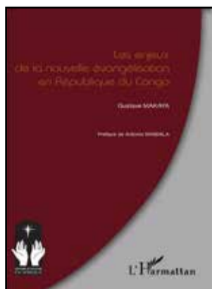
La couverture du livre.

Voilà quelques questions qui constituent des lieux théologiques pour l'Afrique, en général, et pour le Congo, en particulier, et auxquelles l'abbé