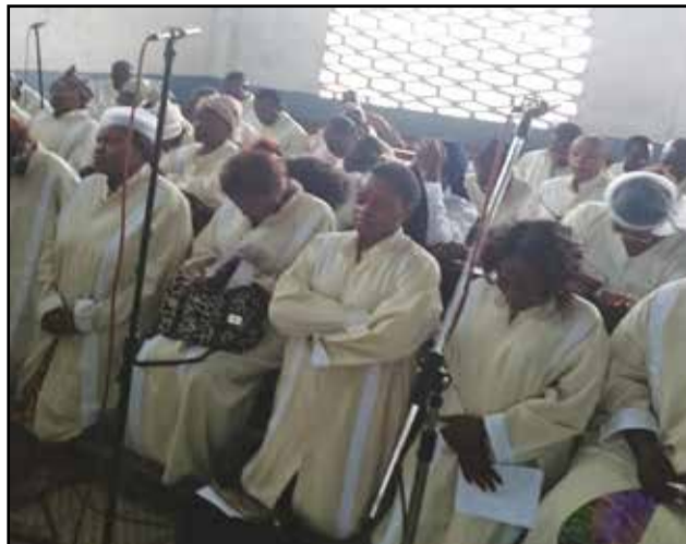
La chorale Père Paul Ondia animant la messe.