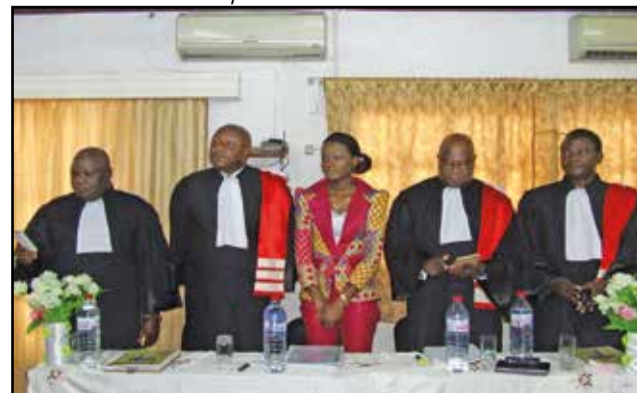
L'impétrante avec le jury et son Directeur de mémoire.

traduction», a-t-elle fait savoir. Pour elle, il ne suffit pas d'être bilingue pour être traducteur.