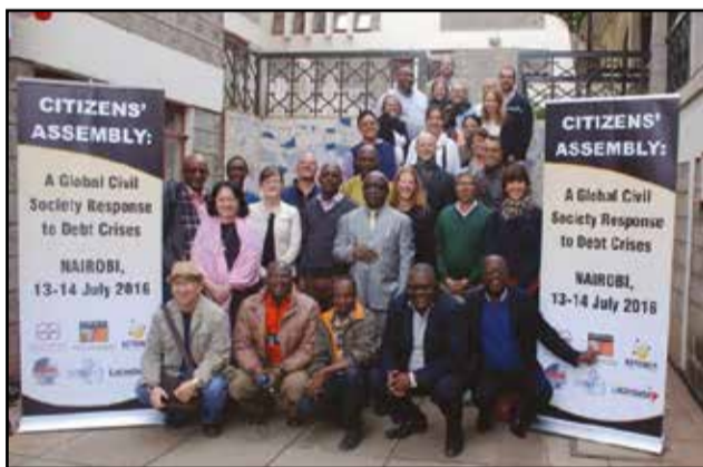
Les participants de la société civile à la rencontre internationale de Nairobi.