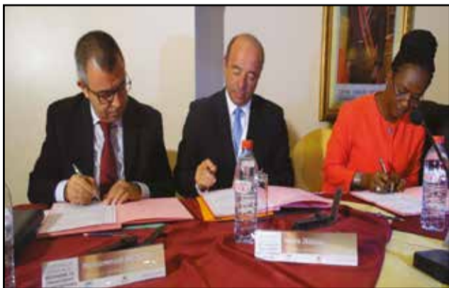
Pendant la signature de l'accord.

Le projet relatif à la signature de l'accord tripartite s'inscrit dans le cadre du renforcement des capacités des P.m.e congolaises, dans le financement de l'acquisition de matériel et d'équipements de travail. A la faveur de ce dispositif d'une valeur de dix milliards de francs Cfa, les P.m.e locales pourront, désormais, introduire des demandes de crédits à la banque Crédits du Congo, pour financer l'achat de leurs matériels et leurs équipements.