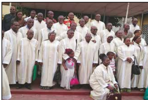
Les choristes posant pour la postérité.

Ondia compte aujourd'hui 83 choristes. Elle est appréciée des chrétiens pour la diversité de son répertoire de chants liturgiques, en polyphonie, en grégorien et en chants de toutes langues.