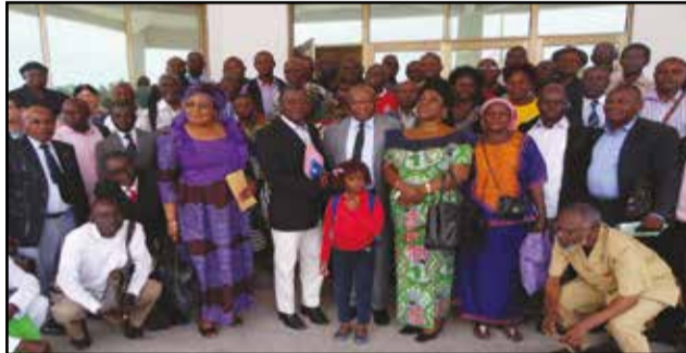
Photo de famille: les organisateurs et les participants.

majeurs constatés dans la mise en œuvre de la décentralisation et du processus de développement local est la faible capacité des élus locaux en matière de gestion administrative et financière des collectivités locales, d'élaboration et de mise en œuvre de plan de développement local. La pratique se résumait à la constitution d'un catalogue de projets ne répondant pas toujours aux attentes, aux besoins et aux priorités des populations locales. C'est dans le but de combler cette insuffisance que la Fondation Niosi et l'O.n.g