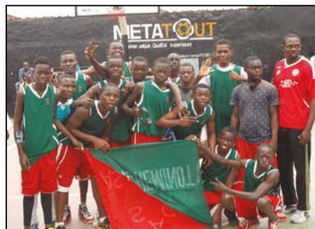
Les cadets d'Avenir du rail.

tombeurs respectifs de l'A.S.G (58-50/12-15, 14-12, 13-9 et 19-14) et Diables-Noirs (46-44/20-6, 10-9, 8-16 et 8-13), en demi-finales. Elle présageait un duel haut en couleurs. L'espace était, à n'en point douter, à ceux qui avaient des reins, des bras et des nerfs solides. Mais, elle s'est avérée pauvre, techniquement et collectivement, estiment les anciens internationaux Maxime Mbochi (ex-Avenir du rail), Zéphyrin Kimbouri et Guy Tchicamboud (tous deux ex-Anges-Noirs). En plus des ratés de paniers apparemment faciles, dans un vacarme à retourner un mort.