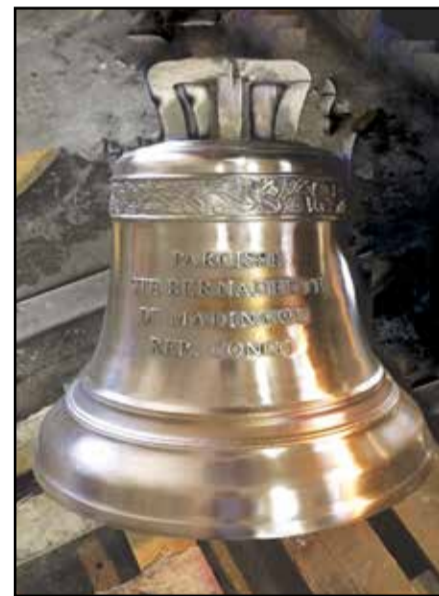
La nouvelle cloche de l'église.