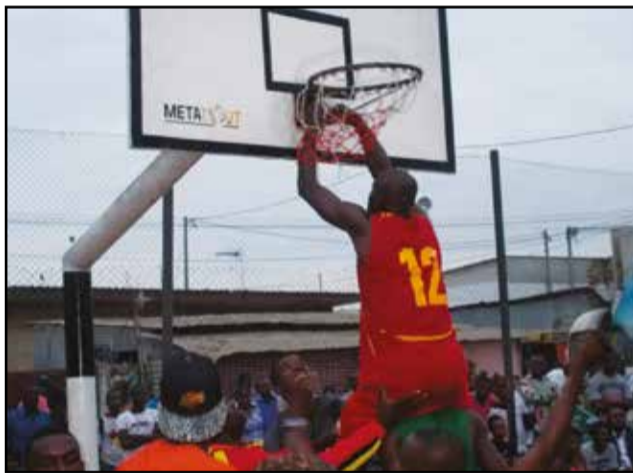
Une relique pour l'Inter Club: le filet d'un panneau qu'arrache par son capitaine.

face à l'ex-Inter Club (placé sous la coupe de la Ligue de Brazzaville), par une deuxième victoire: 50-32. Pour remporter la