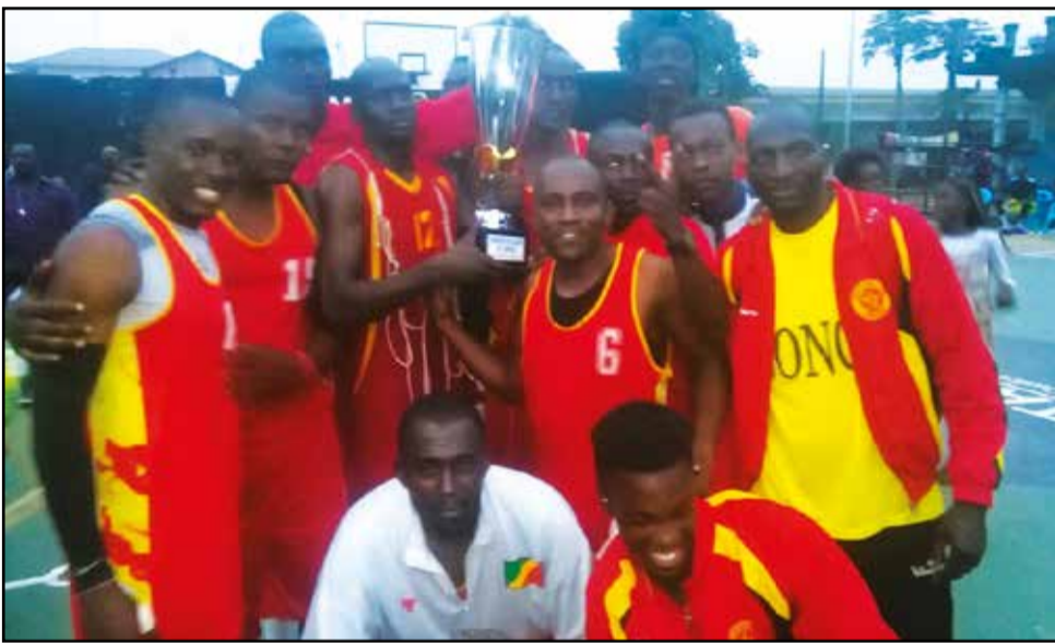
Les militaires d'Inter Club.

Pour en venir aux dames, Brazza Basket a conclu sa double finale