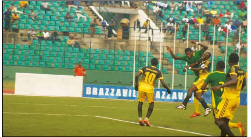
Diabes-Noirs-Etoile du Congo: un duel aérien musclé.

Des matchs remis et d'autres de la 31 e journée du championnat national de football ligue 1 ont été disputés, le week-end dernier et en milieu de la semaine en cours. L'Etoile du Congo en a profité pour remporter son premier succès aux dépens des Diabes-Noirs depuis sept ans. Elle a ainsi vaincu le signe indien, les "Noir et jaune" étant pendant cette période sa bête noire.