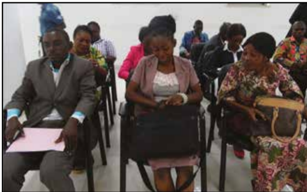
Une vue des journalistes

décision, le groupe Talassa a réagi au niveau de la Cour suprême. C'est donc un contentieux subjectif. A ce niveau, la Cour suprême a annulé la décision du procureur de la République, pour un seul et unique motif de manque de motivation. En même temps, la Cour suprême a donné la possibilité au conseil de se rétracter, en application des articles 138 de la loi n°51-83 du 21 avril portant code de procédure civile, commerciale, administrative et financière dans les suivants: Lorsqu'une erreur matérielle a exercé une influence