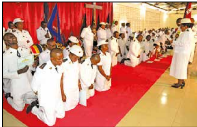
Une vue de la consécration des cadets.