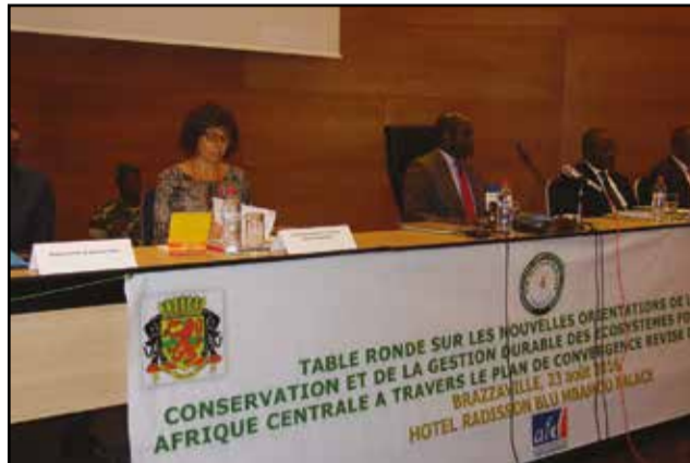
Une vue du podium.