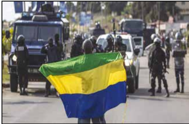
Une scène de manifestation.

de ces violences, on déplorait déjà trois morts et des dizaines de blessés. Comme on le redoutait, le Gabon est secoué par des affrontements entre force de l'ordre et manifestants anti-Bongo, après l'annonce, par le ministre de l'intérieur, de la réélection du président Ali Bongo-Ondimba, pour un second septennat. Les représentants de l'opposition au sein de la Cenap ne reconnaissent pas les résultats publiés et l'un d'eux, Paul-Marie Gondjout, a claqué la porte, en dénonçant « une élection volée ». L'opposition exige la proclamation des résultats « bureau