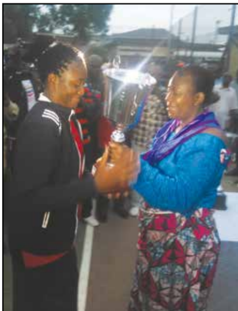
Qu'elle est belle notre coupe, semble dire la capitaine du Brazza Basket

68 (13-27, 32-15, 24-8 et 37-18). Mercredi 31 août: la finale et