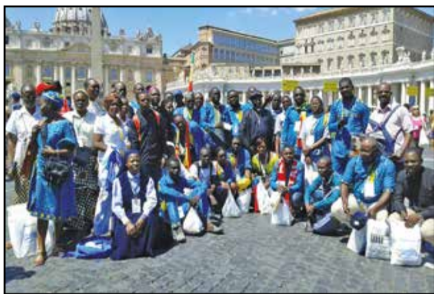
La délégation congolaise aux Jmj 2016.