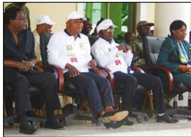
Les responsables de la D.n.r encadrés le préfet et l'administrateur-maire de Kinkala.