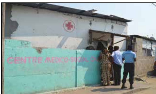
Le centre médico-social fermé à Poto-Poto.