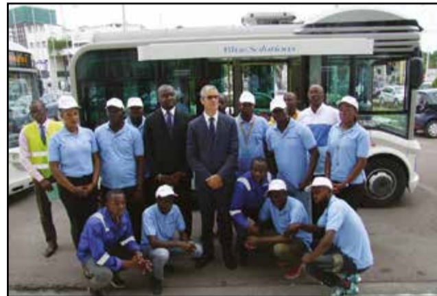
M. Bolloré, au milieu des travailleurs de Bluecongo.

A l'occasion de la tenue de la 6ème session du conseil départementale et municipal de Brazzaville, le député-maire Hugues Ngouelondélé a officiellement lancé, lundi 12 septembre 2016, la mise en circulation de bus électriques pour le transport en commun dans la commune. Appartenant à la société Bluecongo, créée par le groupe Bolloré en partenariat avec l'Etat du Qatar, les six bus mis en circulation, d'une capacité de 23 places chacun, ont pour objectif de faciliter la mobilité de riverains sur les axes dont la demande est supérieure à l'offre.