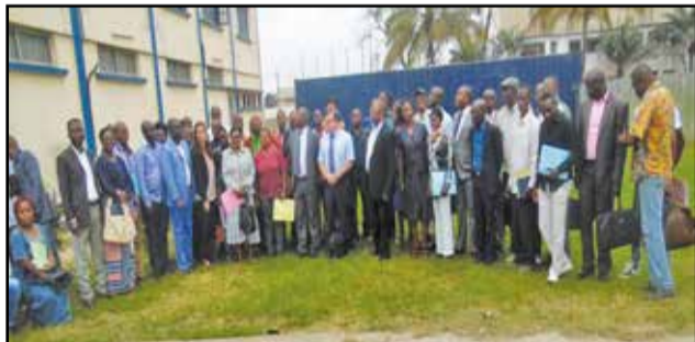
Les participants posant à la fin de la cérémonie.

la corruption. Quatre départements sont visés par l'action sur le territoire national: Pointe-Noire, Brazzaville, le Niari et la Cuvette. Ainsi, quatre axes majeurs du projet contribueront à l'atteinte de cet objectif.»