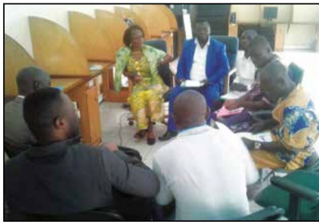
Pendant les travaux en atelier.

son côté, appelé à l'ouverture d'esprit des parties prenantes. Tandis que M. Julien Makaya, consultant genre et protection des femmes vivant avec le V.i.h, a, dans son intervention, présenté les différentes étapes qui découleront de cette étude, en l'occurrence le rapport d'analyse de la situation et l'évaluation du dispositif de protection des droits des femmes vivant avec le V.i.h au Congo, ainsi que le Plan d'action d'amélioration de la protection des droits des femmes vivant avec le V.i.h. Plus de trente ans après sa découverte, la pandémie du Sida continue de poser un problème de développement durable dans la région africaine, qui, selon l'O.m.s (Organisation mondiale de la santé), supporte 69 % de la charge de morbidité totale et enregistre plus de 70 % des décès liés au Sida dans le monde. Sur la planète, 33,3 millions de personnes vivent avec le V.i.h, dont environ 22,5 millions en Afrique subsaha-