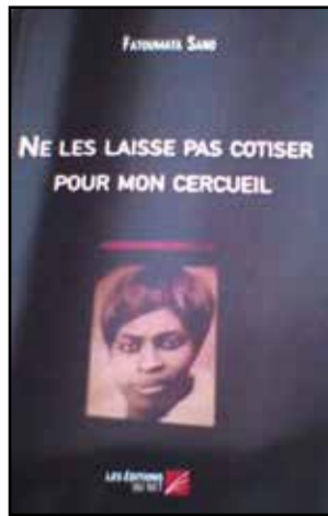
La couverture du récit

L'âme des morts, pour certains, ne disparaît donc jamais? Je ne le pense pas. D'ailleurs,