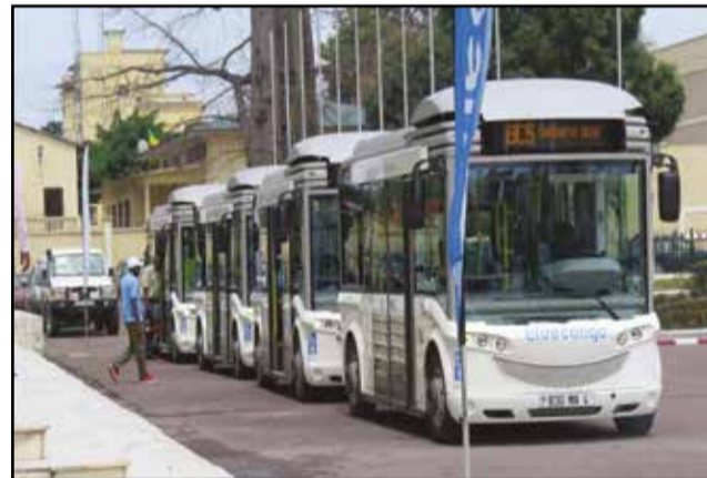
Les bus électriques.

C'est une première dans le transport en commun au Congo et sans doute en Afrique centrale. La commune de Brazzaville a mis en circulation des bus fonctionnant totalement à l'électricité, grâce à la batterie L.m.p (Lithium metal polymère), une technologie développée par le groupe Bolloré à travers sa filiale Blue solutions. Ce procédé unique au monde permet de stocker de l'énergie électrique et se distingue par sa puissance, sa forte densité énergétique et sa sécurité d'utilisation. Ces bus desservent 7 lignes dans la capitale, chaque semaine, de lundi à samedi, au prix homologué de 150 F Cfa la place: Gare-C.h.u; Gare-Hôpital militaire; Gare-Chacona; Gare-rond-point Ebina; Mairie central-Chacona; Gare-Marché Tâ-Ngoma et Rond-point Moungali-Aéroport Maya-Maya. Ce sont aussi des véhicules adaptés aux personnes à mobilité réduite (béquilles, etc). Ils offrent l'occasion d'intégrer des transports en commun urbain adapté à leurs conditions. La société Bluecongo vise le développement, dans notre pays, d'infrastructures de transports électriques respectueuses de l'environnement et de systèmes de production et de stockage d'électricité issue de l'énergie solaire. Les bus 100% électriques seront progressivement mis en circulation dans les deux plus grandes villes du pays, Brazzaville et Pointe-Noire.