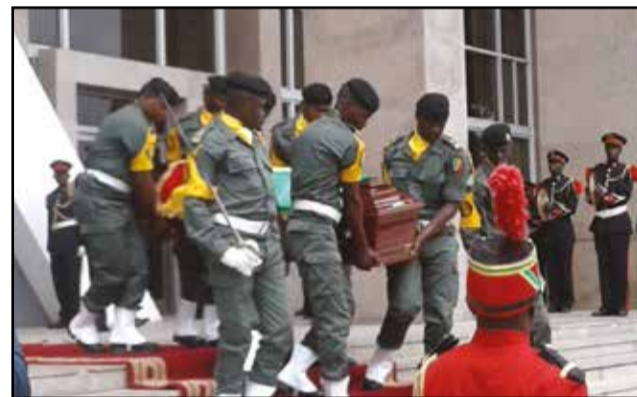
La dépouille mortelle de la défunte.