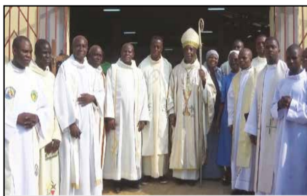
Photo de famille autour de l'évêque, devant la chapelle de Maléla Bombé. (P.9)

Mgr Louis Portella Mbuyu a béni la chapelle Notre Dame de Maléla-Bombé