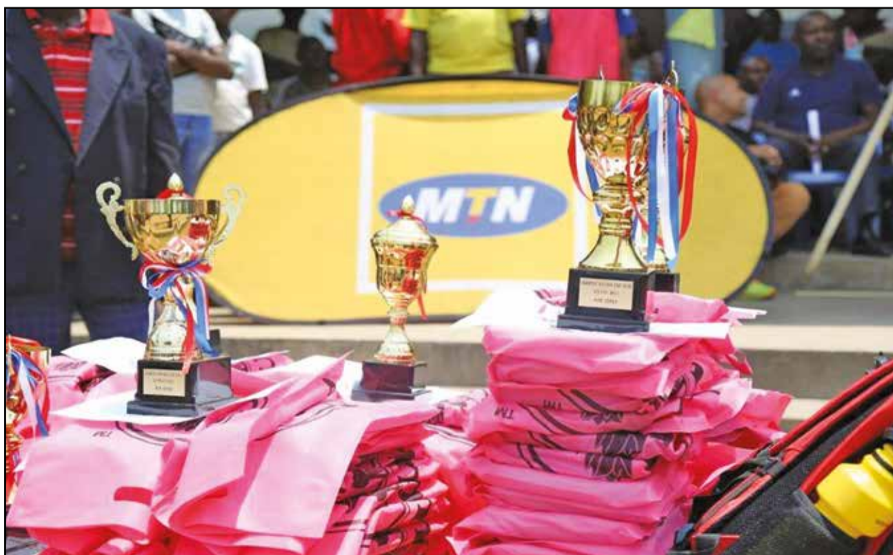
Une vue des trophées.

cline comme «être une voie qui mène au changement social», d'où sa devise: «Sport pour un Congo meilleur».