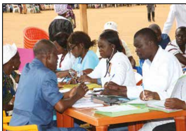
L'initiative a été salvatrice pour les populations.