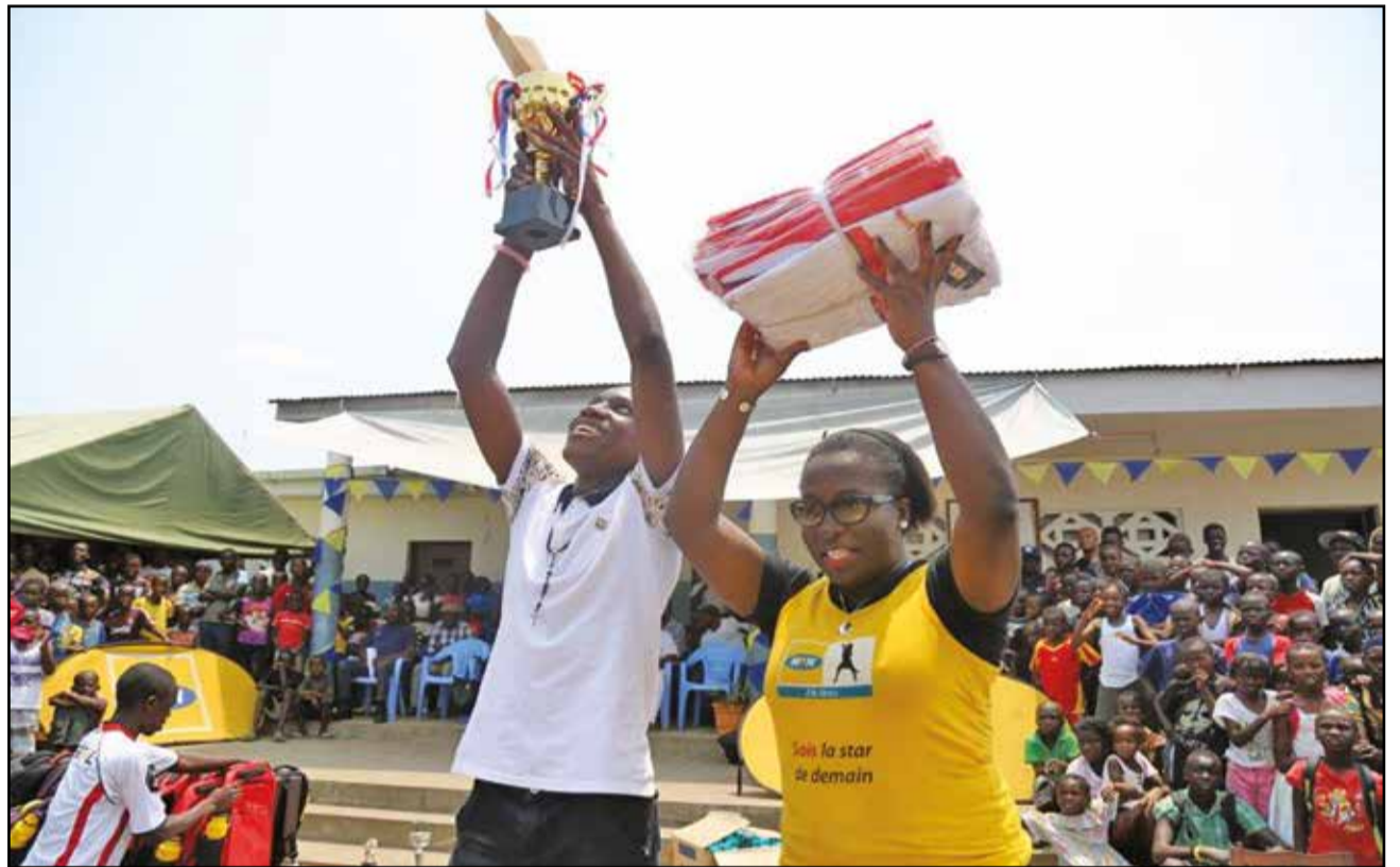
Après l'effort, le réconfort.

La remise de kits scolaires, composés de sacs scolaires (comprenant cahiers, crayons de couleur, stylos, packs de géométrie, gourdes MTN et des serviettes de sport) aux meilleurs finalistes du tournoi, en plus des coupes pour les équipes finalistes et l'offre de smartphones par MTN Congo aux meilleurs joueurs et buteurs,