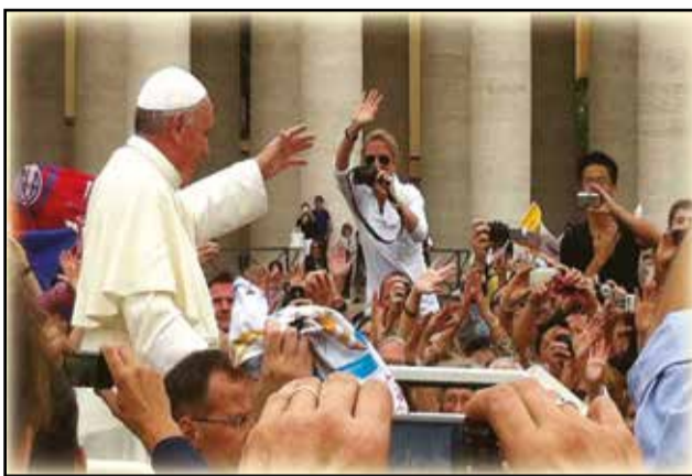
Le Pape François saluant la foule des pèlerins, à bord de sa papamobile.

Le Seigneur regarde celui qui est négligé et mis à l'écart du monde, a précisé le Pape qui a rappelé que «Lazare est le seul personnage, dans toutes les paraboles de Jésus, à être appelé par son nom». Cette pauvreté de Lazare, à l'inverse de l'ostentation de l'homme riche, s'exprime avec une grande dignité. Ceci est enseignement précieux, a-t-il précisé, en lançant une invita-