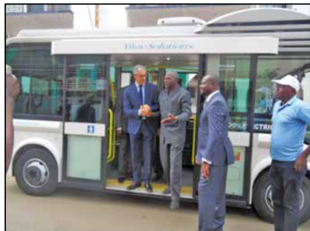
Réception des bus par le maire.

duplicata du permis d'occuper, et la délibération relative à