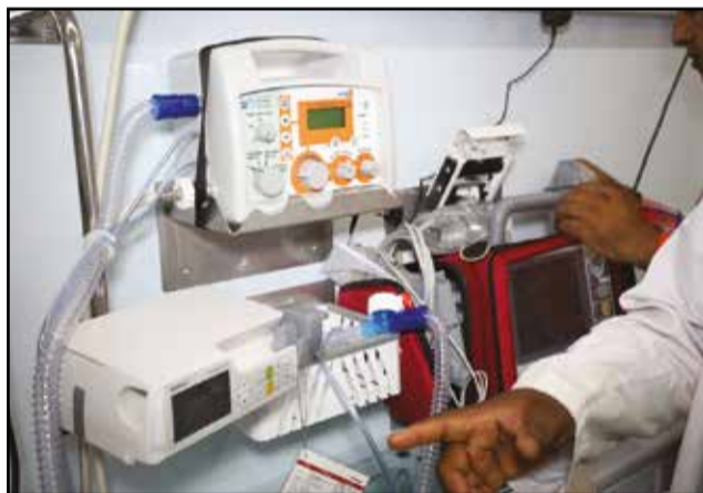
Une vue intérieure du nouveau bloc opératoire.