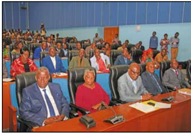
Les participants à l'ouverture du séminaire.

des pistes de solutions ont été envisagées: l'installation des clubs de filles et des cellules d'écoute de la jeune fille; la prise en compte de la jeune fille dans le règlement intérieur de l'établissement et son encouragement public sous forme d'émulation, l'identification des cas sociaux liés à la gestion de la jeune fille et la dynamisation des mères éducatrices, pour le suivi de sa scolarisation. La conférencière a suggéré, pour y parvenir, l'établissement d'un partenariat entre l'école congolaise et le Fawe (Forum des éducateurs africains). Après les différentes communications, le ministre a eu un échange inter-actif avec les chefs d'établissements. Ces derniers ont exposé, à cet effet, les problèmes auxquels ils sont confrontés dans la gestion de leurs structures. Anatole Collinet Makosso a pris note de toutes ces doléances et a promis d'en être l'interprète auprès du gouvernement. « J'attends de vous des rendements meilleurs eu égard à quelques difficultés conjoncturelles qui