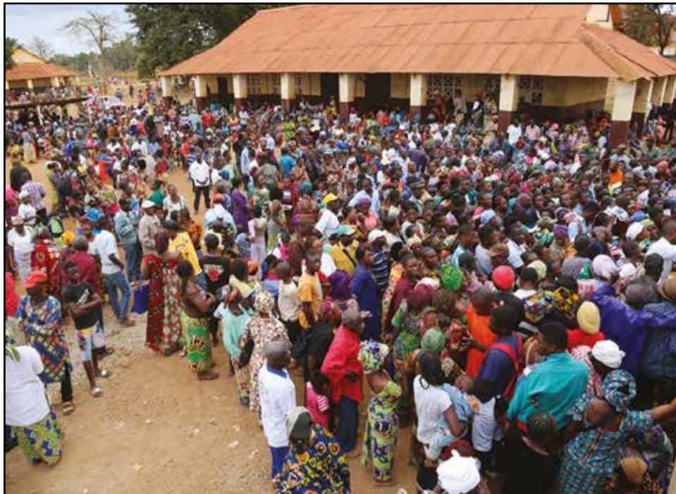
Les populations étaient fortement mobilisées.

Il est à noter que ce bloc opératoire est doté des équipements chirurgicaux de nouvelle génération. Il s'agit, entre autres, d'un puissant bistouri électrique de 300 watts, avec fonction monopolaire et bipolaire, d'un Plasmair (stérilisateur d'air) de 40 kg capable d'éliminer jusqu'à 99,99% de bactéries aérobiques dans le compartiment, d'un autoclave de 50 litres, d'un respirateur anesthésique multifonction avec moniteur de surveillance, d'un respirateur de transport, d'un aspirateur chirurgical, d'un défibrillateur de dernière génération, d'une seringue auto-pousseuse de haute précision... La santé n'a pas de prix, dit l'adage. Et le Promoteur l'a compris, pour soulager