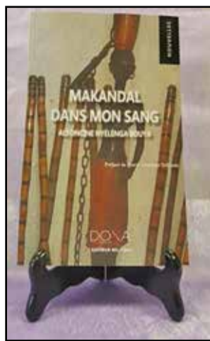
La couverture du livre.

**Makandal dans mon sang vise deux objectifs: d'abord, faire connaître l'histoire de Makandal aux Congolais et aux gens de l'Afrique centrale. Ensuite, mettre à jour les liens étroits et historiques entre les peuples du Congo et d'Haïti. Les thèmes abordés ne sont pas propres à un seul continent, même si deux continents s'en dégagent, de façon notable: l'Afrique, à travers le Congo, et l'Amérique centrale, au tra-