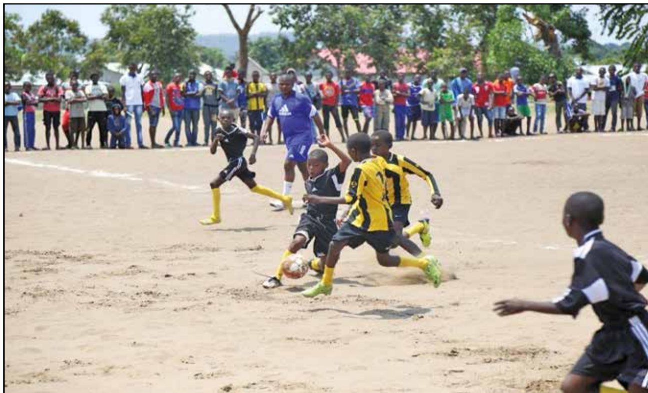
Une phase du tournoi.