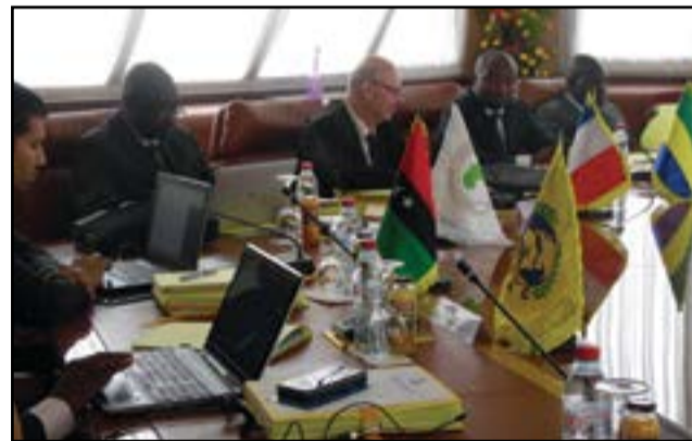
Vue d'une partie des administrateurs pendant les travaux.

par signature et des prises de participation; la situation provisoire de la banque au 30 juin 2016; le rapport d'activités du deuxième trimestre de la direction générale