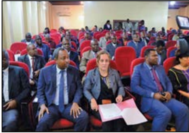
Les partenaires à l'ouverture de l'atelier.

la création des entreprises, la revalorisation de l'agriculture, la promotion des industries de transformation du produit ligneux, la promotion de l'esprit d'entrepreneuriat et des dispositifs de financement et de micro financement. Deux millions de personnes seraient en mesure de bénéficier de cette P.n.e. L'emploi décent restant concentré dans le secteur formel public et privé et, ne représentant que 15% de la population active estimée à plus de 2,5 millions d'individus. Selon Anthony Ohemeng-Boamah, même si le taux de chômage a baissé, selon les dernières estimations après Ecom 2011 (Enquête congolaise sur les ménages), celui des jeunes, demeure important et le taux de sous-emploi est particulièrement préoccupant; il est estimé à 27,8% et concerne, ainsi, près du tiers de la population. La P.n.e est d'une importance