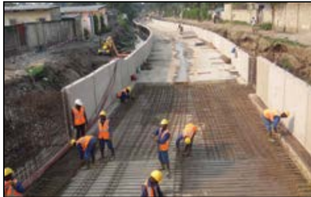
Les ouvriers de Razel à pied d'oeuvre.

et de la route de la corniche prendront fin en février 2018. Il a, également, parlé des difficultés rencontrées, notamment le terrain qui est difficile à consolider, selon lui, et la question de l'expropriation qui traîne. Ce qui pénalise l'avancement des terrassements. Il a expliqué aussi que la route de la corniche est à deux voies. Elle part du giratoire du pont du Djoué jusqu'au giratoire de la case de Gaulle, sur cinq kilomètres. Razel