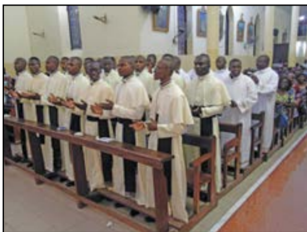
Une vue des séminaristes (aux 1er et 2ème plans) ayant revêtu la soutane.