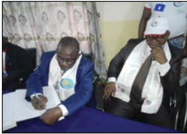
Le récipiendaire signant le livre d'or, sous le regard du manager général de M. B. Production.

et père de six enfants. Titulaire d'un bac, série D, il a été embauché à la S.n.d.e, le 1 er décembre 1983, en qualité de technicien supérieur de l'hydraulique et équipement rural. Après un training de six mois dans les services des Directions centrales de la Direction générale, puis affecté à la Direction technique, dans la section travaux neufs, en complément d'effectifs. Avant d'assumer plusieurs fonctions, entre autres: contrôleur des travaux de construction du réservoir d'eau traitée semi-enterré de 500m 3 de l'hôpital militaire de Brazzaville (1984-1985); chef de centre par intérim à Owando (Département de la Cuvette); superviseur des travaux de pose du réseau secondaire à Brazzaville (1986-1987); superviseur des travaux de réhabilitation des centres secondaires Mossendjo, Madingou, Abala, Boundji, Owando et Makoua (1987-1988); chef de projet de construction du système d'adduction en eau potable