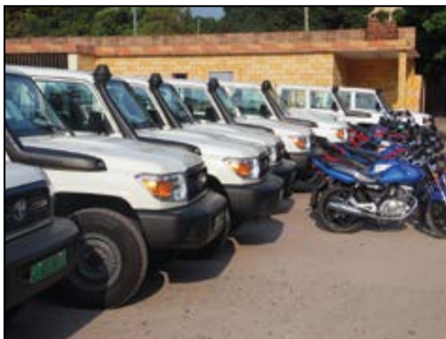
L'échantillon des véhicules et des motos.

caution, afin de leur permettre de faciliter la réalisation de leurs missions de terrain. D'un coût prévisionnel de 60 milliards de francs Cfa dont 50 milliards pour l'Etat congolais et 10% pour la Banque mondiale, le deuxième P.d.s.s se fait suivant l'approche du financement basée sur la performance dans les sept départements cibles. Il va couvrir environ 86% de la population totale du Congo. Pour Maixent Apelé, coordinateur du deuxième P.d.s.s, le financement basé sur la performance peut s'avérer déterminant pour l'atteinte d'une couverture universelle en soins de santé, «pourvu que les services soient plus inclusifs, plus accessibles et de meilleure qualité, grâce à la participation effective de tous les acteurs à tous les niveaux de la pyramide de santé». A l'endroit des structures bénéficiaires, «il vous revien-