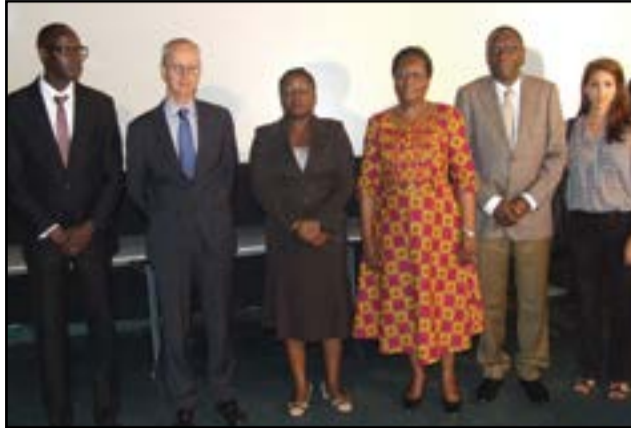
Vue des officiels.

contribuer à leur mise en œuvre par le biais d'accords souscrits entre différents organismes (structures d'envoi et structures d'accueil), dans 55 pays, sur 24 espaces volontariats de par le monde. En 2015, ces 24 espaces volontariats ont mené 1030 actions, ayant touchées 62.045 personnes. Dans la restitution faite, les participants ont relevé les faiblesses comme l'insuffisance d'informations et de formation sur le volontariat, le manque de motivation des jeunes dans le volontariat, la situation sociale précaire, etc. Comme piste de solutions, les jeunes volontaires congolais ont proposé: la valorisation du statut de volontaire dans le milieu jeune, la sensibilisation, via les médias, sur l'importance du volontariat, etc. Pour le premier conseiller de