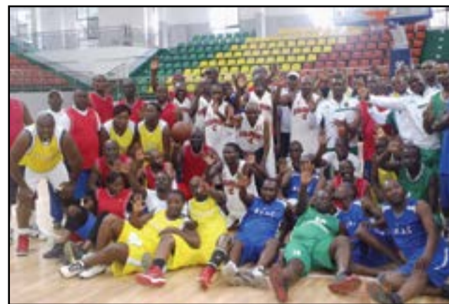
Ce rendez-vous n'est qu'un moment de retrouvailles.

Cette année, le Tournoi international de basket-ball de l'Amitié, en sigle «Tiba», n'a pas connu le succès attendu, pour sa huitième édition, à cause de nombreux forfaits d'équipes ayant pourtant annoncé leur arrivée.