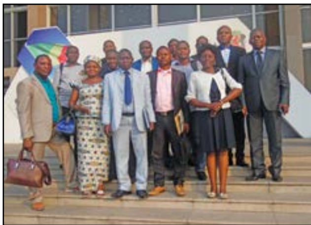
Les officiels et les participants.