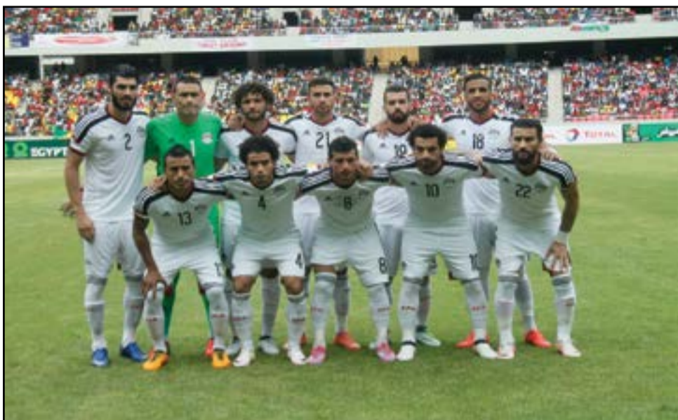
Les Pharaons d'Egypte qui ont renversé les Diables-Rouges.

La logique a été respectée! L'Egypte, donnée favorite de son match contre le Congo bien qu'en déplacement, a tenu son rôle, même si c'est par un score étriqué (2-1) qu'elle l'a emporté, au Stade de l'Unité de Kintélé, à Brazzaville. Au terme d'un match intensément disputé et heurté, par moment. C'est de mauvais augure, pour les Diables-Rouges du Congo. Le public congolais a manifesté sa déception, au coup de sifflet final de l'arbitre ivoirien Denis Dembélé. Il n'y a, pourtant, pas de honte à être battu par l'Egypte, à accepter cette défaite. On attendait les terribles Pharaons d'Egypte dans notre fameux nouveau «trou», précédés d'une flatteuse réputation. Des commentaires élogieux à la gloire de Mohamed Salah, finalement auteur d'un but et d'une passe décisive, d'Abdallah El-Saied, pour ne citer que ces deux-là, l'attestaient. Grands bouffeurs de ballon, ils en ont imposé, effectivement, par leur assurance technique, leur jeu collectif, leur puissance physique, leur occupation rationnelle du terrain, leur recherche du jeu en triangle, leur sens tactique et leur changement incessant de rythme à l'approche de la zone de vérité. Même si, par moment, les Diables-Rouges leur donnaient des sueurs froides au dos. Ils