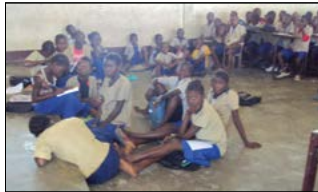
Le déficit en tables-bancs, un des problèmes identifiés par le P.c.p.a-Congo.