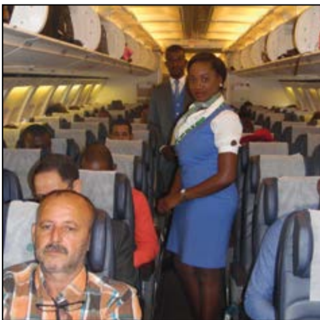
Pendant le vol.

changer le naturel. Ecair, c'est comme ma maison, j'y suis, j'y reste». Très accueillantes, les hôtesses d'Ecair donnent le meilleur d'elles-mêmes, pour mettre à l'aise les passagers, même les plus exigeants. «A l'entrée du vol, nous étions accueillis par un sourire qui t'accompagne jusqu'à destination. C'est formidable. On trouve ça nulle part ailleurs. Le vol est impeccable. Pas trop de trous d'air. C'est un Boeing spacieux, les voyageurs sont confortablement assis. Bref, Tu ne regrettes pas! J'aime Ecair, j'aime prendre ses vols. La preuve, je suis là. Le conseil que je peux donner à la direction générale de cette compagnie, c'est d'éviter d'interrompre le trafic, ainsi que les retards et les annulations de vols. C'est très important, pour maintenir la clientèle qui, parfois, est composée d'hommes d'affaires ou d'opérateurs économiques qui voyagent pour aller honorer des rendez-vous d'affaires. En pareilles circonstances, la notion d'heure est strictement importante. Qu'elle respecte les horaires des vols, pour attirer davantage de clients», a laissé entendre un autre voyageur. Quarante minutes. C'est le temps mis pour atteindre la ville de Pointe-Noire. Le commandant de bord, M. Daniel, et son équipage offrent aux passagers du Boeing 757 200 un vol formidable. Dans l'ensemble, les mots «merci et