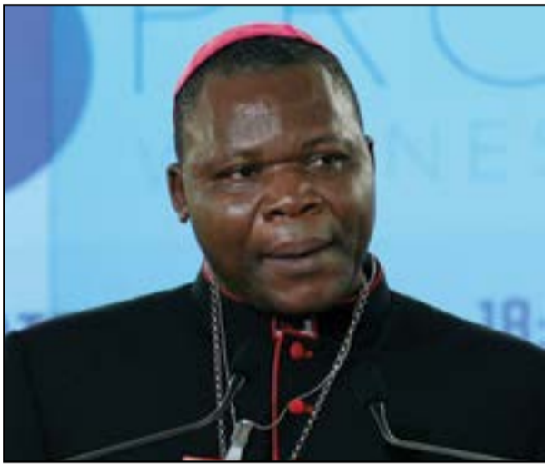
Mgr Dieudonné Nzapalainga. (P.9)