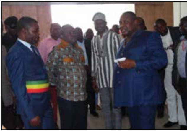
Les ministres Jean Jacques Bouya et Leonidas Carel Mottom Mamoni visitant les chantiers.

Le ministre de l'aménagement du territoire et des grands travaux, Jean-Jacques Bouya, a procédé, jeudi 6 octobre 2016, à la visite de deux chantiers à Brazzaville. Il s'agit des chantiers relatifs à la construction du Centre international de conférence de Kintélé, dans le district d'Ignié, au Nord de Brazzaville, et du musée de l'histoire politique africaine, situé au quartier Mpila, dans le 6 e arrondissement Talangai. Au terme de cette visite, le ministre Bouya, qui était accompagné d'une forte délégation de son cabinet, s'est réjoui du niveau d'exécution des travaux et a annoncé que les deux infrastructures seront livrées à l'Etat, d'ici peu.