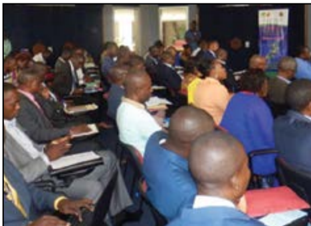
Les hommes d'affaires du Congo invités à prendre part à la conférence internationale sur les investissements en Namibie.