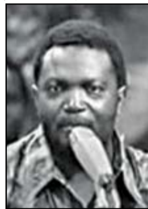
François Luambo Makiadi.