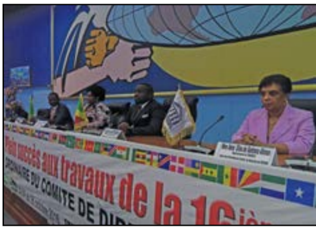
Le présidium de la rencontre.