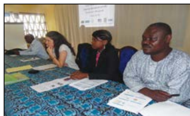
Une vue du présidium.

Il s'est tenu, vendredi 23 septembre 2016, au Centre interdiocésain des œuvres à Brazzaville, un atelier de restitution de l'étude de marché des jus de fruits locaux artisanaux. Organisé par le Pamtaac-B (Projet d'appui au maraîchage, à la transformation agro-alimentaire et la commercialisation des produits transformés), cet atelier a réuni une soixantaine de participants et avait pour objectif d'améliorer la chaîne de fabrication et de vente des jus de fruits locaux, tout en encourageant les consommateurs à s'y intéresser.