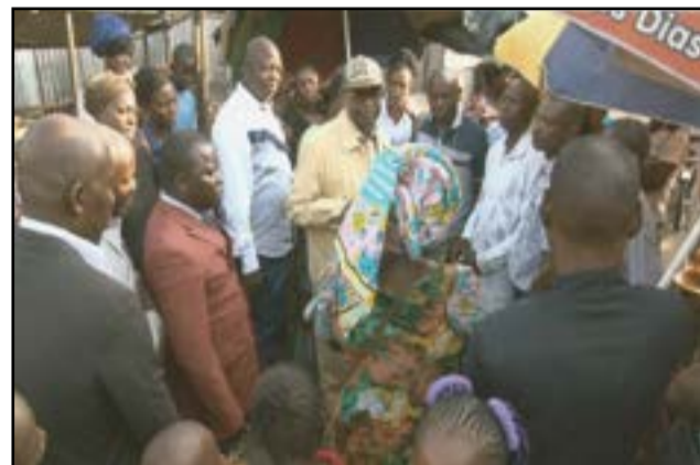
Pendant la visite des marchés.