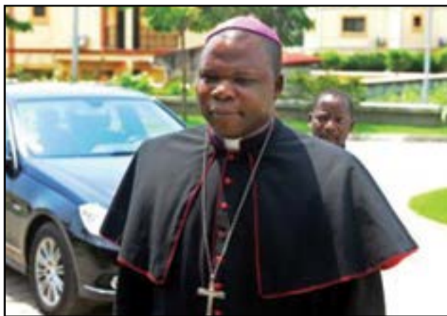
Mgr Dieudonné Nzapalainga.

des évêques, notamment dans la sous-région Afrique centrale, au sein de l'Acerac (Association des conférences épiscopales de la région de l'Afrique centrale). On peut se souvenir de ses prises de position remarquables à Libreville (Gabon) lors de la IX ème Assemblée plénière de l'Acerac du 3 au 10 juillet sur l'évaluation des trois dernières et lors de la X ème tenue à Brazzaville, du 7 au 14 juillet 2014. Il est déjà