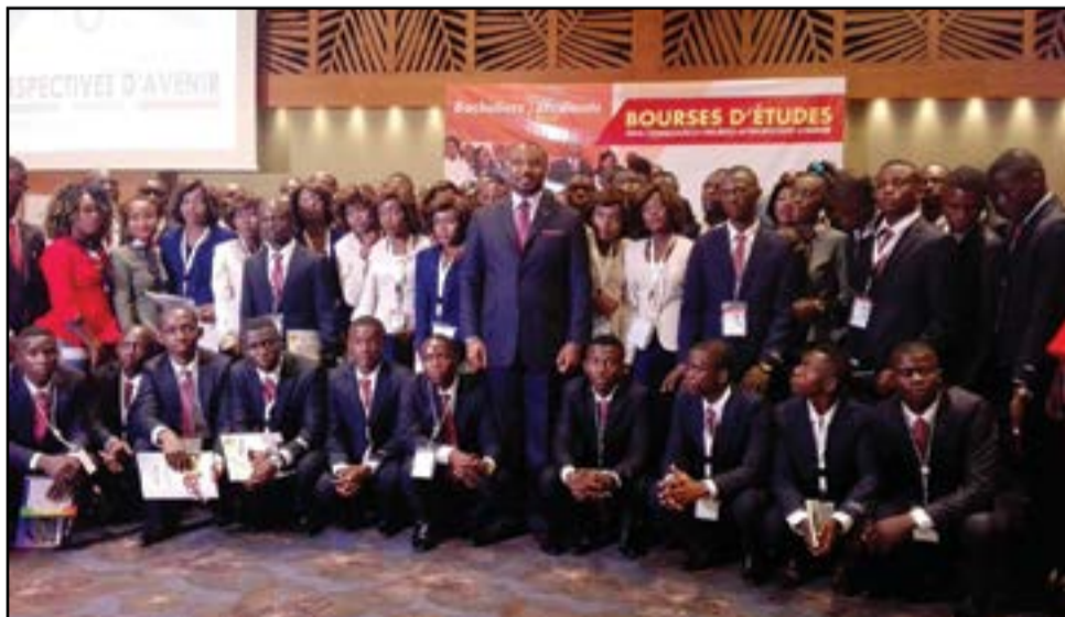
Photo de famille avec les boursiers.

et l'hôtellerie, le transport et la logistique. Il y a une soixantaine de filières concernées, cette année». Pour sa part, M. Denis Christel Sassou-Nguesso a rappelé