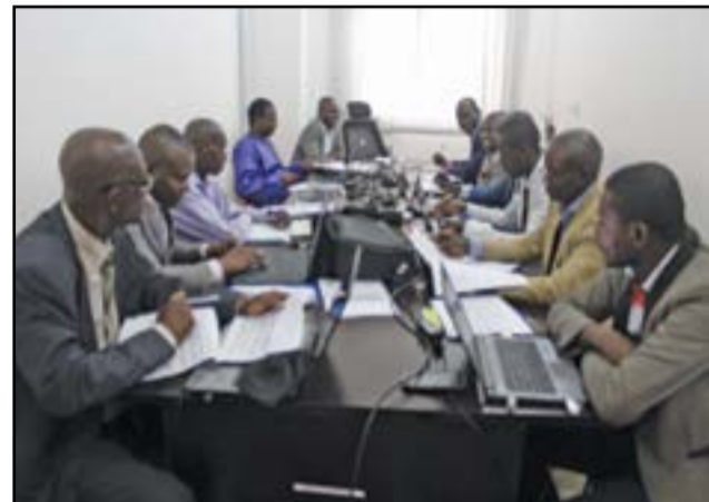
Les participants à l'atelier.

En marge de la journée mondiale du tourisme célébrée, le 27 septembre 2016, sous le thème «Promouvoir l'accessibilité universelle en faveur d'un tourisme pour tous», une session de sensibilisation des journalistes et attachés de presse des Ministères sectoriels du Pstat (Projet de renforcement des capacités en statistiques) a été organisée, à Brazzaville, pour leur éducation sur la nécessité de maîtriser les statistiques du tourisme, gage du développement de ce sous-secteur économique.