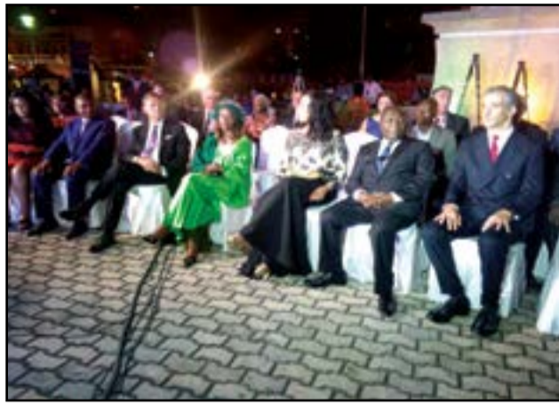
Une vue des officiels.