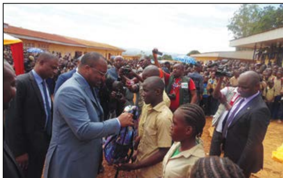
La remise des kits scolaires à un échantillon d'élèves.