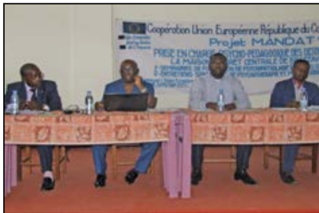
Une vue du présidium pendant le séminaire.

La première thématique a fait ressortir quatre axes: milieu carcéral; vécu de l'incarcération; spécificités cliniques; vécu judiciaire. D'après le Dr Michel Dzalalou, le milieu carcéral fait intervenir les éléments ci-après: le vécu du temps, c'est-à-dire: temps subi, régressif, qui s'inscrit dans le corps; la détention préventive, qui renvoie à quatre moments: explosivité, retrait, adaptation, apaisement.