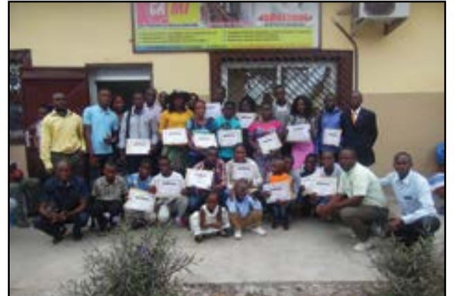
Photo souvenir à la fin de la cérémonie.