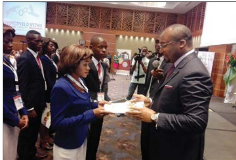
Le président de la FPA remettant les bourses et titres de voyage aux lauréats.

que la Fondation Perspectives d'avenir s'est donnée comme mission principale d'œuvrer à la préparation du capital humain dont le Congo aura besoin, demain, pour son émergence et son développement durable. Un tel choix, a-t-il dit, ne pouvait se faire sans un pari sur la jeunesse et l'avenir. Un pari sur une