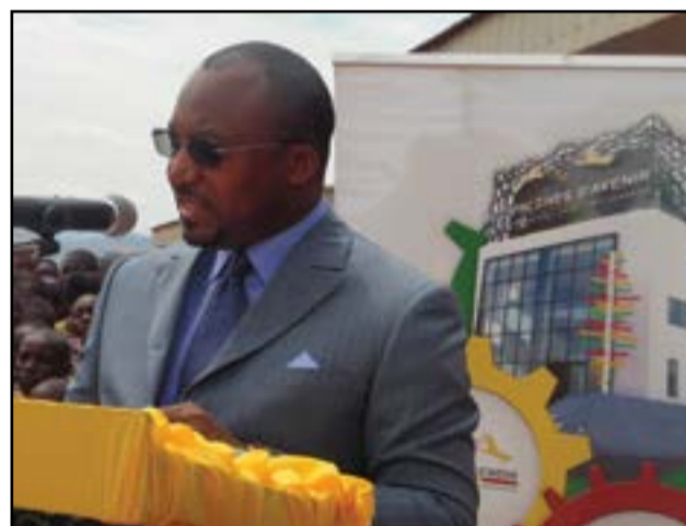
Denis Christel Sassou-Nguesso, pendant son allocution.

susceptibles de favoriser l'apprentissage et des infrastructures complémentaires, pour assurer le bien-être et le développement personnel des apprenants. Le droit à l'éducation fait partie de ces droits dont on ne peut, simplement, décréter la garantie, mais auxquels il faut donner corps, progressivement et collectivement. Ce droit ne peut se réaliser sans obligation de moyens. Ces moyens ne peuvent pas seulement venir de l'Etat, dans un contexte où l'Etat providence n'est plus de mise. Chacun doit y apporter sa contribution, y compris les organisations de la société civile, comme la Fondation Perspectives Avenir et les entreprises des secteurs privé et public. Ces dernières doivent le faire au titre de leur responsabilité sociale. Les entreprises, qu'elles soient privées ou publiques, bénéficieront, demain, des investissements d'aujourd'hui dans la préparation du capital humain dont notre pays aura besoin pour son développement. Sans ce capital humain, elles ne pourront ni renforcer leurs capacités de gestion stratégique ou opérationnelle, ni relever le défi d'une production qui demande de plus en plus un investissement dans la recherche et l'innovation. Elles ont donc intérêt à investir dans le renou-