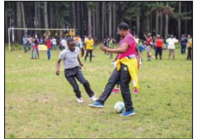
Une partie de football.

Ainsi, le Y'ello Team Building de MTN Congo intègre la vision du Groupe MTN, selon laquelle la performance d'une organisation se capitalise sur des salariés épanouis et satisfaits de leur travail, au regard du durcissement du climat social et économique mondial, conséquence de la