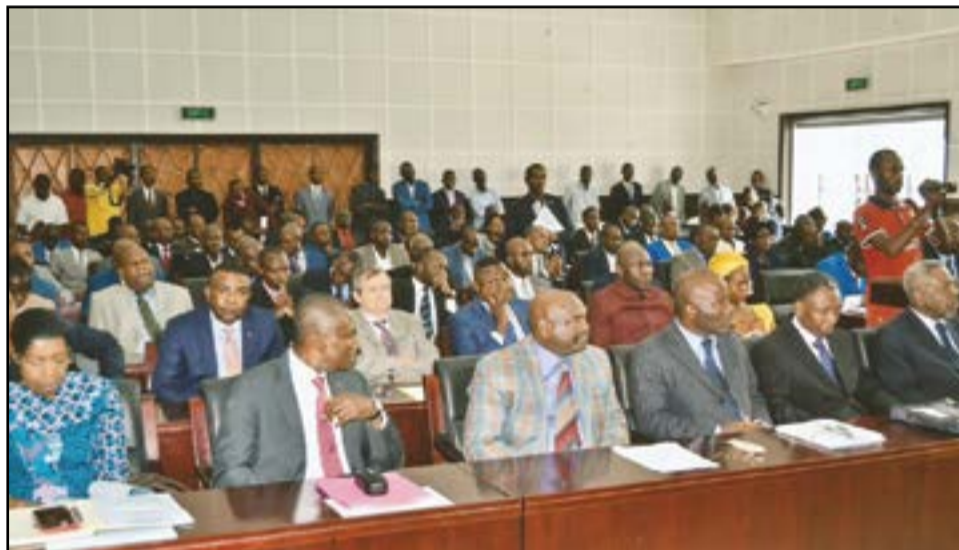
Des participants à la rencontre.

- toutes prestations de conseils et d'assistance ayant pour objet à titre principal ou accessoire; - la mise en œuvre des règles ou principes juridiques; - la rédaction des actes, la négociation et le suivi des relations contractuelles; - les missions de justice; - les missions pour le compte des personnes physiques ou morales sous-forme ou pour le compte de fonds fiduciaires ou de tout instrument de gestion d'un patrimoine d'affectation; - la mission d'arbitre, d'expert, de médiateur, de conciliateur, de séquestre, de liquidateur, d'exécuteur testamentaire, etc. Pour couvrir ses missions variées dans tous les domaines de la vie civile, économique et sociale, les membres du Barreau doivent tenir au respect des principes, c'est-à-dire, fournir les garanties, elles aussi diverses, mais dont l'essentiel figure à l'Article 26 de la loi n°026-92 du 20 août 1992 qui formule le serment de l'Avocat, à savoir, le caractère libéral et indépendant et, je complète, quel que soit le mode d'exercice, l'appartenance à un barreau sous l'administration d'un conseil du Barreau, la dignité, la conscience, la probité et dans le respect encore, des principes d'honneur, de loyauté, de désintéressement, de confraternité, de délicatesse, de modération, de courtoisie et d'humanité. En un mot, l'exercice professionnel dans le respect de la déontologie, colonne vertébrale de notre métier.