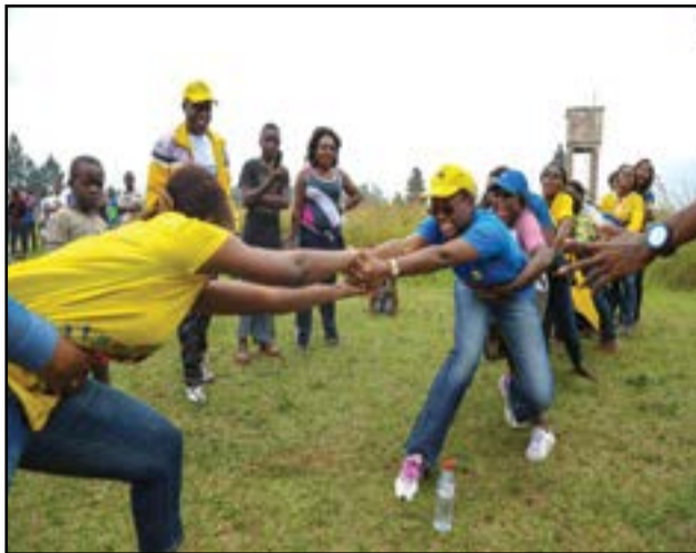
Y'ello Team Building vise, entre autres, à améliorer la performance sociale.

À l'instar des années précédentes, les activités 2016 ont été axées sur des activités à sensations émotionnelles fortes, au profit de résultats à vocation d'apaiser et de mobiliser, centrées sur l'art, la nature, le talent, l'enfance et la solidarité pour un bien-être. Le Y'ello Team Building 2016 avait comme intérêt de présenter des activités accessibles à tous, quel que soit le niveau dans l'entreprise des individus, dirigeants y compris. Sachant que l'intérêt principal a été d'obtenir une «atmosphère détendue et conviviale de tous les MTNers» et surtout de capter l'attention de tous les collaborateurs par le Top Management de MTN Congo. Sans fausse modestie, mission a été