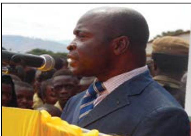
Le directeur du C.e.g Central.

vement et la réforme du système éducatif dans notre pays de manière à ce qu'il