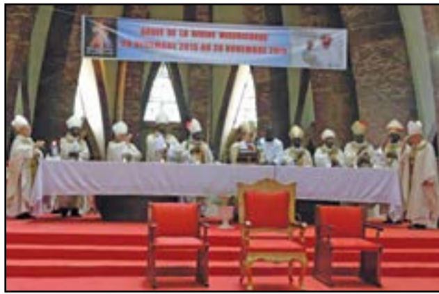
Le nonce apostolique et les évêques du Congo bénissant le peuple de Dieu.