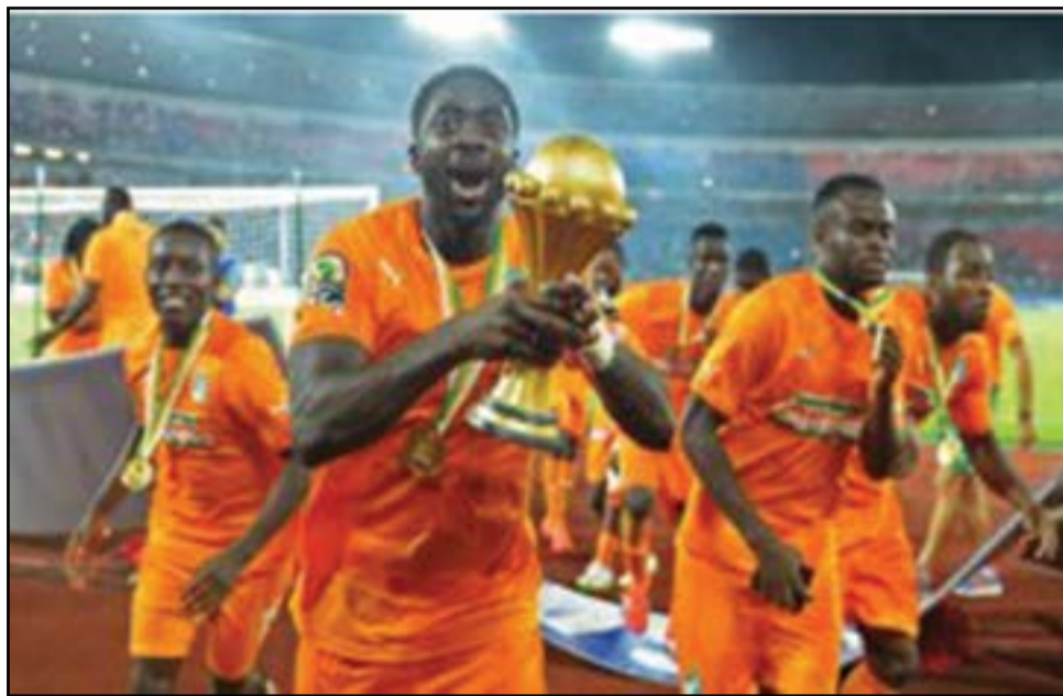
La Côte d'Ivoire remettra en jeu le trophée de la CAF.

Dans le groupe C, la Côte d'Ivoire (21 e participation), champion d'Afrique en titre, et la République Démocratique du Congo (18 e participation), troisième en 2015, s'étaient affrontés en demi-finales lors de l'édition précédente, en Guinée Equatoriale. Ils en découdront avec le Maroc (16 e participation), entraîné par le Français Hervé Renard qui a remporté avec la Côte d'Ivoire ladite édition et retrouvera, donc, ses anciens poulains.