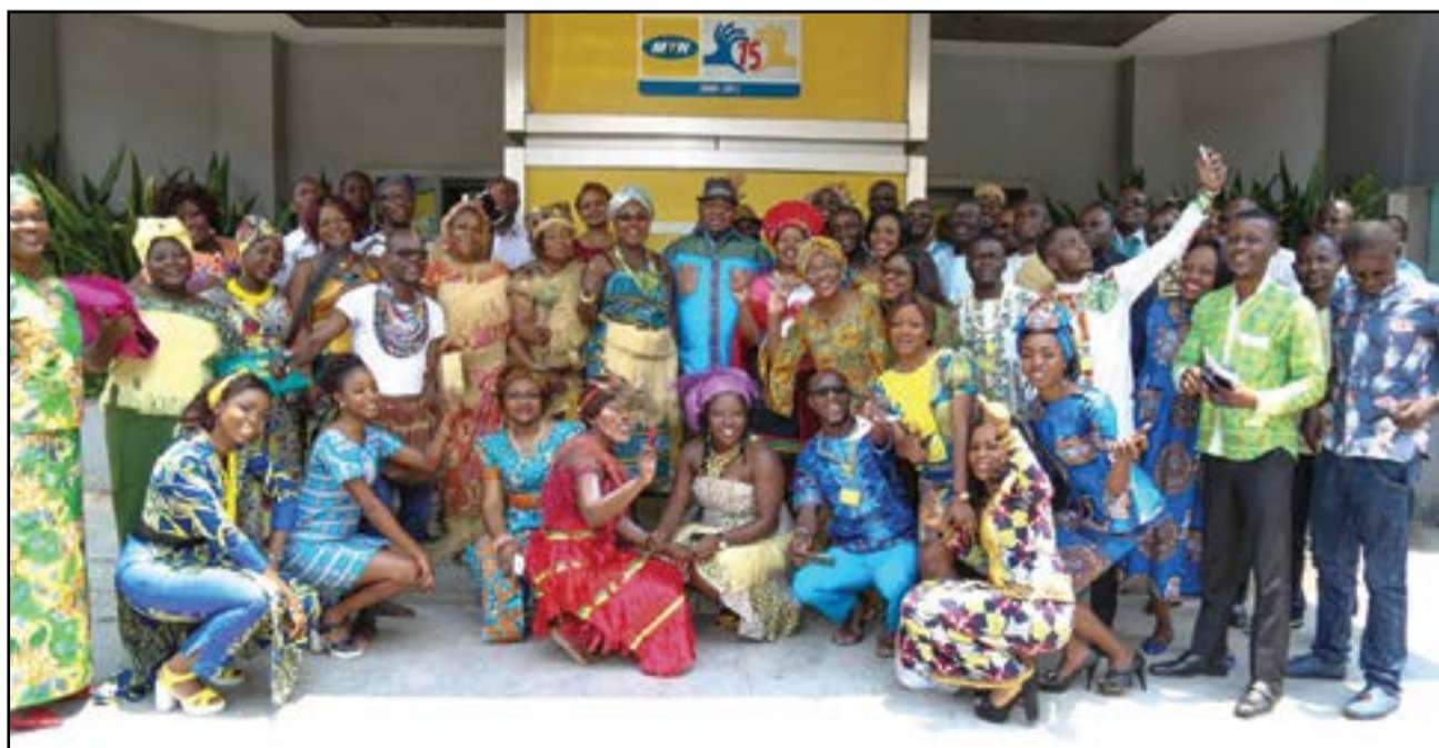
Photo de famille des participants à la journée culturelle.

que ce jour lui permet de se souvenir de l'héritage de son pays, le Congo, précisément dans les départements des Plateaux, en s'habillant en tenue traditionnelle téké.