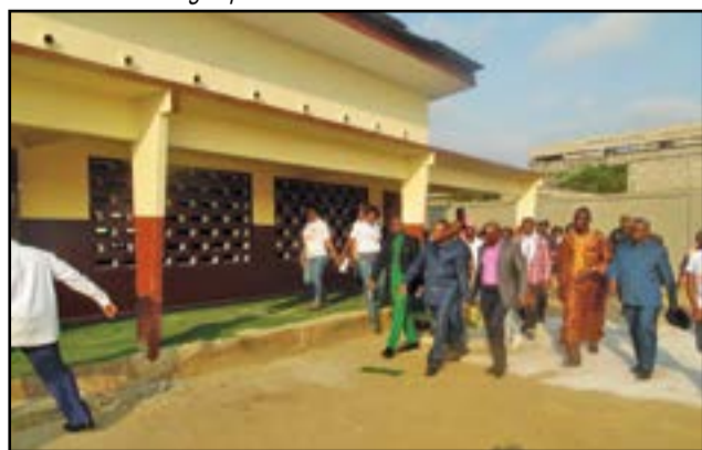
Pendant la visite guidée...

travaux, «les travaux ont consisté à la démolition de l'ancien mur de clôture dont l'état de délabrement constituait un danger permanent