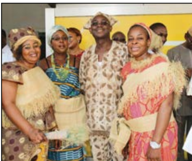
...s'est déroulée dans une ambiance très conviviale.

Un autre gagnant de la direction générale a signifié