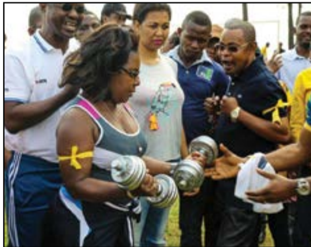
Bien-être et performance sont les résultats attendus du Y'ello Team Building.

La norme d'organisation du Y'ello Team Building 2016 a été la collaboration, la conception, l'identification, la prise des contacts à l'endroit des autorités, la planification, la cuisson des repas, l'implémentation des activités artistiques, ludiques et sportives... Soit un véritable programme social partagé. Une véritable expérience enrichissante et fortement intéressante pour l'équipe interne allant des