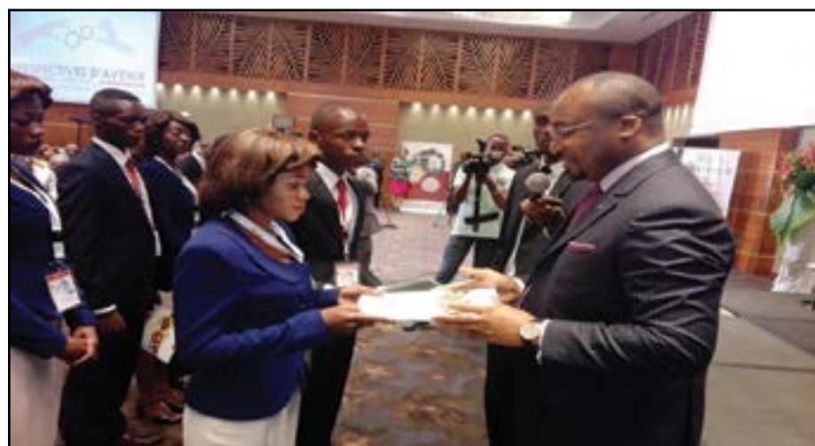
Le président de la FPA remettant les bourses et titres de voyage à un échantillon de lauréats. (P.22)

La Fondation Perspectives d'Avenir a accordé des bourses à plus de 70 étudiants congolais