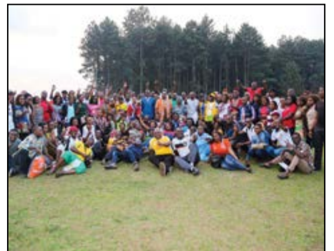
Les participants posent pour la postérité.