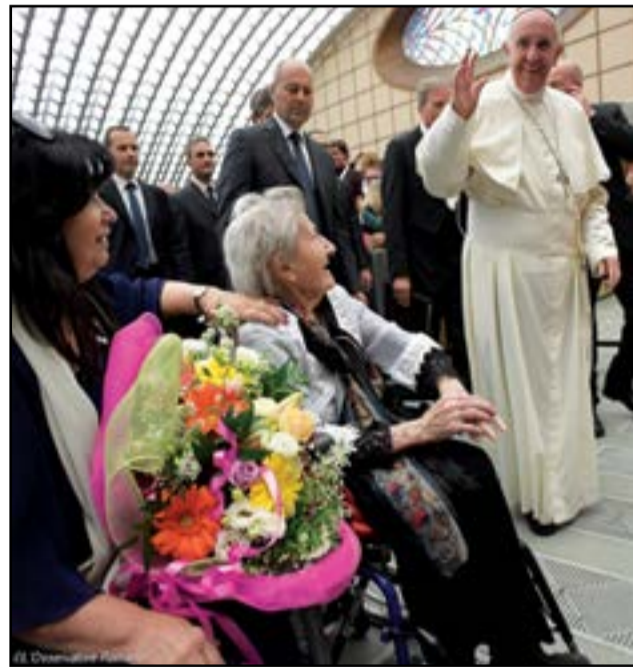
Dans la Salle Paul VI, le Pape a salué des milliers de retraités.

Cette semaine qui s'est achevée dimanche a été, si l'on peut dire, à l'enseigne de l'apha et de l'oméga; de la jeunesse et de la vieillesse. Car c'est le message du Pape pour la prochaine Journée mondiale du migrant et du réfugié, le 15 janvier prochain, qui a ouvert cette semaine. Le thème choisi par le Saint-Père est en effet: «Mineurs migrants, vulnérables et sans voix».