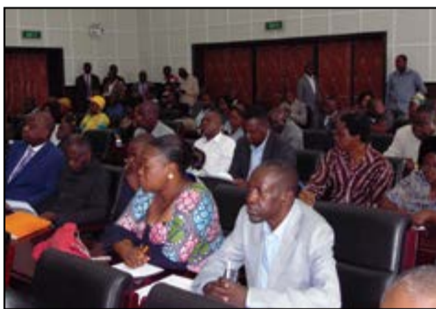
Une vue des participants.

marquables ont été enregistrés dans la réalisation des O.m.d au Congo, notamment dans les domaines de l'éducation primaire pour tous, la lutte contre le V.i.h-sida et la promotion du développement durable. Par la suite, le directeur général du plan a fait savoir que le Congo, sous l'éclairage du Président de la République,