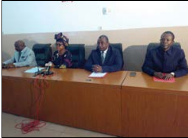
Une vue du présidium.

«En effet, la Fecodho a pour seule vocation d'œuvrer à la promotion et à la protection des droits de l'homme. La peine de mort signifie une condamnation extrême soumettant l'Etat à l'épreuve de détruire une vie humaine. Elle est donc une grave violation des droits fondamentaux de l'être humain. Aujourd'hui, force est de constater que la Constitution du 25 octobre 2015 a, purement et simplement, déclassifiée cette peine macabre. C'est pour cela que la Fecodho interpelle les pouvoirs publics à tout mettre en œuvre, pour procéder, dans les meilleurs délais, à la ratification du deuxième protocole additionnel se rapportant au pacte international relatif aux droits civils et politiques visant