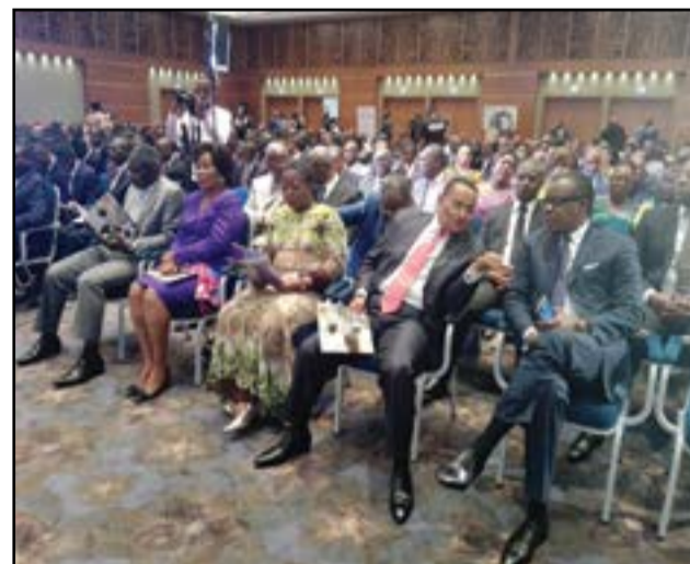
Les autres membres du gouvernement.