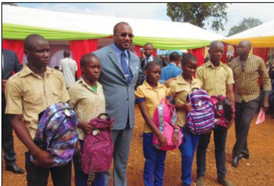
Le président de la FPA avec l'échantillon d'élèves bénéficiaires.

sentiment d'être les exclus du combat collectif pour l'émergence et le développement, de l'alliance pour un changement porteur de transformation dans notre pays», a-t-il affirmé. Puis, il a démontré l'importance d'une formation de qualité: «Notre Constitution garantit le droit à l'éducation. Garantir ce droit va bien au-delà du simple fait de mettre à la disposition des enfants, des infrastructures scolaires. Il faut encore y mettre des enseignants qualifiés, des matériels