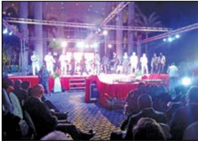
Pendant le spectacle.

gigantesque réalisée par ce grand explorateur qui a incarné plusieurs valeurs politiques, économiques et commerciales. C'est également, célébrer la diversité culturelle, valoriser la différence entre les peuples et les cultures. Le mémorial qui brille de mille feux, ce soir, est en pleine extension, dont les