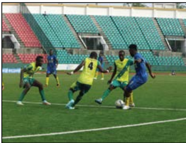
Etoile du Congo-J.S.T: des gradins vides.

En tout cas, l'A.C Léopards de Dolisie a été inaccessible, en cette saison 2015-2016. Il a, également, remporté la Coupe du Congo, aux dépens du CARA de Brazzaville. 19 points le séparent de son dau-