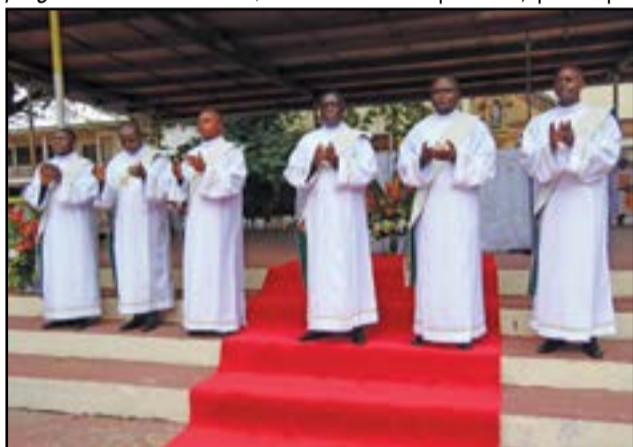
Les nouveaux diacres.

aussi, la commémoration du 40 ème anniversaire de la mort du Cardinal Emile Biayenda, «comme point culminant et du temps fort de toutes les activités programmées». Pour cela, l'ar-