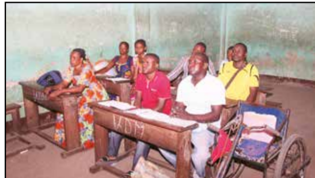
Des apprenants au centre Mama Elombé.

Les cours d'alphabétisation et de réscolarisation, pour l'année scolaire 2016-2017, ont bel et bien démarrés sur toute l'étendue du territoire national. A cet effet, Anatole Collinet Makosso, ministre de l'enseignement primaire, secondaire et de l'alphabétisation, a effectué lundi 17 octobre 2016, jour de cette rentrée, une ronde de supervision dans les établissements de Brazzaville. Dans les centres de réscolarisation d'Angola libre, dans le 1 er arrondissement Makélékélé, au Ceg 8 mars, à Moungali, le 3 e arrondissement, et au poste d'alphabétisation Mama Elombé, à Ouenzé, dans le 5 e arrondissement, la rentrée des classes a été effective.