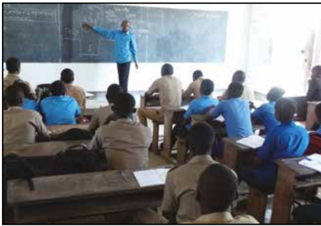
Des élèves suivant un cours, pendant la visite du ministre Anatole Collinet Makosso.

et Boko, les salles sont pleines d'élèves et il y a même un phénomène de pléthore, en raison des populations déplacées des villages, accueillies dans ces localités. Seulement, les enseignants manquent. Beaucoup sont à Brazzaville, en raison de l'insécurité que font régner les bandits armés. En effet, dans les grands villages, les écoles sont fermées et les populations déplacées. Dans les établissements scolaires comme Jean Kimbembé, Ntari-Ngouari et Moundongo, à Kinkala, les effectifs des élèves sont passés du simple au double. Au primaire, certains élèves sont obligés de s'asseoir à même le sol. Au Lycée 5 Février de Kinkala, par contre, c'est le contraire. Les effectifs sont en baisse. Le lycée ne compte que 402 élèves, 12 professeurs et 8 fonctionnaires administratifs. 31 professeurs et 561 élèves manquent à l'appel. L'on comprend qu'à ce niveau, beaucoup de lycées ont préféré se déplacer à Brazzaville.