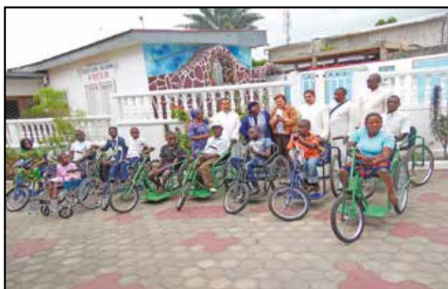
Le nonce apostolique posant avec les handicapés.