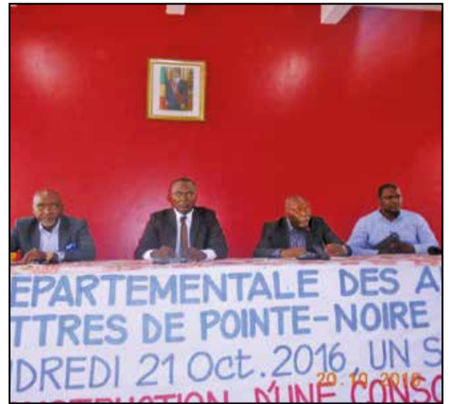
Le présidium du séminaire.