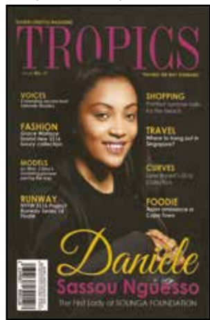
Les couvertures du premier numéro en version papier.

Pourquoi éditer Tropics maintenant? «Dans la vie, quand on a des projets, on n'a pas forcément les moyens de concrétiser le projet. Ça prend du temps à la réalisation, ça prend du temps à la concrétisation, et on a aussi besoin de tomber sur des personnes qui croient en