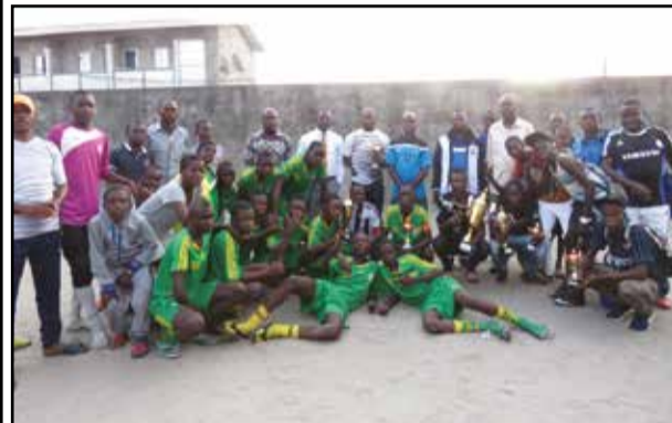
Les lauréats brandissant leurs trophées.

Les meilleures équipes et acteurs des Liges 1 et 2, de Pointe-Noire, ainsi que ceux du football des jeunes, ont été récompensés, samedi 29 octobre 2016, à l'issue des finales des catégories minimes et cadets marquant la fin de la saison sportive 2015-2016, au Stade Papa Loboko, à Tié-Tié, dans le troisième arrondissement.