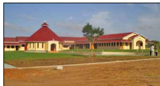
Le centre Bon Pasteur pour la paix de Juba.